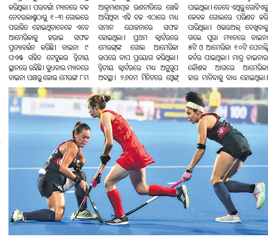
ଚାଉନା ଓ ଆମେରିକା ମଧ୍ୟରେ ଅନୁଷ୍ଠିତ ମ୍ୟାଚ୍‌।

କଟକ, ୭।୨ (କାର୍ତ୍ତିକ ସାହୁ): ଓଡ଼ିଶା କ୍ରିକେଟ୍ ଆସୋସିଏସନ୍ (ଓସିଏ) ପକ୍ଷରୁ ଆୟୋଜିତ ଅନ୍ତଃ ବିଦ୍ୟାଳୟ କ୍ରିକେଟ୍ ଟୁର୍ନାମେଣ୍ଟରେ ରୁଧିରୀ ଅନୁଷ୍ଠିତ ଭାରତ-ଅଷ୍ଟ୍ରେଲିଆ ମ୍ୟାଚ୍‌ର ଏକ ସଂଘର୍ଷପୂର୍ଣ୍ଣ ମୁହୂର୍ତ୍ତ।