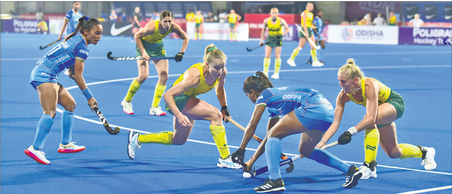
କଳିଙ୍ଗ ଷ୍ଟାଡିୟମରେ ଚାଲିଥିବା ଏପିଆଇଏଲ୍ ମ୍ୟାଚ୍‌ରେ ଇଣ୍ଡିଆ ଟିମ୍‌ର ଲିଗ୍‌ରେ ରୁଧିରୀ ଅନୁଷ୍ଠିତ ଭାରତ-ଅଷ୍ଟ୍ରେଲିଆ ମ୍ୟାଚ୍‌ର ଏକ ସଂଘର୍ଷପୂର୍ଣ୍ଣ ମୁହୂର୍ତ୍ତ।

ମେଲବୋର୍ନ, ୭।୨ (ପି.ଟି.) ଭାରତୀୟ କ୍ରିକେଟ ଦଳର ଷ୍ଟାର ଉଇଲେଟ୍‌ସ୍‌ଙ୍କ ପର ଚିନ୍ତା ପତ୍ତ ଆସିବ। ଆଇପିଏଲ୍ରେ ପ୍ରତ୍ୟାବର୍ତ୍ତନ କରିବେ। ଦିଲ୍ଲୀ କ୍ୟାପିଟାଲ୍‌ର ପୃଷ୍ଠା କୋର୍ ଟିମ୍ ପତ୍ତ ଏହି ସୂଚନା ଦେଇଛନ୍ତି। ତେବେ ପତ୍ତ କେବଳ ଜଣେ ବ୍ୟାଟର ଭାବରେ ଖେଳିବେ ବୋଲି ପତ୍ତ ଘୋଷଣା କରିଛନ୍ତି। ଡିସେମ୍ବର ୨୦୨୨ରେ ଏକ ଭୟାବହ ସତର୍କତା ପୂର୍ବକ ଗୋଟିଏ ଆହତ ହୋଇଥିଲେ ପତ୍ତ। ଲିଗାମେଣ୍ଟ ରି-କନସ୍ଟ୍ରକ୍ସନ୍‌ର ସର୍ଜରୀ ପରେ ଦୀର୍ଘଦିନ ଧରି ସେ କ୍ରିକେଟରୁ ଦୂରରେ ରହିଛନ୍ତି। ପତ୍ତ ଏକ ସାକ୍ଷାତକାରରେ ଏହି ସୂଚନା ଦେବା ସହ କହିଛନ୍ତି, ପତ୍ତ ସ୍ଥୁଳ ହୋଇ ଅଭ୍ୟାସ ଆରମ୍ଭ କରିଛନ୍ତି। ଏହାର ଏକାଧିକ ଭିତ୍ତିପୂର୍ଣ୍ଣ ସର୍ଜରୀ ସୋପାନ ମିଳିଥିବାର ଦେଖିବାକୁ ମିଳୁଛି। ତେବେ ଆଇପିଏଲ୍‌କୁ ଆଉ ମାତ୍ର ୬ ସପ୍ତାହ ଥିବା ବେଳେ ପତ୍ତ କେତେ ମାତ୍ରାରେ ଉପଲବ୍ଧ ରହିବେ ତାହା କହିବା ସମ୍ଭବ ନୁହେଁ ବୋଲି ପତ୍ତ ଘୋଷଣା କରିଛନ୍ତି। ପତ୍ତ ଉଇଲେଟ୍‌ସ୍‌ଙ୍କ କ୍ରିକେଟ ଜୀବନରେ ଏକ ନିର୍ଦ୍ଦିଷ୍ଟ ମଧ୍ୟ ବୃତ୍ତାନ୍ତ ହୋଇନାହିଁ। ତେବେ ଆଇପିଏଲ୍‌ରେ ୧୪ ମ୍ୟାଚ୍‌ରୁ