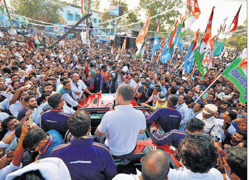
ସୁନ୍ଦରଗଡ଼ ଜିଲ୍ଲାରେ କଂଗ୍ରେସ ନେତା ରାହୁଲ ଗାନ୍ଧୀଙ୍କ ଭାରତ ଯୋଡ଼ୋ ନ୍ୟାୟ ଯାତ୍ରା ଅବସରରେ କେତେକ ଦୃଶ୍ୟ।