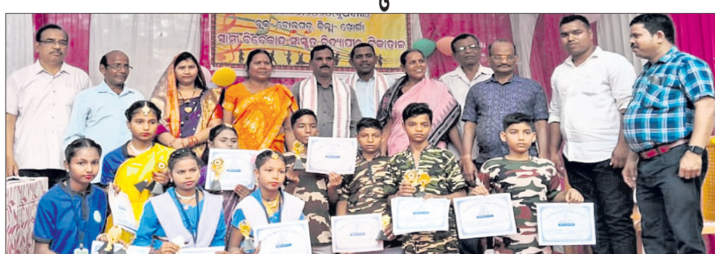
ସାମୀ ବିବେକାନନ୍ଦ ସଂସ୍କୃତ ବିଦ୍ୟାପୀଠର ବାର୍ଷିକ ଉତ୍ସବରେ ଅତିଥିକ ଗହଣରେ କୁଟା ଛାତ୍ରାଛାତ୍ରୀ