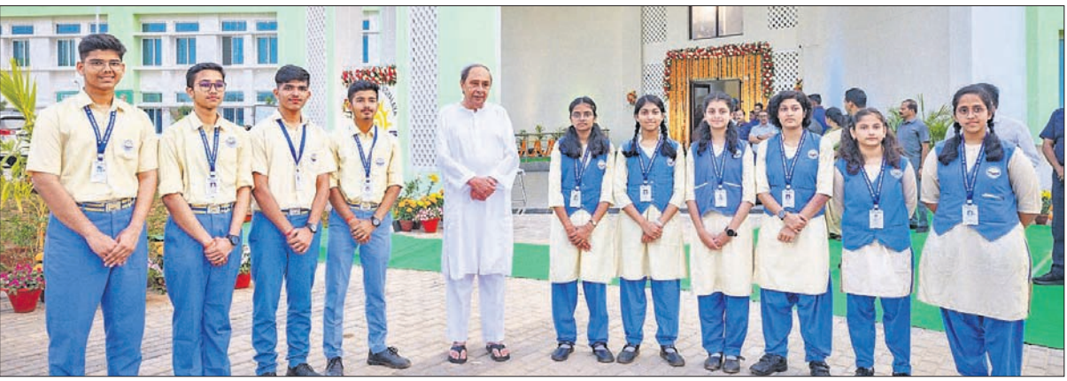
ଅନ୍ଧାରୁଆରେ ଆଇକନିକ୍ ଓଡ଼ିଶା ଆଦର୍ଶ ବିଦ୍ୟାଳୟ ଉଦଘାଟନ ଅବସରରେ ଛାତ୍ରାଛାତ୍ରୀଙ୍କ ସମେତ ମୁଖ୍ୟମନ୍ତ୍ରୀ ନବୀନ ପଟ୍ଟନାୟକ।

ପରେ ଏହି ନିଷ୍ପତ୍ତି ନିଆଯାଇଛି। ୨୦୦ ଖାଗନ କ୍ଷମତା ବିଶିଷ୍ଟ ଖାଗନ ରକ୍ଷଣାବେକ୍ଷଣ ଦକ୍ଷତା ଏବଂ ନିର୍ଭରଯୋଗ୍ୟତାକୁ ପ୍ରସ୍ତୁତ ଖାଗନ ପିଓଏଚ୍ କାରଖାନା କଣ୍ଠାବାଞ୍ଚିରେ ଉନ୍ନତ କରିବା ଏହାଦ୍ୱାରା ଉନ୍ନତ କାର୍ଯ୍ୟକ୍ରମରେ ଏବଂ କାର୍ଯ୍ୟକ୍ରମ ହେବ ବୋଲି ଆଶା କରାଯାଇଛି।