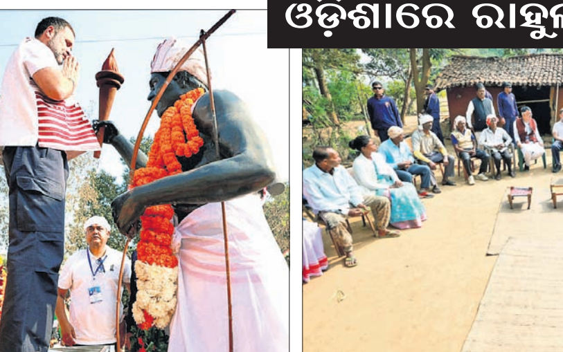
ରାଜଗାଙ୍ଗପୁରରେ ବିର୍ବା ପୂଣ୍ୟକ ପ୍ରତିପତ୍ତିରେ ମାଲ୍ୟାପର୍ଣ୍ଣ କରୁଛନ୍ତି ରାହୁଲ ଗାନ୍ଧୀ (ବାମ)। ଭାରତ ଯୋଡ଼ୋ ନ୍ୟାୟ ଯାତ୍ରା ଅବସରରେ ସ୍ଥାନୀୟ ଆଦିବାସୀଙ୍କ ସହ ବିଶେଷ ପୂର୍ଣ୍ଣ(ମଝି)। ଧରୁଟାର ଗାଳନା କୌଶଳ ଦେଖୁଛନ୍ତି ରାହୁଲ (ଡାହାଣ)।