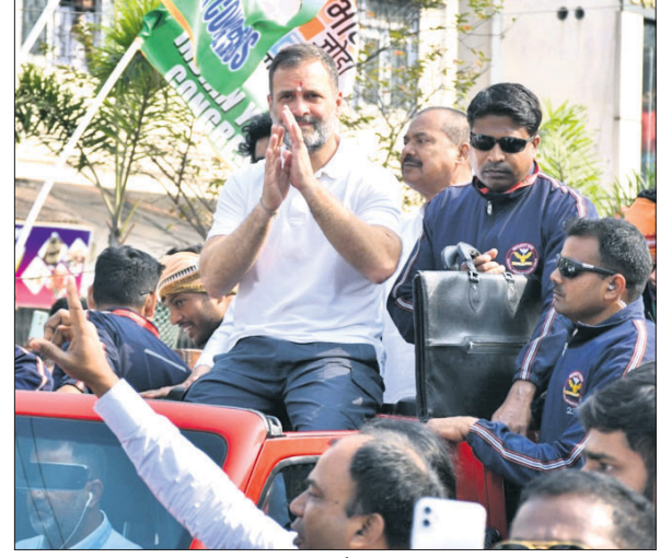
ଉଦ୍‌ଦିଗମ୍ଭର ଛକରୁ ପାନପୋଷ ପର୍ଯ୍ୟନ୍ତ ରାଷ୍ଟ୍ରକ ଗାହୀଙ୍କ ରୋଡ୍ ଶୋ। ଚଳାଉଛନ୍ତି। ଏହାର ସମସ୍ତ ଦୃଶ୍ୟ ୩୦ ଲକ୍ଷରୁ ଉର୍ଦ୍ଧ୍ୱ ବେକାର ମୁଦତ୍ତ ପାଲ୍ଲୀମେଣ୍ଡରେ ଦେଖାଯାଉଛି। ମୁଦକ ଦାବନ ଖଟିବାକୁ ଅନ୍ୟ ଖଣିଆଦାନପୂର୍ଣ୍ଣ ଓଡ଼ିଶା ପ୍ରଦେଶରେ ରାଜ୍ୟକୁ ଯାଉଛନ୍ତି। ୧୯ ପୃଷ୍ଠା-୭

ଭୁବନେଶ୍ୱର, ୭/୨ (ଅନିଲ ଦାସ) ବିଧାନସଭାରେ ରୁଧିର ଅଭାବନାୟ ଦୃଶ୍ୟ ଦେଖିବାକୁ ମିଳିଛି। ଅର୍ପଣ ରଥରେ ଉତ୍ତୁମା ଚାଉଳ ଏବଂ ପରା ହତ୍ୟାକାଣ୍ଡକୁ ନେଇ ଭାଜପା ଓ ବିଜେଡି ମୁହଁପୁହିଁ ହୋଇଛନ୍ତି। ଅର୍ପଣ ରଥରେ ଉତ୍ତୁମା ଚାଉଳ ଥିବା ଅଭିଯୋଗ ଆଣି ଭାଜପା ରାଜ୍ୟ ସରକାରଙ୍କୁ ଟାର୍ଗେଟ୍ କରିଛି। ମହାସୁଆର ନିଯୋଗ ମୁଖ୍ୟ ଅର୍ପଣ ରଥରେ ଉତ୍ତୁମା ଚାଉଳ ଥିବା ଅଭିଯୋଗ କରିଛନ୍ତି। ରାଜ୍ୟ ସରକାର ଜଗନ୍ନାଥ ସଂସ୍କୃତିକୁ ଅପସଂସ୍କୃତିରେ ପରିଣତ କରିଛନ୍ତି। ଏ ନେଇ ମୁଖ୍ୟମନ୍ତ୍ରୀ ଗୃହରେ ସ୍ୱାସ୍ଥ୍ୟକରଣ ଦିଅନ୍ତୁ ଦାବି କରି ଭାଜପା ସଦସ୍ୟମାନେ ବିଧାନସଭାରେ ପ୍ରବଳ ହୋଇଛନ୍ତି।