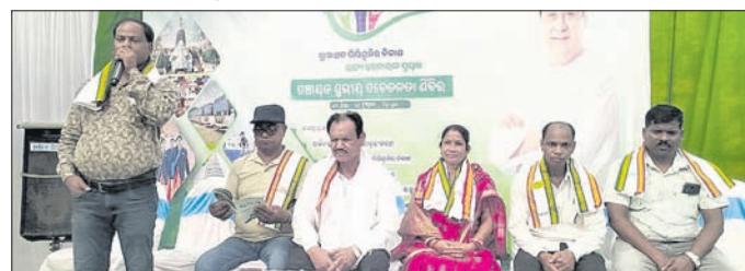
ପଞ୍ଚାୟତସ୍ତରୀୟ ସଚେତନତା ଶିବିରରେ ମହାଧ୍ୟାନ ଅତିଥି ।