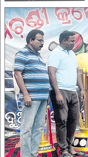
ବୋଲଗଡ଼, ୨୦୧୭(ଦେବବ୍ରତ ହୋତା)

ବୋଲଗଡ଼ କ୍ଲବ୍ ଅନ୍ତର୍ଗତ ଧଳାପଥର ଗ୍ରାମ ପଞ୍ଚାୟତ କୋଡୁଅବେରେଶା ଖେଳପଡ଼ିଆରେ ଚାଲିଥିବା ବ୍ୟାଦଶତମ ମା' ରାମଚଣ୍ଡୀ କ୍ରିକେଟ ଟୁର୍ନାମେଣ୍ଟର ଅନ୍ତିମ କ୍ରମେ ଫାଇନାଲ ମ୍ୟାଚ୍ରେ କୁଧିର ଅନୁଷ୍ଠିତ ହୋଇଥିଲା।