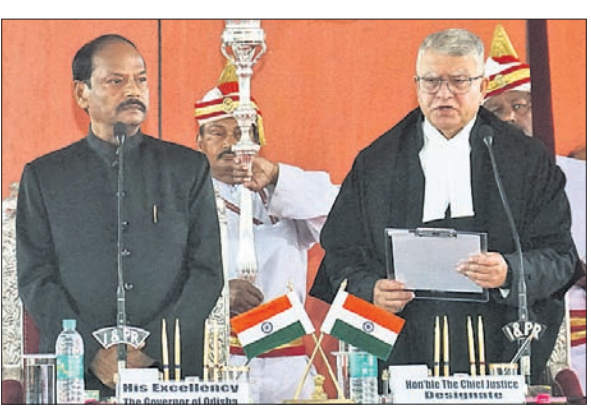
ରାଜ୍ୟପାଳ ରଘୁବର ଦାସ ହାଇକୋର୍ଟ ମୁଖ୍ୟ ବିଚାରପତି ଜଷ୍ଟିସ୍ ଚକ୍ରଧାରୀ ଶରଣ ସିଂଙ୍କୁ ଶପଥ ପାଠ କରାଇଛନ୍ତି।