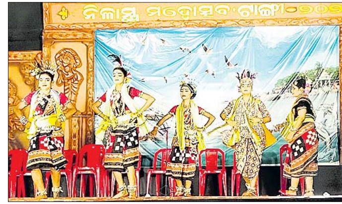
ନାଳାୟ ମହୋତ୍ସବର ୫ମ ସନ୍ଧ୍ୟାରେ କଳାକାରମାନେ ନୃତ୍ୟ ପରିବେଷଣ କରୁଛନ୍ତି।

ଗାଙ୍ଗା-ଖୋର୍ଦ୍ଧା, ୭।୨ (ରଘୁନାଥ ସାହୁ) ଗାଙ୍ଗା ବ୍ଲକ୍ ସାମ୍ପାଦକ ସଂସ୍ଥା ଆନୁକୂଲ୍ୟରେ ସ୍ଥାନୀୟ ତିଳିକା ସ୍ତ୍ରୀକ୍ଷେତ୍ର ପରିସରରେ ନାଳାୟ ମହୋତ୍ସବର ୫ମ ସନ୍ଧ୍ୟା ରୁପସାର ଅନୁଷ୍ଠିତ ହୋଇଯାଇଛି।