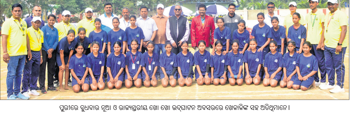
ପୁରୀରେ ରୁଧିରୀ ଅନୁଷ୍ଠିତ ଓ ରାଜ୍ୟସ୍ତରୀୟ ଖୋ ଖୋ ଉଦ୍‌ଘାଟନ ଅବସରରେ ଖେଳାଳିଙ୍କ ସହ ଅତିଥିମାନେ।