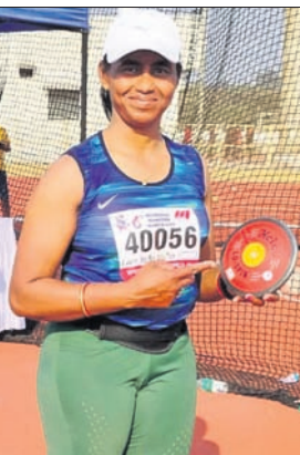
ଇଭେଣ୍ଟରେ ମଧ୍ୟ ଭାଗନେବେ ଏଥିରେ ମଧ୍ୟ ସେ ସ୍ୱର୍ଣ୍ଣ ପଦକ ଜିତିବେ ବୋଲି ଆଶା ରଖୁଛନ୍ତି।

ଭୁବନେଶ୍ୱର, ୮୨ (ପି.ଟି.): ପୁରୀ ମାଷ୍ଟର୍ସ ଗ୍ରେସ୍ ଆଣ୍ଡ ସ୍ପୋର୍ଟ୍ସ ଫେଡେରେଶନ ଆନୁକୂଲ୍ୟରେ