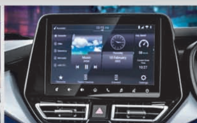
22.86cm SmartPlay Pro+