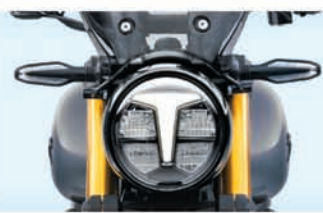
ALL LED LAMPS