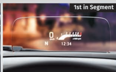
Head Up Display