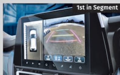
360 View Camera