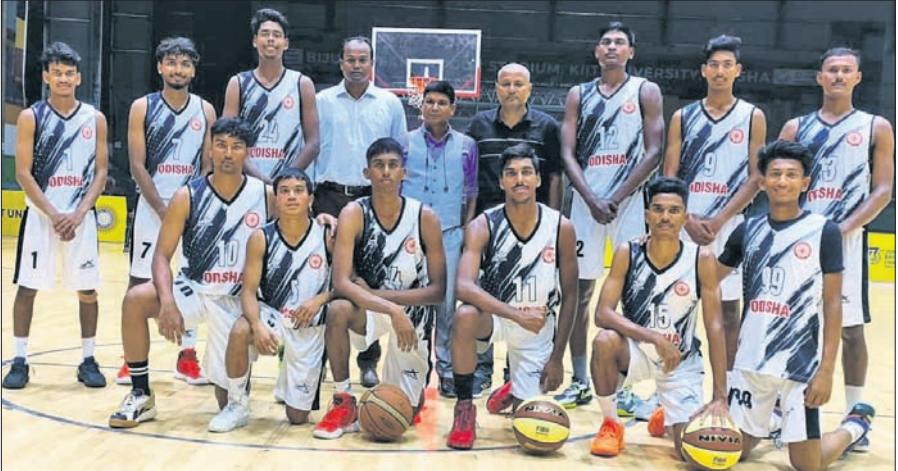
ଓଡ଼ିଶା ବାସ୍କେଟବଲ୍ ଦଳ।

ଭୁବନେଶ୍ୱର, ୮୨ (ବିକ୍ରମ ରଣା): କିଙ୍ଗ୍ ଯୁନିଭର୍ସିଟି ପରିସରରେ ଚାଲିଥିବା ୭ମାତ୍ର ଜାତୀୟ କ୍ରିକେଟ