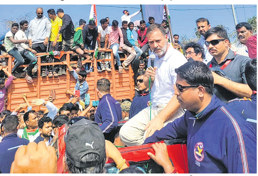
ଝାରସୁଗୁଡ଼ାଠାରେ କଂଗ୍ରେସ ନେତା ରାହୁଲ ଗାନ୍ଧୀ ରୋଡ୍ ଶୋ କରିଛନ୍ତି।