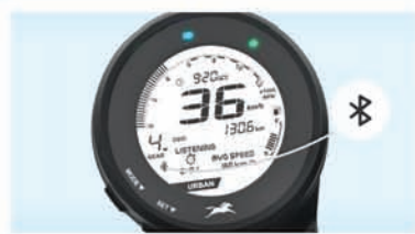
BLUETOOTH CONNECTIVITY WITH VOICE ASSIST**