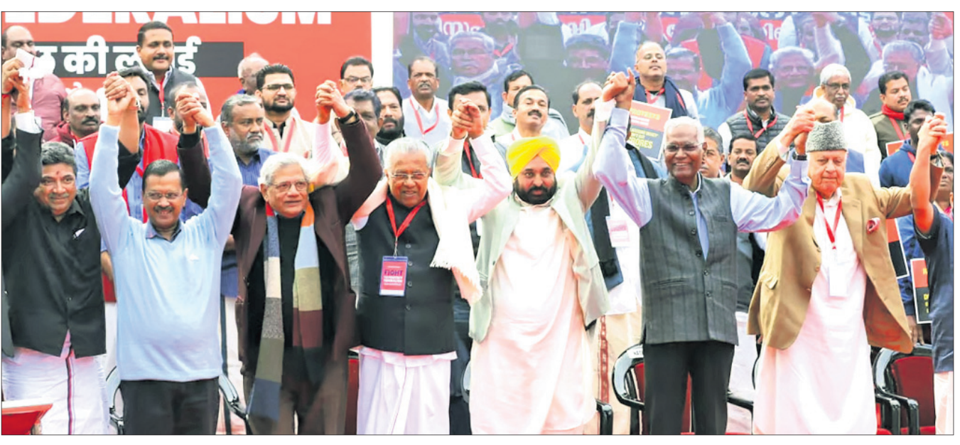
କେନ୍ଦ୍ରୀୟ ଅନୁଦାନ ପ୍ରଦାନରେ ଅବହେଳା ଓ ପସପାତୀତାକୁ ବିରୋଧ କରି ଗୁରୁବାର ନୂଆଦିଲ୍ଲୀର ଯତ୍ନମୟତାରେ ଏକତ୍ରିତ ବିରୋଧୀ ଗୋଷ୍ଠୀଙ୍କୁ ସମାବେଶରେ ସେଥିରେ ଦିଲ୍ଲୀ ମୁଖ୍ୟମନ୍ତ୍ରୀ ଅରିନ୍ଦମ କେଜ୍ରିୱାଲ, କେନ୍ଦ୍ର ମୁଖ୍ୟମନ୍ତ୍ରୀ ପିନାରୀୟା ବିଜୟନ, ପଞ୍ଜାବ ମୁଖ୍ୟମନ୍ତ୍ରୀ ଭଗତ୍ ସିଂହ ମାନ୍, ନ୍ୟାଶନାଲ କନ୍ଫରେନ୍ସ ଅଧ୍ୟକ୍ଷ ଫାଲ୍ଗୁନ ଅବହୁଲ, ସିପିଆଇ (ଏମ) ସାଧାରଣ ସମ୍ପାଦକ ଡି. ରାଜା, ସିପିଆଇ (ଏମ) ସାଧାରଣ ସମ୍ପାଦକ ସାତାରାମ ଯେରୁରୀ ପ୍ରମୁଖ ଯୋଗଦେଇଛନ୍ତି।

ନୂଆଦିଲ୍ଲୀ, ୮୧: ଭାରତ ଏବଂ ମ୍ୟାନମାର ମଧ୍ୟରେ ଅବାଧ ଯାତାୟାତ ବନ୍ଦ ହେବ। ଦୁଇ ଦେଶ ମଧ୍ୟରେ ରହିଥିବା ମୁକ୍ତ ଗମନାଗମନ ବ୍ୟବସ୍ଥା (ଏଫ୍ଏମଆର୍) ରଦ୍ଦ କରିଥିବା ଘୋଷଣା କରିଛନ୍ତି।