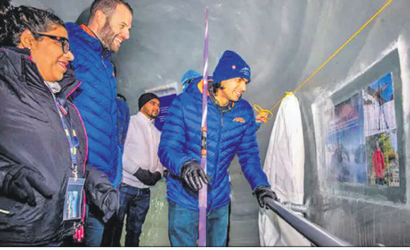
ଫଳ ଉନ୍ନତତର କରୁଛନ୍ତି ନୀରଜ ଚୋପ୍ରା।

ଲାଇସାକେ, ୮୨ (ପି.ଟି.): ଭାରତୀୟ ଜାତଭେଲିଙ୍ଗ ତାରକା ନୀରଜ ଚୋପ୍ରାଙ୍କୁ