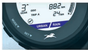
RAIN & URBAN ABS MODES