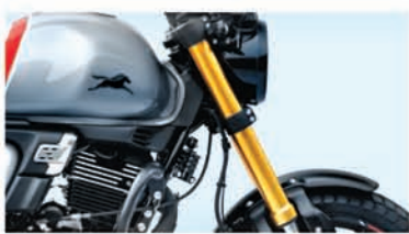
UPSIDE DOWN FRONT FORKS