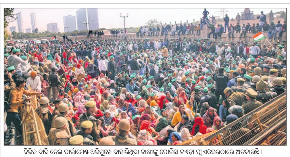
ବିଭିନ୍ନ ଦାବି ନେଇ ପାର୍ଲିମେଣ୍ଟ ଅଭିମୁଖେ ବାହାରିଥିବା ଚାଷୀଙ୍କୁ ପୋଲିସ ନବଦ୍ୱାରା ପୁାଏଠକରେ ଅଟକାଇଛି।

ଉତ୍ତେଜନାପୂର୍ଣ୍ଣ ସ୍ଥିତିକୁ ଦେଖି ହଲଦ୍ୱାରୀ ଅତିରିକ୍ତ ପୁରସ୍କା ବଳ ମଗାଯାଇଛି। ଧାମି ବରିଷ୍ଠ ଅଧିକାରୀମାନଙ୍କ ଏକ ବୈଠକ କରାଯିବ ବୋଲି କହିଛି ପୋଲିସ।