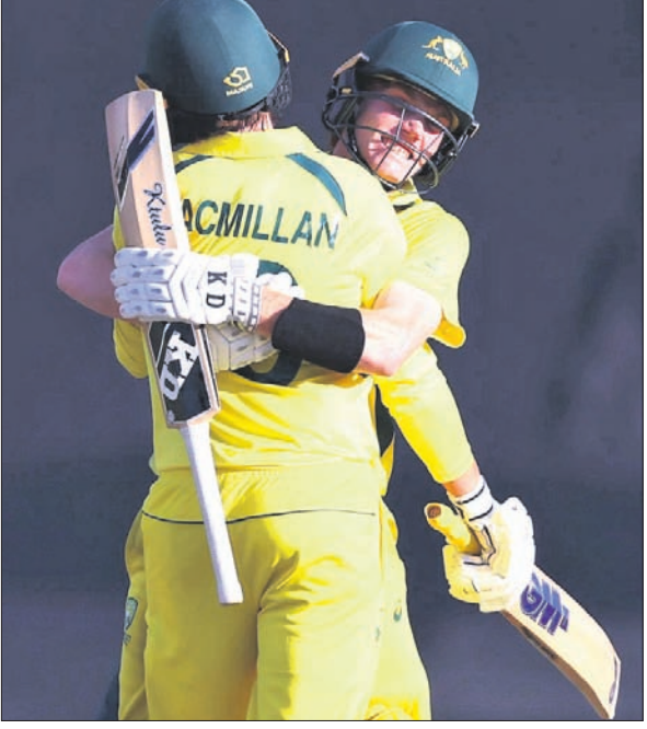
ଅଷ୍ଟ୍ରେଲିଆକୁ ଜିତାଇବା ପରେ ଉତ୍ତରାଖଣ୍ଡ ରାଫ୍ଟ ମ୍ୟାଚ୍‌ମିଳାନ।

ପକ୍ଷରୁ ଚମ୍ପିୟନ ୨୪ ରନ୍‌ରେ ୬ ଉଲ୍ଲେଖନୀୟ ଥିଲେ। ଅନୁମାନକ ମଧ୍ୟରେ ମଲି ବିଅର୍ଡ଼ାନ, କାଲମ