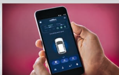
In-built Suzuki Connect