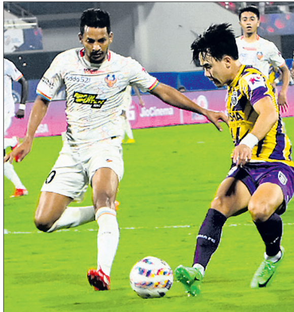
ଓଡ଼ିଶା ଏଫସି ଓ ଏଫସି ଗୋଆ ମଧ୍ୟରେ ଅନୁଷ୍ଠିତ ମ୍ୟାଚ।