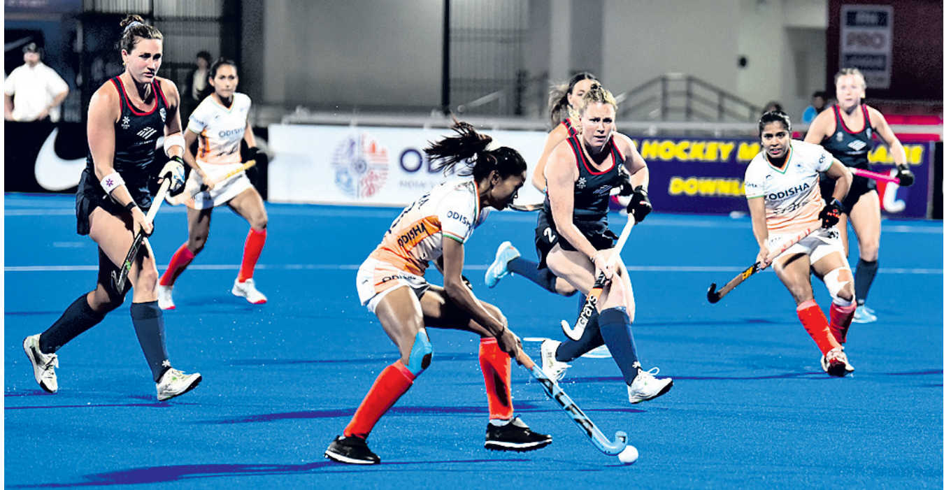
କଳିଙ୍ଗ କ୍ଷୁଦ୍ରମତ୍ସର ଶୁକ୍ରବାର ଏଫଆଇଏଫ ମହିଳା ହକି ପ୍ରୋ ଲିଗରେ ଭାରତ ଓ ଆମେରିକା ମଧ୍ୟରେ ଅନୁଷ୍ଠିତ ମ୍ୟାଚ । ଏଥିରେ ଭାରତ ୩-୧ ଗୋଲରେ ବିଜୟୀ ହୋଇଛି । (ରିପୋର୍ଟ: ଖେଳ ପୃଷ୍ଠା)