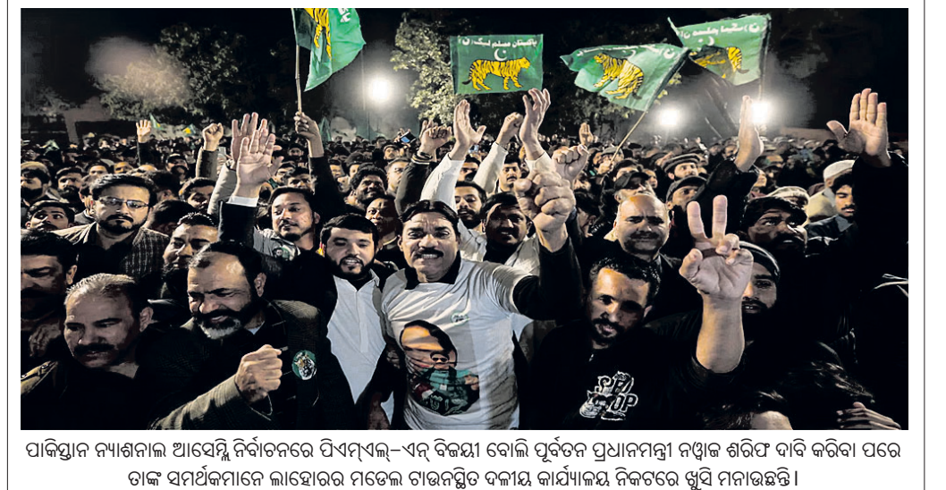
ପାକିସ୍ତାନ ନ୍ୟାଶନାଲ ଆସେମ୍ବ୍ଲି ନିର୍ବାଚନରେ ପିଏମ୍‌ଏଲ୍-ଏନ୍‌ଏ ବିଜୟୀ ବୋଲି ପୂର୍ବତନ ପ୍ରଧାନମନ୍ତ୍ରୀ ନଝାଜ ଶରିଫ ଦାବି କରିବା ପରେ ତାଙ୍କ ସମର୍ଥକମାନେ ଲାହୋରର ମଡେଲ ଟାଉନରେ ଦଳୀୟ କାର୍ଯ୍ୟକ୍ରମ ନିକଟରେ ଧ୍ୱଜା ଧରିବାକୁ ଯାଇଛନ୍ତି।

ନୂଆଦିଲ୍ଲୀ,୯୧୨: ପୂର୍ବତନ ପ୍ରଧାନମନ୍ତ୍ରୀ ଚରଣ ସିଂ, ପି.ଭି. ନରସିଂହ ରାଓ ଏବଂ ସବୁଜ ବିପ୍ଳବର ଜନକ କୃଷିବିଜ୍ଞାନୀ ଏମ୍.ଏସ୍. ସ୍ୱାମୀନାଥନଙ୍କୁ ଭାରତର ଉନ୍ନତ ଯୋଷଣାକୁ ସମାଜବାଦୀ ଦଳମତ ନିର୍ଦ୍ଦେଶରେ ସ୍ୱାଗତ କରାଯାଇଛି। କଂଗ୍ରେସ ପକ୍ଷରୁ ଦଳ ଅଧ୍ୟକ୍ଷ ମିଲିକାକୁମ୍ଭର ଖାଗେ ସରକାରଙ୍କ ନିଷ୍ପତ୍ତିକୁ ସ୍ୱାଗତ କରିବା ସହ ସେମାନଙ୍କ ଦୂରଦୃଷ୍ଟି, କଠିନ ପରିଶ୍ରମ ଏବଂ ଅସାଧାରଣ ଲାଗାବିଳୁ ପ୍ରଶଂସା କରିଛନ୍ତି। ପୂର୍ବତନ ଅଧ୍ୟକ୍ଷା ସୋନିଆ ଗାନ୍ଧୀ ମଧ୍ୟ କେନ୍ଦ୍ରର ନିଷ୍ପତ୍ତିକୁ ସ୍ୱାଗତ କରିଛନ୍ତି। ଅନ୍ୟପକ୍ଷରେ କଂଗ୍ରେସ ନେତା ରାଜୀବ ଶୁକ୍ଲା କହିଛନ୍ତି, କେନ୍ଦ୍ର ସରକାର ନରସିଂହ ରାଓଙ୍କୁ ସମ୍ମାନିତ କରିଥିବାବେଳେ ମନମୋହନ ସିଂ ସରକାରଙ୍କ ଅର୍ଥନୀତି ଉପରେ କ୍ଷେତ୍ରପତ୍ର ଆଣିଛନ୍ତି। ରାଓଙ୍କ ସରକାରରେ ମନମୋହନ ଅର୍ଥମନ୍ତ୍ରୀ ଥିଲେ। ନରସିଂହ ରାଓ ଜଣେ ଦୂରଦୃଷ୍ଟିସମ୍ପନ୍ନ ନେତା ଥିଲେ ବୋଲି ଲୋକ ସଭା ବୀରବ୍ରତ ଓଏମ୍ ବିର୍ଲା କହିଛନ୍ତି। ୩ ବିଶିଷ୍ଟ ବ୍ୟକ୍ତିଙ୍କୁ ବନ୍ଧୁ ପୂର୍ବରୁ ସର୍ବୋଚ୍ଚ ସମ୍ମାନ ପ୍ରଦାନ କରିବାର ଥିଲା ବୋଲି ପ୍ରତିରକ୍ଷା ମନ୍ତ୍ରୀ ରାଜନାଥ ସିଂ କହିଛନ୍ତି। ଭାରତର ଉନ୍ନତ ଯୋଷଣା ହୋଇଥିବା ୩ ଜଣ ପ୍ରଭୁତରେ ଭାରତର ଉନ୍ନତ ବୋଲି ଜେଡିଏମ୍ ନେତା ରାଜୀବ ରଞ୍ଜନ ସିଂ କହିଛନ୍ତି।