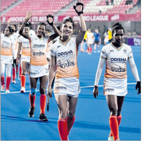
ମ୍ୟାଚ ଜିତିବା ପରେ ଭାରତୀୟ ଖେଳାଳି

ଭୁବନେଶ୍ୱର, ୯/୨ (ତପନ ସାଲ୍) ଏଫଆଇଏଚ୍ ପହିଲା ହକି ପ୍ରୋ ଲିଗର ଚଳିତ ସିଜନରେ ଭାରତ ଶୁକ୍ରବାର ପ୍ରଥମ ବିଜୟ ହାସଲ କରିଛି। କଳିଙ୍ଗ ଷ୍ଟାଡିୟମରେ ଶୁକ୍ରବାର ଅନୁଷ୍ଠିତ ମ୍ୟାଚରେ ଯାହାର ଦଳ ୩-୧ ଗୋଲରେ ଆମେରିକାକୁ ପରାସ୍ତ କରିଛି। ପୂର୍ବ ୩ ମ୍ୟାଚରେ ଯଥାକ୍ରମେ ବାଲିଆ (୧-୨), ନେଦରଲାଣ୍ଡ (୧-୩) ଓ ଅଷ୍ଟ୍ରେଲିଆ (୦-୩) ଠାରୁ ହାରିଥିବା ଭାରତ ବିଜୟ ସହ କଳିଙ୍ଗ ଷ୍ଟାଡିୟମରେ ଏହାର ଅଭିଯାନ ଶେଷ କରିଛି। ଏଥିସହ ପ୍ରୋ ଲିଗରେ ପଥକ ଖାତା ଖୋଲିଛି ଭାରତୀୟ ଦଳ। ୪ ମ୍ୟାଚରୁ ୧ ବିଜୟ ଓ ୩ ପରାଜୟ ସହ ୩ ପଥକ ପାଇ ଭାରତ ତେଜସ୍କର