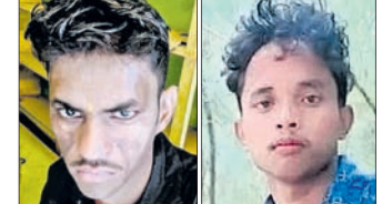
ମୃତ ଭବାନୀ ଓ ମନୋରଞ୍ଜନ

■ ୪ ସୁପାରିକିଲରଙ୍କ ସହ ଭାଇ-ଭାଇ ଗିରଫ ■ ହତ୍ୟା ପାଇଁ ୧ଲକ୍ଷ ୪୦ ହଜାର ଟଙ୍କା