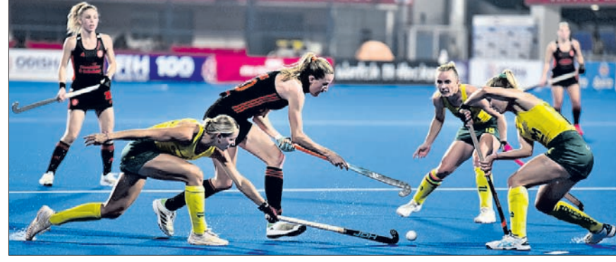
ନେଦରଲାଣ୍ଡ-ଅଷ୍ଟ୍ରେଲିଆ ମ୍ୟାଚର ଏକ ସଂଘର୍ଷପୂର୍ଣ୍ଣ ମୁହୂର୍ତ୍ତ।