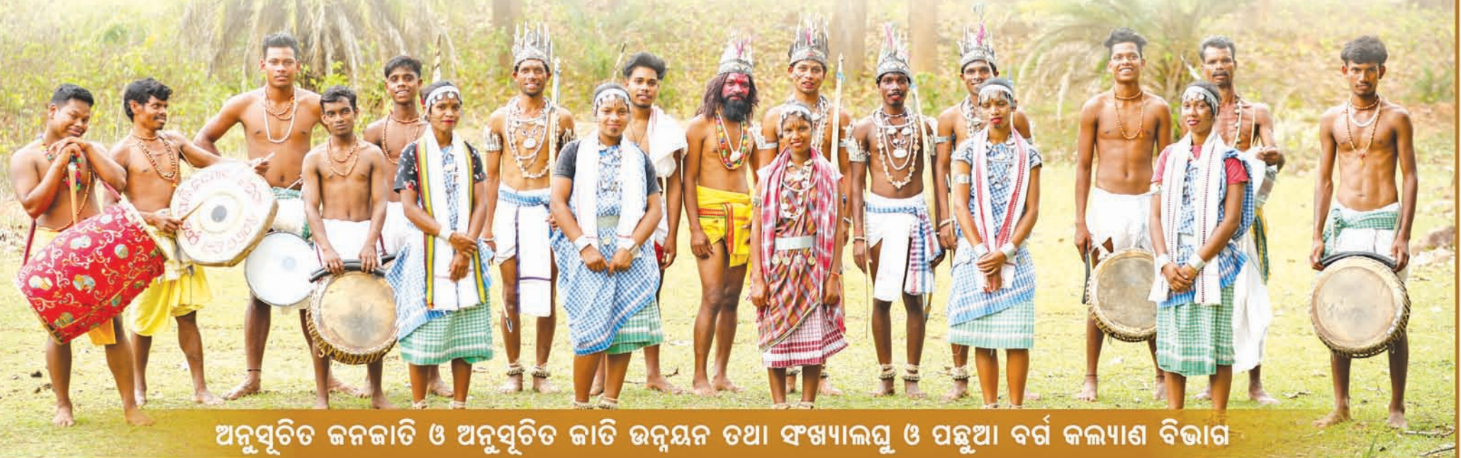
ଅନୁସୂଚିତ ଜନଜାତି ଓ ଅନୁସୂଚିତ ଜାତି ଉନ୍ନୟନ ତଥା ସଂଖ୍ୟାଲଘୁ ଓ ପଛୁଆ ବର୍ଗ କଲ୍ୟାଣ ବିଭାଗ