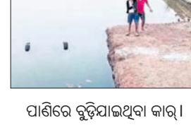
ପାଣିରେ ବୁଡ଼ିଯାଇଥିବା କାର୍।