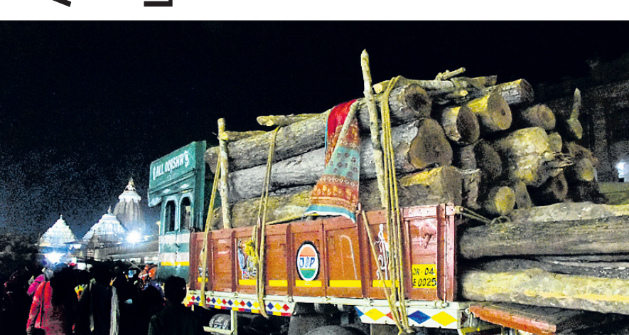
ଆସନ୍ତା କୁଲାଇ ୭ରେ ହେବାକୁ ଥିବା ମହାପ୍ରଭୁଙ୍କୁ ବିଶ୍ୱପ୍ରସିଦ୍ଧ ରଥଯାତ୍ରା ପାଇଁ ଶୁକ୍ରବାର ନୟାଗଡ଼ ଓ ଦଶପଲ୍ଲୀ ବନଖଣ୍ଡକୁ ଚାଲି ଯିବା ପୂର୍ବକ ପୁରୀରେ ପହଞ୍ଚିଥିବା ରଥକାଠ।

ପୁରୀ/ନୟାଗଡ଼/ ଦଶପଲ୍ଲୀ, ୯୨ (ଅଭିଳାଷ ମହାନ୍ତି, ଲୋକନାଥ ମିଶ୍ର, ପ୍ରକାଶ କୁମାର ପାଣି)