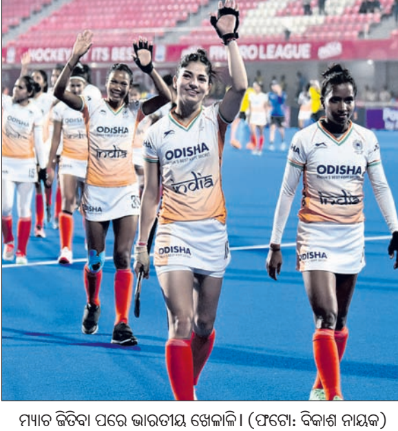
ମ୍ୟାଚ ଜିତିବା ପରେ ଭାରତୀୟ ଖେଳାଳି

ଭୁବନେଶ୍ୱର, ୯/୨ (ତପନ ସାଲ୍) ଏଫଆଇଏଚ୍ ପହିଲା ହକି ପ୍ରୋ ଲିଗର ଚଳିତ ସିଜନରେ ଭାରତ ଶୁକ୍ରବାର ପ୍ରଥମ ବିଜୟ ହାସଲ କରିଛି। କଳିଙ୍ଗ ଷ୍ଟାଡ଼ିୟମରେ ଶୁକ୍ରବାର ଅନୁଷ୍ଠିତ ମ୍ୟାଚରେ ଯାହାକି ଦଳ ୩-୧ଗୋଲରେ ଆମେରିକାକୁ ପରାସ୍ତ କରିଛି। ପୂର୍ବ ୩ ମ୍ୟାଚରେ ଯଥାକ୍ରମେ ଚାଇନା (୧-୨), ନେଦରଲାଣ୍ଡ (୧-୩) ଓ ଅଷ୍ଟ୍ରେଲିଆ(୦-୩)ଠାରୁ ହାରିଥିବା ଭାରତ ବିଜୟ ସହ କଳିଙ୍ଗ ଷ୍ଟାଡ଼ିୟମରେ ଏହାର ଅଭିଯାନ ଶେଷ କରିଛି। ଏଥିସହ ପ୍ରୋ ଲିଗରେ ପଦଖାନ ଖାତା ଖୋଲିଛି ଭାରତୀୟ ଦଳ। ୪ ମ୍ୟାଚରୁ ୧ ବିଜୟ ଓ ୩ ପରାଜୟ ସହ ୩ ପଦଖାନ ପାଇ ଭାରତ ଚେତୁଲର