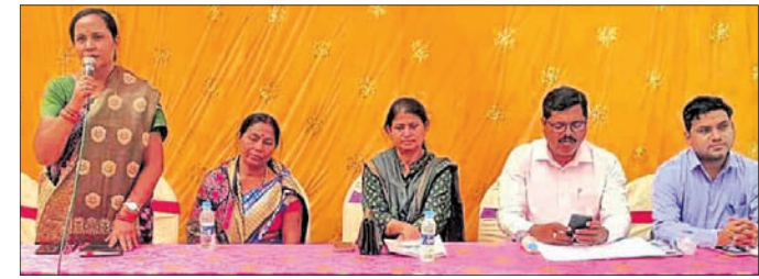
ଜନଶୁଣାଣି ଶିବିରରେ ଯୋଗଦେଇଥିବା ପ୍ରଶାସନିକ ଅଧିକାରୀ ଓ ଅନ୍ୟମାନେ ।

ପ୍ରମୁଖ ଯୋଗଦେଇ ବିଭିନ୍ନ ଦିଗ ଉପରେ ଶୁଣାଣି କରିଥିଲେ । କରତସିଂହପୁରର ଜିଲ୍ଲା ପ୍ରଶାସନ ତରଫରୁ ରାଜ୍ୟ ସରକାରଙ୍କ ଦ୍ୱାରା ପ୍ରତିଷ୍ଠିତ ୨୦୧୩ ଅଧିକାରୀ ଓ ବିସ୍ତାପନ ନୀତି ଓ ପରବର୍ତ୍ତୀ ସମୟରେ ୨୦୧୬ର ସଂଶୋଧିତ ଆଇନକୁ ବିଚାରକୁ ନେଇ କ୍ଷତିପୂରଣ ପ୍ରଦାନ କରାଯିବ ବୋଲି ଶିବିରରେ କୁହାଯାଇଥିଲା ।