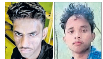
ମୃତ ଭବାନୀ ଓ ମନୋରଞ୍ଜନ

■ ୪ ସୁପାରିକିଲରଙ୍କ ସହ ଭାଇ-ଭାଇ ଗିରଫ ■ ହତ୍ୟା ପାଇଁ ୧ଲକ୍ଷ ୪୦ ହଜାର ଡିଲ୍