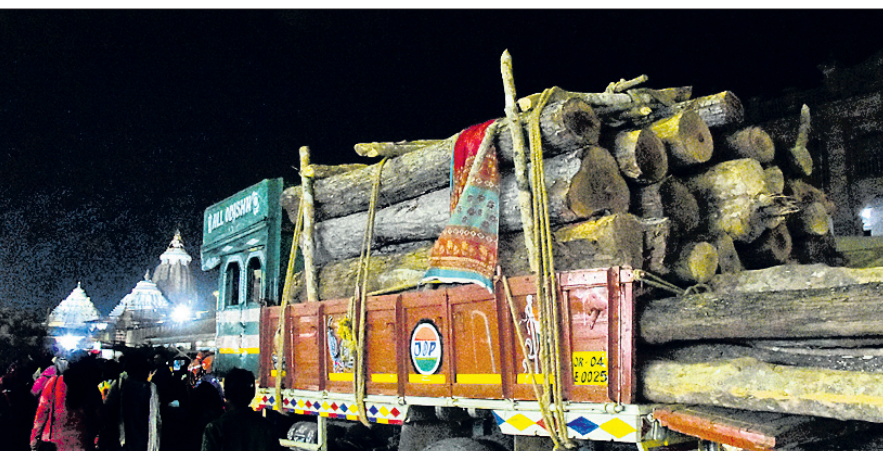
ଆସନ୍ତା କୁଲାଭି ୭ରେ ହେବାକୁ ଥିବା ମହାପ୍ରଭୁଙ୍କ ବିଶ୍ୱପ୍ରସିଦ୍ଧ ରଥଯାତ୍ରା ପାଇଁ ଶୁକ୍ରବାର ନୟାଗଡ଼ ଓ ଦଶପଲ୍ଲୀ ବନଖଣ୍ଡରୁ ଗ୍ରୁକ ଯୋଗେ ପୁରୀରେ ପହଞ୍ଚିଥିବା ରଥକାଠ।

ପୁରୀ/ନୟାଗଡ଼/ ଦଶପଲ୍ଲୀ, ୯୨ (ଅଜିତ ମହାନ୍ତି, ଲୋକନାଥ ମିଶ୍ର, ପ୍ରକାଶ କୁମାର ପାଣି)