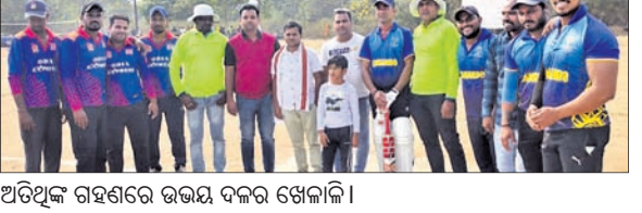
ଅତିଥିଙ୍କ ଗହଣରେ ଭଉଣ୍ୟ ଦଳର ଖେଳାଳୀ