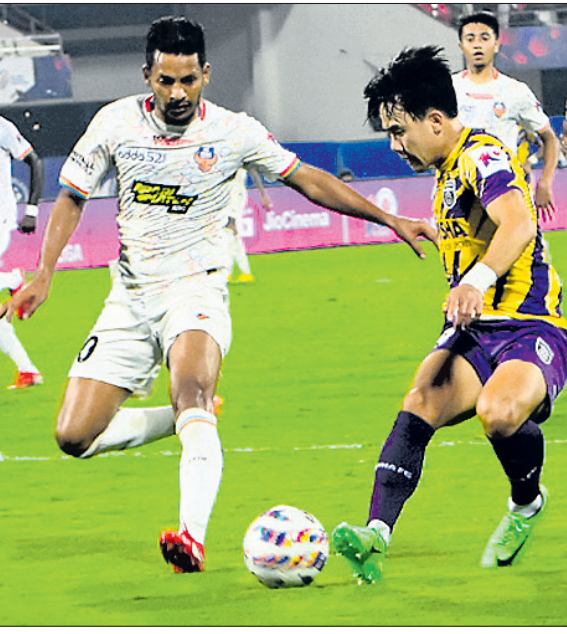
ଓଡ଼ିଶା ଏଫସି ଓ ଏଫସି ଗୋଆ ମଧ୍ୟରେ ଅନୁଷ୍ଠିତ ମ୍ୟାଚ।