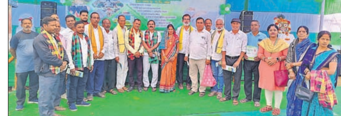
ଚନ୍ଦନପୁର ପଞ୍ଚାୟତ ପକ୍ଷରୁ ଅନୁଷ୍ଠିତ କାର୍ଯ୍ୟକ୍ରମରେ ଯୋଗଦେଇଥିବା ଅତିଥି ।