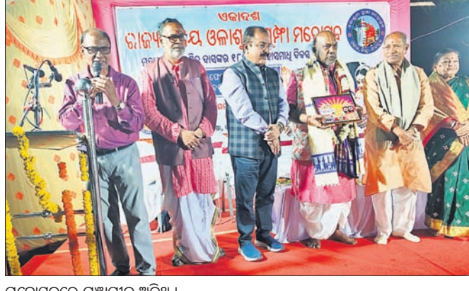
ମହୋତ୍ସବରେ ମହାସାଧନ ଅତିଥି ।