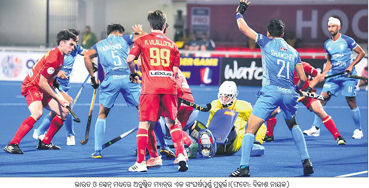
ଭାରତ ଓ ସେନ୍ଦର ମଧ୍ୟରେ ଅନୁଷ୍ଠିତ ମ୍ୟାଚର ଏକ ସଂଘର୍ଷପୂର୍ଣ୍ଣ ପୃଷ୍ଠା

ଲକିତ କ୍ରମାଦ ଉପାଧାୟ ଏକ ଫିଲ୍ଡ ଗୋଲ ଦେଇ ଦଳକୁ ୪-୧ରେ ବିଜୟ କରିଥିଲେ।