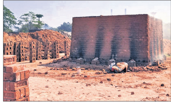
କେଙ୍କାନାଳ/ଓଡ଼ାପଡ଼ା, ୧୦/୨ (ରବିବର ନାୟାର/ରଞ୍ଜିତ ନାୟକ)