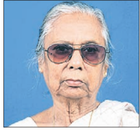
ନିର୍ବାଚନମଣ୍ଡଳରୁ ୮ଥର ଓ କବିସୂର୍ଯ୍ୟନଗର ନିର୍ବାଚନମଣ୍ଡଳରୁ ୨ ଥର ବିଧାୟିକା ଭାବେ ନିର୍ବାଚିତ ହୋଇଥିଲେ। ପୃଷ୍ଠା-୫