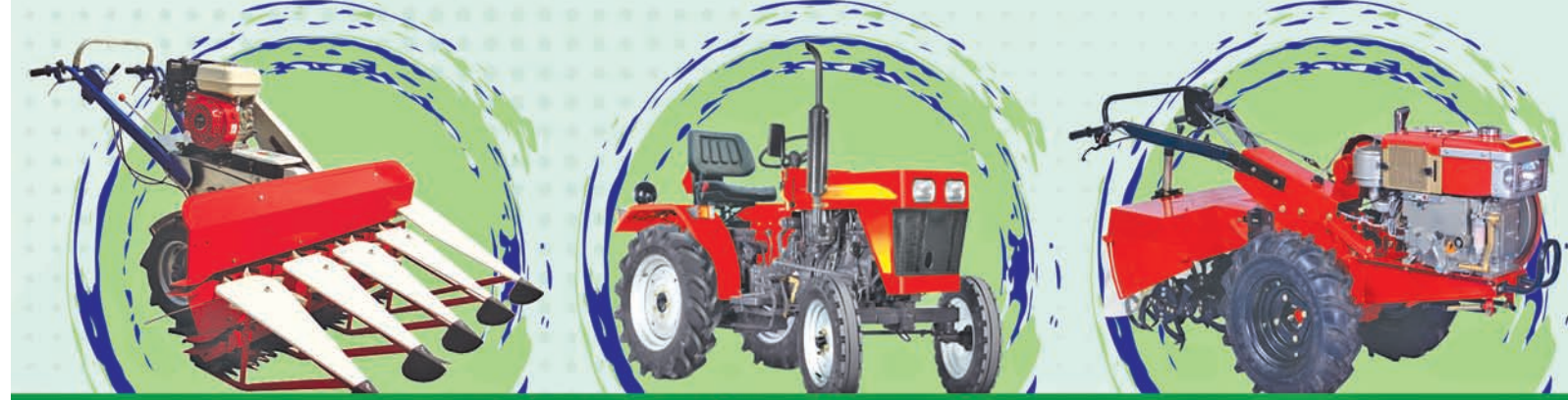
କୃଷି ଓ କୃଷକ ସଶକ୍ତିକରଣ ବିଭାଗ, ଓଡ଼ିଶା