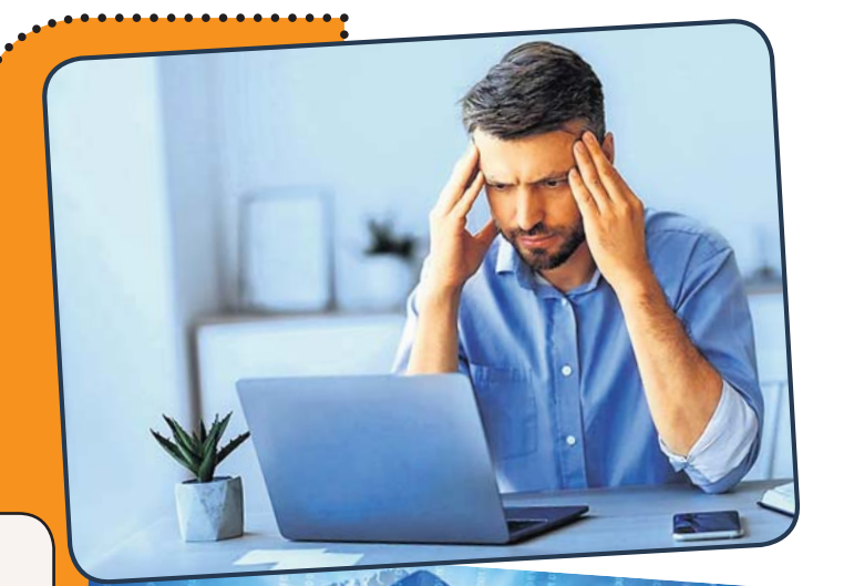
ଏକ କୋଡ୍ ଆସିଥାଏ ଏବଂ ଯାହାକୁ ଦେବା ପରେ ଆକାଉଣ୍ଟ ଭେରିଫାଏ ହୋଇଥାଏ । ଫଳରେ ପ୍ୟାନ୍‌ସ୍‌ୱେଲ୍ ଚୋରି ହେଲେ ମଧ୍ୟ ଆକାଉଣ୍ଟରେ କୌଣସି ଅଧିକାର ହୋଇ ନ ଥାଏ ।

ପଛାଡି ନାହିଁ । ହେଲେ ଏହାଦ୍ୱାରା କେବେକେବେ ହ୍ୟାକର୍ ନା କେବଳ ଆପଣଙ୍କ ଆକାଉଣ୍ଟ ହ୍ୟାକ୍ କରିବେ ବରଂ ଆପଣଙ୍କ ତାଗା ବ୍ୟବହାର କରି ବିଭିନ୍ନ ଅସାମାଜିକ କାର୍ଯ୍ୟ ବି କରିଥାନ୍ତି । ତେଣୁ ସୋସିଆଲ୍ ମିଡିଆରେ ନିଜର କିମ୍ବା ପରିବାରର କୌଣସି ପୋଷ୍ଟ କରିବା ବେଳେ ସତର୍କ ରୁହନ୍ତୁ । ମଝିରେ ମଝିରେ ପ୍ରାଇଭେସି ସେଟିଂ ରିଭ୍ୟୁ କରନ୍ତୁ । ଆକାଉଣ୍ଟର ପ୍ୟାନ୍‌ସ୍‌ୱେଲ୍ ମଜବୁତ ରଖନ୍ତୁ । ଏହାକୁ ମଝିରେ ମଝିରେ ବଦଳାଇବାକୁ ଭୁଲନ୍ତୁ ନାହିଁ । ଏଥିପାଇଁ ପ୍ୟାନ୍‌ସ୍‌ୱେଲ୍