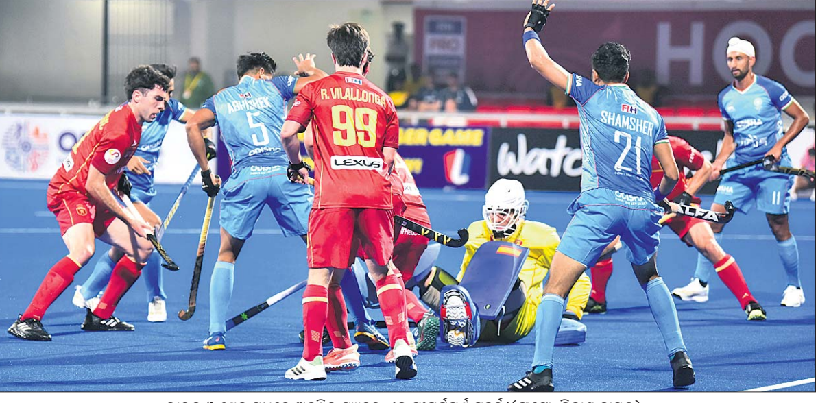
ଭାରତ ଓ ସେନ ମଧ୍ୟରେ ଅନୁଷ୍ଠିତ ମ୍ୟାଚର ଏକ ସଂଘର୍ଷପୂର୍ଣ୍ଣ ପୃଷ୍ଠା

ଲଳିତ କୁମାର ଉପାଧ୍ୟାୟ ଏକ ଫିଲ୍ଡ ଗୋଲ ଦେଇ ଦଳକୁ ୪-୧ରେ ବିଜୟ କରିଥିଲେ।