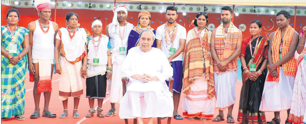
ଆଦିବାସୀ ପ୍ରଦର୍ଶନୀ ପଠାରେ ଶନିବାର ଅନୁଷ୍ଠିତ ସ୍ୱତନ୍ତ୍ର ଉନ୍ନୟନ ପରିଷଦ ମହାସମାବେଶରେ ହିତାଧିକାରୀଙ୍କ ସହ ମୁଖ୍ୟମନ୍ତ୍ରୀ ନବୀନ ପଟ୍ଟନାୟକ ।