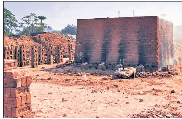
ଡେକାନାଲ, ୧୦୧୨ (ରତନ ନାୟାର)

ସନ୍ଧ୍ୟାରେ ଇଟାଭାଟିରେ ନିଆଁ ଧରାଯାଇଥିଲା। ରାତିକ ମଧ୍ୟରେ ଉପରଯାଏ ନିଆଁ ଉଠିବାର ଡର ନ ଥିଲା। ତେଣୁ ହେଉଥିବା ପ୍ରବଳ ଶୀତ ଓ ହାତୀ ଦାଉରୁ ରକ୍ଷା ପାଇଁ ଶ୍ରମିକ ଦମ୍ପତିଙ୍କ ସହ ୨ ଫୁଆ ଭାଟି ଉପରକୁ ବଢ଼ି ଶୋଇଯାଇଥିଲେ। ହେଲେ ବିକଳିତ ରାତିରେ ଜଳଜା ଇଟାଭାଟିର ଭୟଙ୍କର ଧୂଆଁ ୩ ଜଣଙ୍କ ଜୀବନ ନେଇଯାଇଥିଲା। ଡେକାନାଲ ଜିଲା ଓଡ଼ାପଡ଼ା ବ୍ଲକ କମଳାଙ୍କ ଗ୍ରାମସ୍ଥିତ ଦୁର୍ଗାପୁର ବ୍ରାହ୍ମଣୀ ନଦୀ କୂଳରେ ରହି ଉଠିଥିବା ଏକ ବେଆଇନ ଇଟାଭାଟିରେ ଶନିବାର ଘଟିଥିବା ଏହି ଅଘଟଣ ଜିଲାରେ ଶୋକର ଛାୟା ଖେଳାଇ ଦେଇଛି।