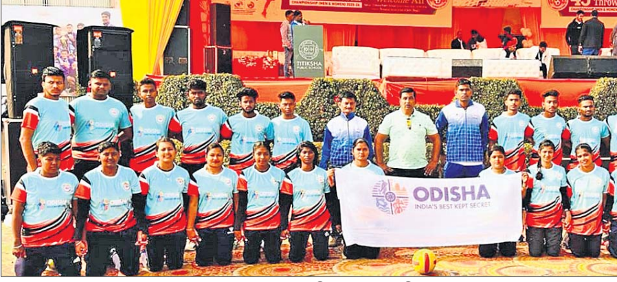
ଓଡ଼ିଶା ପୁରୁଷ ଓ ମହିଳା ଥ୍ରୋ ବଲ୍ ଦଳ।

ପ୍ରତିଯୁଗୀ ହରାଇବା ସହ ପଏଣ୍ଟ ଟେବୁଲର ପ୍ରଥମ ସ୍ଥାନରେ ରହି କ୍ୱାର୍ଟର ଫାଇନାଲ ପାଇଁ ଯୋଗ୍ୟ ଅର୍ଜନ କରିଥିଲା। ସମାନ ଢଙ୍ଗରେ ମହିଳା ଦଳ ମଧ୍ୟ ନିଜ ଗ୍ରୁପ୍‌ର ୫ ମ୍ୟାଚ୍ ଜିତି କ୍ୱାର୍ଟରରେ ପ୍ରବେଶ କରିଛି। ମଧ୍ୟପ୍ରଦେଶ, ଆନ୍ଧ୍ର