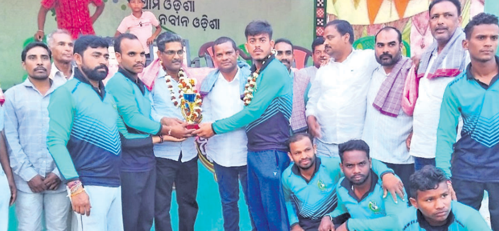
ଚାମ୍ପିୟନ ମେଡିକାଲି ଦଳକୁ ଅତିଥିମାନେ ପୁରସ୍କାର ପ୍ରଦାନ କରୁଛନ୍ତି।

ସୁବର୍ଣ୍ଣପୁର ଜିଲ୍ଲା ବାରମ୍ବାର ବାଲୁକାପୁର ବ୍ଲକ୍ ଅନ୍ତର୍ଗତ ଲୁହରପାଳ ପଞ୍ଚାୟତର ଘିରାପାଲି ଖେଳ ପଡ଼ିଆରେ ହେଉଥିବା ୧୦ମ ମା' ମେଗାକାଳି କ୍ରିକେଟ ଚୂନାବଳୀର ଫାଇନାଲରେ ଆୟୋଜକ ଘିରାପାଲିକୁ ହରାଇ ମେଡିକାଲି ଚାମ୍ପିୟନ ହୋଇଛି।