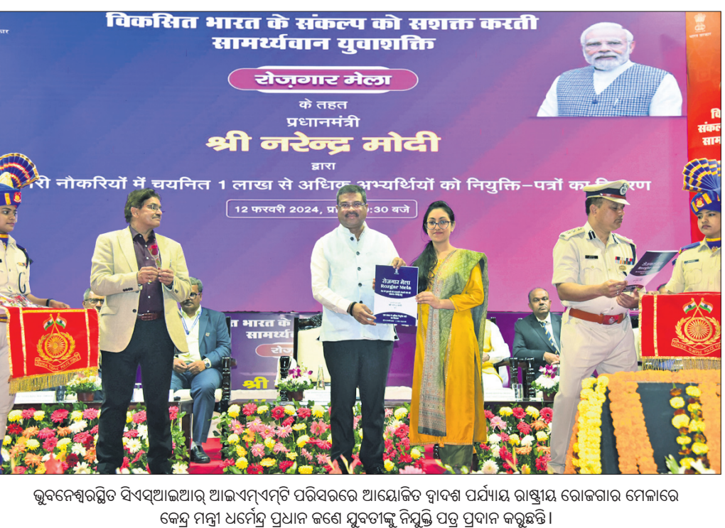
ଭୁବନେଶ୍ୱରସ୍ଥିତ ସିଏସ୍‌ଆଇଆର୍ ଆଇଏମ୍‌ଏମ୍‌ଏସ୍ ପରିସରରେ ଆୟୋଜିତ ଦ୍ୱାଦଶ ପର୍ଯ୍ୟାୟ ରାଷ୍ଟ୍ରୀୟ ରୋଜଗାର ମେଳାରେ କେନ୍ଦ୍ର ମନ୍ତ୍ରୀ ଧର୍ମେନ୍ଦ୍ର ପ୍ରଧାନ ଜଣେ ମୁକତାକୁ ନିୟୁତ୍ତି ପତ୍ର ପ୍ରଦାନ କରୁଛନ୍ତି।

କରାଯାଇଥିଲା। ଲକ୍ଷ୍ମୀ ବସ୍ ଆମ ଜୀବନକୁ ସୁଧାଇ ଦେଇଛି। ଗାଁ ଅର୍ଥନୀତିକୁ ମଜବୁତ କରିବାରେ ଏହା ଗୁରୁତ୍ୱପୂର୍ଣ୍ଣ ଭୂମିକା ଗ୍ରହଣ କରିବ। ପଞ୍ଚାୟତକୁ ବିକାଶ କେନ୍ଦ୍ର କରିବା ଆମର ଲକ୍ଷ୍ୟ ରହିଛି। ଲକ୍ଷ୍ମୀ ବସ୍ ଏଥିରେ ଗୁରୁତ୍ୱପୂର୍ଣ୍ଣ ଭୂମିକା ଗ୍ରହଣ କରିବ। ଏହି ଯୋଜନାରେ ମହାପ୍ରଭୁ ଶ୍ରୀଜଗନ୍ନାଥଙ୍କ ଦର୍ଶନ ପାଇଁ ଓ ଶ୍ରୀମନ୍ଦିର ପରିକ୍ରମା ପ୍ରକଳ୍ପର ଅନୁଭବ ନେବା ପାଇଁ ଶ୍ରୀଜଗନ୍ନାଥ ଏକ୍ସପ୍ରେସ୍ ବସ୍ ସେବା ଆରମ୍ଭ କରାଯାଇଛି। ଏଥିରେ ମା'ମାନଙ୍କ ପାଇଁ ବସ୍ ଟିକେଟ ମୂଲ୍ୟ ଅଧା କରାଯାଇଛି। ଗ୍ରାମାଞ୍ଚଳରେ ଗମନାଗମନର ବହୁ ସମସ୍ୟା ରହିଥିଲା। ପୁଖ୍ୟମନ୍ତ୍ରୀଙ୍କ କାର୍ଯ୍ୟାଳୟର ଜିଲ୍ଲାଗତ ପରେ ଏ ବିଷୟରେ ଜାଣି ନିଷ୍ପତ୍ତିଗ୍ରହଣ କରି ଲକ୍ଷ୍ମୀ ଯୋଜନା ଆରମ୍ଭ କରିଛନ୍ତି। ଗ୍ରାମାଞ୍ଚଳରେ ଭଲ ସଡ଼କ ନିର୍ମାଣ ହୋଇଛି। ଲକ୍ଷ୍ମୀ ବସ୍ ଦ୍ୱାରା ଗ୍ରାମାଞ୍ଚଳବାସୀଙ୍କର ଯାତ୍ରା ଅତ୍ୟନ୍ତ ସୁବିଧାନୀୟ ହେବ। ଲକ୍ଷ୍ମୀ ବସ୍ ଖର୍ଚ୍ଚରେ ତାଙ୍କର ଦୈନିକ କାର୍ଯ୍ୟ ଗ୍ରାମାଞ୍ଚଳ ଲୋକମାନେ ପୁରୁଷାର୍ଥରେ ଏବଂ କମ୍ ଖର୍ଚ୍ଚରେ ତାଙ୍କର ଦୈନିକ କାର୍ଯ୍ୟ ପାଇଁ ଘର ପାଖରୁ ଏହି ବସ୍କୁ ବ୍ୟବହାର କରିପାରିବେ ବୋଲି ପୁଖ୍ୟମନ୍ତ୍ରୀ କହିଛନ୍ତି। କାର୍ଯ୍ୟକ୍ରମରେ ବଲାଙ୍ଗୀରରେ ପରିବହନ କାର୍ଯ୍ୟକ୍ରମରେ ବଲାଙ୍ଗୀରରେ ପରିବହନ