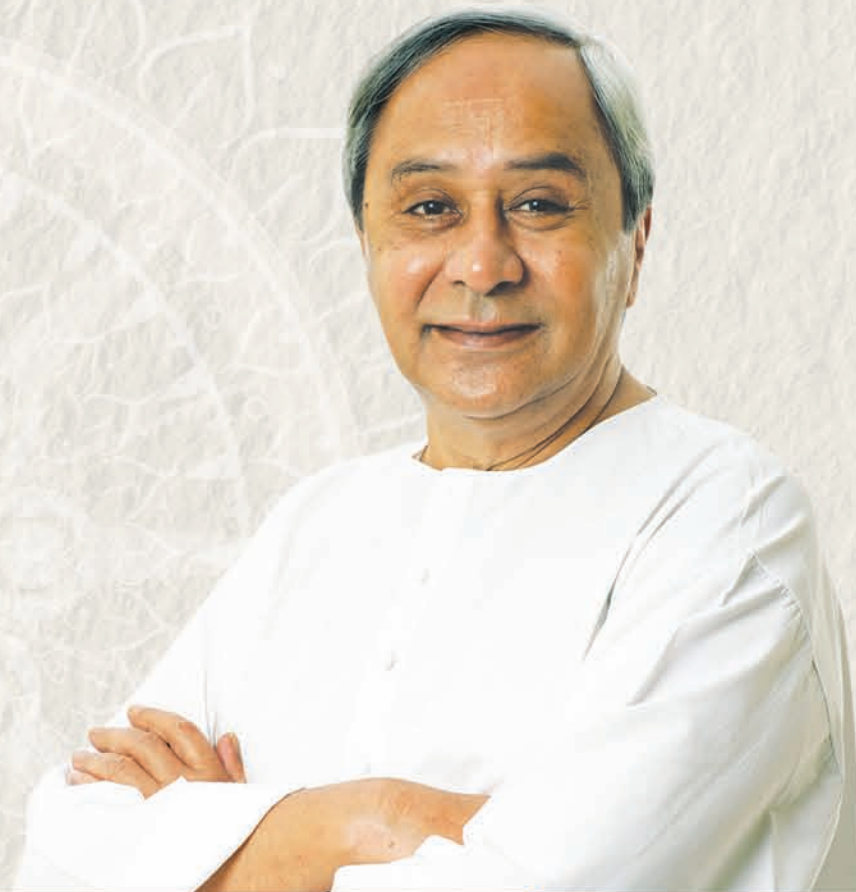
SHRI NARENDRA MODI