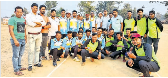
ଖେଳାଳିଙ୍କ ସହ ଅତିଥି।

ବୌଦ୍ଧ ଜିଲ୍ଲା ଲକ୍ଷ୍ମୀପାଳ ବ୍ଲକ୍ ବନ୍ଦଗୋରା ଧରଣର ଶ୍ରୀମତୀ ଯୋଗାଣୀ ସଂସଦର ଅଧିକାରୀଙ୍କ ଗୃହିଣୀ ପ୍ରତିଷ୍ଠା ପାଇଁ ସୁବର୍ଣ୍ଣପୁର ଜିଲ୍ଲା ଉଲ୍ଲଖା ବ୍ଲକ୍ ଅନ୍ତର୍ଗତ କଳାପଥର ସ୍ଥିତ ସତ୍ୟବାଦୀ ଉଚ୍ଚ ମାଧ୍ୟମିକ ବିଦ୍ୟାଳୟରେ ପ୍ରତିଦିନ ଏକ ଦାଖଲ କାର୍ଯ୍ୟକ୍ରମ କରାଯାଇଛି।