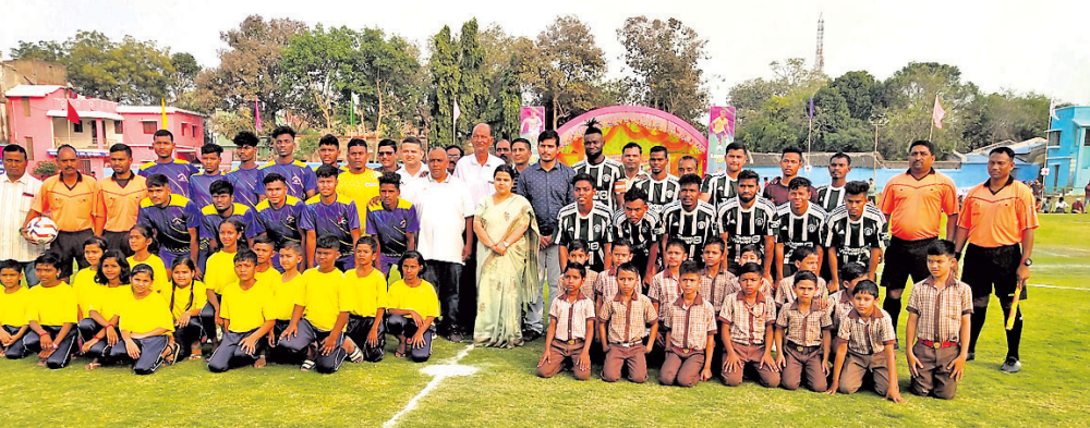
ଉତ୍ତୀର୍ଣ୍ଣ ଦଳର ଖେଳାଳି ଓ ଆୟୋଜକ କ୍ଲବ୍ କର୍ମଚାରୀଙ୍କ ସହିତ ଜିଲ୍ଲାପାଳ।

ସୁବର୍ଣ୍ଣପୁର ଗାନ୍ଧୀପଡ଼ିଆରେ ୧୫ତମ ରାମଧିନ କ୍ଲବ୍ ସର୍ବଭାରତୀୟ ପୂର୍ବକଳ୍ପ ଚୂନାବଳୀ ଯୋଗ୍ୟତାରେ ଉତ୍ତୀର୍ଣ୍ଣ ହୋଇଯାଇଛି। ମହିଷାସୁର ମର୍ଦ୍ଧିନୀ କ୍ଲବ୍ ପକ୍ଷରୁ ଏହି ଚୂନାବଳୀ ଆୟୋଜନ ହେଉଛି।