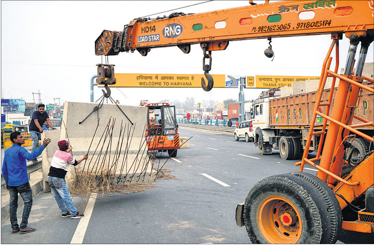
ମଙ୍ଗଳବାର କୃଷକଙ୍କ 'ଫିଲ୍ମା ଚଲୋ' ଅଭିଯାନ ପୂର୍ବରୁ ସିପୁ ସାମାଜରେ ପୋଲିସ୍ ପକ୍ଷରୁ ରାସ୍ତା ଅବରୋଧ କରାଯାଇଛି।