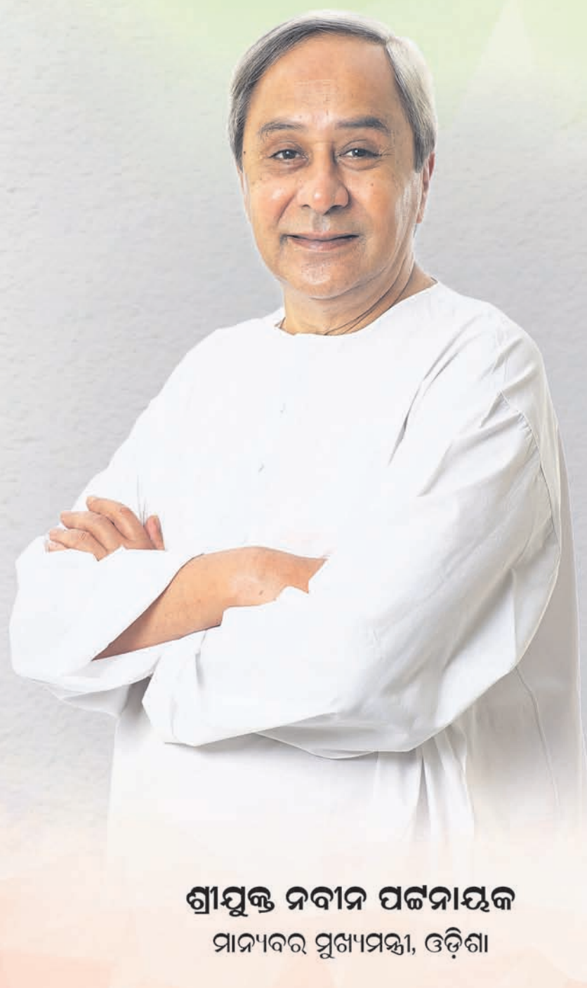
ଶ୍ରୀଯୁକ୍ତ ନବୀନ ପଟ୍ଟନାୟକ ମାନ୍ୟବର ପୁଷ୍ୟମନ୍ତ୍ରୀ, ଓଡ଼ିଶା

ଜେଏନ୍ ଇନଡୋର ଷ୍ଟାଡ଼ିୟମ, କଟକ ୧୪ ରୁ ୧୮ ଫେବୃଆରୀ ୨୦୨୪