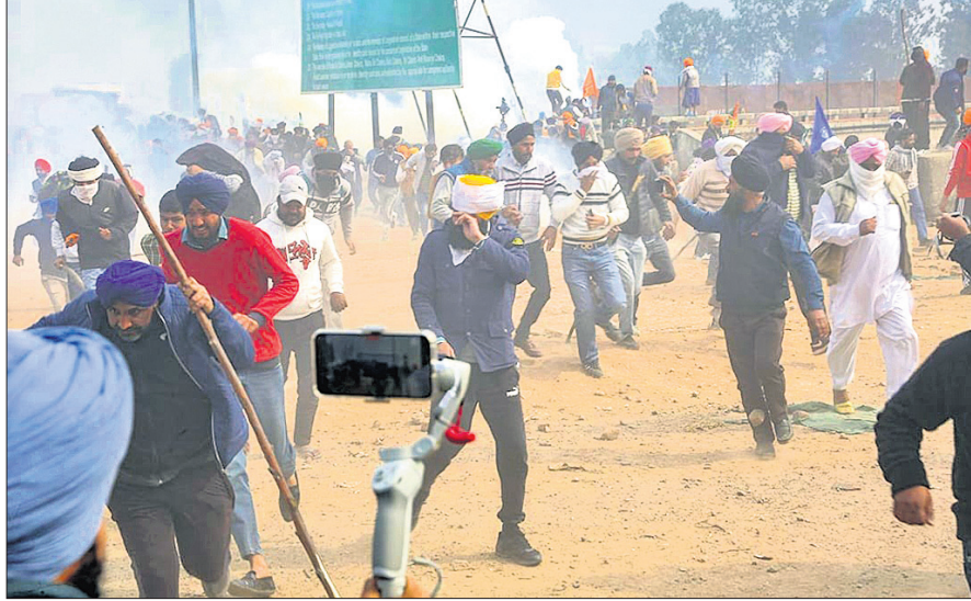
'ଦିଲ୍ଲୀ ଚଲୋ' ଶୋଭାଯାତ୍ରା ବେଳେ ପଞ୍ଜାବ-ହରିୟାଣାର ସମ୍ମୁଖାପରେ ମଙ୍ଗଳବାର କଂଗ୍ରେସ୍ ବ୍ୟାରିକେଡକୁ ଭାଙ୍ଗିଦେଇଛନ୍ତି ଆନ୍ଦୋଳନକାରୀ କୃଷକ ।

ଭାରତୀୟ ଆନ୍ଦୋଳନକାରୀଙ୍କୁ ୧୪୪ ଧାରା ଜାରି ସହ ସର୍ବାଧିକ ସତର୍କତା ଅବଲମ୍ବନ କରାଯାଇଛି । ଇତିମଧ୍ୟରେ କେନ୍ଦ୍ର କୃଷିମନ୍ତ୍ରୀ ଅର୍ଜୁନ ପୁଣ୍ଡା କହିଛନ୍ତି, ସମସ୍ତ ପକ୍ଷଙ୍କ ସହ ବିଚାରବିମର୍ଶ ନ କରି ଏମ୍ଏସ୍‌ପି ସମ୍ପର୍କିତ ଆଇନ ଚରବିଆ ଭାବେ ଅଣାଯାଇପାରିବ ନାହିଁ । ଏହି ପ୍ରସଙ୍ଗରେ ବିଶୋଭକାରୀ କୃଷକମାନଙ୍କୁ ସରକାରଙ୍କ ସହ ଫଳପ୍ରଦ ଆଲୋଚନା କରିବାକୁ ସେ ଅନୁରୋଧ କରିଛନ୍ତି । ଅନ୍ୟପକ୍ଷେ କଂଗ୍ରେସ୍ କ୍ଷମତାକୁ ଆସିଲେ 'କିଷାନ ନ୍ୟାୟ ଗ୍ୟାରେଞ୍ଜି' ନାମରେ ଫସଲର ଏମ୍ଏସ୍‌ପି ପାଇଁ ନିଜ ବିଦ୍ୱେଷିତ ପ୍ରତିଷ୍ଠିତ ପାଳନ ପୂର୍ବକ ତୁରନ୍ତ ଆଇନ ଆଣିବ ବୋଲି ଦକର ଅଧିକ୍ଷକ ମଲ୍ଲିକାର୍ଜୁନ ଖାର୍ବେ କହିଛନ୍ତି । ୨୦୨୦ ସେପ୍ଟେମ୍ବରରେ କେନ୍ଦ୍ର ସରକାର କୃଷକଙ୍କ ଉପରେ ପୃଷ୍ଠା-୯