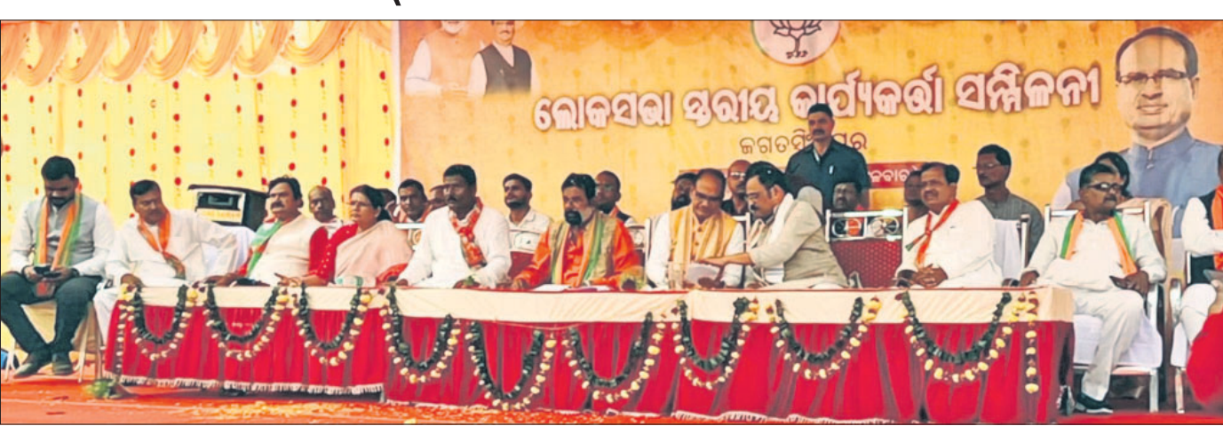
ଭାଜପା ବରିଷ୍ଠ ନେତା ତଥା ମଧ୍ୟପ୍ରଦେଶର ପୂର୍ବତନ ମୁଖ୍ୟମନ୍ତ୍ରୀ ଶିବରାଜ ସିଂ ରୌହାଙ୍କ ସମେତ ଦଳୀୟ ନେତୃତ୍ୱ।

କଂଗ୍ରେସ ସରକାର ଥିବା ସମୟରେ ହୋଇଥିବା ଲୋକାଭିଯୁକ୍ତି ଯୋଜନା ରାଜ୍ୟବାସୀଙ୍କ ପାଖରେ ପହଞ୍ଚାଇବାକୁ ଉଦ୍ୟମ କରାଯିବ।