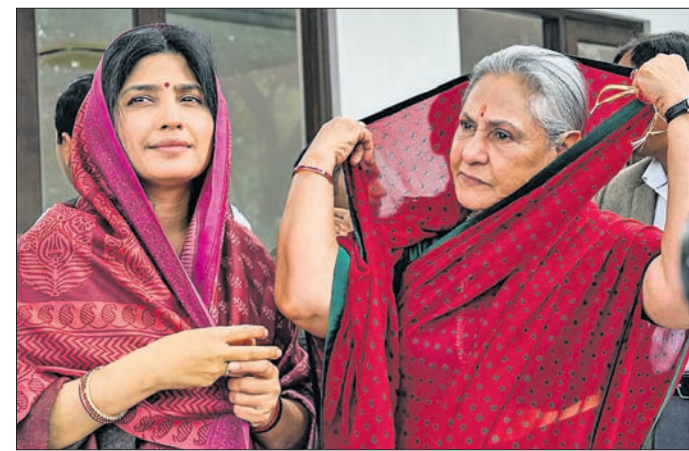
ଭବନ ପ୍ରଦେଶର ଜଗାଝାରେ ଭୁବେଶ୍ୱର ମହାଦେବ ମନ୍ଦିର ନିର୍ମାଣ ପାଇଁ ଲକ୍ଷ୍ମଣ୍ଡିତ ଦଳୀୟ ମୁଖ୍ୟମନ୍ତ୍ରୀ ସମ୍ମୁଖରେ ପହଞ୍ଚିଥିବା ମହାଶାଳିଗ୍ରାମ ଶିଳା ପୁନଃ ବେଳେ ସମାଜବାଦୀ ପାର୍ଟି ଏମ୍ପି ଡିମ୍ପଲ ଯାଦବଙ୍କ ସହ ଜୟା ବଜନ।

କୋରାପୁଟ ଲୋକସଭା ଆସନ ପାଇଁ ଏକାଧିକ ଆଶାୟୀ ଆବେଦନ କରିବାକୁ ନେଇ ପିପିସି ସାଧାରଣ ସମାବେଶ ଦ୍ୱାରା ପ୍ରସ୍ତାବ ଦିଆଯାଇଛି। କଂଗ୍ରେସର ନୀତି ଓ ଆଦର୍ଶ ପ୍ରକାରେ ବର୍ତ୍ତମାନ ଏମ୍ପି ଓ ବିଧାୟକ ଭାବେ ରହିଥିବା ପ୍ରାର୍ଥୀଙ୍କୁ ପୁଣି ଥରେ ଦଳ ରିପିଟ କରିବାକୁ କହିଛନ୍ତି।