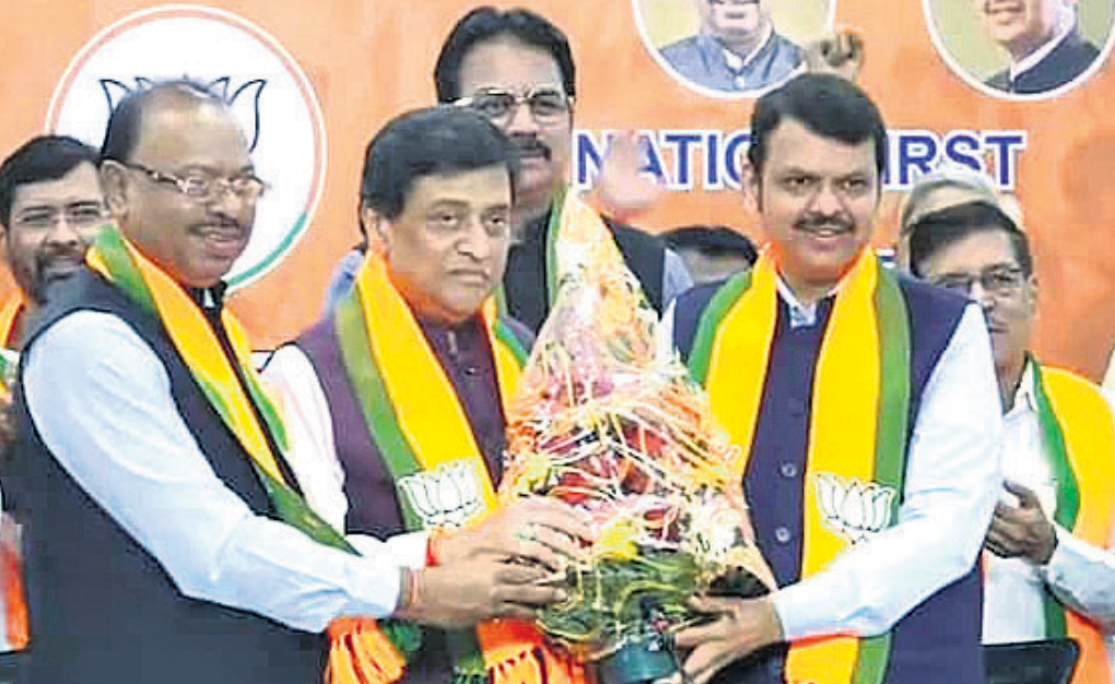
ମହାରାଷ୍ଟ୍ର ଉପମୁଖ୍ୟମନ୍ତ୍ରୀ ଦେବେନ୍ଦ୍ର ଫଡନବିସ୍ ଏବଂ ଅନ୍ୟ ବରିଷ୍ଠ ନେତାଙ୍କ ଉପସ୍ଥିତିରେ ଭାଜପାରେ ଯୋଗ ଦେଇ ଅଶୋକ ଚଉନ୍ଦ୍ର।

ବମେ ଉଚ୍ଚ ନ୍ୟାୟାଳୟଙ୍କ ରାୟ ତାଙ୍କ ସପକ୍ଷରେ ଯାଇଥିବା ଅଶୋକ କହିଛନ୍ତି। ସୋମବାର ସେ କଂଗ୍ରେସର ପ୍ରାଥମିକ ସଦସ୍ୟ ପଦକୁ ଇସ୍ତଫା ଦେଇଥିଲେ।