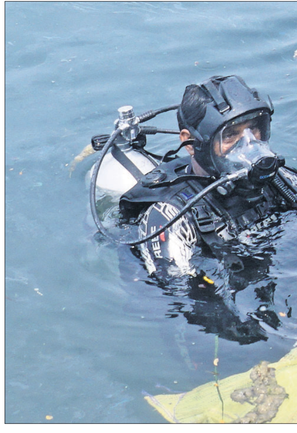
କଟକଠାରେ ମହାନଦୀ ପାଣିକୁ ଆବର୍ଜନା ମୁକ୍ତ କରିବାକୁ ଉତ୍ତରପ୍ରଦେଶ ରାଜ୍ୟ ବିପର୍ଯ୍ୟୟ ପରିଚାଳନା ଫୋର୍ସର କର୍ମଚାରୀମାନେ ସଫେଇ କାର୍ଯ୍ୟ କରୁଛନ୍ତି।