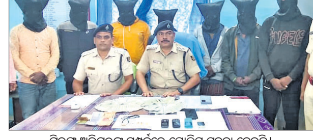
ଗିରଫ ଅଭିଯୁକ୍ତଙ୍କ ସମ୍ପର୍କରେ ପୋଲିସ୍ ସୂଚନା ଦେଇଛି।

ପାଟଣା, ୧୩।୨ (ବୀରକିଶୋର ଦାଶ) ପୋଲିସ୍ ଗିରଫ କରିବାକୁ ସଫଳ ହୋଇଛି। ଅଭିଯୁକ୍ତମାନେ ଗତ କେନ୍ଦୁଝର ଜିଲ୍ଲା ପାଟଣା ପୋଲିସ୍ ମଞ୍ଜୁଳକାର ୭ ଆନ୍ତଃ ଜିଲ୍ଲା ଲୁଚେରାକୁ ପାଟଣା, ବୁରୁମୁଣ୍ଡା, ଘଟଗାଁ ଓ ଚମ୍ପୁଆ ଥାନା ଅଞ୍ଚଳରେ ଗୋପି, ଛିନ୍ଦିଗାଠ ଓ ଲୁଚେରା ଆଦି ସ୍ଥଳ ସୃଷ୍ଟି କରିଥିଲେ। ସମସ୍ତେ କେନ୍ଦୁଝର ଶଙ୍କରପୁରରେ ଭଡ଼ା ଘରେ ରହୁଥିବା ଗ୍ରାମ୍ୟ ଯୋଗ୍ୟ ଥାନା ଯୋଗ୍ୟ ଥାନା ଲୁଚେରା ଥାନା ଯୋଗ୍ୟ ଥାନା କୋଟେବେଲ ସାହିର ଆଦେଲ ଏସ୍, ଭଞ୍ଜନଗର ଥାନା ଖାମ୍ବେଲି, କନ୍ଧାସାହିର ବିଜୟ ଦାସ, ଆଦା ଥାନା ଡିକୁଣ୍ଡି ଗ୍ରାମର ଆଉଲ ଆବା, ଯାକପୁର ଜିଲ୍ଲା ଯାକପୁର ଗୋଡ଼ ଥାନା ମଞ୍ଜୁଳକାର ଗ୍ରାମର ଆଉଲ ମାଲିଙ୍ଗା (ଆଶ୍ର ପ୍ରବେଶ ବିଶାଖାପାଟଣା ଜିଲ୍ଲା, ନରଖ ପାଟଣା ଗ୍ରାମରୁ ଆସି ଯାକପୁରରେ ଯୁକ୍ତମାଳ ଗାଁରେ ଅବସ୍ଥାନ କରୁଛନ୍ତି), ଯାକପୁରରେ ଥାନା ମୁଖ୍ୟମାଳ ଗ୍ରାମର ଆଉଲ ଶେଖର (୩୨)। ସମସ୍ତଙ୍କୁ ଖାଡ଼ଖଣ୍ଡର କୁସରଗୁଣ୍ଡି ଅଞ୍ଚଳ ଓ ଗଞ୍ଜାମ ଜିଲ୍ଲା ଆଦାରେ ଚଢ଼ାଉକରି