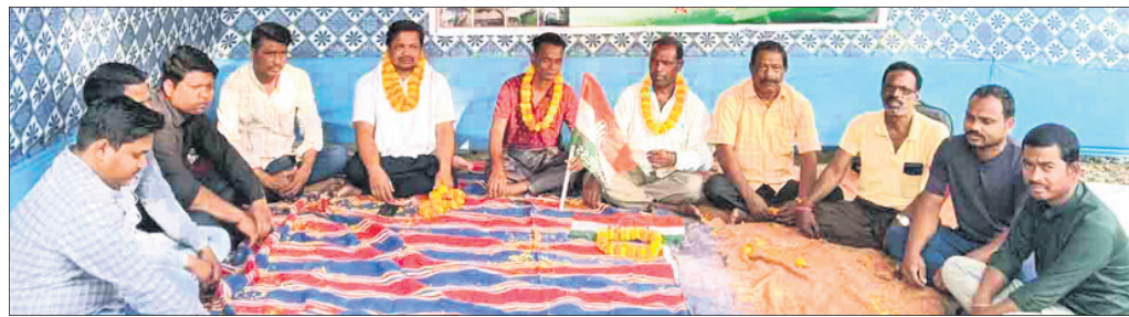
ଧାରଣାରେ ସାମିଲ ହୋଇଥିବା କଂଗ୍ରେସ ନେତାମାନେ ।

କୁଜଙ୍ଗ, ୧୩୧୨ (ମନୋଜ ପ୍ରଧାନ) ଜଙ୍ଗଲହାନୀ ଯୋଗୁ ବନ୍ୟପ୍ରାଣୀଙ୍କ ଜୀବନ ସଙ୍କଟରେ ପଡ଼ିଛି। ସେମାନଙ୍କର ସୁରକ୍ଷା ଦାରିରେ ମଙ୍ଗଳାକାର କୁଜଙ୍ଗ ବନ୍ୟପ୍ରାଣୀ କମିଟି ପକ୍ଷରୁ ଉପଯୋଗୀ ବ୍ୟବସ୍ଥା ଗ୍ରହଣ କରିବା ପାଇଁ ଉଦ୍ଦେଶ୍ୟ ରଖାଯାଇଛି। ଜଙ୍ଗଲହାନୀ ଯୋଗୁ ବନ୍ୟପ୍ରାଣୀଙ୍କ ଜୀବନ ସଙ୍କଟରେ ପଡ଼ିଛି। ସେମାନଙ୍କର ସୁରକ୍ଷା ଦାରିରେ ମଙ୍ଗଳାକାର କୁଜଙ୍ଗ ବନ୍ୟପ୍ରାଣୀ କମିଟି ପକ୍ଷରୁ ଉପଯୋଗୀ ବ୍ୟବସ୍ଥା ଗ୍ରହଣ କରିବା ପାଇଁ ଉଦ୍ଦେଶ୍ୟ ରଖାଯାଇଛି।