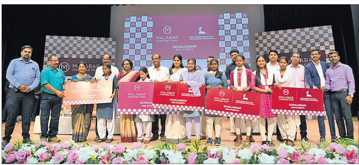
ମାଲାବାର ଚାରାବଲ୍ ଅଫିସ୍ ଆଇ.ଏ.ଏ.ଏ.ପି. ପକ୍ଷରୁ ଚାରାବଲ୍ ଫାଉଣ୍ଡେସନ୍ ଆଇ.ଏ.ଏ.ଏ.ପି. ପକ୍ଷରୁ ୨୮, ୨୮, ୦୦୦ ଟଙ୍କାର ସ୍ଟୁଡେଣ୍ଟସ୍କିପ୍ ବିତରଣ କରାଯାଇଛି।