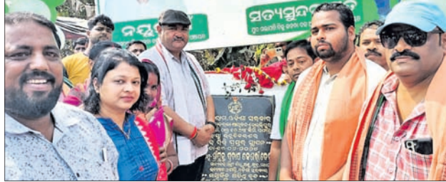
ମନ୍ତ୍ରୀ ପ୍ରତାପ କେଶରୀ ଦେବ ପ୍ରକଳ୍ପର ଶିଳାନ୍ୟାସ କରୁଛନ୍ତି ।

ଉତ୍ତରା ବୃଦ୍ଧି ମୁଖ୍ୟମନ୍ତ୍ରୀଙ୍କ ଏକ ଯୁଗାନ୍ତକାରୀ ପଦକ୍ଷେପ ଉପାଦାନ ଉପରେ କଂଗ୍ରେସର ଧାରଣା ଲାଗୁ କରାଯିବ। ଉପାଦାନ ଉପରେ କଂଗ୍ରେସର ଧାରଣା ଲାଗୁ କରାଯିବ।