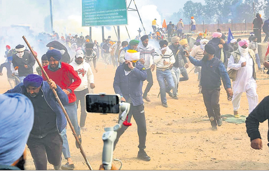
'ଦିଲ୍ଲୀ ଚଲୋ' ଶୋଭାଯାତ୍ରା ବେଳେ ଆମ୍ଭେ-ହରିୟାଣାର ସମୁଦାୟ ମଙ୍ଗଳବାର କଂଗ୍ରେସ୍ ଦଳର କର୍ମୀ ଉପସ୍ଥିତ ହୋଇଛନ୍ତି।

ଭୁବନେଶ୍ୱର, ୧୩/୨ (ଅନିଲ ଦାସ) ଘରୋଇ ବିଦ୍ୟୁତ୍ ଉପଭୋକ୍ତାଙ୍କ ପାଇଁ ଖୁସି ଖବର। ୨୦୨୪-୨୫ ଆର୍ଥିକ ବର୍ଷ ପାଇଁ କୌଣସି ବିଦ୍ୟୁତ୍ ଶୁଳ୍କ ବଦଳ ନାହିଁ। ଅନ୍ୟପକ୍ଷରେ ବିଦ୍ୟୁତ୍ ନିୟମକ ଆୟୋଗ (ଓଇଆର୍‌ସି) ଘରୋଇ ଉପଭୋକ୍ତାଙ୍କ ପାଇଁ ବିଦ୍ୟୁତ୍ ଦର ହ୍ରାସ କରିଛନ୍ତି। ଘରୋଇ ବିଦ୍ୟୁତ୍ ଉପଭୋକ୍ତାଙ୍କ ପାଇଁ ପ୍ରତ୍ୟେକ ୟୁନିଟ୍ ପାଇଁ ୧୦ ପଇସା ହ୍ରାସ ହୋଇଛି। ଘରୋଇ ବ୍ୟତୀତ ଅନ୍ୟ ସମସ୍ତ ବର୍ଗର ଉପଭୋକ୍ତାଙ୍କ ବିଦ୍ୟୁତ୍ ଦର ଅପରିବର୍ତ୍ତନ ରହିବ। ଦାରିଦ୍ର୍ୟ ସାମାଜିକ ଚଳେ (ଡିପିଏଲ୍) ଥିବା ଉପଭୋକ୍ତାଙ୍କୁ ମାସିକ ୩୦ ୟୁନିଟ୍ ପାଇଁ ୮୦ ଟଙ୍କା ଲେଖାଏଁ ଦେବାକୁ ପଡୁଥିଲା। ସେଥିରେ ୧୦ ଟଙ୍କା ହ୍ରାସ କରାଯାଇଛି। ଅର୍ଥାତ୍ ଏବେ ଡିପିଏଲ୍ ଉପଭୋକ୍ତାଙ୍କୁ ୮୦ ଟଙ୍କା ବଦଳରେ ୭୦ ଟଙ୍କା ଦେବାକୁ ପଡୁଛି। ଏହାଦ୍ୱାରା ଗରିବ ବିଦ୍ୟୁତ୍ ଉପଭୋକ୍ତାମାନେ ବିଶେଷ ଉପକୃତ ହେବେ। ଯେଉଁ ଉପଭୋକ୍ତାମାନେ କାର୍ଗି ବିଲ୍ ବଦଳରେ ଇ-ବିଲ୍