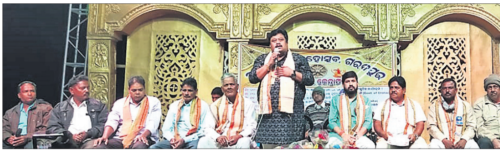
ମହୋତ୍ସବରେ ଯୋଗଦେଇଥିବା ଅତିଥିମାନେ ।

ପାଟକୁରା, ୧୩୨ (ରବୀନ୍ଦ୍ର ନାଥ ବାରିକ) ରଘୁବଳର ଉଦ୍ଦେଶ୍ୟକୁ ଉପସ୍ଥାପନ କରିବା ପାଇଁ ଉପାଦାନ ଉପରେ କଂଗ୍ରେସର ଧାରଣା ଲାଗୁ କରାଯିବ। ଉପାଦାନ ଉପରେ କଂଗ୍ରେସର ଧାରଣା ଲାଗୁ କରାଯିବ। ଉପାଦାନ ଉପରେ କଂଗ୍ରେସର ଧାରଣା ଲାଗୁ କରାଯିବ।