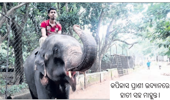
କପିଳାସ ପ୍ରାଣୀ ଉଦ୍ୟାନରେ ହାତୀ ସହ ମାହୁଡ଼ା ।

ଏବଂ ଆସାମରୁ ଚାଲିମପ୍ରାପ୍ତ ୫ଜଣ ମାହୁଡ଼ା ଅଛନ୍ତି । ତେବେ ଏହାର ବିକାଶ ପାଇଁ ପର୍ଯ୍ୟାପ୍ତ ଭିତ୍ତିଭୂମି ଥିଲେ ମଧ୍ୟ କେନ୍ଦ୍ର ଓ ରାଜ୍ୟ ସରକାର ଏବଂ ବନବିଭାଗ ସମେତ ରୁ ଅଧିକ ଅର୍ଥ ଲଞ୍ଚିଆର ଆବଶ୍ୟକତା ଅଭାବ ପରିଲକ୍ଷିତ ହେଉଛି । ଫଳରେ ଏହା ଯେତିକି ସଂଖ୍ୟକ ପର୍ଯ୍ୟଟକଙ୍କୁ ଆକର୍ଷିତ କରିବା କଥା ତାହା ଦେଖାଯାଉ ନାହିଁ । ସେହିପରି ପ୍ରତିବର୍ଷ ଅଧିକ ପ୍ରାଣୀଙ୍କୁ ଆଣିବା ପାଇଁ ବନବିଭାଗ ପକ୍ଷରୁ ପ୍ରସ୍ତାବ ଯାଉଥିଲେ ମଧ୍ୟ ଏ ସମ୍ପର୍କରେ ରାଜ୍ୟ ବନବିଭାଗ କର୍ତ୍ତୃପକ୍ଷ ଆବଶ୍ୟକତା ପ୍ରଦର୍ଶନ କରୁ ନ ଥିବା ଆଲୋଚନା ହେଉଛି । ଏଥିସହ ଜରୁରୀ ସମୟରେ ହାତୀ ଓ ଜୀବଜନ୍ତୁଙ୍କ ବିକାଶ ପାଇଁ ଜଣେ ଠିକା ପ୍ରାଣୀ ଚିକିତ୍ସକ ରହିଛନ୍ତି । ଚାଲିମପ୍ରାପ୍ତ କର୍ମଚାରୀ ମଧ୍ୟ ନାହାନ୍ତି । ଫଳରେ ଆବଶ୍ୟକତାକୁ ସାତକୋଟିଆ କିମ୍ବ ନନ୍ଦନବାନନର ଚିକିତ୍ସା ବିଶେଷଜ୍ଞଙ୍କ ଉପରେ ବନବିଭାଗ ନିର୍ଭର କରୁଛି । ଏ ସଂଜ୍ଞାକ୍ରମରେ କପିଳାସ ରେଞ୍ଜର ତରୁଣ କୁମାର