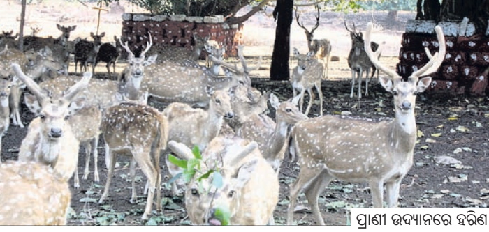
ପ୍ରାଣୀ ଉଦ୍ୟାନରେ ହରିଣା ।

ଦେଶାନ୍ତରୀଣ ଜିଲାର ପ୍ରସିଦ୍ଧ ପର୍ଯ୍ୟଟନସ୍ଥଳୀ କପିଳାସରେ ଥିବା ପ୍ରାଣୀ ଉଦ୍ୟାନ ୪୫ ବର୍ଷରେ ପଦାର୍ପଣ କରିଛି । ୧୯୭୯ ମସିହା ଜାନୁଆରୀ ୨୬ରେ ସମୁଦ୍ରତୀର କପିଳାସର ପାଦ ଦେଶରେ ୫ ହେକ୍ଟର ଜାଗାରେ ତିଆରି ପାର୍କରୁ ଏହି ପ୍ରାଣୀ ଉଦ୍ୟାନ ଆରମ୍ଭ ହୋଇଥିଲା । ଏହାପରେ ବେବୋଉର ବିଭାଗ ଏବଂ କପିଳାସ ସଂରକ୍ଷିତ ଜଙ୍ଗଲର କିଛି ଅଞ୍ଚଳକୁ ନେଇ ୨୭.୬୪ ହେକ୍ଟରକୁ ଏହା ସମ୍ପ୍ରସାରିତ ହୋଇଥିଲା । ୧୯୮୮ରେ ଏହା ମିଳି କୁ ଭାବେ ମାନ୍ୟତା ପାଇଥିଲା । ଏହି ପ୍ରାଣୀ ଉଦ୍ୟାନରେ ୨୪୭ଟି ଜୀବଜନ୍ତୁ ରହିଛନ୍ତି । ୨୦୦୯ ମସିହାରେ ଏହି ପ୍ରାଣୀ ଉଦ୍ୟାନ ପରିସରରେ ଏକ ହାତୀ ଉଦ୍ଭାର କେନ୍ଦ୍ର ପ୍ରତିଷ୍ଠା ହୋଇଥିଲା । ଦେଶାନ୍ତରୀଣ ସମେତ ବିଭିନ୍ନ ଜିଲାରୁ ଉଦ୍ଭାର ହାତୀଗୁଣ୍ଡା ଓ ଉପଭବ କରୁଥିବା ହାତୀଙ୍କୁ ଆଣି