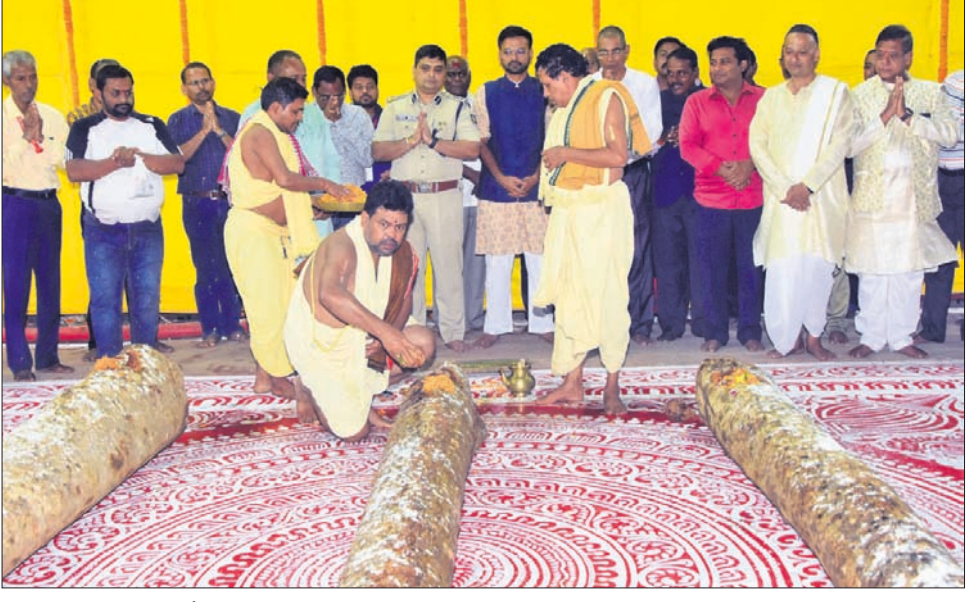
ଶ୍ରୀମନ୍ଦିର ପ୍ରଶାସନ କାର୍ଯ୍ୟାଳୟ ସମ୍ମୁଖରେ ରଥକାଠ ଅନୁକୂଳ କରାଯାଉଛି।

ଆଦ୍ୟ ଲୁଚାଳ ୭ରେ ମହାପ୍ରଭୁ ଶ୍ରୀଜଗନ୍ନାଥଙ୍କ ବିଷୁବସାଧନା ଯାତ୍ରା... ଘୋଷଯାତ୍ରାର ଆଦ୍ୟପର୍ବ ବସନ୍ତ ପଞ୍ଚମୀ ବା ଦରବସ୍ତା ପୂଜାଠାରୁ ଆରମ୍ଭ ହୋଇଛି।