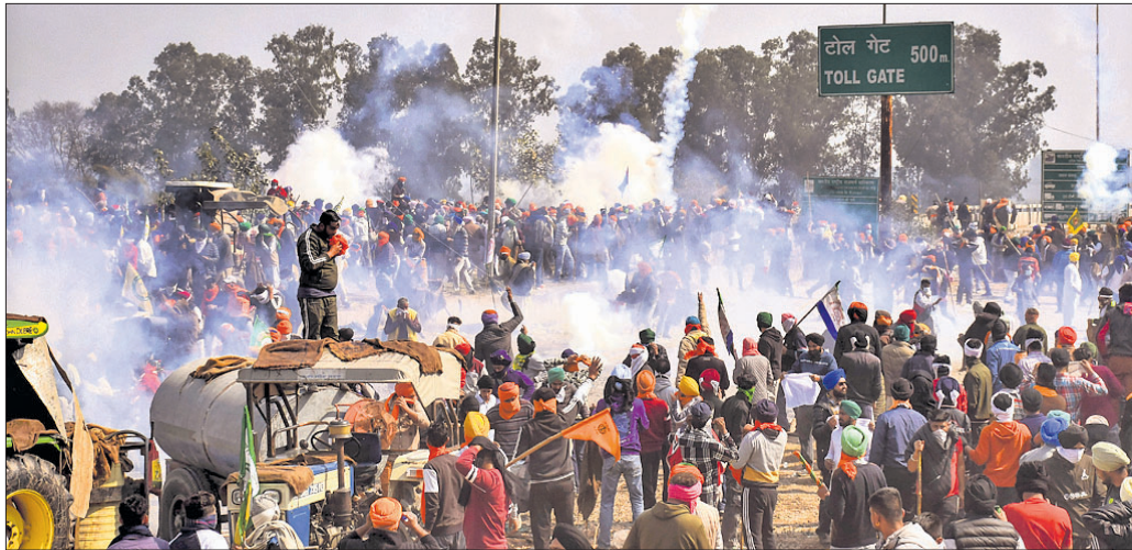
ଦିଲ୍ଲୀ ଅନ୍ତର୍ଗଞ୍ଜ୍ୟ ଯାତ୍ରାରେ ଚାଷୀମାନଙ୍କ ଉପରେ ପଞ୍ଜାବ-ହରିୟାଣା ଶମ୍ଭୁ ସାମାଜିକ ପଟିଆଲା ପୋଲିସ୍ କୁହୁହୁଆ ବାଣ୍ଟି ପ୍ରୟୋଗ କରିଛି।

କେନ୍ଦ୍ରୀୟ ମାଧ୍ୟମିକ ଶିକ୍ଷା ବୋର୍ଡ (ସିବିଏସ୍)ର ବୋର୍ଡ ପରାସ୍ତା ଗୁଜରାଟ ଆରମ୍ଭ ହେବ। ଦଶମ ବୋର୍ଡ ମାର୍ଚ୍ଚ ୧୩ ପର୍ଯ୍ୟନ୍ତ ଚାଲିବାକୁ ଥିବାବେଳେ ଦ୍ୱାଦଶ ଶ୍ରେଣୀ ବୋର୍ଡ ପରାସ୍ତା ଏପ୍ରିଲ ୨ରେ ଶେଷ ହେବ।