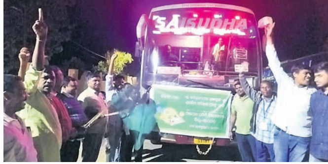
ବସ୍ତୁ ଅତିଥ୍ୟମାନେ ପତାକା ଦେଖାଇ ଯାତ୍ରାର ଶୁଭାରମ୍ଭ କରୁଛନ୍ତି ।