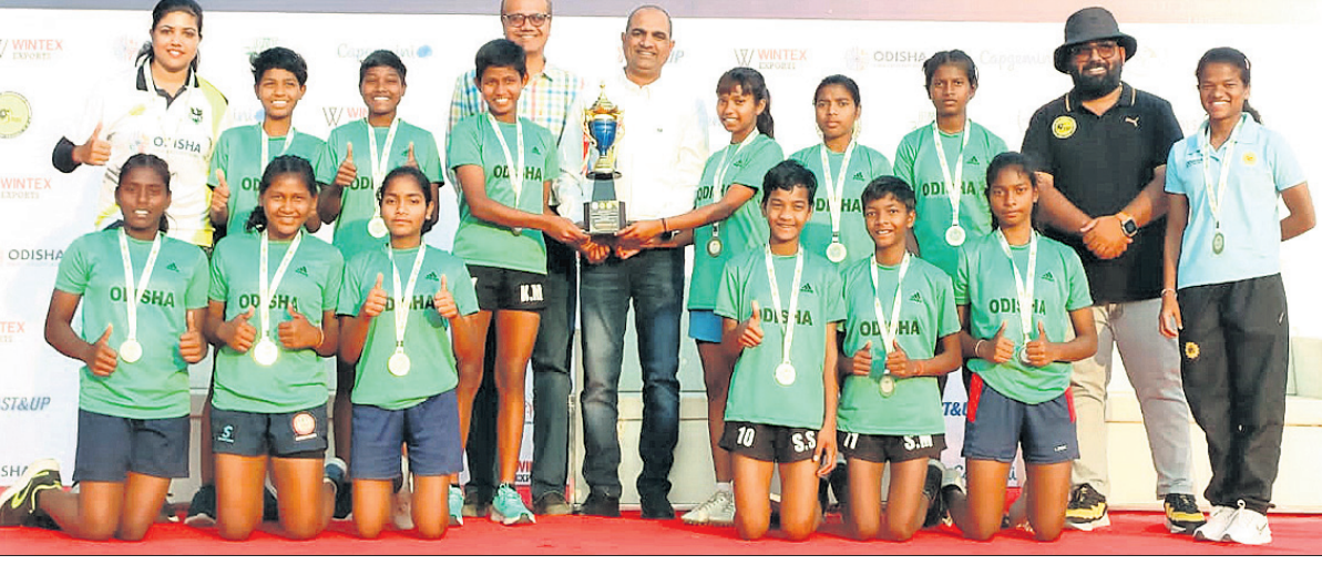
ଅତିଥିଙ୍କଠାରୁ ପୁରସ୍କାର ଗ୍ରହଣ ଅବସରରେ ଓଡ଼ିଶା ବାଲିକା ରଙ୍ଗୀ ଦଳ।