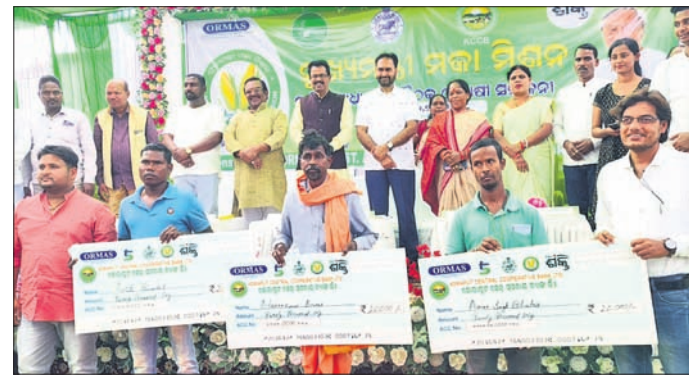
ଅତିଥିକ ଗହଣରେ ସହାୟତା ପାଇଥିବା ମକା ଚାଷୀ ।

ପୁଖ୍ୟମନ୍ତ୍ରୀ ମକା ମିଶନର ଆଭିମୁଖ୍ୟ, ସଙ୍ଗଠନ ବାୟୁ, ପରିଚାଳିତ ଏବଂ ଚାଷୀଙ୍କ ହିତ ପାଇଁ ସରକାର