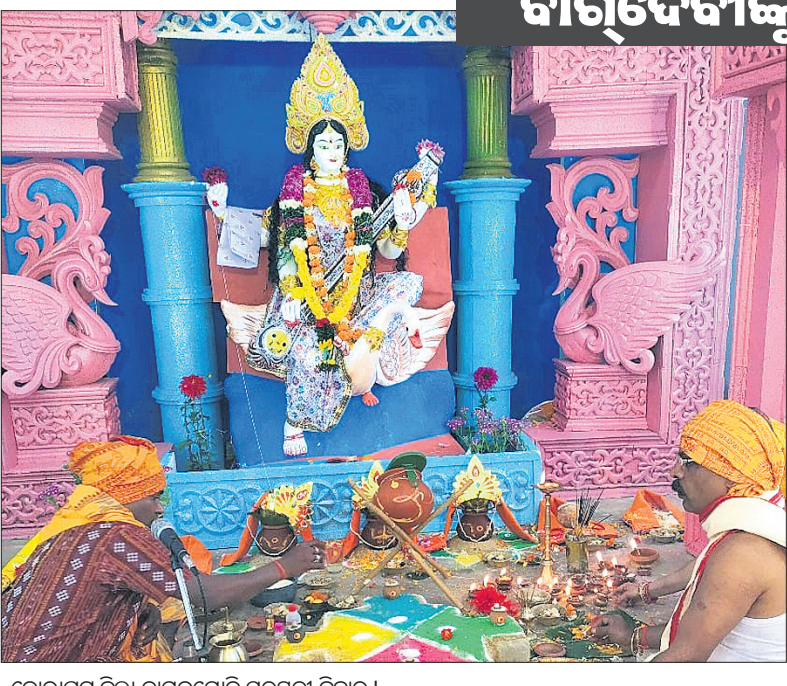
କୋରାପୁଟ ଜିଲା ଦାମନଯୋଡ଼ି ସରସ୍ୱତୀ ବିହାର ।