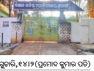
ଗୁଡ଼ାରି, ୧୪ 19 (ପ୍ରମୋଦ କୁମାର ପତି)

କୌଣସି ବିଭାଗରେ ସ୍ତାୟୀ ଅଧ୍ୟାପକ କିମ୍ବା ସ୍ତାୟୀ ଅଧ୍ୟାପକ ନ ଥିବାରୁ କଲେଜରେ ପୂଜାର ଆୟୋଜନ କରାଯାଇ ନ ଥିଲା । ଦୀର୍ଘ ୪୦ ବର୍ଷର କଲେଜରେ ପ୍ରଥମ ଥର ପାଇଁ ସରସ୍ୱତୀ ପୂଜା ପାଳନ ହୋଇ ନ ଥିବା ଯୋଗୁଁ ଛାତ୍ରାଛାତ୍ରୀ ଏବଂ ଅଭିଭାବକ ମହଲରେ ଅସନ୍ତୋଷ ପ୍ରକାଶ ପାଇଛି । ସରକାର ଏହି କଲେଜର ରୂପାନ୍ତରଣ କରିଥିବା ବେଳେ ଏହି କଲେଜରେ କଲେ ହେଲେ ସ୍ତାୟୀ ଅଧ୍ୟାପକ ନ ଥିବାରୁ ଗୋଷ୍ଠି ଅଧ୍ୟାପକ, ଅଧ୍ୟାପିକାରେ ଚାଲିଛି ଶିକ୍ଷାଦାନ । ତେଣୁ ଉଚ୍ଚ ଶିକ୍ଷା ବିଭାଗ ଏ ସମ୍ପର୍କରେ ଦୃଷ୍ଟି ଦେବା ସହ ସ୍ତାୟୀ ଅଧ୍ୟାପକ ନିଯୁକ୍ତି ପାଇଁ ଦାବି ହୋଇଛି ।