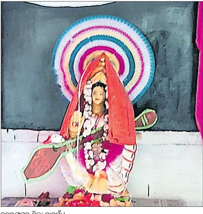
ନବରଙ୍ଗପୁର ଜିଲା ତାକୁରାଁ ।