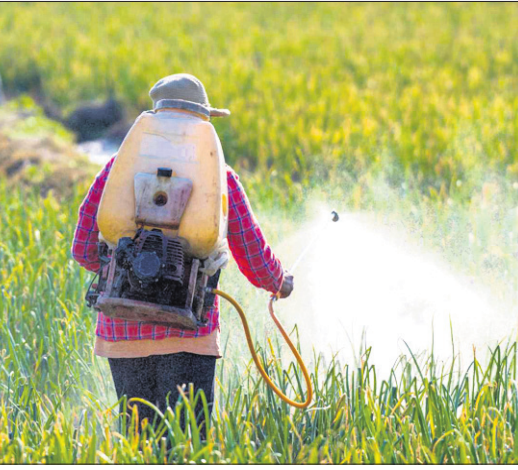
ହୋଇପାରୁଛି, ତଥାପି ଚାଷ ପାଇଁ ଆବଶ୍ୟକ ସଂସାଧନ ଏବଂ ବଜାରଗୁଡ଼ିକ ଉପଲବ୍ଧ ହେଉନାହିଁ। ଫଳସ୍ୱରୂପ କୃଷକଙ୍କ ଲାଭ କମ୍ ଦେଖି ହେଉଛି ଏବଂ କୃଷି ଅସମର୍ଥତା ବୃଦ୍ଧିପାଇଛି। ଏହି ଆହ୍ୱାନଗୁଡ଼ିକ ବିପଜ୍ଜନକ ନ ଥିଲେ ମଧ୍ୟ ବିଶେଷଜ୍ଞମାନେ ଅଧିକ ଅମଳକମ୍ପନ ଫସଲରେ ରହୁଥିବା ପୋଷକ ତତ୍ତ୍ୱର ଅବନତି ବିଶୟକୁ ନେଇ ଏବେ ଅଧିକ ଚିନ୍ତିତ। ଉଦାହରଣସ୍ୱରୂପ, ନିକଟରେ କରାଯାଇଥିବା ଏକ

ବିଶ୍ୱରେ ୩,୯୦,୦୦୦ରୁ ଅଧିକ ପ୍ରଜାତିର ଉଦ୍ଭିଦ ଠାବ କରାଯାଇଛି। ସେଗୁଡ଼ିକ ମଧ୍ୟରୁ କେବଳ ୩ଟି ମିଥ୍ୟା ଧାନ, ମକା ଓ ଗହମ ଆମ ଖାଦ୍ୟରେ ରହୁଥିବା ଉଦ୍ଭିଦଭିତ୍ତିକ କ୍ୟାଲୋରିର ପ୍ରାୟ ୬୦ ପ୍ରତିଶତ ଭାଗ କରେ। ଏହି ତିନୋଟି ଶସ୍ୟର ପ୍ରାଧାନ୍ୟ ମୁଖ୍ୟତଃ ପ୍ରମୁଖ ପ୍ରଯୁକ୍ତିଗତ ପ୍ରଗତି ଯୋଗୁ ସମ୍ଭବ ହୋଇପାରିଛି। ବିଶେଷକରି ୧୯୬୦ ଦଶକର ସବୁଜ ବିପ୍ଳବ ସମୟରେ ଅଧିକ ଅମଳକମ୍ପନ କିସମ (ଏର୍ଥୋଜିଭି)ର ଧାନ ଓ ଗହମ ବିକଶିତ କରାଯାଇଥିଲା ଏବଂ ଏଥିରୁ ବିପ୍ଳବ ଲାଭ ମିଳିଛି। ଏହା ମୁଖ୍ୟତଃ ଖାଦ୍ୟ ଉତ୍ପାଦନକୁ ଯଥେଷ୍ଟ ବୃଦ୍ଧି କରିଛି ଏବଂ ଅନେକ ଶହ କୋଟି ଲୋକଙ୍କୁ ଖୁସୀକରଣ କରିପାରିଛି। ଉଲ୍ଲେଖଯୋଗ୍ୟ, ଏର୍ଥୋଜିଭି ବିହୀନଗୁଡ଼ିକ ଯୋଗୁ ଉତ୍ପାଦନ ବୃଦ୍ଧି ହୋଇଛି ସତ, କିନ୍ତୁ ଗାଈ ପ୍ରକ୍ରିୟାକୁ ଦେଖିଲେ ଏହା ଅନ୍ୟ ସମସ୍ୟାକୁ ସୃଷ୍ଟି କରିଛି। ଉଲ୍ଲେଖନୀୟ ଯେ, ଅଧିକ ଅମଳକମ୍ପନ ବିହୀନ ଉତ୍ପାଦନ କଳସେଚନ ଉପଲବ୍ଧତା ଏବଂ ବିଭିନ୍ନ ରାସାୟନିକ ପଦାର୍ଥ ବିଶେଷକରି ସାର ଏବଂ କୀଟନାଶକ ପ୍ରୟୋଗ ଉପରେ ଦେଖି ନିର୍ଭର କରେ। ଫଳସ୍ୱରୂପ ଏର୍ଥୋଜିଭି ବିହୀନରେ ଚାଷ କରିବା ଦ୍ୱାରା କେମାଳ କଳସେଚନର ଅତ୍ୟଧିକ ବ୍ୟବହାର କରିବାକୁ ପଡ଼ୁଛି। ଏପରିକି ଅଧିକ ଅମଳକମ୍ପନ ବିହୀନ ପାଇଁ ଅର୍ଥଶ୍ରେଣୀ ଅଞ୍ଚଳରେ କୃଷକମାନେ ଭୂତଳ କଳସେଚନ ଉପରେ ନିର୍ଭର କରିବାକୁ ବାଧ୍ୟ ହେଉଛନ୍ତି। ସେହିଭଳି ପାରମ୍ପରିକ ବିହୀନ ବଦଳରେ ଏର୍ଥୋଜିଭି ଭିତ୍ତିକ କୃଷି ଦ୍ୱାରା ଯତ୍ନସାରକାର ଆଧାରିତ ସାର ପ୍ରୟୋଗ ଅତ୍ୟଧିକ ବୃଦ୍ଧିପାଇଛି। ଏର୍ଥୋଜିଭି ବିହୀନରେ ଚାଷ କଲେ ସେଥିରେ ରୋଗପୋକର ଅଧିକ ବିପଦ ରହିଛି। ସେହି ସବୁ ବିହୀନକୁ ନେଇ ଏକ ଚାଷ (ଏକାଦେକକେ ଜମିରେ ଗୋଟିଏ ପ୍ରକାର ଚାଷ) କରିବାର ଅଭାବ କାରଣରୁ ବାରମ୍ବାର ରୋଗ ପୋକ ସଂକ୍ରମଣ ହେବା ଦେଖାଯାଏ ଓ ତାହା ଏବେ