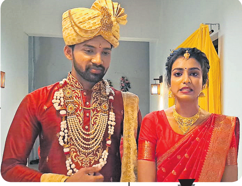
ଜା ସାଥକ ଚ୍ୟାନେଲରେ ପ୍ରସାରିତ ନୂଆ ଧାରାବାହିକ ‘ମଧୁର ସଂସାର’ର ଏକ ଦୃଶ୍ୟ

ନୂଆ ବର୍ଷରେ ଅନ୍ୟତମ ଲୋକପ୍ରିୟ ଚ୍ୟାନେଲ ଜା ସାଥକରେ ଆରମ୍ଭ ହୋଇଥିବା ମେଗା ଧାରାବାହିକ ‘ମଧୁର ସଂସାର’ ଦର୍ଶକଙ୍କ ମନକୁ ଛୁଇଁବାରେ ସଫଳ ହୋଇଛି। କାହାଣୀ ଅନୁସାରେ ମଧୁ ଜଣେ ସରଳ, ଅତିରିକ୍ତ ଏବଂ ଖୋଲା ମନୋଭାବର ଝିଅ। ମାନସ ଜଣେ ସାଧାସିଧା ଓଡ଼ିଆ ବ୍ୟକ୍ତି। କାହାଣୀଟି ଆଗକୁ ବଢୁଥିବାରୁ ମଧୁ ଏବଂ ମାନସ ପରସ୍ପରକୁ ବିବାହ କରିବାକୁ ପ୍ରସ୍ତୁତ ହୋଇଛନ୍ତି। ମାନସଙ୍କ ମାଆ ସୁଲୋଖ୍ୟା କିନ୍ତୁ ଏଥିରେ ରାଜି ନୁହନ୍ତି। ତେବେ ମାନସଙ୍କ ପରିବାରର ସମସ୍ତ ଚିନ୍ତା-ମଧୁର ପାର୍ଥକ୍ୟକୁ ଏଡ଼ାଇ ମଧୁ ନିଜର ସଂସାର ଗଢ଼ିବାକୁ ସମର୍ଥ ହେବେ କି ? ମାନସ ଓ ମଧୁର ସମ୍ପର୍କ ପ୍ରକୃତରେ ମାନସଙ୍କ ପରିବାରକୁ ଏକ ରଖିପାରିବାକୁ ସକ୍ଷମ ହେବ କି ? ଏମିତି ବହୁ ପ୍ରଶ୍ନର ଉତ୍ତର ରହିଛି ବର୍ତ୍ତମାନ ଏହି ଚ୍ୟାନେଲରେ ପ୍ରସାରିତ ହେଉଥିବା ମେଗା ଧାରାବାହିକ ‘ମଧୁର ସଂସାର’ରେ।