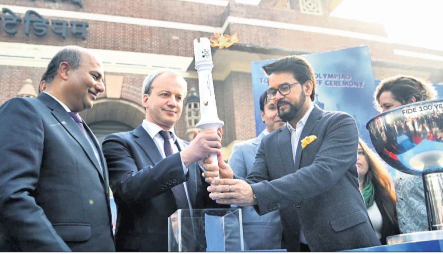
କ୍ରେମ୍ କ୍ରୀଡ଼ାମନ୍ତ୍ରୀ ଅନୁରାଗ ଠାକୁର ପିତେ ସଭାପତି ଆର୍କାତି ଡୋକୌଭିଚ୍‌କ୍ ମଶାଲ ହସ୍ତାନ୍ତର କରୁଛନ୍ତି।

କରିଥିଲା। ଚେସ୍ ଟୁର୍ନାମେଣ୍ଟରେ ଖେଳ ହୋଇଥିବା ବେଳେ ସମଗ୍ର ବିଶ୍ୱକୁ ଏହା ଭାରତର ଦାନ ବୋଲି କହିଥିଲେ କ୍ରୀଡ଼ାମନ୍ତ୍ରୀ ଅନୁରାଗ ଠାକୁର। ଏହା କେବଳ ଏକ ଖେଳ ଟୁର୍ଣ୍ଣ ବରଂ ଏହା ଆଧ୍ୟାତ୍ମିକ ଓ ଯୋଜନ ଆବଶ୍ୟକ କରିଥାଏ ବୋଲି ଠାକୁର କହିଥିଲେ। ଭାରତୀୟ ଗ୍ରାଣ୍ଡମାଷ୍ଟର ବିଶ୍ୱନାଥନ ଆନନ୍ଦ ଓ ହଜେରୀଆନ୍ ଗ୍ରାଣ୍ଡମାଷ୍ଟର କୁଚିତ ପୋଲଗାର ମଧ୍ୟ ଏହି କାର୍ଯ୍ୟକ୍ରମରେ ଉପସ୍ଥିତ ଥିଲେ।