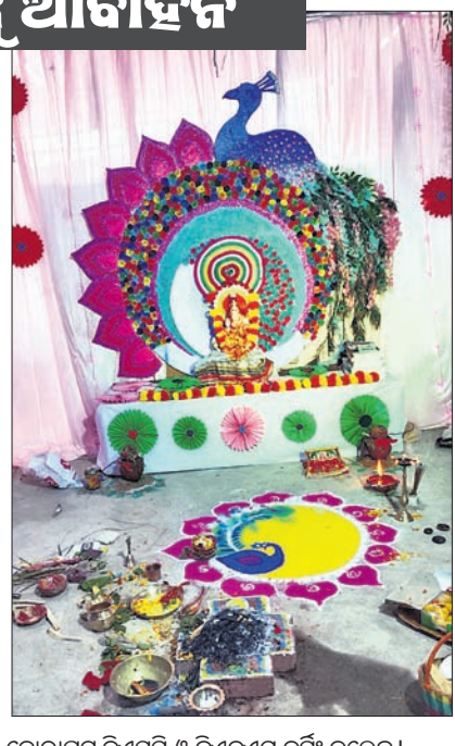
କୋରାପୁଟ ବିଏସ୍‌ସି ଓ ଜିଏନ୍‌ଏମ୍ ନର୍ସି କଲେଜ ।