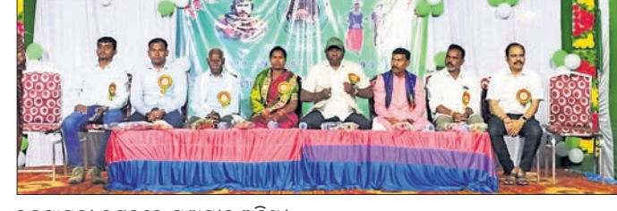
ଉଦ୍‌ଯାପନା ଉତ୍ସବରେ ମଞ୍ଚାସୀନ ଅତିଥି ।