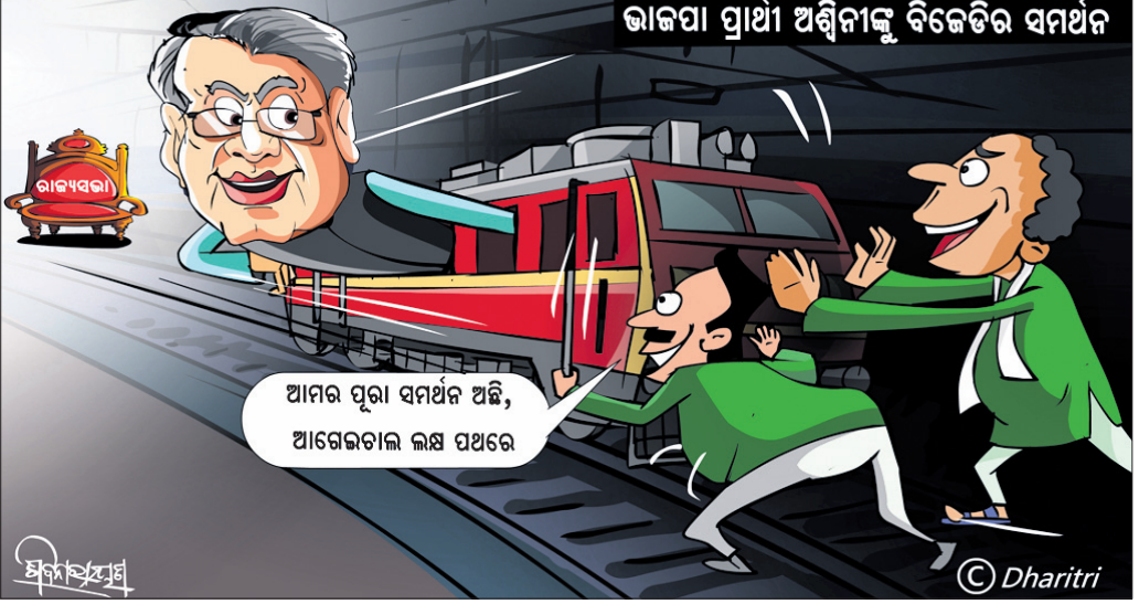
ଭାବପା ପ୍ରାଣୀ ଅଶ୍ୱିନୀଙ୍କୁ ବିଜେଡିର ସମର୍ଥନ