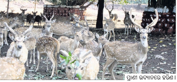
ପ୍ରାଣୀ ଉଦ୍ୟାନରେ ହରିଣା ।

ଦେଶାନ୍ତରୀଣ ଜିଲାର ପ୍ରସିଦ୍ଧ ପର୍ଯ୍ୟଟନସ୍ଥଳୀ କପିଳାସରେ ଥିବା ପ୍ରାଣୀ ଉଦ୍ୟାନ ୪୫ ବର୍ଷରେ ପଦାର୍ପଣ କରିଛି । ୧୯୭୯ ମସିହା ଜାନୁଆରୀ ୨୬ରେ ସମୁଦ୍ରତୀର କପିଳାସର ପାଦ ଦେଶରେ ୫ ହେକ୍ଟର ଜାଗାରେ ଡିଅର ପାର୍କରୁ ଏହି ପ୍ରାଣୀ ଉଦ୍ୟାନ ଆରମ୍ଭ ହୋଇଥିଲା । ଏହାପରେ ବେବୋଉର ବିଭାଗ ଏବଂ କପିଳାସ ସଂରକ୍ଷିତ ଜଙ୍ଗଲର କିଛି ଅଞ୍ଚଳକୁ ନେଇ ୨୭.୬୪ ହେକ୍ଟରକୁ ଏହା ସମ୍ପ୍ରସାରିତ ହୋଇଥିଲା । ୧ ଏପ୍ରିଲ ୧୯୮୬ରେ ଏହା ମିଳି କୁ ଭାବେ ମାନ୍ୟତା ପାଇଥିଲା । ଏହି ପ୍ରାଣୀ ଉଦ୍ୟାନରେ ୨୪୭ଟି ଜୀବଜନ୍ତୁ ରହିଛନ୍ତି । ୨୦୦୯ ମସିହାରେ ଏହି ପ୍ରାଣୀ ଉଦ୍ୟାନ ପରିସରରେ ଏକ ହାତୀ ଉଦ୍ଭାର କେନ୍ଦ୍ର ପ୍ରତିଷ୍ଠା ହୋଇଥିଲା । ଦେଶାନ୍ତରୀଣ ସମେତ ବିଭିନ୍ନ ଜିଲାରୁ ଉଦ୍ଭାର ହାତୀଙ୍କୁ ଆଣି ଓ ଉପଦ୍ରବ କରୁଥିବା ହାତୀଙ୍କୁ ଆଣି