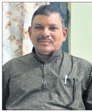
ଛେଡ଼ିପଦା, ୧୫୧୨