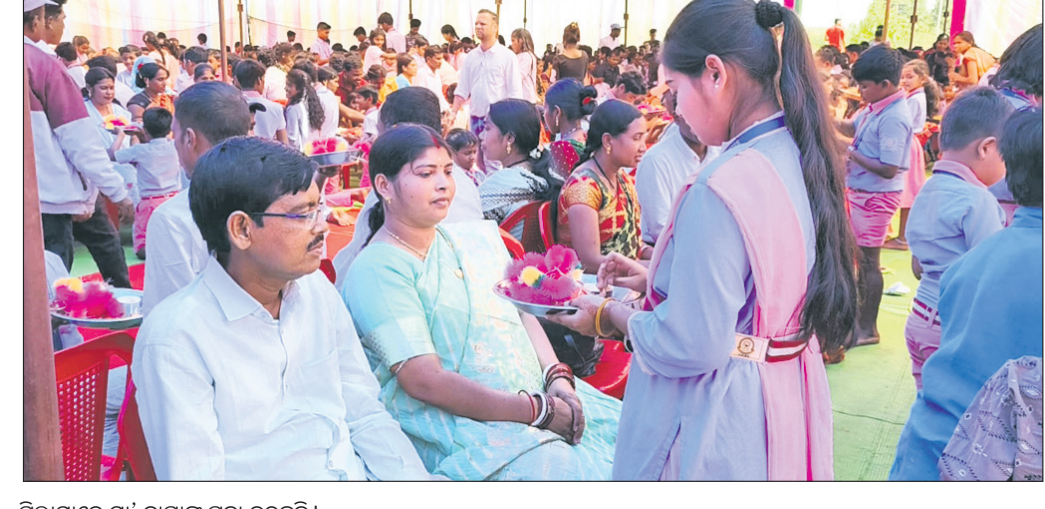
ପିଲାମାନେ ମା' ବାପାଙ୍କୁ ପୂଜା କରୁଛନ୍ତି ।

ଉତ୍ତରକୋଟ, ୧୪୧୨ (ସବାଶିବ ଶତପଥୀ) ନବରଙ୍ଗପୁର ଜିଲା ଉତ୍ତରକୋଟ ବ୍ଲକ୍