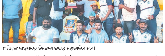
ଅତିଥିଙ୍କ ସମ୍ମୁଖରେ ବିଜେତା ଦଳର ଖେଳାଳିମାନେ ।

ଚାରିଗତି ସଞ୍ଜାୟ ମାଝି ସ୍ମାରକୀ କ୍ରିକେଟ ଟୁର୍ନାମେଣ୍ଟ