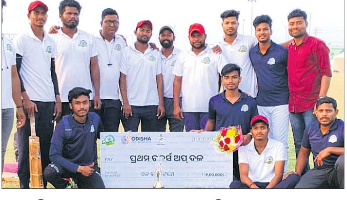
ନୟାଗଡ଼ ଟିମକୁ ୧ ଲକ୍ଷ ଟଙ୍କାର ଟେକ ପ୍ରଦାନ କରାଯାଇଛି ।

ନୟାଗଡ଼, ୧୪/୧ (ଲୋକନାଥ ମିଶ୍ର) : ପୁରୀର ଶାନ୍ତନାଥ କ୍ରିକେଟ ସ୍ଥାଡ଼ିୟମରେ ନୂଆ-ଓ ଯୋଜନାରେ ଆସନ୍ତା ୧୫ରୁ ୧୮ ତାରିଖ ପର୍ଯ୍ୟନ୍ତ ପ୍ରତିଦିନ ସନ୍ଧ୍ୟାରେ ବିଭିନ୍ନ ସାଂସ୍କୃତିକ କାର୍ଯ୍ୟକ୍ରମ ହେବ ବୋଲି ସୂଚନା ମିଳିଛି ।