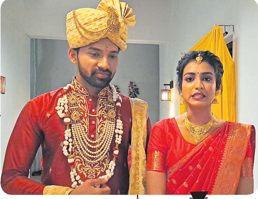
ଜା ସାଥିକ ଚ୍ୟାନେଲରେ ପ୍ରସାରିତ ନୂଆ ଧାରାବାହିକ ‘ମଧୁର ସଂସାର’ର ଏକ ଦୃଶ୍ୟ

ନୂଆ ବର୍ଷରେ ଅନ୍ୟତମ ଲୋକପ୍ରିୟ ଚ୍ୟାନେଲ ଜା ସାଥିକରେ ଆରମ୍ଭ ହୋଇଥିବା ମେଗା ଧାରାବାହିକ ‘ମଧୁର ସଂସାର’ ଦର୍ଶକଙ୍କ ମନକୁ ଛୁଇଁବାରେ ସଫଳ ହୋଇଛି। କାହାଣୀ ଅନୁସାରେ ମଧୁ ଜଣେ ସରଳ, ଅତିରିକ୍ତ ଏବଂ ଖୋଲା ମନୋଭାବର ଝିଅ। ମାନସ ଜଣେ ସାଧାସିଧା ଓଡ଼ିଆ ବ୍ୟକ୍ତି। କାହାଣୀଟି ଆଗକୁ ବଢୁଥିବାକୁ ମଧୁ ଏବଂ ମାନସ ପରସ୍ପରକୁ ବିବାହ କରିବାକୁ ପ୍ରସ୍ତୁତ ହୋଇଛନ୍ତି। ମାନସଙ୍କ ମାଆ ସୁଲୋଖା କିନ୍ତୁ ଏଥିରେ ରାଜି ନୁହନ୍ତି। ତେବେ ମାନସଙ୍କ ପରିବାରର ସମସ୍ତ ଚିନ୍ତା-ମଧୁର ପାର୍ଥକ୍ୟକୁ ଏଡ଼ାଇ ମଧୁ ନିଜର ସଂସାର ଗଢ଼ିବାକୁ ସମର୍ଥ ହେବେ କି ? ମାନସ ଓ ମଧୁର ସମ୍ପର୍କ ପ୍ରକୃତରେ ମାନସଙ୍କ ପରିବାରକୁ ଏକ ରଖିପାରିବାକୁ ସକ୍ଷମ ହେବ କି ? ଏମିତି ବହୁ ପ୍ରଶ୍ନର ଉତ୍ତର ରହିଛି ବର୍ତ୍ତମାନ ଏହି ଚ୍ୟାନେଲରେ ପ୍ରସାରିତ ହେଉଥିବା ମେଗା ଧାରାବାହିକ ‘ମଧୁର ସଂସାର’ରେ।