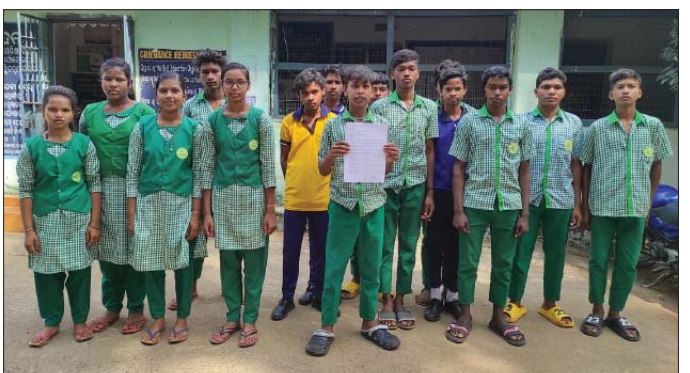
ଛାତ୍ରାଛାତ୍ରୀମାନେ ବିଲ୍‌ଓଙ୍କୁ ଅଭିଯୋଗ ପତ୍ର ପ୍ରଦାନ କରିବାକୁ ଆସିଛନ୍ତି।

ପରୀକ୍ଷା କେନ୍ଦ୍ର ପରିବର୍ତ୍ତନ ପାଇଁ ଖଜୁରିପଡ଼ା ଗୋଷ୍ଠୀ ଶିକ୍ଷା ବିଭାଗ ଅଧୀନ ଆଡାସିପତା ପଞ୍ଚାୟତ ସରକାରୀ ଉଚ୍ଚ ବିଦ୍ୟାଳୟର ଛାତ୍ରାଛାତ୍ରୀ ଜିଲ୍ଲା ଶିକ୍ଷା ଅଧିକାରୀଙ୍କୁ ଏକ ଅଭିଯୋଗପତ୍ର ଦାଖଲ କରିଛନ୍ତି।