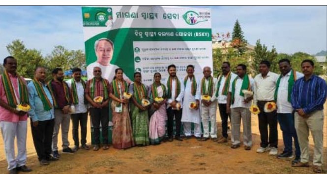
ସାକ୍ଷ୍ୟ ଶିବିରରେ ଉପସ୍ଥିତ ଅତିଥି।