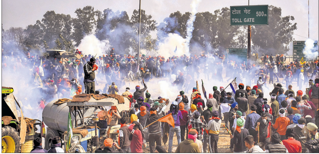
ଦିଲ୍ଲୀ ଅଜମୁଖେ ଯାଉଥିବା ଚାଷୀମାନଙ୍କ ଉପରେ ପଞ୍ଜାବ-ହରିୟାଣା ଶମ୍ଭୁ ସାମାଜିକ ପଟିଆଲା ପୋଲିସ୍ କୁହୁହୁଆ ବାସ୍ତୁ ପ୍ରୟୋଗ କରିଛି।

କେନ୍ଦ୍ରୀୟ ମାଧ୍ୟମିକ ଶିକ୍ଷା ବୋର୍ଡ (ସିବିଏସ୍)ର ବୋର୍ଡ ପରାସ୍ତା ଗୁଜରାଟ ଆରମ୍ଭ ହେବ। ଦଶମ ବୋର୍ଡ ମାର୍ଚ୍ଚ ୧୩ ପର୍ଯ୍ୟନ୍ତ ଚାଲିବାକୁ ଥିବାବେଳେ ଦ୍ୱାଦଶ ଶ୍ରେଣୀ ବୋର୍ଡ ପରାସ୍ତା ଏପ୍ରିଲ ୨ରେ ଶେଷ ହେବ।