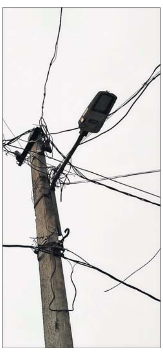
ପାଉ ନାହାନ୍ତି । କିଛି ଦିନ ଆମ ଗାଁ ଦାଣ୍ଡ ଆଲୋକ ହେଲା । ଏବେ କିଛି ଅନ୍ଧାରରେ

ପଞ୍ଚାୟତ ରହିଛି । ପ୍ରତି ପଞ୍ଚାୟତରେ ୪୦ ଟି ଲୋଡ଼ିଏ ଏପରି ୧୯୪ ପଞ୍ଚାୟତରେ ୭ ହଜାର ୬୦୦ ଟ୍ରାନ୍ସ ଲାଇଟ୍ ଲାଗିଥିଲା । ସ୍ତ୍ରୀ ଲାଇଟ୍ ପାଇଁ ଗୋଟିଏ ପଞ୍ଚାୟତ ପିଛା ୨ ଲକ୍ଷ ୬୦ ହଜାର ଟଙ୍କା ଲୁକ୍କାୟିତ ହୋଇଛି । ଏହି ଲାଇଟ୍ ବିଜିନି ଗାଁ ଦାଣ୍ଡ ଏବେ ଅନ୍ଧାରରେ ରହିଛି । ଲାଇଟ୍ ଲଗାଇବା ସଂଗ୍ରାହଣୀ କେଉଁ କାରଣରୁ ନିମ୍ନମାନର ସାମଗ୍ରୀ ବ୍ୟବହାର କଲେ ତାହା ପ୍ରଶ୍ନାବଳୀ ପୃଷ୍ଠି କରିଛି । ଅଭିଯୋଗ ଅନୁଯାୟୀ, ଜିଲାର ୭୬ଟି ଗ୍ରାମରେ ୧୬୭, ଖଣ୍ଡପଡ଼ା ବ୍ଲକରେ ୨୨, ଗଣିଆ ବ୍ଲକରେ ୮, ଦଶପଲ୍ଲୀ ବ୍ଲକରେ ୨୦, ନୟାଗଡ଼ ବ୍ଲକରେ ୨୯, ନୂଆଗାଁ ବ୍ଲକରେ ୨୨, ଭାପୁର ବ୍ଲକରେ ୨୦, ରଣପୁର ବ୍ଲକରେ ୧୭ ଏପରି ୧୯୪