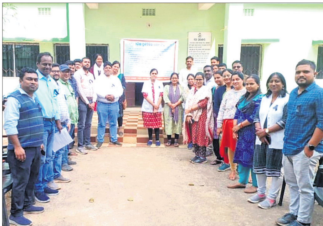
ଖୋର୍ଦ୍ଧା ଜିଲ୍ଲା ପ୍ରାଣୀ ଚିକିତ୍ସାକର ସମ୍ମୁଖରେ ଚିକିତ୍ସକ ଧାରଣା ।

ପ୍ରାଣୀ ଚିକିତ୍ସକ ଆନ୍ଦୋଳନ ଯୋଗୁ ଏବେ ରାଜ୍ୟରେ ପ୍ରାଣୀ ଚିକିତ୍ସା ସେବା ଠିକ୍ ହୋଇପାରିଛି । ୧,୩୪୩ଟି ପ୍ରାଣୀ ଚିକିତ୍ସକ ମଧ୍ୟରୁ ଆନ୍ଦୋଳନରେ ୧,୨୩୫ଟି ପ୍ରାଣୀ ଚିକିତ୍ସକ ଆନ୍ଦୋଳନରେ ୨୮ ଦିନ ହେଲା ସମୂହ କ୍ଷୁଦ୍ରରେ ରହିବା ସହିତ ଜିଲ୍ଲା ପୁଖ୍ୟ ପ୍ରାଣୀ ଚିକିତ୍ସା ଅଧିକାରୀଙ୍କ କାର୍ଯ୍ୟାଳୟରେ ଧାରଣାରେ ବସିଛନ୍ତି । ଫଳରେ ରାଜ୍ୟରେ ପ୍ରାଣୀଚିକିତ୍ସା ସମ୍ପୂର୍ଣ୍ଣ ବିପର୍ଯ୍ୟୟ ହୋଇପଡ଼ିଥିବାରୁ ରୋଗ ଯନ୍ତ୍ରଣାରେ ଛତାପତ ହେଉଛି ପ୍ରାଣୀ ସମ୍ପଦ । ଏବେ ବିଭିନ୍ନ ପ୍ରକାର ସଂକ୍ରାମକ ରୋଗ ବ୍ୟାପୁଥିଲେ ମଧ୍ୟ ଚିକିତ୍ସା ମିଳୁ ନ ଥିବାରୁ ଜୀବନ ଯାଉଛି । ନିକଟରେ ଖୋର୍ଦ୍ଧା ବେଗୁନିଆ ଅଞ୍ଚଳରେ ଜଣେ ଗରିବ ଛେଳିପାଳକଙ୍କ ବହୁ ଛେଳି ଅସୁସ୍ଥ ହୋଇପଡ଼ିଥିଲେ । ପ୍ରାଣୀ ଚିକିତ୍ସକ ଆନ୍ଦୋଳନରେ ଥିବାରୁ ଛେଳି ପାଳକ ଜଣକ ଗ୍ଲାନାୟ ଜଣେ ଡାକ୍ତରଙ୍କୁ ଡକାଇ ଚିକିତ୍ସା କରାଇଥିଲେ । ହେଲେ ଭୁଲ୍ ଚିକିତ୍ସା ଯୋଗୁ ୯ଟି ଛେଳିଙ୍କର ମୃତ୍ୟୁ ଘଟିଥିଲା । ଗତ ମାସକ ଭିତରେ ଚିକିତ୍ସା ନ ପାଇ ଓ ଡାକ୍ତରଙ୍କ ଭୁଲ୍ ଚିକିତ୍ସା ଯୋଗୁ ଶହ ଶହ ଛେଳି ଏବଂ ଗୃହପାଳିତ ପ୍ରାଣୀଙ୍କର ମୃତ୍ୟୁ ଘଟିଥିବା ନିଜର ରହିଛି । ଏପଟେ ବାମାକୃତ ପ୍ରାଣୀଙ୍କ ମୃତ୍ୟୁ ହେଲେ ବ୍ୟବହୃତ କରାଯାଇ ପାରୁନାହିଁ କି ସରକାରୀ ସହାୟତା ମିଳୁନାହିଁ । ସେହିପରି ରାଜ୍ୟର ଗରିବ ଚାଷୀମାନେ ବିଭିନ୍ନ ସରକାରୀ ଯୋଜନାରେ ସେମାନଙ୍କ ପ୍ରାପ୍ୟ ପାଇପାରୁନାହାନ୍ତି । ଆନିମାଲ ହେଲ୍ ଲାଇନ୍ ମଧ୍ୟ ସେବାରେ ଆସୁନାହିଁ । କାତ୍ୟା ପ୍ରାଣୀ ରୋଗ ନିୟନ୍ତ୍ରଣ କାର୍ଯ୍ୟକ୍ରମ (ପୁଖ୍ୟତଃ ଫାଟୁଆ ନିରାକରଣ) ସମ୍ପୂର୍ଣ୍ଣ ଭାବେ ହୋଇନାହିଁ । କାରଣରୁ ରାଜ୍ୟର ଏକ କୋଟି ପ୍ରାଣୀଙ୍କ ଜୀବନ ସଂକଟାପତ ଅବସ୍ଥାରେ ରହିଛି । କାତ୍ୟା କୃତ୍ରିମ ପ୍ରଜନନ କାର୍ଯ୍ୟକ୍ରମ ବହୁ ମାତ୍ରାରେ ପ୍ରଭାବିତ ହୋଇଛି । ବିଭାଗରେ ଚାରି ସପ୍ତାହ ଧରି ବାର୍ଷିକ ସରକାରୀ ଓ ଡିପୋର୍ଟ ପ୍ରାୟ ବନ୍ଦ ହୋଇ ଯାଇଛି । ଜନସାଧାରଣ ଅସୁବିଧାରେ ପଡ଼ି ମୋ ସରକାର, ପୁଖ୍ୟମନ୍ତ୍ରୀଙ୍କ କାର୍ଯ୍ୟାଳୟ ବା ଜିଲ୍ଲାପାଳଙ୍କୁ