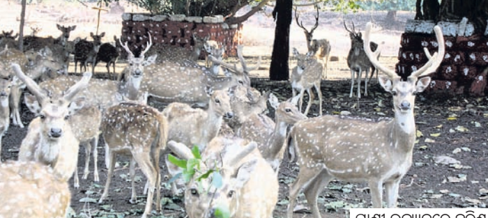
ପ୍ରାଣୀ ଉଦ୍ୟାନରେ ହରିଣା ।

ଦେଶାନ୍ତରୀଣ ଜିଲାର ପ୍ରସିଦ୍ଧ ପର୍ଯ୍ୟଟନସ୍ଥଳୀ କପିଳାସରେ ଥିବା ପ୍ରାଣୀ ଉଦ୍ୟାନ ୪୫ ବର୍ଷରେ ପଦାର୍ପଣ କରିଛି । ୧୯୭୯ ମସିହା ଜାନୁଆରୀ ୨୬ରେ ସମ୍ବଳିନାମୟ କପିଳାସର ପାଦ ଦେଶରେ ୫ ହେକ୍ଟର ଜାଗାରେ ଡିଅର ପାର୍କରୁ ଏହି ପ୍ରାଣୀ ଉଦ୍ୟାନ ଆରମ୍ଭ ହୋଇଥିଲା । ଏହାପରେ ବେବୋଉର ବିଭାଗ ଏବଂ କପିଳାସ ସଂରକ୍ଷିତ ଜଙ୍ଗଲର କିଛି ଅଞ୍ଚଳକୁ ନେଇ ୨୬.୬୪ ହେକ୍ଟରକୁ ଏହା ସମ୍ପ୍ରସାରିତ ହୋଇଥିଲା । ୧ ଏପ୍ରିଲ ୧୯୮୬ରେ ଏହା ମିଳି କୁ ଭାବେ ମାନ୍ୟତା ପାଇଥିଲା । ଏହି ପ୍ରାଣୀ ଉଦ୍ୟାନରେ ୨୪୭ଟି ଜୀବଜନ୍ତୁ ରହିଛନ୍ତି । ୨୦୦୯ ମସିହାରେ ଏହି ପ୍ରାଣୀ ଉଦ୍ୟାନ ପରିସରରେ ଏକ ହାତୀ ଉଦ୍ଭାବ କେନ୍ଦ୍ର ପ୍ରତିଷ୍ଠା ହୋଇଥିଲା । ଦେଶାନ୍ତରୀଣ ସମେତ ବିଭିନ୍ନ ଜିଲାରୁ ଉଦ୍ଭାବ ହାତୀଙ୍କୁ ଆଣି ଓ ଉପସ୍ତବ କରୁଥିବା ହାତୀଙ୍କୁ ଆଣି