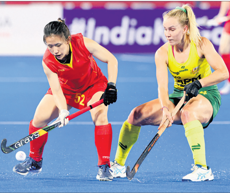
ଦର୍ଦ୍ଦା ମୁଖ୍ୟ ଷ୍ଟାଡ଼ିୟମରେ ଚୁପ୍‌ଚାପି କରାଯାଇ ଓ ଅଣ୍ଡେଲିଆ ମଧ୍ୟରେ ଅନୁଷ୍ଠିତ ମହିଳା ହକି ପ୍ରୋ ଲିଗ ମ୍ୟାଚ।

ଦଳ ଏଠାରେ କ୍ରମାଗତ ଦ୍ୱିତୀୟ ମ୍ୟାଚ ହାରିଛି। ଭୁବନେଶ୍ୱରରେ ଅନୁଷ୍ଠିତ ପ୍ରଥମ ଚରଣରେ ମଧ୍ୟ ଭାରତ ୧-୩ ଗୋଲରେ ନେଦରଲାଣ୍ଡଠାରୁ ହାରି ଯାଇଥିଲା। ଭାରତ ଏପର୍ଯ୍ୟନ୍ତ ଖେଳିଥିବା ୬ ମ୍ୟାଚରୁ ମାତ୍ର ୩ ପଏଣ୍ଟ ପାଇ ଟେବୁଲର ୫ମ ସ୍ଥାନରେ ରହିଛି। ଅନ୍ୟପକ୍ଷରେ ନେଦରଲାଣ୍ଡ ୧୦