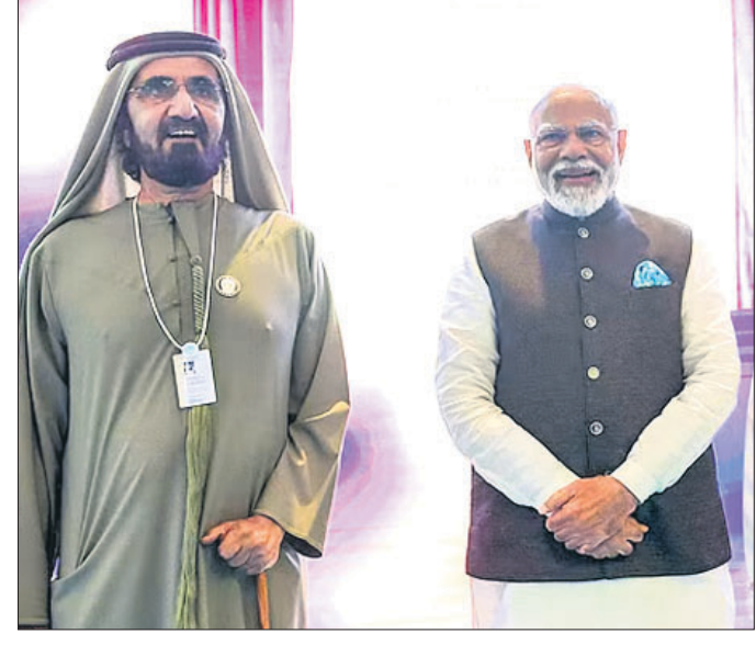
ସୁଏଜ୍ ଡାକ୍ତରୀ ସମ୍ବନ୍ଧରେ, ପ୍ରାୟ ୨୦ ମିନିଟ୍‌ରେ ତଥା ଦୁଇ ଘଣ୍ଟାରେ ଶେଷ ମହମ୍ମଦ ବିନ୍ ରଶିଦ୍ ଅଲ୍ ମକ୍ତୁବ୍‌ଙ୍କ ସହ ଭାରତର ପ୍ରଧାନମନ୍ତ୍ରୀ ନରେନ୍ଦ୍ର ମୋଦି ।