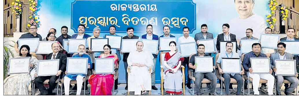
ମୁଖ୍ୟମନ୍ତ୍ରୀ ନବୀନ ପଟ୍ଟନାୟକଙ୍କ ସହ ସମ୍ମାନିତ ହୋଇଥିବା ବ୍ୟକ୍ତିବିଶେଷ ।