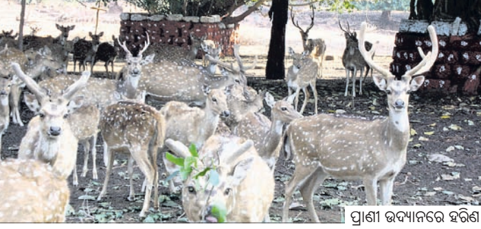
ପ୍ରାଣୀ ଉଦ୍ୟାନରେ ହରିଣା ।

ଦେଶାନ୍ତରୀଣ ଜିଲାର ପ୍ରସିଦ୍ଧ ପର୍ଯ୍ୟଟନସ୍ଥଳୀ କପିଳାସରେ ଥିବା ପ୍ରାଣୀ ଉଦ୍ୟାନ ୪୫ ବର୍ଷରେ ପଦାର୍ପଣ କରିଛି । ୧୯୭୯ ମସିହା ଜାନୁଆରୀ ୨୬ରେ ସମ୍ବଳିନାମୟ କପିଳାସର ପାଦ ଦେଶରେ ୫ ହେକ୍ଟର ଜାଗାରେ ଡିଅର ପାର୍କରୁ ଏହି ପ୍ରାଣୀ ଉଦ୍ୟାନ ଆରମ୍ଭ ହୋଇଥିଲା । ଏହାପରେ ବେବୋଉର ବିଭାଗ ଏବଂ କପିଳାସ ସଂରକ୍ଷିତ ଜଙ୍ଗଲର କିଛି ଅଞ୍ଚଳକୁ ନେଇ ୨୬.୬୪ ହେକ୍ଟରକୁ ଏହା ସମ୍ପ୍ରସାରିତ ହୋଇଥିଲା । ୧ ଏପ୍ରିଲ ୧୯୮୬ରେ ଏହା ମିଳି ଲୁ ଭାବେ ମାନ୍ୟତା ପାଇଥିଲା । ଏହି ପ୍ରାଣୀ ଉଦ୍ୟାନରେ ୨୪୭ଟି ଜୀବଜନ୍ତୁ ରହିଛନ୍ତି । ୨୦୦୯ ମସିହାରେ ଏହି ପ୍ରାଣୀ ଉଦ୍ୟାନ ପରିସରରେ ଏକ ହାତୀ ଉଦ୍ଭାବ କେନ୍ଦ୍ର ପ୍ରତିଷ୍ଠା ହୋଇଥିଲା । ଦେଶାନ୍ତରୀଣ ସମେତ ବିଭିନ୍ନ ଜିଲାରୁ ଉଦ୍ଭାବ ହାତୀଙ୍କୁ ଆଣି ଓ ଉପସ୍ତବ କରୁଥିବା ହାତୀଙ୍କୁ ଆଣି