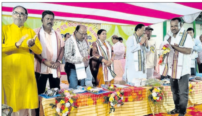
ବାର୍ଷିକ ଉତ୍ସବରେ ଉପସ୍ଥିତ ଅଥିବାମାନେ ।

ବରେନ୍ଦ୍ରକୃଷ୍ଣ ବିଦ୍ୟାପୀଠର ବାର୍ଷିକ ଉତ୍ସବ ବିଦ୍ୟାଳୟ ପରିସରରେ ରୁଧିରାଜ ଉତ୍ସବ ଅନୁଷ୍ଠିତ ହୋଇଯାଇଛି। ପୂର୍ବରୁ ବିଦ୍ୟାଳୟ ପରିସରରେ ମା' ସରସ୍ୱତୀ ଏବଂ ଶ୍ରୀମତୀଙ୍କ ପ୍ରତିମୂର୍ତ୍ତିଙ୍କୁ ବାଙ୍କୀ ନିବାସ ଓ ଲକ୍ଷ୍ମୀନାରାୟଣ ମୋଦି ଛାତ୍ରବାସ ସମେତ ବିଭିନ୍ନ ବିଭାଗରେ ମା'ଙ୍କୁ ଉନ୍ମୋଚନ କରିଥିଲେ।