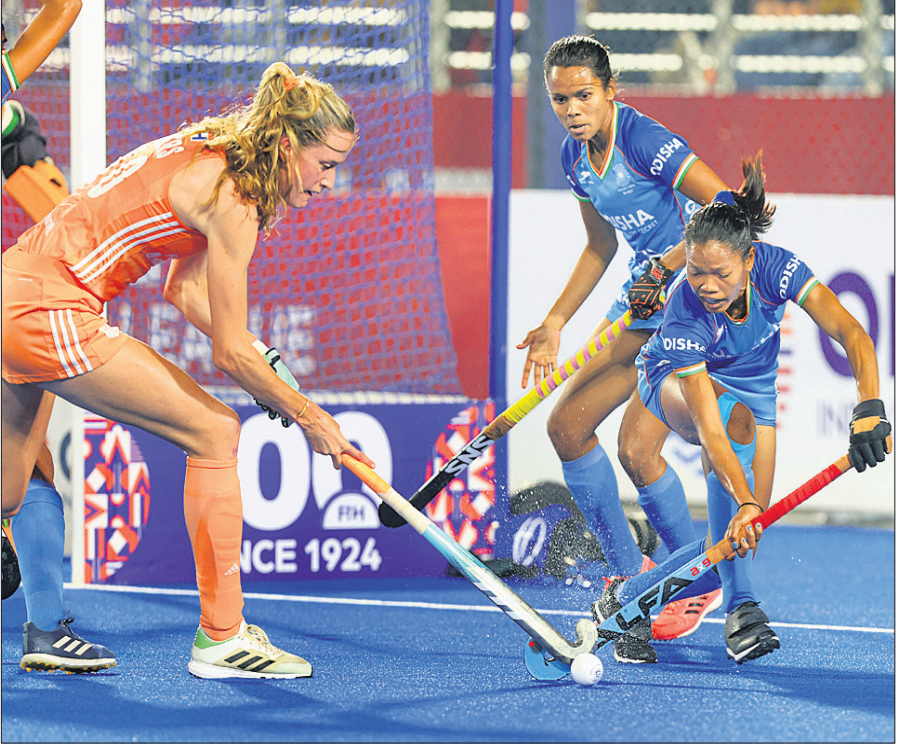
ଭାରତ-ନେଦରଲାଣ୍ଡ ମ୍ୟାଚର ଏକ ସଂଘର୍ଷପୂର୍ଣ୍ଣ ମୁହୂର୍ତ୍ତ।