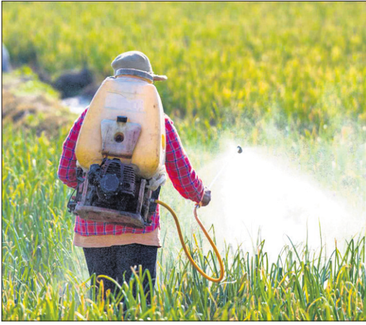
ହୋଇପାଉଛି, ତଥାପି ଗାଈ ପାଇଁ ଆବଶ୍ୟକ ସଂସାଧନ ଏବଂ ବ୍ୟବହାରିକ ଉପଲବ୍ଧ ହେଉନାହିଁ। ଫଳସ୍ୱରୂପ କୃଷକଙ୍କ ଲାଭ କମ୍ ବେଶି ହେଉଛି ଏବଂ କୃଷି ଅସମାପନତା ବୃଦ୍ଧିପାଇଛି। ଏହି ଆହ୍ୱାନଗୁଡ଼ିକ ବିପଜନକ ନ ଥିଲେ ମଧ୍ୟ ବିଶେଷଜ୍ଞମାନେ ଅଧିକ ଅମଳକ୍ଷମ ଫସଲରେ ରହୁଥିବା ପୋଷକ ତତ୍ତ୍ୱର ଅବନତି ବିଷୟକୁ ନେଇ ଏବେ ଅଧିକ ଚିନ୍ତିତ। ଉଦାହରଣସ୍ୱରୂପ, ନିକଟରେ କରାଯାଇଥିବା ଏକ

କନ୍ୟା ଯୋଗ ୩,୯୦,୦୦୦ରୁ ଅଧିକ ପ୍ରକାଶିତ ଉଦ୍ଭିଦ ଠାବ କରାଯାଇଛି। ସେଗୁଡ଼ିକ ମଧ୍ୟରୁ କେବଳ ୩ଟି ଯଥା ଧାନ, ମକା ଓ ଗହମ ଆମ ଖାଦ୍ୟରେ ରହୁଥିବା ଉଦ୍ଭିଦଭିତ୍ତିକ କ୍ୟାଲୋରିର ପ୍ରାୟ ୬୦ ପ୍ରତିଶତ ଭରଣା କରେ। ଏହି ତିନୋଟି ଶସ୍ୟର ପ୍ରାଧାନ୍ୟ ମୁଖ୍ୟତଃ ପ୍ରମୁଖ ପ୍ରଯୁକ୍ତିଗତ ପ୍ରଗତି ଯୋଗୁ ସମ୍ଭବ ହୋଇପାରିଛି। ବିଶେଷକରି ୧୯୬୦ ଦଶକର ସବୁଜ ବିପ୍ଳବ ସମୟରେ ଅଧିକ ଅମଳକ୍ଷମ କିସମ (ଏନ୍ଡୋଜିନ୍)ର ଧାନ ଓ ଗହମ ବିକଶିତ କରାଯାଇଥିଲା ଏବଂ ଏଥିରୁ ବିପୁଳ ଲାଭ ମିଳିଛି। ଏହା ମୁଖ୍ୟତଃ ଖାଦ୍ୟ ଉପଲବ୍ଧତାକୁ ଯଥେଷ୍ଟ ବୃଦ୍ଧି କରିଛି ଏବଂ ଅନେକ ଶହ କୋଟି ଲୋକଙ୍କୁ କ୍ଷୁଧାମୁକ୍ତ କରିପାରିଛି। ଉଲ୍ଲେଖଯୋଗ୍ୟ, ଏନ୍ଡୋଜିନ୍ ବିହୀନଗୁଡ଼ିକ ଯୋଗୁ ଉତ୍ପାଦନ ବୃଦ୍ଧି ହୋଇଛି ସତ, କିନ୍ତୁ ଗାଈ ପ୍ରକ୍ରିୟାକୁ ଦେଖିଲେ ଏହା ଅନ୍ୟ ସମସ୍ୟାସୂଚୀ ସୃଷ୍ଟି କରିଛି। ଉଲ୍ଲେଖନୀୟ ଯେ, ଅଧିକ ଅମଳକ୍ଷମ ବିହୀନ ଉତ୍ପାଦନ କଳସେଚନ ଉପଲବ୍ଧତା ଏବଂ ବିଭିନ୍ନ ରାସାୟନିକ ପଦାର୍ଥ ବିଶେଷକରି ସାର ଏବଂ କୀଟନାଶକ ପ୍ରୟୋଗ ଉପରେ ବେଶି ନିର୍ଭର କରେ। ଫଳସ୍ୱରୂପ ଏନ୍ଡୋଜିନ୍ ବିହୀନରେ ଗାଈ କିରିବା ଦ୍ୱାରା କେନାଲ କଳସେଚନର ଅତ୍ୟଧିକ ବ୍ୟବହାର କିରିବାକୁ ପଡୁଛି। ଏପରିକି ଅଧିକ ଅମଳକ୍ଷମ ବିହୀନ ପାଇଁ ଅର୍ଦ୍ଧଶତାବ୍ଦୀ ଅଞ୍ଚଳରେ କୃଷକମାନେ ଭୂତଳ କଳସେଚନ ଉପରେ ନିର୍ଭର କରିବାକୁ ବାଧ୍ୟ ହେଉଛନ୍ତି। ସେହିଭଳି ପାରମ୍ପରିକ ବିହୀନ ବଦଳରେ ଏନ୍ଡୋଜିନ୍ ଭିତ୍ତିକ କୃଷି ଦ୍ୱାରା ଯବକ୍ଷାରକାର ଆଧାରିତ ସାର ପ୍ରୟୋଗ ଅତ୍ୟଧିକ ବୃଦ୍ଧିପାଇଛି। ଏନ୍ଡୋଜିନ୍ ବିହୀନରେ ଗାଈ କଳେ ସେଥିରେ ରୋଗପୋକର ଅଧିକ ବିପଦ ରହିଛି। ସେହି ସବୁ ବିହୀନକୁ ନେଇ ଏକ ଗାଈ (ଏକାଦେକକେ କମିରେ ଗୋଟିଏ ପ୍ରକାର ଗାଈ) କରିବାର ଅଭ୍ୟାସ କାରଣରୁ ବାରମ୍ବାର ରୋଗ ପୋକ ସଂକ୍ରମଣ ହେବା ଦେଖାଯାଏ ଓ ତାହା ଏବେ