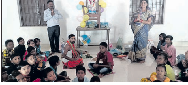
ମାହାଙ୍ଗା ଅଞ୍ଚଳର ଏକ ସ୍କୁଲରେ ସରସ୍ୱତୀ ପୂଜା କରାଯାଇଛି ।