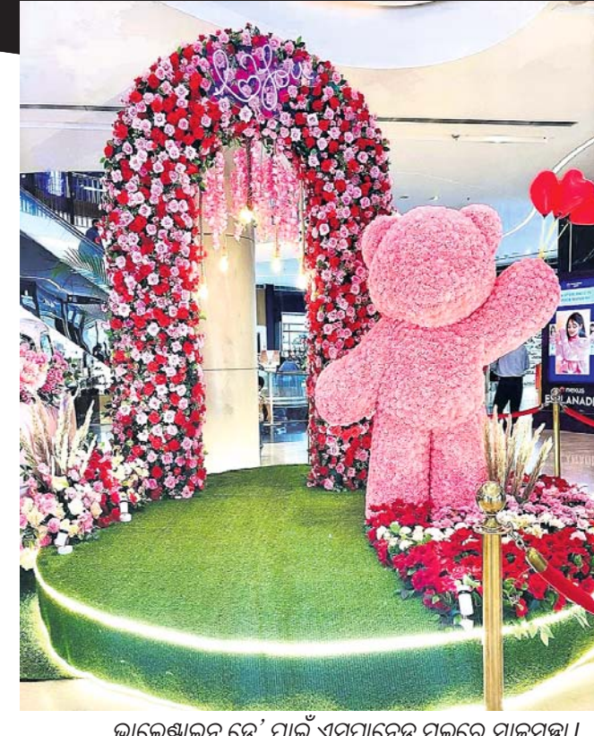
ଭାଲେଣ୍ଟାଇନ୍ ଡେ’ ପାଇଁ ଏସ୍କୁମୋନେଟ୍ ମଲ୍‌ରେ ସାଜସଜ୍ଜା।

ଆକର୍ଷଣୀୟ ସାଜସଜ୍ଜା ସହ କ୍ୟାଣ୍ଟୋଲ ଲାଇଟ୍ ଡିନର