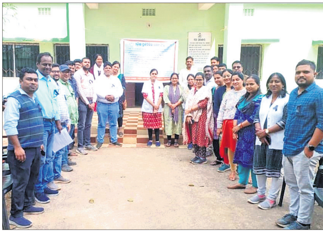
ଖୋର୍ଦ୍ଧା ଜିଲ୍ଲା ପ୍ରାଣୀ ଚିକିତ୍ସାଳୟ ସମ୍ମୁଖରେ ଚିକିତ୍ସକ ଧାରଣା।

ପ୍ରାଣୀ ଚିକିତ୍ସକ ଆନ୍ଦୋଳନ ଯୋଗୁ ଏବେ ରାଜ୍ୟରେ ପ୍ରାଣୀ ଚିକିତ୍ସା ସେବା ଠିକ୍ ହୋଇପାରିଛି। ୧,୨୫୫ଟି ପ୍ରାଣୀ ଚିକିତ୍ସକ ମଧ୍ୟରୁ ଆନ୍ଦୋଳନରେ ୨,୨୩୫ଟି ସାମିଲ ହୋଇଛନ୍ତି। ୨୮ ଦିନ ହେଲା ସମସ୍ତ କ୍ଷେତ୍ରରେ ରହିବା ସହିତ ଜିଲ୍ଲା ପୁଞ୍ଜୀ ପ୍ରାଣୀ ଚିକିତ୍ସା ଅଧିକାରୀଙ୍କ କାର୍ଯ୍ୟାଳୟରେ ଧାରଣାରେ ବସିଛନ୍ତି। ଫଳରେ ରାଜ୍ୟରେ ପ୍ରାଣୀଚିକିତ୍ସା ସମ୍ପୂର୍ଣ୍ଣ ବିପର୍ଯ୍ୟୟ ହୋଇପଡିଥିବା ରୋଗ ଯନ୍ତ୍ରଣାରେ ଛଟପଟ ହେଉଛନ୍ତି ପ୍ରାଣୀ ସମ୍ପଦ। ଏବେ ବିଭିନ୍ନ ପ୍ରକାର ସଂକ୍ରାମକ ରୋଗ ବ୍ୟାପୁଥିଲେ ମଧ୍ୟ ଚିକିତ୍ସା ମିଳୁ ନ ଥିବାରୁ ଜୀବନ ଯାଉଛି। ନିକଟରେ ଖୋର୍ଦ୍ଧା ବେଗୁନିଆ ଅଞ୍ଚଳରେ ଜଣେ ଗରିବ ଛେଳିପାଳକଙ୍କ ବହୁ ଛେଳି ଅସୁସ୍ଥ ହୋଇପଡିଥିଲେ। ପ୍ରାଣୀ ଚିକିତ୍ସକ ଆନ୍ଦୋଳନରେ ଥିବାରୁ ଛେଳି ପାଳକ ଜଣକ ସ୍ଥାନୀୟ ଜଣେ ଡାକ୍ତରଙ୍କୁ ଡକାଇ ଚିକିତ୍ସା କରାଇଥିଲେ। ହେଲେ ଭୁଲ୍ ଚିକିତ୍ସା ଯୋଗୁ 'ଟି ଛେଳି'ର ମୃତ୍ୟୁ ଘଟିଥିଲା। ଗତ ମାସକ ଭିତରେ ଚିକିତ୍ସା ନ ପାଇ ଓ ଡାକ୍ତର ଭୁଲ୍ ଚିକିତ୍ସା ଯୋଗୁ ଶହ ଶହ ଛେଳି ଏବଂ ଗୁହପାଳିତ ପ୍ରାଣୀଙ୍କର ମୃତ୍ୟୁ ଘଟିଥିବା ନିଜର ରହିଛି। ଏପଟେ ବାମାନୁତ ପ୍ରାଣୀଙ୍କ ମୃତ୍ୟୁ ହେଲେ ବ୍ୟବହୃତ କରାଯାଇ ପାରୁନାହିଁ କି ସରକାରୀ ସହାୟତା ମିଳୁନାହିଁ। ସେହିପରି ରାଜ୍ୟର ଗରିବ ଚାଷୀମାନେ ବିଭିନ୍ନ ସରକାରୀ ଯୋଜନାରେ ସେମାନଙ୍କ ପ୍ରାପ୍ୟ ପାଇପାରୁନାହାନ୍ତି। ଆନିମାଲ ହେଲ୍ ଲାଇନ୍ ମଧ୍ୟ ସେବାରେ ଆସୁନାହିଁ। ଜାତୀୟ ପ୍ରାଣୀ ରୋଗ ନିୟନ୍ତ୍ରଣ କାର୍ଯ୍ୟକ୍ରମ (ପୁଞ୍ଜୀତ୍ୟ ଫାଉଣ୍ଡାସନ୍) ନିରାକରଣ ସମ୍ପୂର୍ଣ୍ଣ ବନ୍ଦ ହୋଇଯିବା କାରଣରୁ ରାଜ୍ୟର ଏକ କୋଟି ପ୍ରାଣୀଙ୍କ ଜୀବନ ସଂକଟାପତ୍ତ ଅବସ୍ଥାରେ ରହିଛି। ଜାତୀୟ କୃତ୍ରିମ ପ୍ରଜନନ କାର୍ଯ୍ୟକ୍ରମ ବହୁ ମାତ୍ରାରେ ପ୍ରଭାବିତ ହୋଇଛି। ବିଭାଗରେ ଚାରି ସପ୍ତାହ ଧରି ବାର୍ଦ୍ଧୀ ସରକାରୀ ଓ ନିପୋଟି ପ୍ରାୟ ବନ୍ଦ ହୋଇ ଯାଇଛି। ଜନସାଧାରଣ ଅସୁବିଧାରେ ପଡି ମୋ ସରକାର, ମୁଖ୍ୟମନ୍ତ୍ରୀଙ୍କ କାର୍ଯ୍ୟାଳୟ ବା ଜିଲ୍ଲାପାଳଙ୍କୁ