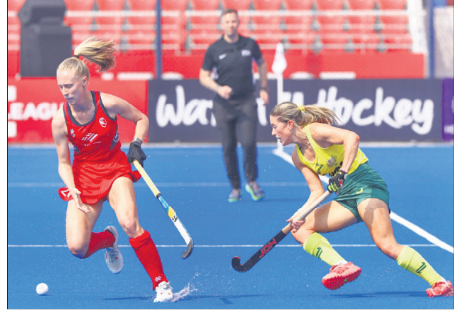
ଅଷ୍ଟ୍ରେଲିଆ ଓ ଆମେରିକା ମଧ୍ୟରେ ଅନୁଷ୍ଠିତ ମ୍ୟାଚ।

ଭାରତବେଳା, ୧୫।୨ (ବିନେଶ ମିଶ୍ର) ରାଉରକେଲା ବର୍ସା ପୁଷ୍ପ ଅର୍ଜନତୀୟ ହକି ଷ୍ଟାଡିୟମରେ ମହିଳା ହକି ପ୍ରୋ ଲିଗ୍ ୧୩ତମ ମ୍ୟାଚ୍ ରୁରୁବାର ଆମେରିକାକୁ ୪-୦ ଗୋଲରେ ହରାଇ ବୃହତ୍