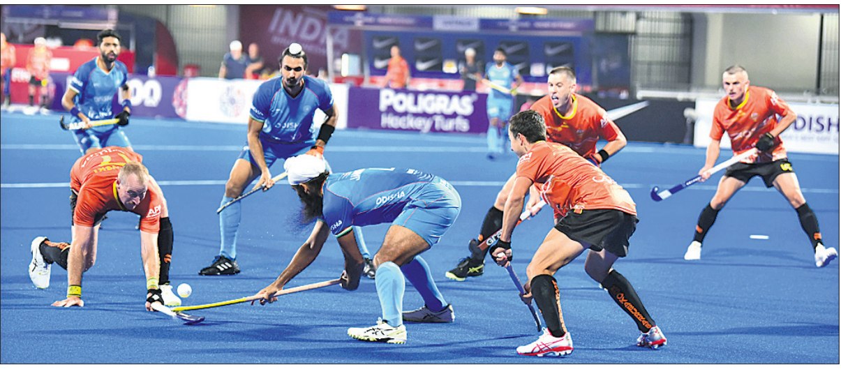
ଭାରତ ଓ ଅଷ୍ଟ୍ରେଲିଆ ମଧ୍ୟରେ ଅନୁଷ୍ଠିତ ମ୍ୟାଚର ଏକ ସଂଘର୍ଷପୂର୍ଣ୍ଣ ପୃଷ୍ଠା

ଭୁବନେଶ୍ୱର, ୧୫।୨ (ସମ୍ବାଦକ ଚଳା) କଳିଙ୍ଗ ଷ୍ଟାଡିୟମରେ ଅନୁଷ୍ଠିତ ପୁରୁଷ ପ୍ରୋ ଲିଗ୍ ହକିରେ ଅଷ୍ଟ୍ରେଲିଆ ନିକଟରୁ ସଂଘର୍ଷପୂର୍ଣ୍ଣ ୬-୪ ଗୋଲରେ ପରାଜିତ ହୋଇଛି ଭାରତ। ଅଷ୍ଟ୍ରେଲିଆ ପକ୍ଷରୁ କେବଳ ଗୋଲର୍ସ (୨ ଓ ୨) ମିନିଟରେ ତବଲ୍ ଗୋଲ ଦେଇଥିବା ବେଳେ ଆରମ୍ଭ କେଲିଭି(୪୦), ଶାର୍ପ ଲାଡଲାନ(୫୨), ଆଣ୍ଡରସନ୍ ଜାକର୍(୫୫) ଓ ଫ୍ରେଲି ଜ୍ୟାକ(୫୮) ମିନିଟରେ ଷୋର କରିଥିଲେ। ଅନ୍ୟ ପକ୍ଷରେ ହୋଇଛି ଭାରତ। ଅଷ୍ଟ୍ରେଲିଆ ଭାରତ ପାଇଁ ହରମନପ୍ରାପ୍ତ ପକ୍ଷରୁ କେବଳ ଗୋଲର୍ସ (୨ ଓ ୨) ମିନିଟରେ