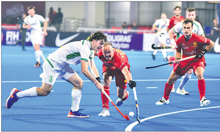
ହେନ୍ ଓ ଆୟଲିଣ୍ଡ ମଧ୍ୟରେ ଅନୁଷ୍ଠିତ ମ୍ୟାଚ।

ଭାରତର ଏହା ପ୍ରଥମ ପରାଜୟ। ଅଷ୍ଟ୍ରେଲିଆ ଆକ୍ରମଣାତ୍ମକ ଆରମ୍ଭ କରିଥିଲା। ପ୍ରଥମ ଦୁଇ ମିନିଟରେ କେବଳ ଗୋଲର୍ସ ହକି ଗୋଲ ଦେଇ ଭାରତକୁ ଚାପରେ ରଖିଥିଲେ। ୧୨ ତମ ମିନିଟରେ ଭାରତକୁ ପେନାଲ୍ଟି କର୍ନର ମିଳିଥିବା ବେଳେ ହରମନପ୍ରାପ୍ତ