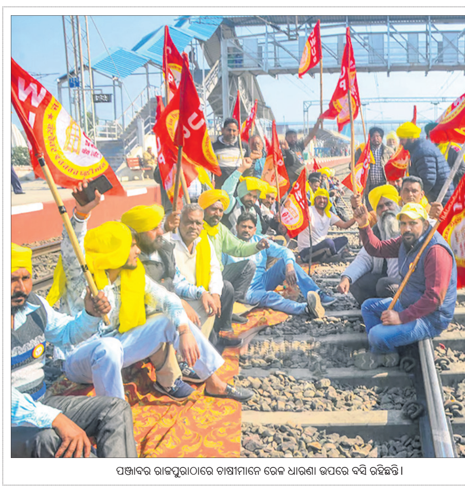
ପଞ୍ଜାବର ରାଜପୁରଠାରେ ଚାଷୀମାନେ ରେଳ ଧାରଣା ଉପରେ ବସି ରହିଛନ୍ତି।

କେନ୍ଦ୍ରୀୟ ସହ ଗଣମାଧ୍ୟମରେ ଅଧିକାରୀଙ୍କ ପ୍ରକାଶ କରୁଥିଲେ ବୋଲି କହିଛନ୍ତି। ସେହିପରି ଇଲେକ୍ଟୋରାଲ ଚାନ୍ଦା ବ୍ୟବସ୍ଥାରେ ସ୍ୱଚ୍ଛତା ଆଣିବାକୁ ହେଲେ ଆମ୍ଭେ ବହୁ ବାଟ ଯିବାକୁ ଅଛି ବୋଲି ଅନ୍ୟତମ ପୂର୍ବତନ ସିଇସି ଏନ୍. ଗୋପାଳକୃଷ୍ଣ କହିଛନ୍ତି। କାରଣ ଗୋଟିଏ ବ୍ୟବସ୍ଥା ଗଲେ ଅନ୍ୟତମ ଆସିବ। ଏହାକୁ କମିଶନର ବଦଳାଇବ ଏବଂ ପୁଣି ଯୋଜନା ଅଧିକ ପ୍ରଚଳିତ ହେବ ବୋଲି ସେ କହିଛନ୍ତି। ୨୦୦୬ ଜୁନରୁ ୨୦୦୯ ଏପ୍ରିଲ ପର୍ଯ୍ୟନ୍ତ ଗୋପାଳକୃଷ୍ଣ ସିଇସି ରହିଥିଲେ। ସେ ବହୁ ସମୟରେ ଏହା ଉପରେ