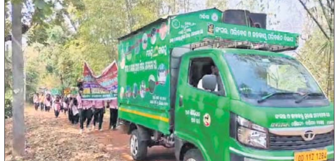
ଛାତ୍ରାଛାତ୍ରୀ ସଚେତନତା ଶୋଭାଯାତ୍ରାରେ ଯାଉଛନ୍ତି

ବୈଶିକା, ୧୫୨ (ଉତ୍ତର ଦାଶ) ମୟୂରଭଞ୍ଜ ଜିଲ୍ଲା ବେତନଟୀ ବନାଞ୍ଚଳ ରେଞ୍ଜି ଅନ୍ତର୍ଗତ କୃଷକମାନଙ୍କୁ ସଚେତନ କରିବା ପାଇଁ ବନାଗ୍ନି ନିରାକରଣ ଶିବିର ଅନୁଷ୍ଠିତ ହୋଇଯାଇଛି।