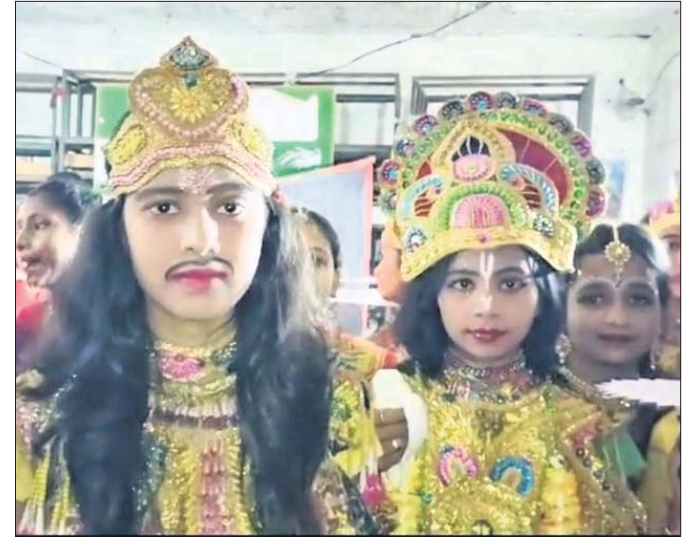
ନାଚକରେ ଭାଗ ନେଇଥିବା ଛାତ୍ରାଛାତ୍ରୀ

ବାଲିଆପାଳ କଳେଶ୍ୱର ଅଧୀନ ବକ୍ସବାଠା ସରକାରୀ ଉଚ୍ଚ ବିଦ୍ୟାଳୟ ପରିସରରେ ବସ୍ତ୍ରାଣ୍ଡର ଉଦ୍‌ଘାଟନ କରାଯାଇଥିଲା।