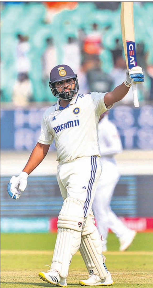
ଶତକ ହାସଲ ପରେ ରୋହିତ ଶର୍ମା ।

ଭାରତ ୫ ଉଇକେଟ ହରାଇ ୩୨୬ ରନ୍ ସଂଗ୍ରହ କରିଛି । ଭାରତ ପକ୍ଷରୁ ଏହି ମ୍ୟାଚରେ ୨ ଜଣ ଖେଳାଳି ପଦାର୍ପଣ କରିଥିଲେ । ଆହତ ଥିବା ଲୋକେଶ ରାହୁଲଙ୍କ ସ୍ଥାନରେ ସର୍ତ୍ତାରାଜ ଖାଁ ଓ ଶ୍ରୀକର ଭରଦ୍ୱାଜଙ୍କ ସ୍ଥାନରେ ଧ୍ରୁବ କୁମ୍ଭର ନିକର ଚେଷ୍ଟା ପଦାର୍ପଣ କରିଥିଲେ । ଭାରତର ବ୍ୟାଟିଂ ବିପର୍ଯ୍ୟୟ: ରାଜକୋଟରେ ଭାରତ ଟ୍ୱେଣ୍ଟି ବ୍ୟାଟିଂ ନେଇଥିଲା । ତେବେ ଦୁଇ ଜନପତି ବ୍ୟାଟର ତଥା ବିଶାଖାପାଟଣାରେ ଶତକ ହାସଲ କରିଥିବା ଯଶସ୍ୱୀ ଜୟସାଲ(୧୦) ଓ ଖାତା ଖୋଲିବା ପୂର୍ବରୁ ଶ୍ରୀମନ