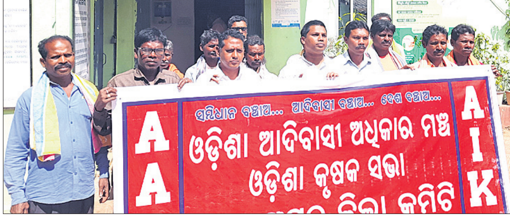
ଦାବି ଜଣାଇବାକୁ ଆସିଥିବା ଓଡ଼ିଶା ଆଦିବାସୀ ଅଧିକାର ମଞ୍ଚ ସଦସ୍ୟମାନେ।

ଓଡ଼ିଶା ଆଦିବାସୀ ଅଧିକାର ମଞ୍ଚ ନବରଙ୍ଗପୁର ଜିଲ୍ଲା କମିଟି ପକ୍ଷରୁ ଅନୁଷ୍ଠିତ ଗାଁ ଗଣତନ୍ତ୍ର ପ୍ରଦାନ କରାଯାଇଛି। ଜଙ୍ଗଲ ଅଧିକାର ଆଇନ ୨୦୦୬ ଓ ସଂଶୋଧିତ ଆଇନ ୨୦୧୨ ନିୟମାବଳୀ ରାଜ୍ୟ ଠିକ୍ କାର୍ଯ୍ୟକାରୀତା ନେଇ ଦାବି ଜଣାଇଛନ୍ତି। ନବରଙ୍ଗପୁର ଜିଲ୍ଲା ମଧ୍ୟରୁ ଅଣସର୍ବୋଚ୍ଚ ଗ୍ରାମ ଓ ପଢ଼ାଗ୍ରାମରେ ଗ୍ରାମ୍ୟ ଜଙ୍ଗଲ ଅଧିକାର କମିଟି ଗଠନ ପାଇଁ ଗାଁ ଗଣତନ୍ତ୍ର ଚାଲିବା କରାଯାଇଛି।