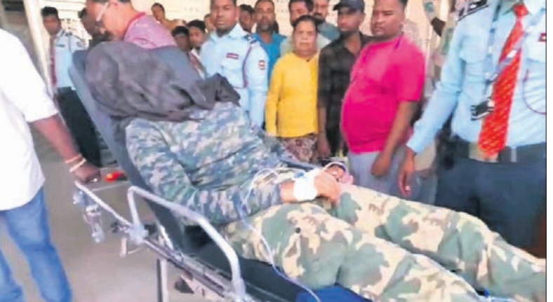
ବଲାଙ୍ଗୀର ଭୀମ ଭୋଇ ମେଡିକାଲ କଲେଜ ହସ୍ପିଟାଲକୁ ଜଣେ ଆହତ ଯବାନଙ୍କୁ ନିଆଯାଇଛି।

■ ମାଓବାଦୀ ବିସ୍ଫୋରଣରେ ଲ୍ୟାଣ୍ଡମାଇନ୍ ■ ବୌଦ୍ଧ ଜିଲ୍ଲା କଣ୍ଟାମାଳ ଥାନା ବଳମପୁରୀ ଜଙ୍ଗଲରେ ବିସ୍ଫୋରଣ ■ ଭୀମ ଭୋଇ ମେଡିକାଲ କଲେଜ ହସ୍ପିଟାଲରେ ହେଲା ସିଟି ସ୍କାନ୍ ■ ଆହତ ଯବାନଙ୍କୁ ବଲାଙ୍ଗୀରରୁ ଏୟାରଲିଫ୍ଟ କରାଗଲା