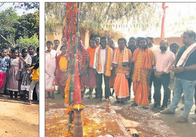
ଶୁଭେଚ୍ଛା ସ୍ତୋତ୍ର କରାଯାଇଛି।

୩ ମାସ ଧରି ଚାଲିବ। ମୋ ୧୫ରେ ବାଲିଯାତ୍ରା ସରିବ ବୋଲି ସୂଚନା ମିଳିଛି। ମଙ୍ଗଳା ଚିନ୍ତା କାରାଖାନାରେ ଥିବା ଧାରଣା ମନ୍ଦିରକୁ କଳସରେ ପାଣି ଆଣାଯାଇଥିଲା। କେମ୍ପା ନୃତ୍ୟ, ପାରମ୍ପରିକ ବାଦ୍ୟରେ ଅତିଥିଙ୍କୁ ବାଲି ଘର ପର୍ଯ୍ୟନ୍ତ ପାଠାଣ୍ଡି ଅଣା ଯାଇଥିଲା। ଗାଁରୁ ୫ଟି ଦେବା ଲାଠି ଓ ପରସଲାରୁ ଆସିଥିବା ଦେବା ଲାଠିକୁ ସୁଧା ଦେବା ପୂଜା କରାଯାଇଥିଲା। ସମସ୍ତଙ୍କୁ ବାଲିଘର ପର୍ଯ୍ୟନ୍ତ ନିମନ୍ତ୍ରଣ