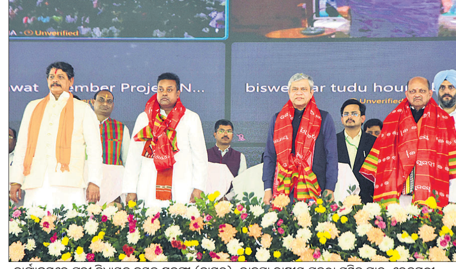
କାର୍ଯ୍ୟକ୍ରମରେ ପୂର୍ବା ବିଧାନ ସଭା ସଭ୍ୟ (ବାମରୁ), ଭାରତୀୟ ରାଷ୍ଟ୍ରପତି ପ୍ରବକ୍ତା ସମିତି ପ୍ରତି, ରେକମନ୍ଦ୍ରୀ ଅଧିକାରୀ ଶ୍ରେଣୀ ଏବଂ ଭାରତୀୟ ରାଜ୍ୟ ସଭାପତି ମନମୋହନ ସାମଲ ।

ଜିଲ୍ଲା ନୂଆଗଡ଼ 'ଆମ ବସ୍ତୁ'ରୁ ଉଦ୍ଘାଟନ କରାଯାଇଥିବା 'ଆମ ବସ୍ତୁ' ଯୋଜନାରେ ୧୩ ଜିଲ୍ଲାରେ ୨୦ଟି ନବନିର୍ମିତ ବସ୍ତୁ ଉଦ୍ଘାଟନ କରାଯାଇଛି। ଏହି ଜିଲ୍ଲାରୁ ଯୋଗାଯୋଗ କ୍ଷେତ୍ରରେ ଉନ୍ନତି ଆଣିବା ଲକ୍ଷ୍ୟ ରହିଛି। ୫-ଟି ଉତ୍ତମ ଯୋଗାଯୋଗ କ୍ଷେତ୍ରରେ ଯୋଗାଯୋଗ ଉନ୍ନତ କରିବା ଆବଶ୍ୟକ। ନୂଆ ବସ୍ତୁରେ ଲୋକମାନଙ୍କର ସୁବିଧା ବୃଦ୍ଧି ହେଉଥିବାରୁ ଯୋଗାଯୋଗ ଉନ୍ନତ କରିବା ଆବଶ୍ୟକ।