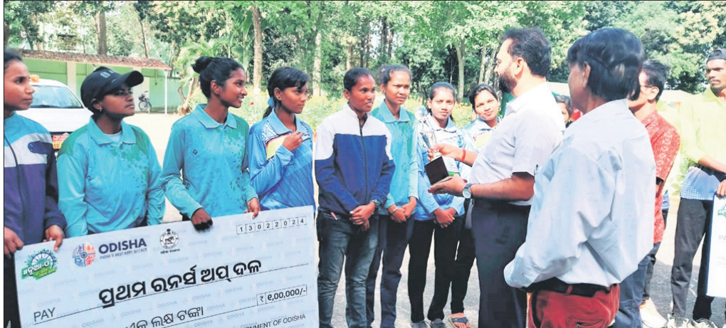
ଜିଲ୍ଲାପାଳ ନବରଙ୍ଗପୁର ମହିଳା କ୍ରିକେଟ ଦଳର ଖେଳାଳିଙ୍କ ସହ ଆଲୋଚନା କରୁଛନ୍ତି।