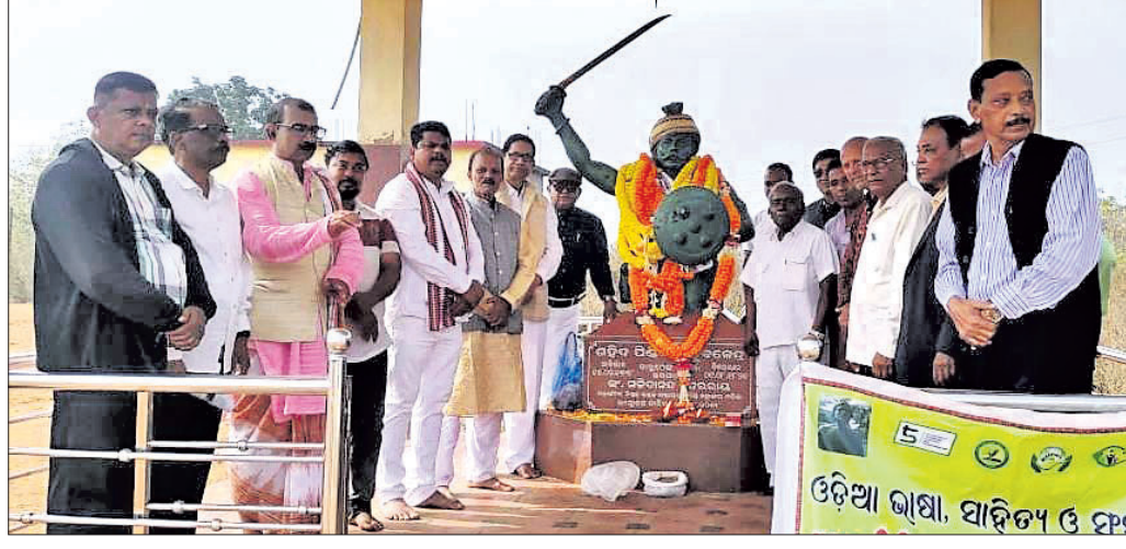
ଶହୀଦ ପିଣ୍ଡିକି ବାହୁବଳେନ୍ଦ୍ରଙ୍କ ପ୍ରତିମୂର୍ତ୍ତିରେ ମାଲ୍ୟାପର୍ଗଣା ଅବସରରେ ଉପସ୍ଥିତ ଅତିଥି ଏବଂ ଅନ୍ୟମାନେ ।