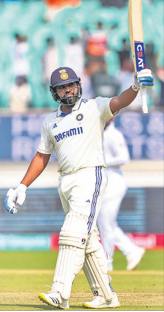
ଶତକ ହାସଲ ପରେ ରୋହିତ ଶର୍ମା ।

ରାଜକୋଟ, ୧୫୧୨ (ପି.ଟି.) ମାତ୍ର ଭୁଲ ବୁଝାମଣା ଯୋଗୁ ନିଜ ଶତକର ଖତର ସୃଷ୍ଟି ହୋଇଥିଲା। ଶତକର ଖତର ସୃଷ୍ଟି ହୋଇଥିଲା। ଶତକର ଖତର ସୃଷ୍ଟି ହୋଇଥିଲା।