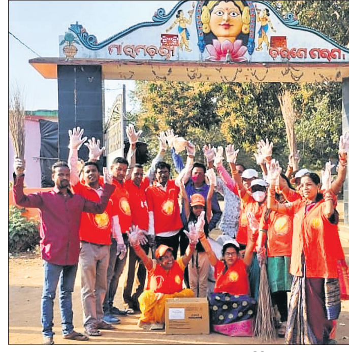
ରାମଚଣ୍ଡୀ ପାଠ ସଂଘେ ଅବସରରେ ଆମ୍ଭା ଭଗବାନ ସେବା ସମିତି ସଭ୍ୟମାନେ ।