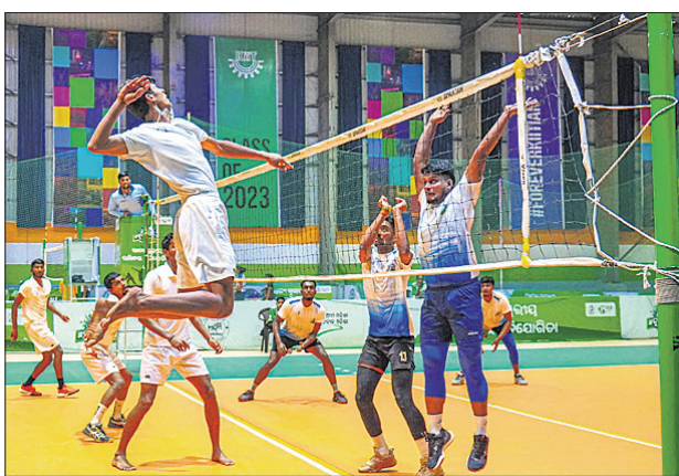
ନୂଆ-ଓ କାର୍ଯ୍ୟକ୍ରମ ଅନ୍ତର୍ଗତ ଭଲିବଲ୍ ଓ ଖୋ-ଖୋରେ ଖେଳାଳିମାନେ ସେମାନଙ୍କ କୌଶଳ ପ୍ରଦର୍ଶନ କରୁଛନ୍ତି।