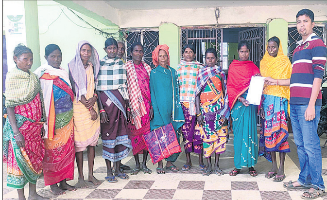
ଅଭିଯୋଗ ଜଣାଇବାକୁ ଆସିଥିବା ଏସ୍‌ଏଚ୍‌ଏଚ୍‌ ମହିଳାମାନେ ।

ସ୍ୱୟଂ ସହାୟକ ଗୋଷ୍ଠୀ(ଏସ୍‌ଏଚ୍‌ଏଚ୍‌)ର ମହିଳାମାନଙ୍କ ରୋଜଗାର ବୃଦ୍ଧି କରି ସେମାନଙ୍କୁ ସ୍ୱାବଲମ୍ବୀ କରିବା ଦିଗରେ ରାଜ୍ୟ ସରକାରଙ୍କ ପକ୍ଷରୁ ମିଶନ ଶକ୍ତି ମାଧ୍ୟମରେ ପଞ୍ଜୀକୃତ ସ୍ୱୟଂଚ୍ଚରି ବିନା ସୁଧରେ ରଣ ପ୍ରଦାନ କରାଯାଇଛି। ବିନା ସୁଧରେ ମିଳିଥିବା ଉଚ୍ଚ ରଣ ୫୦ ହଜାର ଟଙ୍କା ମିଶନ ଶକ୍ତି ବିଭାଗରେ କାର୍ଯ୍ୟକ୍ରମ ଜଣେ ଏମ୍ବିକେ ମହିଳା କର୍ମଚାରୀ ଓ ଟାଙ୍କ ସାମଗ୍ରୀ ମିଶ୍ର ଏସ୍‌ଏଚ୍‌ଏଚ୍‌ ମହିଳାଙ୍କଠାରୁ ଏହି ଟଙ୍କା ଛଡ଼ାଇ ନେଇଥିବା ଅଭିଯୋଗ ହୋଇଛି।