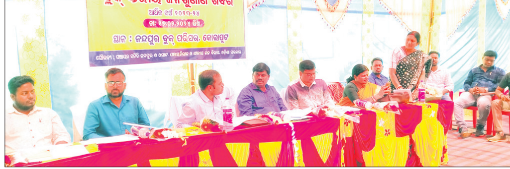
ସମାକ୍ଷା କାର୍ଯ୍ୟକ୍ରମରେ ଉପସ୍ଥିତ ଅଧିକାରୀମାନେ ଆଲୋଚନା କରୁଛନ୍ତି ।

ନନ୍ଦପୁର ରୁକ୍ମ କାର୍ଯ୍ୟାଳୟ ପରିସରରେ ଶନିବାର ସାମାଜିକ ସମାକ୍ଷା ଶିବିର ଓ ଜନଶୁଣାଣି ଅନୁଷ୍ଠିତ ହୋଇଛି।