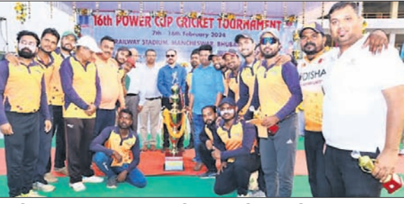
ଚାମ୍ପିୟନ ଇଡ଼ିକୋ ଦଳର ଖେଳାଳିମାନେ ଚୁପ୍ ସହ ଅତିଥିଙ୍କୁ ସମ୍ମାନ କରୁଛନ୍ତି।

ଫିଲିପ୍ ପୁରସ୍କାର ପାଇଥିଲେ। ଏହି ଚୁପ୍ ଚାମ୍ପିୟନ ଇଡ଼ିକୋ ଦଳର ଖେଳାଳିମାନେ ଚୁପ୍ ସହ ଅତିଥିଙ୍କୁ ସମ୍ମାନ କରୁଛନ୍ତି। ଶେଷରେ ଓଡ଼ିଶା ଦଳର ଚାମ୍ପିୟନ ଇଡ଼ିକୋ ଦଳର ଖେଳାଳିମାନେ ଚୁପ୍ ସହ ଅତିଥିଙ୍କୁ ସମ୍ମାନ କରୁଛନ୍ତି। ଶେଷରେ ଓଡ଼ିଶା ଦଳର ଚାମ୍ପିୟନ ଇଡ଼ିକୋ ଦଳର ଖେଳାଳିମାନେ ଚୁପ୍ ସହ ଅତିଥିଙ୍କୁ ସମ୍ମାନ କରୁଛନ୍ତି। ଶେଷରେ ଓଡ଼ିଶା ଦଳର ଚାମ୍ପିୟନ ଇଡ଼ିକୋ ଦଳର ଖେଳାଳିମାନେ ଚୁପ୍ ସହ ଅତିଥିଙ୍କୁ ସମ୍ମାନ କରୁଛନ୍ତି।