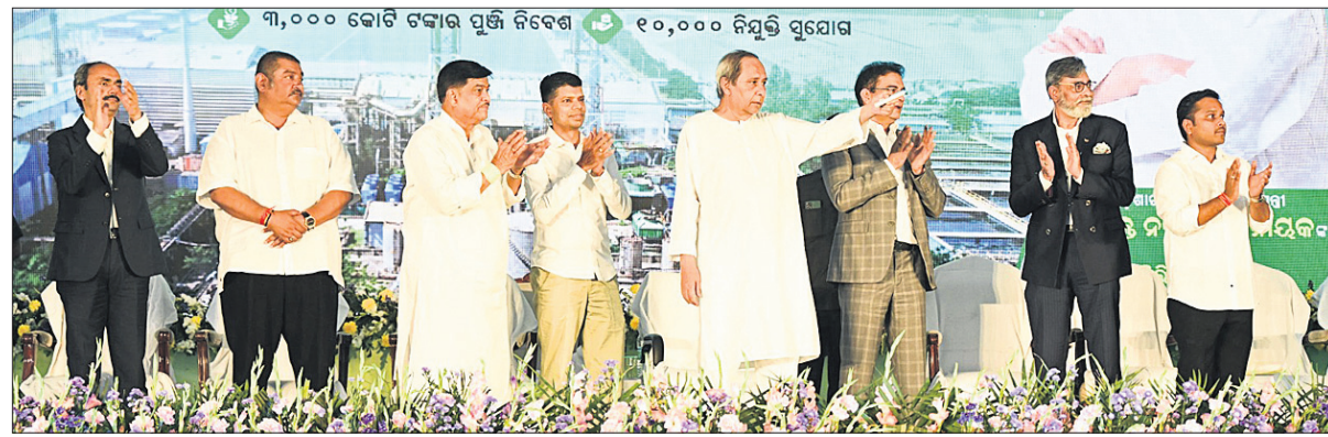
ଶିଳାନ୍ୟାସ କାର୍ଯ୍ୟକ୍ରମରେ ମୁଖ୍ୟମନ୍ତ୍ରୀ ନବୀନ ପଟ୍ଟନାୟକ, ୫-ଟି ତଥା ନବୀନ ଓଡ଼ିଶା ଅଧିକ କାର୍ଯ୍ୟକ୍ରମ ପାଇଁ ଆନୁଷ୍ଠାନିକ ସମେତ ମନ୍ତ୍ରୀ, ବିଧାୟକ ଓ ଅନ୍ୟମାନେ।

ଝେଲ୍‌ସ୍ମନର ଚେକ୍‌ଚାଲଲ କମ୍ପ୍ଲେକ୍ସ ପାଇଁ ଶିଳାନ୍ୟାସ କଲେ ମୁଖ୍ୟମନ୍ତ୍ରୀ