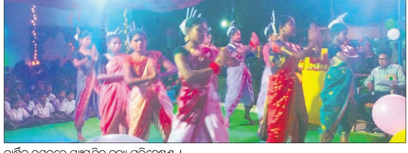
ବାର୍ଷିକ ଉତ୍ସବରେ ସାଂସ୍କୃତିକ ନୃତ୍ୟ ପରିବେଷଣ ।

ମାଲକାନଗିରି, ୧୭/୨ (ଭୂସୂଚନା ପତ୍ର) ମାଲକାନଗିରି ଜିଲା ସରକାରଙ୍କୁ ଉନ୍ନାତ ଉଚ୍ଚ ବିଦ୍ୟାଳୟର ବାର୍ଷିକ ଉତ୍ସବରେ ସୁଖପୂର୍ଣ୍ଣ ଭାବେ ପାଳନ କରିବାକୁ ଅନୁରୋଧ କରିଥିଲେ ।