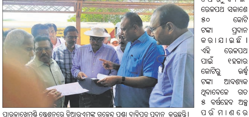
ପାରଳାଖେମୁଣ୍ଡି ସ୍ଵେଚ୍ଛାରେ ଡିଆରଏମ୍‌ଙ୍କୁ ଦାବିପତ୍ର ପ୍ରଦାନ କରୁଛନ୍ତି ।

ନେଇ ରାଜ୍ୟ ଏବଂ କେନ୍ଦ୍ର ମନ୍ତ୍ରଣାଳୟରେ ଛାଡ଼ି ହୋଇ ପ୍ରଦାନ କରାଯାଇଛି ।