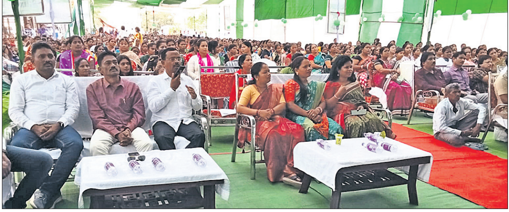
ଭଦ୍ରାବୀରୀ ଉତ୍ସବରେ ଯୋଗଦେଇଥିବା ଅତିଥି ଓ ଅନ୍ୟମାନେ ।

ମାଲକାନଗିରି ଜିଲା ସ୍ୱାସ୍ଥ୍ୟ ସେବାରେ ଆଗୁଆ ଥିବା ବେଳେ ରାଜ୍ୟ ସରକାର ଏହି ହସ୍ତିଚାଳର ରୋଗୀସେବା, ପରିବେଶ ଏବଂ ଡାକ୍ତର କର୍ମଚାରୀଙ୍କ ନିଷ୍ଠାପର କର୍ତ୍ତବ୍ୟ ପ୍ରଶଂସା କରି ଗତ ୨୯ ଦିନ ପୂର୍ବେ ପୁରସ୍କୃତ କରିଥିଲେ ।