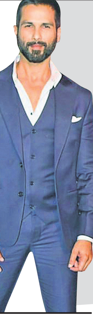
ଶାହିଦ କପୁରଙ୍କ ଫିଲ୍ମ 'ଡେରି ବାଗେ ମୋଁ ଏବା ଉଲଖା ଲିଆ' ଚଳଚ୍ଚିତ୍ର ଦେଖିବା ପାଇଁ ପୁସ୍ୟାଲ ଯିବାକୁ ଯାଉଥିବା ବେଳେ ଶାହିଦଙ୍କ ଅଚାନକ ସରପ୍ରାଇଜ ହେଉଥିଲା ।