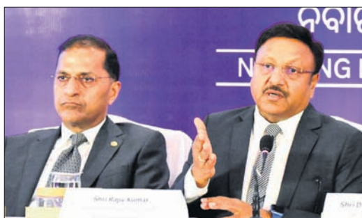
ଖବରଦାତା ସମ୍ମିଳନୀରେ ଉପସ୍ଥିତ ରାଜ୍ୟର ଜିଲ୍ଲାପାଳ ଓ ଏସ୍ପିଙ୍କୁ ନିର୍ଦ୍ଦେଶ ଦେଇଛନ୍ତି।

ସମସ୍ତ ରାଜନୈତିକ ଦଳ ପ୍ରତି ସମାନ ଆଚରଣ ଯୋଷା କରିବାକୁ ଭାରତର ମୁଖ୍ୟ ନିର୍ବାଚନ କମିଶନର (ସିଇସି) ରାଜୀବ କୁମାର ରାଜ୍ୟର ସମସ୍ତ ଜିଲ୍ଲାପାଳ ଓ ଏସ୍ପିଙ୍କୁ ନିର୍ଦ୍ଦେଶ ଦେଇଛନ୍ତି। ଏଥିସହ ପେଟ୍ ସ୍ୱାକ୍ତ ଚକ୍ର ପାଇଁ ଏକ ସ୍ୱତନ୍ତ୍ର କମିଟି ଗଠନ କରାଯାଇ ତଦନ୍ତ କରାଯିବ। ଅଭିଯୋଗ ସତ