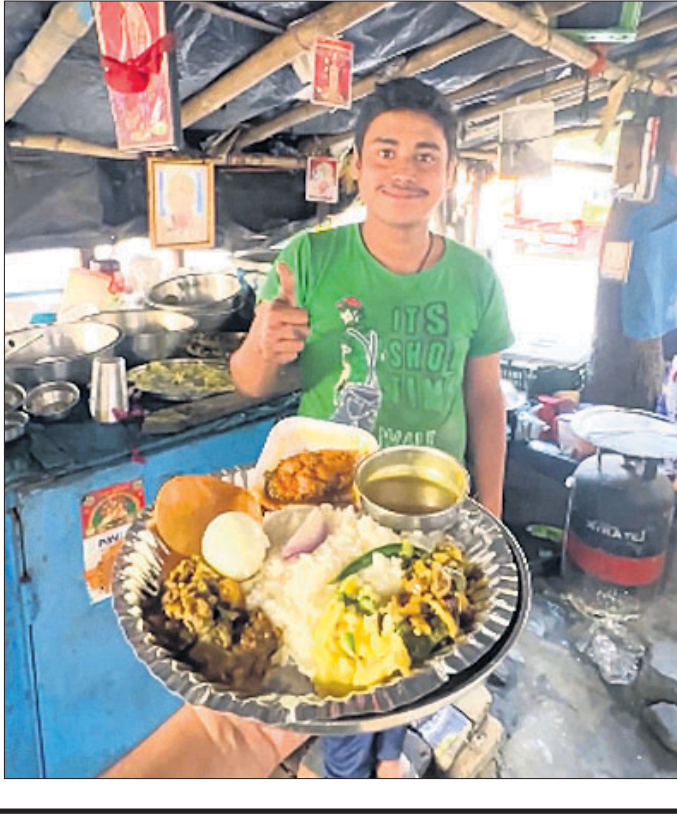
କୋଲକାତାରେ ୧୯ ବର୍ଷୀୟ ଯୁବକ ଏକା ହୋଟେଲ ଚଳାଉଛନ୍ତି ।

ଯଦି କେହି କୌଣସି ଏକ କାର୍ଯ୍ୟ କରିବାକୁ ସଂକଳ୍ପ ନେଇଥାଏ, ତେବେ କାର୍ଯ୍ୟ ସମ୍ପାଦନ କରିବାକୁ ସମର୍ଥନ ଦେବାକୁ ପଡ଼ିଥାଏ । ଏକା ହୋଟେଲ ଚଳାଉଛନ୍ତି ୧୯ ବର୍ଷୀୟ ଯୁବକ ।