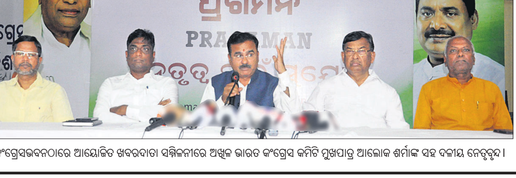
କଂଗ୍ରେସକର୍ମୀମାନେ ଆଲୋଚନା କରିବା ପାଇଁ ଏକ ସଭାରେ ଅଧିବେଶନ କରିଛନ୍ତି।