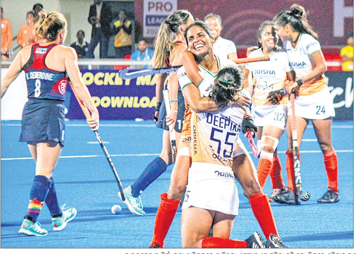
ରାଉରକେଲା ବିର୍ସା ମୁଖା ଷ୍ଟାଡ଼ିୟମରେ ଚାଲିଥିବା ଏଫଆଇଏଚ୍ ମହିଳା ହକି ପ୍ରୋ ଲିଗ୍‌ରେ ଶନିବାର ଅଷ୍ଟ୍ରେଲିଆକୁ ହରାଇବା ପରେ ଭଲସିଡ଼ ଭାରତୀୟ ଖେଳାଳି । ଚାଇନା ଓ ଆମେରିକା ମଧ୍ୟରେ ଅନୁଷ୍ଠିତ ମ୍ୟାଚ୍ ।