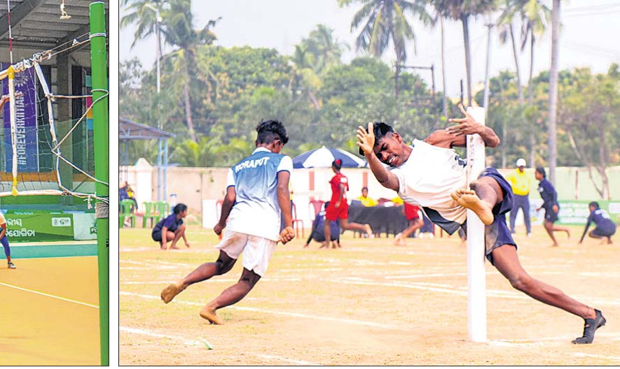
ନୂଆ-ଓ' କାର୍ଯ୍ୟକ୍ରମ ଅନ୍ତର୍ଗତ ଭଲିବଲ୍ ଓ ଖୋ-ଖୋରେ ଖେଳାଳିମାନେ ସେମାନଙ୍କ ବୌଦ୍ଧି ପ୍ରଦର୍ଶନ କରୁଛନ୍ତି ।