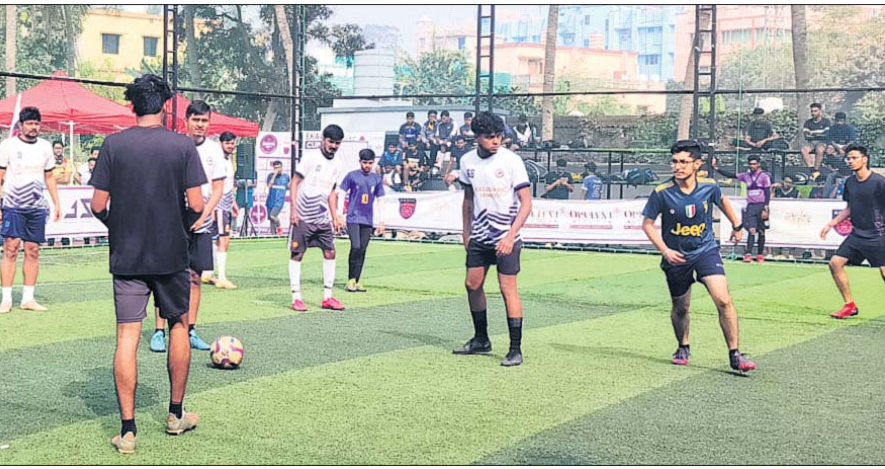
ଏକାମ୍ର କପ୍ ଷ୍ଟିର୍ ପୁଟବଲ ମ୍ୟାଚ୍‌ର ଦୃଶ୍ୟ ।

ଏହି ପ୍ରତିଯୋଗିତାରେ ମୋଟ ୪୦ଟି ଦଳ ଅଂଶଗ୍ରହଣ କରିଛନ୍ତି । ଏଥିରେ ରାଜ୍ୟର ୬ ଜିଲାରୁ ୩୮ଟି ଏବଂ କଲେଜରେ ପଢୁଥିବା ବିଦେଶୀ ପିଲାମାନଙ୍କୁ ନେଇ ୨ଟି ଚମ୍ପିୟନ ଅଂଶଗ୍ରହଣ କରିଛନ୍ତି । ଗୁପ୍ତ ଓ ନକ୍ସାଭଙ୍ଗ ଭିତ୍ତିରେ ଏହି ପୁରୀମେଣ୍ଟ ଅନୁଷ୍ଠିତ ହେଉଛି । ରବିବାର ପ୍ରତିଯୋଗିତା ଉଦ୍‌ଘାଟିତ ହେବ । ରାଜ୍ୟରେ ପୁଟବଲ ସଂସ୍କୃତି ସୃଷ୍ଟି କରିବା ଲକ୍ଷ୍ୟ ନେଇ ଜଗରନଟ୍ ସ୍ପୋର୍ଟ୍‌ସ୍ ଫାଉଣ୍ଡେସନ ପକ୍ଷରୁ ଏହି ପୁରୀମେଣ୍ଟ ଆୟୋଜନ କରାଯାଇଛି ।