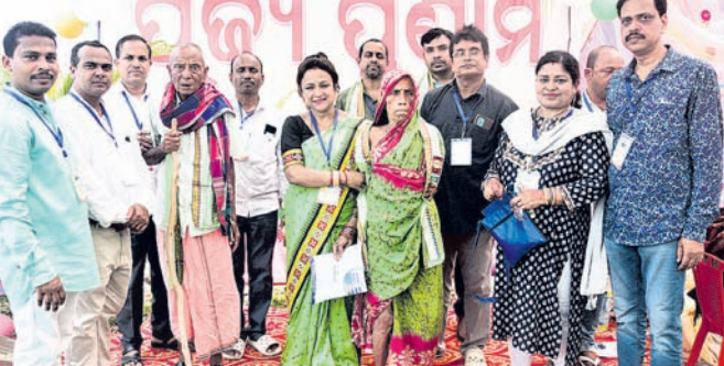
ଆଞ୍ଚଳିକ ବିକାଶ ପରିଷଦ ପକ୍ଷରୁ ଆୟୋଜିତ ପୂଜ୍ୟ ପୂଜା ସମାରୋହ ।