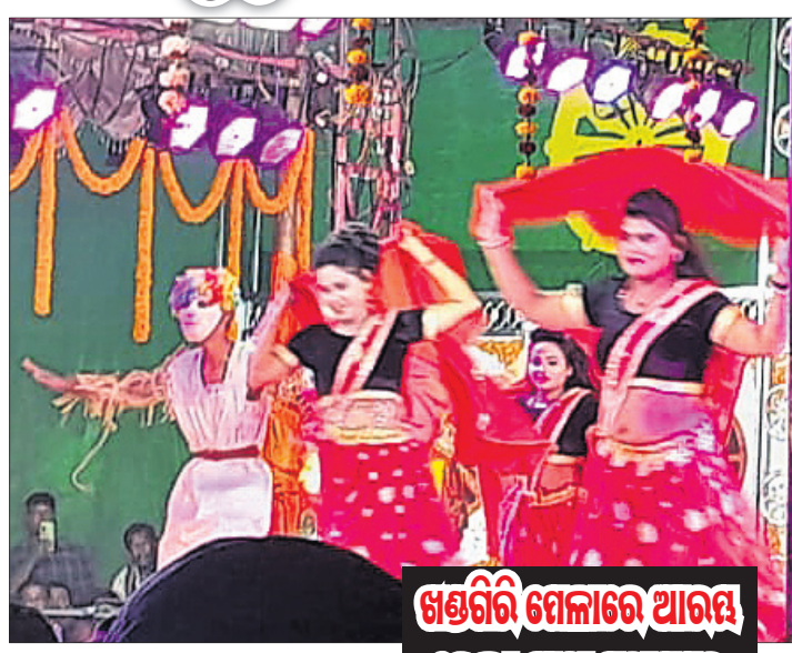
ଖଣ୍ଡଗିରି ମେଳାରେ ଆରମ୍ଭ ହେଲା ଯାତ୍ରା ମହାସମର

ପ୍ରସିଦ୍ଧ ଖଣ୍ଡଗିରି କୁସମେଳା ଅବସରରେ ରବିବାରଠୁ ଖଣ୍ଡଗିରି ଯାତ୍ରା ମହାସମର ଆରମ୍ଭ ହୋଇଛି। ପ୍ରଥମ ଦିନରେ ଦର୍ଶକଙ୍କୁ ଆକର୍ଷିତ କରୁଥିବା ଭଳି ନାଟକ ଥିବାକୁ ଭିତ୍ତ ଦେଇ ଦେଖିବାକୁ ମିଳିଛି। ଏମିତିକି ଦିନ ୧୦ଟାରୁ ସାଧାରଣ ବର୍ଗ ଚିକେଟ ସରିଯାଇଥିଲା। ହେଲେ ବି ଚିକେଟ କାଉଣ୍ଡରରେ କାହିଁରେ କେତେ ଭିଡ଼ ଲାଗି ରହିଥିଲା। ଅଗ୍ରମ ଚିକେଟ ବୁକ୍ ପାଇଁ ଲାଇନ ଲାଗିଥିଲା। ରବିବାର ୫ଟି ପେଣ୍ଡାଲରେ ଯାତ୍ରା ପରିବେଷଣ ହୋଇଥିବାବେଳେ ସବୁତକ ନାଟକ ଦର୍ଶକଙ୍କୁ ଏକ ଆବେଗରେ ବାନ୍ଧି ରଖୁଥିଲା। ଶୀର୍ଷକରୁ ହିଁ ନାଟକଗୁଡ଼ିକ ଆଖି ଭିଜାଇବ ବୋଲି କୁହାଯାଉଥିବାବେଳେ ତାହା ହିଁ ଦେଖିବାକୁ ମିଳିଥିଲା।