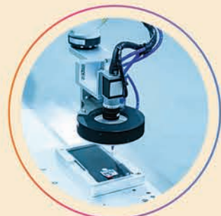
ଇଲେକ୍ଟ୍ରୋନିକ ମାଡୁଫାକରଣିଙ୍ଗ ହବ୍