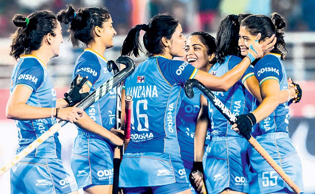
ଗୋଲ୍ ଖୋର କରିବା ପରେ ଉଲ୍ଲାସିତ ଭାରତୀୟ ଖେଳାଳି।