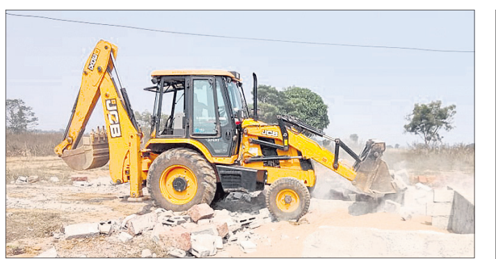
ଶାମପୁରରେ ଜବରଦଖଲ ଉଚ୍ଚେଦ ସମୟର ଫଟୋ ।

ନିଜ ଜମିକୁ ସୁରକ୍ଷା ଦେବାରେ ଭୁବନେଶ୍ୱର ଉନ୍ନୟନ କର୍ତ୍ତୃପକ୍ଷ (ବିଡିଏ) ବିଫଳ ହେଉଛି । ଆଫର୍ଡେବଲ୍ ହାଉସିଂ ପ୍ରକଳ୍ପ ନାଁରେ ସାଧାରଣ ପ୍ରଶାସନ ବିଭାଗ ଶାମପୁର ମୌଜାରେ ବିଡିଏକୁ ଦେଇଥିବା ୬୮.୪୪୫ ଏକର ଜମିକୁ ବେଆଇନ ନିର୍ମାଣ ହଟିବା ବଦଳରେ ବଜ୍ରପୁର ନକସାକୁ ଆସିଛି । କାର୍ତ୍ତବୀରୀ ୨୯ରେ ତରବରିଆ ଭାବେ ବିଡିଏ ଏନ୍‌ଫୋର୍ସମେଣ୍ଟ ଟିମ୍ ବିନା ପୋଲିସ୍ ସହାୟତାରେ ଉଚ୍ଚେଦ କରିବାକୁ ଯାଇ କିଛି ମୂଲ୍ୟୁଆ ଓ ପାଚେରି ଭାଙ୍ଗି ଫେରିଥିଲା । ଇତି ମଧ୍ୟରେ ୨୦ଦିନ ବିତିଥିବାବେଳେ ବିଡିଏର ଉଚ୍ଚେଦ କଥା ତ ଦୂରର କଥା । ଏନେଇ ପରବର୍ତ୍ତୀ ଆଲୋଚନା ମଧ୍ୟ କରାଯାଇନାହିଁ । ଫଳରେ ଉଚ୍ଚ ଜମିରେ ପୁଣି ବେଧଡ଼କ ନିର୍ମାଣ ଚାଲୁଥିବା ନଜରକୁ ଆସିଛି ।