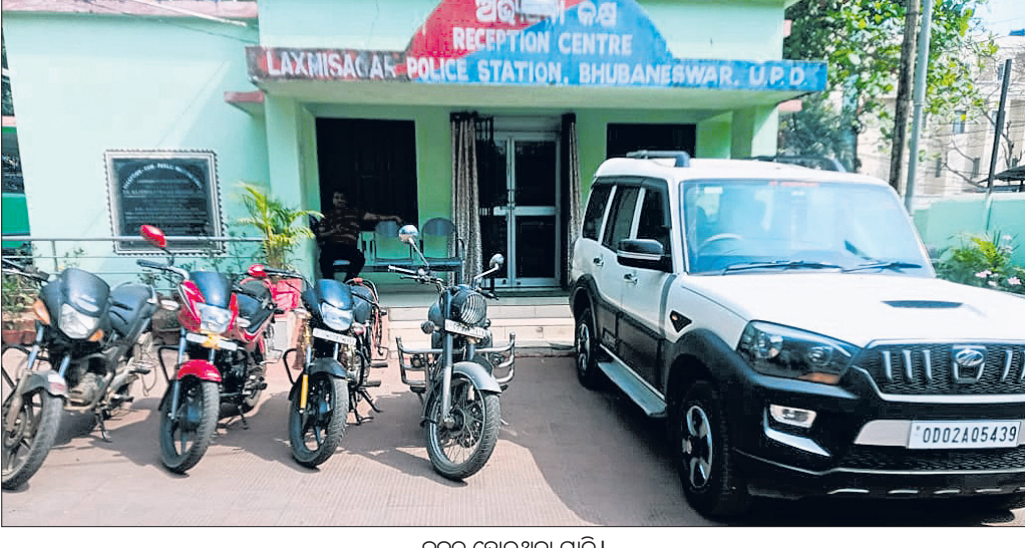
ଜବତ ହୋଇଥିବା ଗାଡ଼ି ।

ରାଜଧାନୀରେ ମଦ୍ୟପ ଚାଳକଙ୍କ ବିରୋଧରେ ଭୁବନେଶ୍ୱର ସହରାଞ୍ଚଳ ଜିଲା ପୋଲିସ୍ ସେଣାଲ ଡ୍ରାଇଭ୍ କରି କାର୍ଯ୍ୟାନୁଷ୍ଠାନ ଗ୍ରହଣ କରୁଛି । ଏହି ଡ୍ରାଇଭ୍‌ରେ ଶନିବାର ରାତିରେ ଭୁବନେଶ୍ୱରର ବିଭିନ୍ନ ଥାନା ଅଞ୍ଚଳରେ ୧୨ଜଣ ମଦ୍ୟପ ଚାଳକ ଧରାପଡ଼ିଛନ୍ତି । ଏନେଇ ୧୨ ମାମଲା ରୁଜୁ କରାଯାଇ ସେମାନଙ୍କୁ ୧୨ଟି କାର୍ ଓ ବାଇକ୍ ଜବତ କରାଯାଇଛି ।