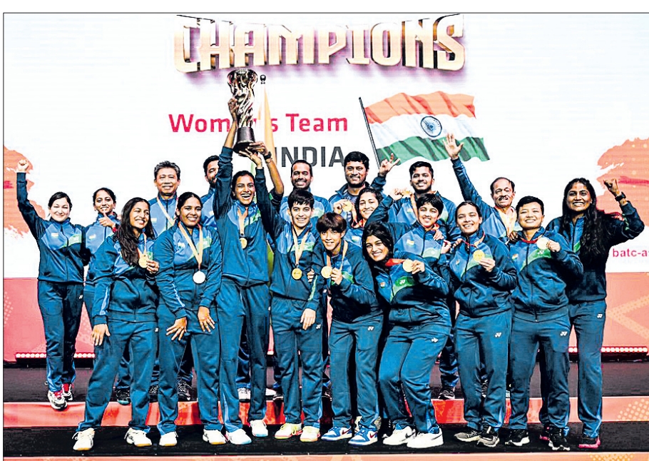
ଚୁପ୍ଟି ସହ ବ୍ୟାଡ୍ମିଣ୍ଟନ ଏସିଆ ଚିମ୍ପ ଚାମ୍ପିୟନଶିପ୍‌ର ଚାଇନେସ ବିଜେତା ଭାରତୀୟ ମହିଳା ଦଳ।

ଫସଲର ସର୍ବନିମ୍ନ ସହାୟକ ମୂଲ୍ୟ (ଏମ୍‌ଏସ୍‌ସି) ଉପରେ ଆଇନଗତ ଗ୍ୟାରେଣ୍ଟି ଦାବି ନେଇ ଚାଷୀ ଆନ୍ଦୋଳନ କରି ରହିବାବେଳେ ରବିବାର ରାତିରେ କେନ୍ଦ୍ରମନ୍ତ୍ରୀମାନଙ୍କ ଏକ କମିଟି କୃଷକ ନେତାମାନଙ୍କ ସହ ଚଞ୍ଚିଗଡ଼ରେ ଚତୁର୍ଥ ପର୍ଯ୍ୟାୟ ଆଲୋଚନା କରିଛନ୍ତି। ଏଥିରେ କେନ୍ଦ୍ର କୃଷି ଓ କୃଷକ କଲ୍ୟାଣ ମନ୍ତ୍ରୀ ଅର୍ଜୁନ ମୂଷା, ବାଣିଜ୍ୟ ଓ ଶିଳ୍ପମନ୍ତ୍ରୀ ପାଠ୍ୟଶ୍ରୀ ଗୋୟଲ ଏବଂ ସ୍ୱଚ୍ଛ ଚାଷୀମନ୍ତ୍ରୀ ନିତ୍ୟାନନ୍ଦ ରାୟ ଯୋଗ ଦେଇଥିଲେ। ଆଲୋଚନା ପରେ ଗୋୟଲ କହିଛନ୍ତି, ସମବାୟ ସମିତିରୁ ଫସଲ କିଣିବା ପାଇଁ ସରକାରଙ୍କ ସହ ୫ ବର୍ଷ ପାଇଁ ଚୁକ୍ତିବଦ୍ଧ ହେବେ। ଚାଷୀନେତାଙ୍କ ସହ ଆଲୋଚନା ସକାରାତ୍ମକ ରହିଛି। ସରକାରଙ୍କ ଏହି ପ୍ରସ୍ତାବ ଉପରେ ସୋମବାର ଚାଷୀନେତା ସେମାନଙ୍କ ନିଷ୍ପତ୍ତି ଶୁଣାଇବେ ବୋଲି ଗୋୟଲ କହିଛନ୍ତି।