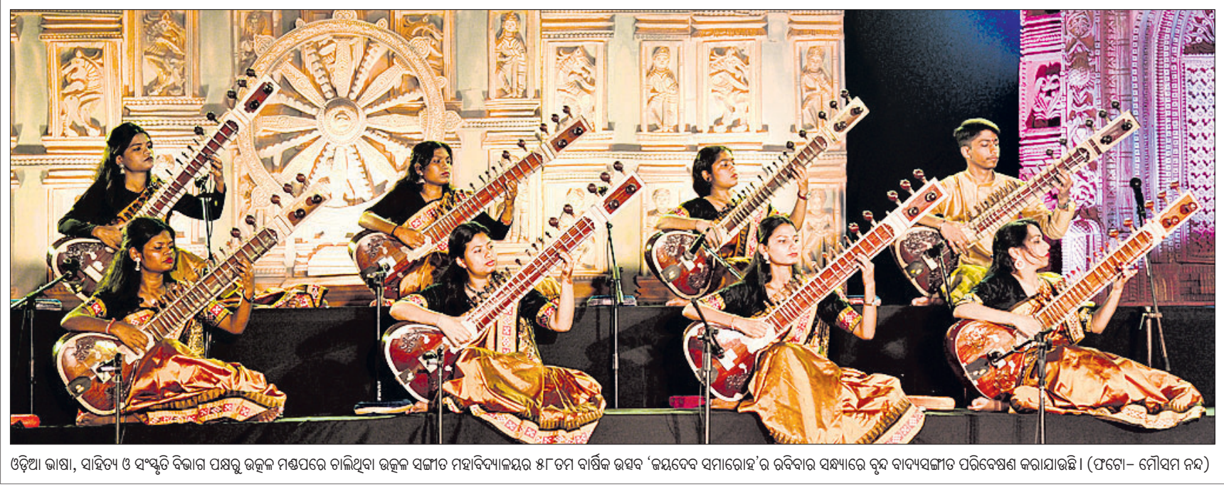
ଓଡ଼ିଆ ଭାଷା, ସାହିତ୍ୟ ଓ ସଂସ୍କୃତି ବିଭାଗ ପକ୍ଷରୁ ଉତ୍କଳ ମଣ୍ଡପରେ ଚାଲିଥିବା ଉତ୍କଳ ସଙ୍ଗୀତ ମହାବିଦ୍ୟାଳୟର ୫୮ତମ ବାର୍ଷିକ ଉତ୍ସବ 'କନ୍ୟାଦେବ ସମାରୋହ'ର ରବିବାର ସନ୍ଧ୍ୟାରେ ବୃନ୍ଦ ବାଦ୍ୟସଙ୍ଗୀତ ପରିବେଷଣ କରାଯାଇଛି।

ସେଲ୍ଫି ପଠାଇବା ସମୟରେ ନିଜର ନାମ ଏବଂ ମୋବାଇଲ ନମ୍ବର ଦେବାକୁ ଭୁଲିଲୁ ନାହିଁ। ଯୋଗ୍ୟ ବିବେଚିତ ଫଟୋ ପ୍ରକାଶ ପାଇବ।