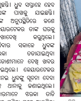
ଏପରିକି ଘରୁ ଚୋରମାନେ ଏସି, ହାତ ଘଣ୍ଟା ଆଦି ମଧ୍ୟ ନେଇ ନାହାନ୍ତି। ପୋଲିସ ଚିମ୍ପି ସମ୍ପାଦନା କରୁଥିବା ସହ ଘଟଣାସ୍ଥଳରେ ପହଞ୍ଚି ତଦନ୍ତ ଆରମ୍ଭ କରିଥିଲା। ତେବେ ଗ୍ଲାମାୟ ଅଞ୍ଚଳରେ ସିସିଟିଭି ଫୁଟେଜ୍ ଯାଞ୍ଚ କରି ଚୋରଙ୍କୁ ଧରିବାକୁ ପ୍ରୟାସ କରାଯାଉଥିବା ପୋଲିସ ପକ୍ଷରୁ ସୂଚନା ଦିଆଯାଇଛି।