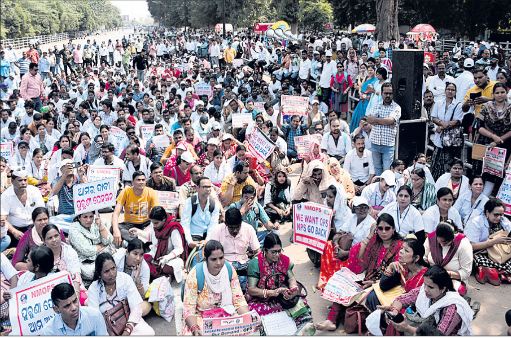
ପୁରୁଣା ଯେନ୍ସନ୍ ବ୍ୟବସ୍ଥା ଲାଗୁ ହେବାର ପୂର୍ଣ୍ଣ ଆୟୋଜନ ଚଳିଛି ।

କମ୍ପ୍ୟୁଟର ଶିକ୍ଷକ ଏବଂ ମୁଖ୍ୟ ଶିକ୍ଷକ ଭାବରେ ଗ୍ରହଣ କରିବା, କନିଷ୍ଠ କ୍ରୀଡ଼ା ଶିକ୍ଷକ ଚାକିରି ନିୟମିତ କରିବା ଆଦି ଆଦର୍ଶ ବିଦ୍ୟାଳୟ ପକ୍ଷରୁ ପ୍ରସ୍ତାବ ଦିଆଯାଇଛି । ଆୟୋଜନରେ ଆଦର୍ଶ ବିଦ୍ୟାଳୟ ଶିକ୍ଷକ ଗ୍ରହଣ କରିବା ଆଦି ଆଦର୍ଶ ବିଦ୍ୟାଳୟ ପକ୍ଷରୁ ପ୍ରସ୍ତାବ ଦିଆଯାଇଛି । ଆୟୋଜନରେ ଆଦର୍ଶ ବିଦ୍ୟାଳୟ ଶିକ୍ଷକ ଗ୍ରହଣ କରିବା ଆଦି ଆଦର୍ଶ ବିଦ୍ୟାଳୟ ପକ୍ଷରୁ ପ୍ରସ୍ତାବ ଦିଆଯାଇଛି ।