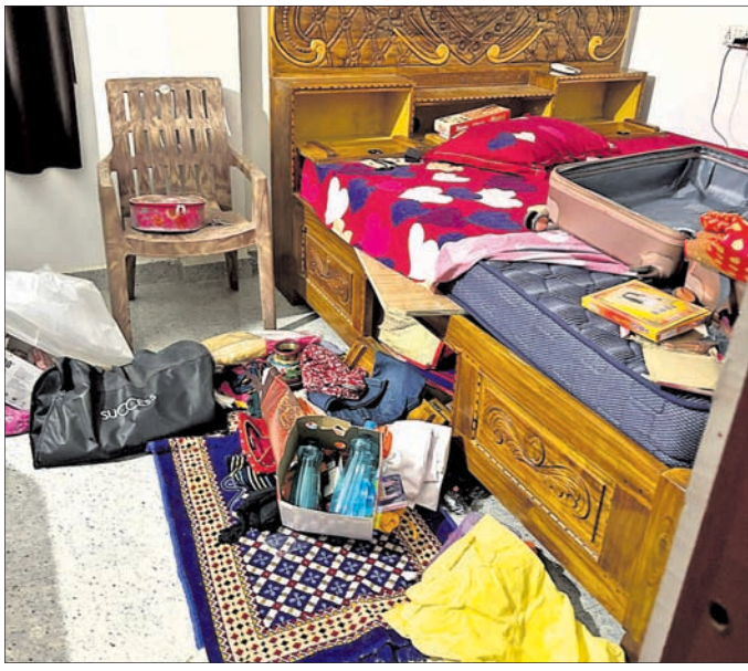
ବାସୁ ବିହାରର ଏକ ଘରେ ଚୋରି ପରେ ବିନିଷପତ୍ର ଏଣେତେଣେ ପଡ଼ିଛି।

ସମେତ କେତେକ ଘର ମୁଖ୍ୟ ଫାଟକ ଚାକିରୀ କରୁଛନ୍ତି। ଗୋଟିଏ ରାତିରେ ବିଭିନ୍ନ ସଂସ୍ଥାର ଅଫିସ ସମେତ ୫ଟି ଘର ଚୋରି ହୋଇଥିବା ପିପିଲି ଥାନାରେ ଅଭିଯୋଗ କରାଯାଇଛି। ପିପିଲି ଗୋଲ୍ଡ ଗେଟ ନିକଟବର୍ତ୍ତୀ ବାସୁ ବିହାରରେ ଥିବା ଅଫିସର ତାଲା ଭାଙ୍ଗି ସିସିଟିଭି ହାର୍ଡଡିସ୍କ ଚୋରି କରାଯାଇଛି। ନେଇଥିବା ସହ ଗବେଷକ ଭାଙ୍ଗି ଫାଇଲପତ୍ର ଫିଙ୍ଗି ହୋଇଥିବା ଦେଖିବାକୁ ମିଳିଛି। ଘର ନମ୍ବର ୨୨,୨୬,୧୯