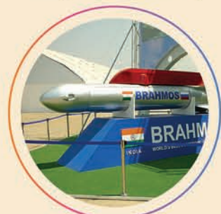
ଡିଫେନ୍ସ ଇଣ୍ଡଷ୍ଟ୍ରିଆଲ ହବ୍