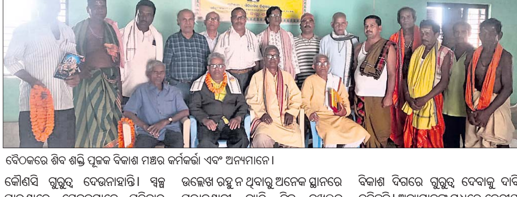
ଦୈନିକରେ ଶିବ ଶକ୍ତି ପୁସ୍ତକ ବିକାଶ ମଞ୍ଚର କର୍ମକର୍ତ୍ତା ଏବଂ ଅନ୍ୟମାନେ।