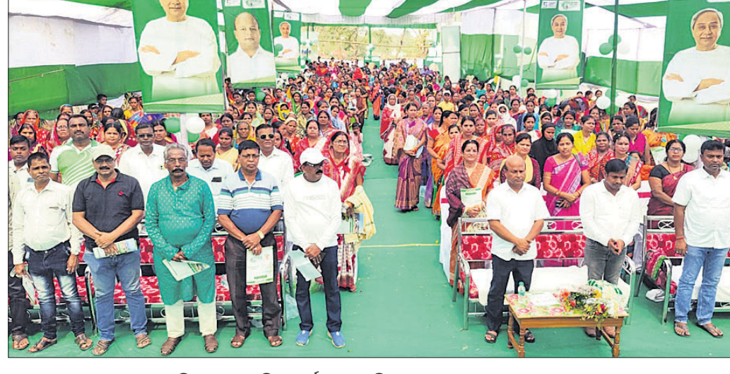
କୁମାରୀ ପଞ୍ଚାୟତରେ ଆମ ଓଡ଼ିଶା ନବୀନ ଓଡ଼ିଶା କାର୍ଯ୍ୟକ୍ରମରେ ବିଧାୟକ, ବ୍ଲକ୍ ଅଧ୍ୟକ୍ଷ ଓ ଅନ୍ୟମାନେ ।