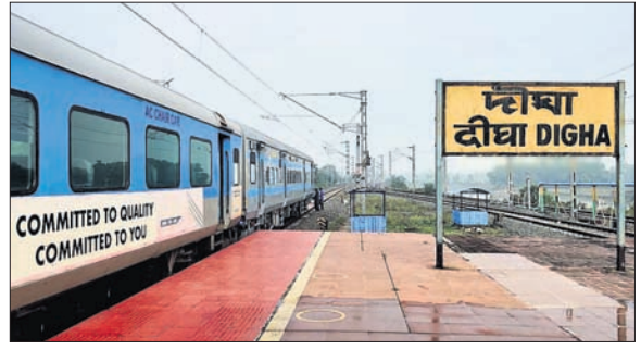
ଦୀଘା ରେଳ ଷ୍ଟେସନ

ଭୋଗରାଇ, ୧୯୧୨ (ପ୍ରବାସ ଦାସ) ଓଡ଼ିଶା-ପଶ୍ଚିମବଙ୍ଗ ସୀମାନ୍ତରେ ଦୀଘା-ଜଳେଶ୍ୱର ରେଳପଥର ଉପରେ ଏବେ ଅନିଶ୍ଚିତତା ମଧ୍ୟରେ। ଏହାର କାର୍ଯ୍ୟକାରୀତା ନେଇ ଉଭୟ ଓଡ଼ିଶା-ପଶ୍ଚିମବଙ୍ଗ ସୀମାନ୍ତରେ ରହିଛି। ଏକମାତ୍ରରେ ଉଭୟ ଓଡ଼ିଶା-ପଶ୍ଚିମବଙ୍ଗ ରାଜ୍ୟ ସହିତ କେନ୍ଦ୍ର ସରକାରଙ୍କ ଛୁଟିକାକୁ ନେଇ ରାଜନୈତିକ ମହଲରେ ଚିନ୍ତାଧାରଣ ଆରମ୍ଭ ହୋଇଛି। ଚଳିତ ଅନ୍ତରାଳରେ ରେଳ ବନ୍ଦରେ ଦୀଘା-ଜଳେଶ୍ୱର ରେଳପଥ ପ୍ରକଳ୍ପ ଚଳେଇ ରଖିବା ପାଇଁ ମାତ୍ର ୧୫କୋଟି ଟଙ୍କା ଟୋକନ ଆଲୋଚନା କରାଯାଇଛି। ଦୀଘା-ଜଳେଶ୍ୱର ରେଳପଥ ପ୍ରକଳ୍ପ କାର୍ଯ୍ୟ ନିମନ୍ତେ ରେଳ ବନ୍ଦରେ କ୍ରମାଗତ ଆର୍ଥିକ ଅନୁଦାନ ନିମ୍ନୋକ୍ତ ହେବାରୁ ଏହାର କାର୍ଯ୍ୟକାରୀତା ନିମନ୍ତେ ଅନିଶ୍ଚିତତା ଦେଖାଦେଇଛି।