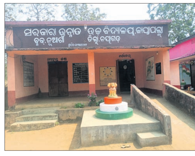
କାମୁସାହି ସରକାରୀ ଉଚ୍ଚ ବିଦ୍ୟାଳୟ।

ନୟାଗଡ଼ ଜିଲ୍ଲା ନୂଆଗାଁ ବ୍ଲକ୍ କାମୁସାହି ପଞ୍ଚାୟତ କାମୁସାହି ସରକାରୀ ଉନ୍ନତ ଉଚ୍ଚ ବିଦ୍ୟାଳୟଟି ନାନା ସମସ୍ୟା ଦେଇ ଗତି କରୁଥିବା ଅଭିଯୋଗ ହେଉଛି। ଏପରି କାଳିଠାରୁ ମାଟ୍ରିକ୍ ପରୀକ୍ଷା ଆରମ୍ଭ ହେବାକୁ ଥିବା ବେଳେ ଶିକ୍ଷକ ଅଭାବ ଯୋଗୁଁ ଛାତ୍ରୀଛାତ୍ର ପାଠ ନ ପଢ଼ି ପରୀକ୍ଷା ଦେବାକୁ ଯିବା କଥା ଅଭିଭାବକମାନଙ୍କ ମନରେ ଚିନ୍ତା ବଢ଼ାଇ ଦେଇଛି। ଛାତ୍ରୀଛାତ୍ରମାନେ ଦୂରକୁ ନ ଯାଇ କିଲି ଗାଁ ପାଖରେ ହାତୀକୁଳ ଶିକ୍ଷା ପାଇପାରିବେ ସେଥିପାଇଁ ପ୍ରତି ପଞ୍ଚାୟତରେ ହାତୀକୁଳ ଖୋଲିବାର ସରକାର ନିଷ୍ପତ୍ତି ନେଇଥିଲେ। ସେହିକ୍ରମରେ ନୟାଗଡ଼ ଜିଲ୍ଲା ନୂଆଗାଁ ବ୍ଲକ୍ କାମୁସାହି ପଞ୍ଚାୟତରେ କାମୁସାହି ଯୁକ୍ତି-ବଳ ସ୍ତଳ ସହ ହାତୀକୁଳକୁ ଯୋଡ଼ି ଦିଆଯାଇଥିଲା। କାମୁସାହି ସରକାରୀ ଉଚ୍ଚତର ସରକାରୀ ଉଚ୍ଚ ବିଦ୍ୟାଳୟ ୨୦୨୨ ଜୁଲାଇରେ ପ୍ରତିଷ୍ଠା ହୋଇ ବିଧାୟକ ଓ ସ୍ଥାନୀୟ ନେତାମାନଙ୍କ ଦ୍ୱାରା ଉଦ୍‌ଘାଟନ କରାଯାଇଥିଲା। ଏକଜଣ ଛାତ୍ରୀଛାତ୍ର