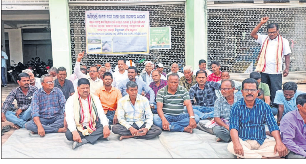
ଜଳନିଷ୍କାସନ ସମସ୍ୟାର ସମାଧାନ ଦାବିରେ ଚାଷୀମାନେ ଧାରଣା ଦେଇଛନ୍ତି ।

ବନ୍ୟା ପରେ ଚାଷ ଜମିରୁ ଜଳ ନିଷ୍କାସନ ହୋଇପାରୁ ନ ଥିବାରୁ ଚାଷୀମାନେ ସମସ୍ୟା ଅନୁଭବ କରୁଛନ୍ତି । ଧାରଣା ପ୍ରଶାସନକୁ ସୋମବାର ଏକ ଦାବିପତ୍ର ପ୍ରଦାନ କରିଛନ୍ତି । ବାରମ୍ବାର ଜଳ ନିଷ୍କାସନ ସମସ୍ୟା ଦୂର କରିବା ନେଇ ଅଭିଯୋଗ କରୁଥିଲେ ମଧ୍ୟ ପ୍ରଶାସନ ଏ ଦିଗରେ କୌଣସି ପଦକ୍ଷେପ ଗ୍ରହଣ କରୁନାହିଁ କିମ୍ବା କୌଣସି କାର୍ଯ୍ୟାନୁଷ୍ଠାନ ହାତକୁ ନେଇନାହିଁ । ବରା ବୁକର କରୁଥିବା ଯୋଗାଣ ପ୍ରଣାଳୀ, ବାଲିବିଲି, ଅରଜାବାଦ ଓ ବରା ର ଚାଷୀ ଏହି ଜଳ ନିଷ୍କାସନ ସମସ୍ୟା ନେଇ ନାହିଁ ନ ଥିବା ହଇଜାଣ ହେଉଛନ୍ତି । ଉପରୋକ୍ତ ଚାଷୀଙ୍କ ଜମି ନିକଟରେ