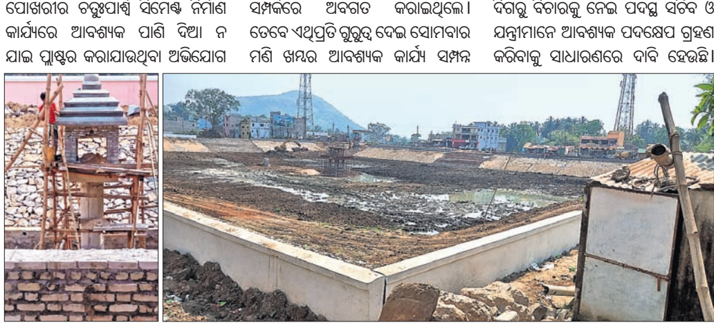
ପୋଖରୀ ମଧ୍ୟରେ ନିର୍ମାଣ ହୋଇଥିବା ମଣି ଖମ୍ବ। ଅଳ୍ପ ଗଭୀର ଖୋଳା ଯାଇଥିବା ପୋଖରୀକୁ ପକ୍ଷ ଉଦ୍ଧାର କରାଯାଇନାହିଁ।

କରାଯାଇଥିବା ପ୍ରକଳ୍ପ ଦାୟିତ୍ୱରେ ଥିବା ସାଧାରଣ ଲୋକମାନଙ୍କୁ ସୂଚନା ଦେବା ପାଇଁ କର୍ମଚାରୀଙ୍କୁ ନିର୍ଦ୍ଦେଶ ଦିଆଯାଇଥିବା ବେଳେ ନିର୍ମାଣ କାର୍ଯ୍ୟରେ ଆବଶ୍ୟକ ପାଣି ଦିଆଯାଉଥିବା ସେ ପ୍ରକାଶ କରିଛନ୍ତି। ଆସିଥିବା ବେଳେ ସ୍ଥାନୀୟ ଅଞ୍ଚଳର ପରିବେଶବିତ୍ ଅର୍ଚ୍ଚନାମା ସାହୁ ପୋଖରୀ ମଧ୍ୟରେ ନିର୍ମାଣ ହୋଇଥିବା ମଣି ଖମ୍ବର କେତେକ ତ୍ରୁଟି ସମ୍ପର୍କରେ ତାଙ୍କର ଦୃଷ୍ଟି ଆକର୍ଷଣ କରିଥିଲେ। ମଣି ଖମ୍ବର ସାଧାରଣରେ ପ୍ରଶ୍ନବାଚୀ ଦୃଷ୍ଟି ହୋଇଛି। ପୋଖରୀର ଚତୁର୍ପାଶ୍ୱୀ ସିମେଣ୍ଟ ନିର୍ମାଣ କାର୍ଯ୍ୟରେ ଆବଶ୍ୟକ ପାଣି ଦିଆ ନ ଯାଇ ପୁଷ୍ପର କରାଯାଉଥିବା ଅଭିଯୋଗ