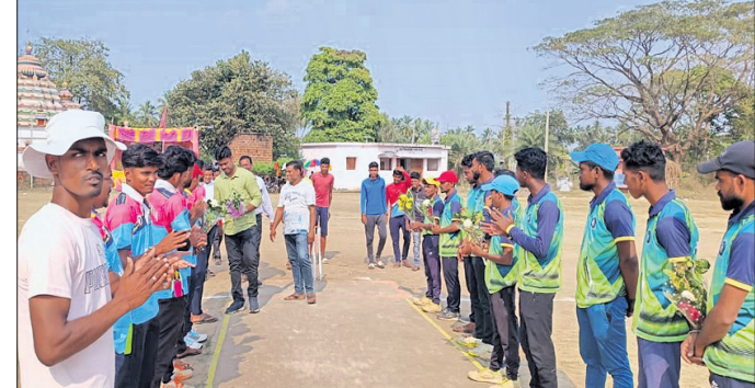
ଅତିଥିମାନେ ଉଭୟ ଦଳର ଖେଳାଳିଙ୍କୁ ସାଗତ କରୁଛନ୍ତି।

ନେଇ ସର୍ବଶ୍ରେଷ୍ଠ ଖେଳାଳି ରୂପେ ପୁରସ୍କାର ଗ୍ରହଣ କରିଥିଲେ। ଖେଳରେ ପୁଷ୍ପ ଅତିଥି ଭାବେ ଶରଣକୁଳ ମହାବିଦ୍ୟାଳୟର ରାଜନାଥ ବିଜ୍ଞାନ ଅଧ୍ୟାପକ ଅର୍ଚ୍ଚନାମା ବନାମ ବିସିସି, ଲୋଧାପୁଆ, ସୁନାଖଳା ମଧ୍ୟରେ ଅନୁଷ୍ଠିତ ହୋଇଥିଲା। ଖେଳରେ ଚମ୍ପିୟାନ ଟିମ୍ ଶାଳଝରିଆ ଦଳ ବ୍ୟାଟିଂ ନିଷ୍ପତ୍ତି ନେଇ ନିର୍ଦ୍ଧାରିତ ୧୫୦ରୁ କମ୍ରେ ୧୪୧ର ନେଇ ସଂଗ୍ରହ କରି ଥିଲେ ଆଉଟ ହୋଇଥିଲା। ଜବାବରେ ସୁନାଖଳା ଦଳ ନିଭାରେ ୧୫ ୦ରୁ କମ୍ରେ ୬ ରନରେ ହରାଇ ୧୧୫ରୁ କମ୍ରେ ୬ ରନରେ ହରାଇ ଫଳରେ ଶାଳଝରିଆ ଦଳ ୨୭ରନରେ ବିଜୟୀ ହୋଇଥିଲା। ଶାଳଝରିଆ ଦଳର କୋଚ୍ ୩୭ ରନ ସହ ଗୋଟିଏ ରନରେ ବିଜୟୀ ହୋଇଥିଲେ।