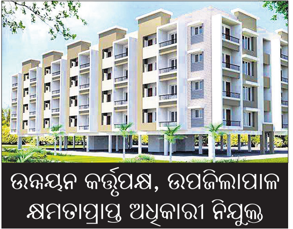
ଉଚ୍ଚଯତ୍ନ କର୍ତ୍ତୃପକ୍ଷ, ଉପଜିଲ୍ଲାପାଳ କ୍ଷମତାପ୍ରାପ୍ତ ଅଧିକାରୀ ନିଯୁକ୍ତ

ଭୁବନେଶ୍ୱର, ୧୯/୨ (ଅନିଲ ଦାସ) ବହୁ ପ୍ରକାଶା ପରେ ଆପାର୍ଟମେଣ୍ଟ ମାଲିକମାନଙ୍କୁ ସୁରକ୍ଷା ଦେବା ସକାଶେ ରାଜ୍ୟ ସରକାର ଓଡ଼ିଶା ଆପାର୍ଟମେଣ୍ଟ (ମାଲିକାନା ଓ ପରିଚାଳନା) ଆଇନ-୨୦୨୩ କାର୍ଯ୍ୟକାରୀ କରିଛନ୍ତି। ଏଥିପାଇଁ ରାଜ୍ୟ ସରକାର ରାଜ୍ୟରେ ଥିବା ୮ଟି ଉଚ୍ଚଯତ୍ନ କର୍ତ୍ତୃପକ୍ଷ (ଡେଭେଲପମେଣ୍ଟ ଅଥରିଟି) ଅଞ୍ଚଳ ପାଇଁ ସମ୍ପୂର୍ଣ୍ଣ ଉଚ୍ଚଯତ୍ନ କର୍ତ୍ତୃପକ୍ଷ ସହିତ ଏବଂ ଏହା ବାହାରେ ଥିବା ଅଞ୍ଚଳ ପାଇଁ ଉପଜିଲ୍ଲାପାଳଙ୍କୁ କ୍ଷମତାପ୍ରାପ୍ତ ଅଧିକାରୀ(କମ୍ପିଟେଣ୍ଟ ଅଥରିଟି) ଭାବେ ନିଯୁକ୍ତି ଦେଇଛନ୍ତି। ଆଇନକୁ କାର୍ଯ୍ୟକାରୀ କରିବା କିମ୍ବା କୌଣସି ସମସ୍ୟା ଦେଖାଦେଲେ ଉକ୍ତ