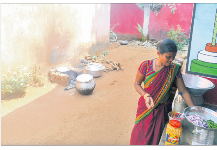
ରୋଷେଇ ଘର ନ ଥିବାରୁ ବାହାରେ ରନ୍ଧା ଯାଉଛି।

ନବମ ଶ୍ରେଣୀରେ ନାମ ଲେଖାଇଥିଲେ। ସେହି ଛାତ୍ରୀଛାତ୍ର ଚଳିତବର୍ଷ ଦଶମ ଶ୍ରେଣୀରେ ଅଧ୍ୟୟନ କରୁଥିଲେ। ପାଠପଢ଼ା ହୋଇ ନ ଥିବା କାରଣରୁ ସେହି ଏକଜଣ ଛାତ୍ରୀଛାତ୍ରମାନଙ୍କ ମଧ୍ୟରୁ ୨ଜଣ ପରୀକ୍ଷା ଦେବେ ନାହିଁ ଏବଂ ୬ ଜଣ ମାଟ୍ରିକ୍ ପରୀକ୍ଷା ଦେବେ। ହାତୀକୁଳ ପ୍ରତିଷ୍ଠା କରାଯାଇଥିଲେ