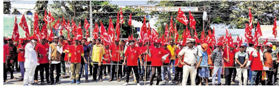
ସିପିଆଇ (ଏମ୍) କର୍ମୀମାନେ ଶୋଭାଯାତ୍ରାରେ ଯାଉଛନ୍ତି।