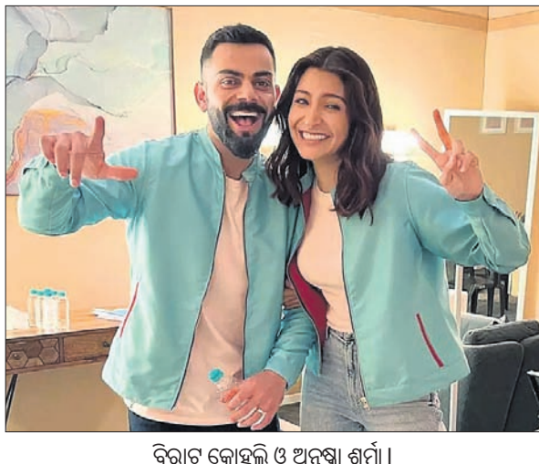
ବିରାଟ କୋହଲି ଓ ଅନୁଷ୍କା ଶର୍ମା ।

ନୂଆଦିଲ୍ଲୀ, ୨୦୧୨ ଭାରତୀୟ କ୍ରିକେଟର ବିରାଟ କୋହଲି ଦ୍ୱିତୀୟ ଥର ପାଇଁ ପିତା ହୋଇଛନ୍ତି। ମଙ୍ଗଳବାର କୋହଲିଙ୍କ ସ୍ତ୍ରୀ ଅନୁଷ୍କା ଶର୍ମା ଏହି ସୂତନା ଦେଇଛନ୍ତି। ଅନୁଷ୍କା ଇନ୍ଦ୍ରିୟାଗ୍ରାମରେ ଏକ ପୋଷ୍ଟ କରିଛନ୍ତି। ପରେ ବିରାଟ କୋହଲି ମଧ୍ୟ ସମାନ ପୋଷ୍ଟିକୁ ନିଜ ସୋସିଆଲ ମିଡିଆ ଆକାଉଣ୍ଟରୁ ଶେୟାର କରିଥିଲେ। ପୂର୍ବରୁ ଉଭୟଙ୍କର ତିନିଟି ଶିଶୁ ଏକ ଝିଅ ରହିଛି। ଫେବୃଆରୀ ୧୫ ତାରିଖରେ ପୁଅ ଜନ୍ମ ହୋଇଥିବା ଅନୁଷ୍କା ସ୍ୱପ୍ନ କରୁଛନ୍ତି। ସେ