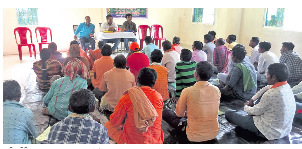
ତାଲିମ ଶିବିରରେ ଯୋଗଦେଇଥିବା ଚାଷୀ ।

ଚିତ୍ରକୋଣା, ୨୦୧୭ (ସାମାପ୍ତି ସେହରା) ୨ ଦିନିଆ ତୈଳବାଜି ଫସଲ ଚାଷ ପାଇଁ ତାଲିମ ଶିବିର ଅନୁଷ୍ଠିତ ହୋଇଯାଇଛି। କାର୍ଯ୍ୟକ୍ରମରେ ଗ୍ଲାମାୟ ଚିତ୍ରକୋଣା ବ୍ଲକ୍ କୃଷି ସୂଚନା ଓ ପ୍ରଦର୍ଶନ କେନ୍ଦ୍ରଠାରେ ଜଣେ ତାଲିମ ଶିବିର ଅନୁଷ୍ଠିତ ହେବ। ସହ ବର୍ତ୍ତମାନ ପ୍ରାଣାଣୀ ସଂଗଠନରେ ପୂର୍ବ ଆଦର୍ଶ ନ ଥିବାରୁ ସେ ଆମ୍ ସମର୍ପଣ କରିଥିବା ପ୍ରକାଶ କରିଛନ୍ତି। ସରକାରଙ୍କ ଅଭିଯାନ ନାଟି ଅନୁଯାୟୀ ଆଇଡିଆ ସମସ୍ତ ପ୍ରକାର ଭୂସିଧା ସୁଯୋଗ ଯୋଗାଇ ଦିଆଯିବ ବୋଲି ସୂଚନା ଅତିରିକ୍ତ ଏସପି ଭଣ୍ଡାର ପ୍ରକାଶ ଦି ସୂଚନା ଦେଇଛନ୍ତି।