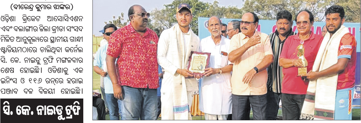
ଉତ୍ସାପନୀ କାର୍ଯ୍ୟକ୍ରମରେ ଦୁଇ କୃତୀ ଖେଳାଳିଙ୍କୁ ଅତିଥିମାନେ ପୁରସ୍କୃତ କରୁଛନ୍ତି।