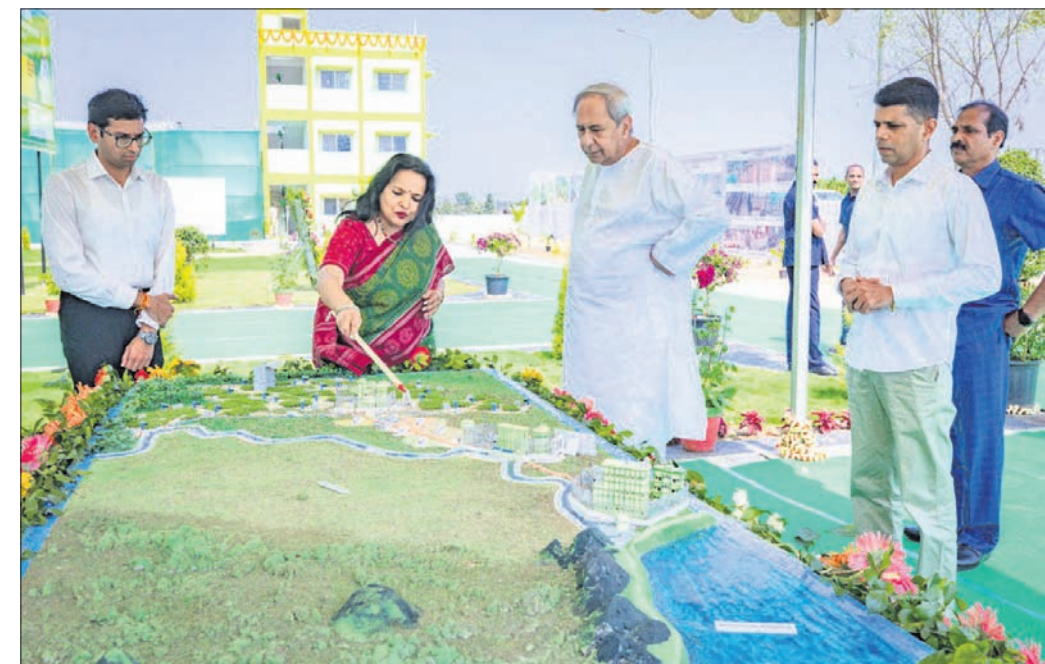
ମୁଖ୍ୟମନ୍ତ୍ରୀ ନବୀନ ପଟ୍ଟନାୟକ ଗଙ୍ଗାଧର ଉଠାକଳସେବନ ପ୍ରକଳ୍ପର ମାଧ୍ୟମ ଦେଖୁଛନ୍ତି।