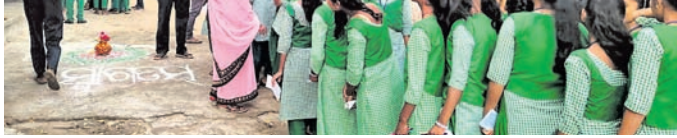
ବାଲିନେକା ସରକାରୀ ଶିଶୁ ମନ୍ଦିର ଛାତ୍ରାଳୟରେ ପରୀକ୍ଷା କେନ୍ଦ୍ରକୁ ଯାଉଛନ୍ତି।

ବାଲିନେକା, ୨୦୧୭ (ଶିବର ସାହୁ) ପରୀକ୍ଷା ବେଳେ ପରୀକ୍ଷା ଦେଖାଇଛନ୍ତି। ପରୀକ୍ଷା କେନ୍ଦ୍ରରେ ପରୀକ୍ଷା ଦେଖାଇଛନ୍ତି। ପରୀକ୍ଷା କେନ୍ଦ୍ରରେ ପରୀକ୍ଷା ଦେଖାଇଛନ୍ତି। ପରୀକ୍ଷା କେନ୍ଦ୍ରରେ ପରୀକ୍ଷା ଦେଖାଇଛନ୍ତି।