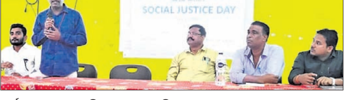
କାର୍ଯ୍ୟକ୍ରମରେ ଜଣେ ଅତିଥି ବକ୍ତବ୍ୟ ରଖୁଛନ୍ତି।

ନବରଙ୍ଗପୁର ଜିଲ୍ଲା ଉନ୍ନୟନ କମିଟି(ବିଶା) ବୈଠକ ଆରମ୍ଭ ହୋଇଛି। ଉପରକୋଟ ମେଡିକାଲରେ ଭକ୍ତ ଭକ୍ଷର ପାଇଁ ସମସ୍ତ କାର୍ଯ୍ୟ ସରିଗଲା। କେନ୍ଦ୍ରୀୟ ନିରୀକ୍ଷଣ ବିଭାଗ ଅନୁମତି ପରେ କାର୍ଯ୍ୟକାରୀ ହେବ। ତାଜଲସିଧ ପାଇଁ ୨ଟି ମେଶିନ ବସିବ ବୋଲି ଜିଲ୍ଲାପାଳ ସୂଚନା ଦେଇଛନ୍ତି। ଆମ ହସିଦାନ ଯୋଜନାରେ ନବରଙ୍ଗପୁର ଜିଲ୍ଲା ମୁଖ୍ୟ ଚିକିତ୍ସାଳୟ, ପାପଡାହାଣ୍ଡି ଓ ଚନ୍ଦ୍ରହାଣ୍ଡି ବିଭାଗ ବ୍ୟାଞ୍ଜନୋଦ୍ଧର ଉନ୍ନତିକରଣ