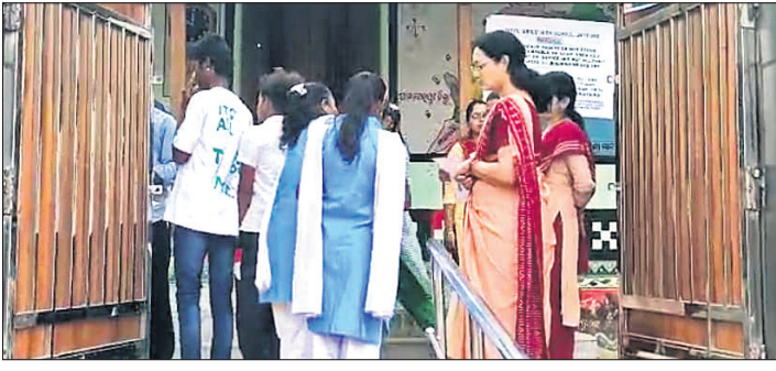
ଜୟପୁରର ଏକ ପରୀକ୍ଷା କେନ୍ଦ୍ରକୁ ଛାତ୍ରାଛାତ୍ରୀଙ୍କୁ ହତାୟତାରେ।