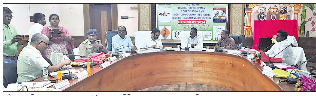
ବୈଠକରେ ଜିଲ୍ଲାପାଳ, ଅନ୍ୟ ଅଧିକାରୀ ଓ ଲୋକ ପ୍ରତିନିଧିମାନେ ଆଲୋଚନା କରୁଛନ୍ତି।