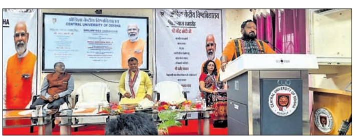
ପ୍ରଧାନମନ୍ତ୍ରୀଙ୍କ କାର୍ଯ୍ୟକ୍ରମକୁ ଦେଖୁଥିବା ଅତିଥି।