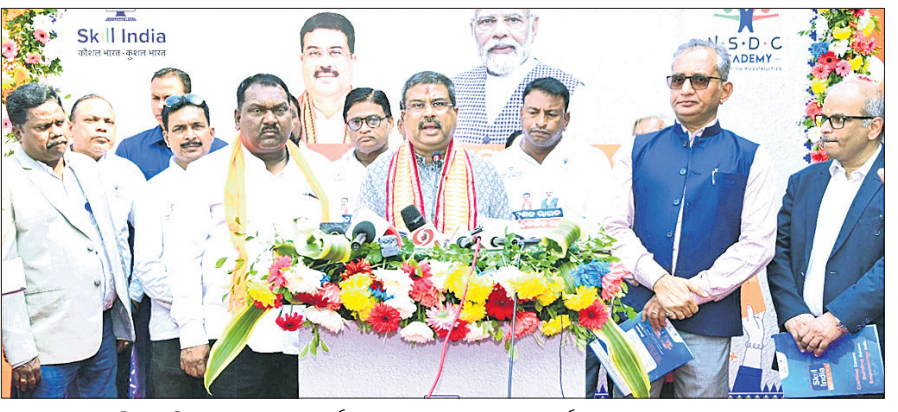
ସ୍କିଲ୍ ଇଣ୍ଡିଆ ସେଣ୍ଟର ଲୋକାର୍ପଣ ଉତ୍ସବରେ କେନ୍ଦ୍ରମନ୍ତ୍ରୀ ଧର୍ମେନ୍ଦ୍ର ପ୍ରଧାନ ଓ ଅନ୍ୟମାନେ।