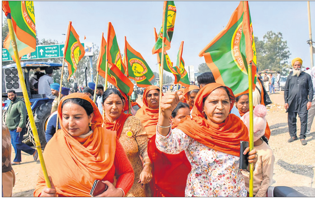
ପଞ୍ଜାବ-ହରିୟାଣା ଶତ୍ରୁ ସାମାଜିକ କୃଷକ ଆନ୍ଦୋଳନରେ କେନ୍ଦ୍ର ସରକାର ପତାକା ଧରି ଘୋରଣ ଦେଉଛନ୍ତି।

ଉତ୍ପାଦିତ ଫସଲର ସର୍ବନିମ୍ନ ସହାୟକ ମୂଲ୍ୟ (ଏମ୍ଏସ୍ପି) ଦାବିରେ ଚାଲିଥିବା କୃଷକ ଆନ୍ଦୋଳନ ସହ ଜଡ଼ିତ ୧୭୭ଟି ସୋସିଆଲ ମିଡିଆ ଆକାଉଣ୍ଟ ଏବଂ ଫ୍ରେଣ୍ଡ୍ ଲିଙ୍କକୁ କେନ୍ଦ୍ର ସରକାର ସାମୟିକ ଭାବେ ବ୍ଲକ୍ କରିଦେଇଛନ୍ତି।