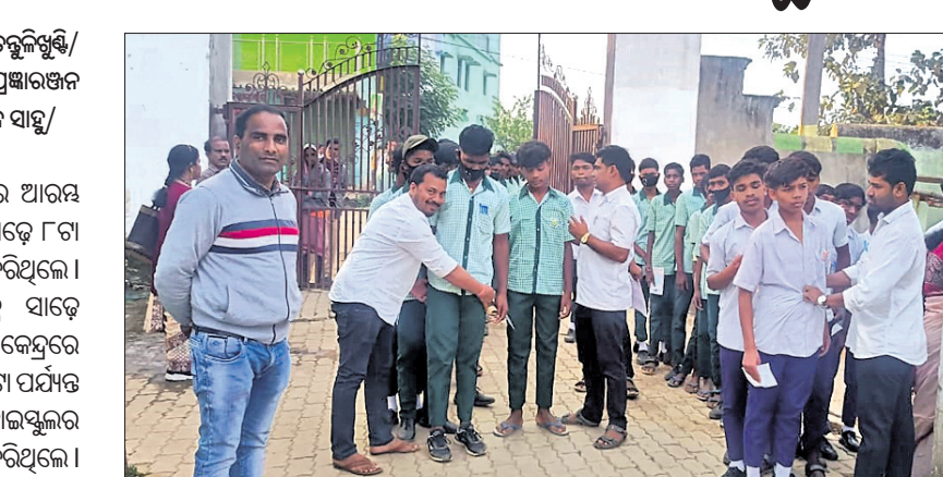
ତାକୁଆଁର ଏକ ପରୀକ୍ଷା କେନ୍ଦ୍ରରେ ପରୀକ୍ଷାର୍ଥୀଙ୍କୁ ପାଠ୍ୟ କରାଯାଉଛି।