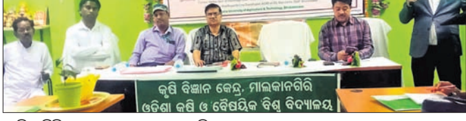
ତାଲିମ ଶିବିରରେ ଯୋଗଦେଇଥିବା ଅତିଥି।

ମାଲକାନଗିରି ଜିଲ୍ଲା କୃଷି ବିଜ୍ଞାନ କେନ୍ଦ୍ର ସମ୍ମିଳନୀ କକ୍ଷରେ ଜିଲ୍ଲାର ୩୦ ଜଣ ଅଗ୍ରଣୀ କୃଷକ ଏବଂ କୃଷି ସହ ଜଡିତ ବିଭିନ୍ନ ବିଭାଗର କର୍ମଚାରୀଙ୍କୁ ନେଇ ୩ ଦିନିଆ ତାଲିମ କାର୍ଯ୍ୟକ୍ରମ ମାଲକାନଗିରି ଆରମ୍ଭ ହୋଇଛି। ଏହାକୁ ଭାରତୀୟ କୃଷି ପରିବାର କଳାଧାରୀ ବିଭାଗ, ଭାରତୀୟ କୃଷି ଅନୁସନ୍ଧାନ ବିଭାଗ ଏବଂ ଓଡ଼ିଶା କୃଷି ଓ ବୈଷୟିକ ବିଶ୍ୱ ବିଦ୍ୟାଳୟ, ଭୁବନେଶ୍ୱର ବିଶ୍ୱାସନିକ ଦ୍ୱାରା ଆରମ୍ଭ ହୋଇଛି। କାର୍ଯ୍ୟକ୍ରମରେ କୃଷକମାନଙ୍କୁ ଆଧୁନିକ କୃଷି ଓ ବୈଷୟିକ ବିଭାଗର କର୍ମଚାରୀଙ୍କୁ ନେଇ ୩ ଦିନିଆ ତାଲିମ କାର୍ଯ୍ୟକ୍ରମ ମାଲକାନଗିରି ଆରମ୍ଭ ହୋଇଛି। ଏହାକୁ ଭାରତୀୟ କୃଷି ପରିବାର କଳାଧାରୀ ବିଭାଗ, ଭାରତୀୟ କୃଷି ଅନୁସନ୍ଧାନ ବିଭାଗ ଏବଂ ଓଡ଼ିଶା କୃଷି ଓ ବୈଷୟିକ ବିଶ୍ୱ ବିଦ୍ୟାଳୟ, ଭୁବନେଶ୍ୱର ବିଶ୍ୱାସନିକ ଦ୍ୱାରା ଆରମ୍ଭ ହୋଇଛି। କାର୍ଯ୍ୟକ୍ରମରେ କୃଷକମାନଙ୍କୁ ଆଧୁନିକ କୃଷି ଓ ବୈଷୟିକ ବିଭାଗର କର୍ମଚାରୀଙ୍କୁ ନେଇ ୩ ଦିନିଆ ତାଲିମ କାର୍ଯ୍ୟକ୍ରମ ମାଲକାନଗିରି ଆରମ୍ଭ ହୋଇଛି। ଏହାକୁ ଭାରତୀୟ କୃଷି ପରିବାର କଳାଧାରୀ ବିଭାଗ, ଭାରତୀୟ କୃଷି ଅନୁସନ୍ଧାନ ବିଭାଗ ଏବଂ ଓଡ଼ିଶା କୃଷି ଓ ବୈଷୟିକ ବିଶ୍ୱ ବିଦ୍ୟାଳୟ, ଭୁବନେଶ୍ୱର ବିଶ୍ୱାସନିକ ଦ୍ୱାରା ଆରମ୍ଭ ହୋଇଛି।