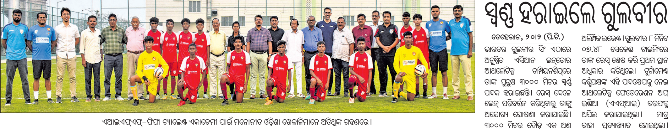
ଏଆଇଏସ୍ଏଫ୍-ଫିମା ଟ୍ୟାଲେଣ୍ଟ ଏକାଡେମୀ ପାଇଁ ମନୋନୀତ ଓଡ଼ିଶା ଖେଳାଳିମାନେ ଅତିଥିକ ରହିଛନ୍ତି।

ଟ୍ୟାଲେଣ୍ଟ କୋର୍ ସର୍ପି ଅନେକକ୍ରମେ କହିଛନ୍ତି ଯେ, ସମସ୍ତ ସଦସ୍ୟ ଆସୋସିଏସନଙ୍କ ସହଯୋଗରେ ବିଶ୍ୱପ୍ରସାରରେ ପ୍ରତିଦ୍ୱନ୍ଦିତା ପ୍ରଦାନ କରିବେ। ଏହା ଘୋଷଣା ଏବଂ ଓଡ଼ିଶାକୁ ସପୋର୍ଟ କରିବା ପାଇଁ ଫିମା ଏଠାରେ ଉପସ୍ଥିତ। ଏକାଡେମୀ ପାଇଁ ମନୋନୀତ ହୋଇଥିବା ୧୫ ଖେଳାଳି ଭାରତର ବିଭିନ୍ନ ଭାଗରୁ ମନୋନୀତ ୧୫ ବର୍ଷରୁ କମ୍ ୩୦ ଖେଳାଳିଙ୍କ ସହ ଟ୍ରେନିଂ ନେବେ। ଫିମା ଦ୍ୱାରା ନିମ୍ନଲିଖିତ କୋର୍ସ ଦ୍ୱାରା ଏମାନେ ସମସ୍ତେ ମିଳିତଭାବେ ଅଭ୍ୟାସ କରିବେ। ଏଆଇଏସ୍ଏଫ୍ ଏବଂ ଓଡ଼ିଶା ସରକାର ସମର୍ଥନ ଯୋଗାଇଦେବ। ଏଠାରେ ଟ୍ରେନିଂ ନେଉଥିବା ଖେଳାଳିଙ୍କୁ ଅଗ୍ରଗତକୁ ଫିମା କୋର୍ସାରେ ବିଭିନ୍ନ ପ୍ରୋଗ୍ରାମ ଦ୍ୱାରା ଅତି ନିକଟକୁ ଅନୁଧ୍ୟାନ କରିବେ।