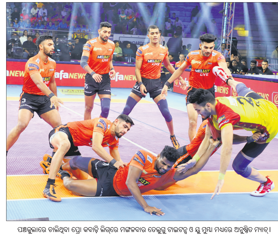
ପଞ୍ଚକୁଳାରେ ଚାଲିଥିବା ପ୍ରୋ କବାଡ଼ି ଲିଗ୍‌ରେ ମଙ୍ଗଳବାର ଚେଲ୍‌ସି ଟାଇଟନ୍‌ସ୍ ଓ ୟୁ ପୁୟା ମଧ୍ୟରେ ଅନୁଷ୍ଠିତ ମ୍ୟାଚ୍।

ପ୍ରତ୍ୟାବର୍ତ୍ତନ କରିଥିଲା। ଏହା ବ୍ୟତୀତ କୋଭିଡ୍ କାରଣରୁ ୨୦୨୦ ସଂସ୍କରଣର ଆଇପିଏଲ୍ ମଧ୍ୟ ଯୁବକରେ ଅନୁଷ୍ଠିତ ହୋଇଥିଲା। ତେବେ ୨୦୧୯ରେ ମଧ୍ୟ ସାଧାରଣ ନିର୍ବାଚନ ସହ ସମାନ ସମୟରେ ଆଇପିଏଲ୍ ଆୟୋଜିତ ହୋଇଥିଲା। ଆଇପିଏଲ୍ ପରେ ଚିନ୍ତା ବିଶ୍ୱକପ ରହିଥିବା ବେଳେ ମେ ୨୬ରେ କିମ୍ବା ପୂର୍ବରୁ ହିଁ ଆଇପିଏଲ୍ ଫାଇନାଲ ମ୍ୟାଚ୍ ଖେଳାଯିବ। ଆମେରିକା ଓ ଫ୍ରେଞ୍ଚାଇଜ୍‌ରେ ଖେଳାଯିବାକୁ ଥିବା ଚିନ୍ତା ବିଶ୍ୱକପରେ ଭାରତ ଛୁଟି ୫ ତାରିଖରେ ପ୍ରଥମ ମ୍ୟାଚ୍ ଖେଳିବ। ସେହିପରି ଆଇପିଏଲ୍‌ର ଗତ ସଂସ୍କରଣର ଦୁଇ ଫାଇନାଲିଷ୍ଟ ଦଳ ଚେନାଇ ପୁପୁର କିଙ୍ଗ୍ସ୍ ଓ ରୁଜ୍‌ବାଟ ଚାଇଟ୍‌ସ୍ ମଧ୍ୟରେ ଉଦ୍‌ଘାଟନା ମ୍ୟାଚ୍ ଖେଳାଯିବ। ଡିସେମ୍ବର ୨୦୨୨ରେ ହୋଇଥିବା ମିନି ଅକ୍ଟବର ଆଇପିଏଲ୍ ଇତିହାସର ମହଙ୍ଗା ଖେଳାଳି ଭାବରେ ମିଚେଲ୍ ଷ୍ଟାର୍କ୍ ୨୪.୭୫ କୋଟି ଟଙ୍କାରେ କିଣିଥିଲା ବୋଲି କାତା ନାଜଟ ରାଇଡର୍‌ସ୍।