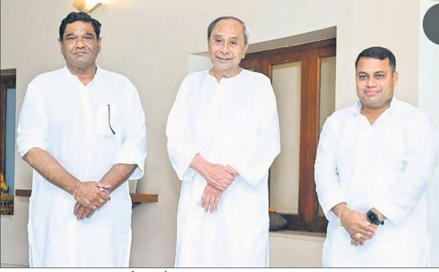
ରାଜ୍ୟସଭା ସଭ୍ୟ ଡା. ସୁଧାଂଶୁ କୁମାରଙ୍କୁ ଦେବାଶିଷ ଯାତ୍ରାରେ ଶୁଭାଶିଷ ପ୍ରଦାନ କରାଯାଇଛି।

ନବ ଏବଂ ଅପର ପଢ଼ାପଢ଼ିଆର ପ୍ରାଥମିକ ପଦକ୍ଷେପ ଗ୍ରହଣ କରିବାକୁ ଶିକ୍ଷକମାନଙ୍କୁ ପ୍ରୋତ୍ସାହିତ କରାଯାଇଛି।