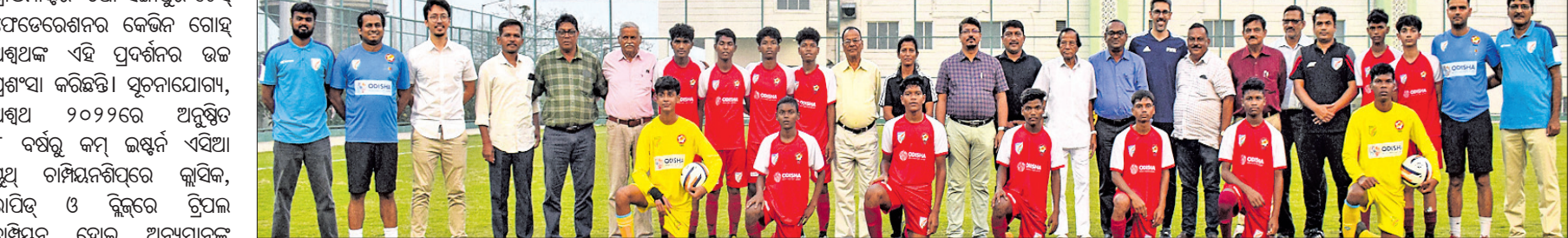
ଏଆଇଏସଫଏ-ପିଫା ଚ୍ୟାଲେଞ୍ଜ ଏକାଡେମୀ ପାଇଁ ମନୋନୀତ ଓଡ଼ିଶା ଖେଳାଳିମାନେ ଅତିଥିଙ୍କୁ ଗହଣରେ।

କହିଛନ୍ତି ଯେ, ସମସ୍ତ ସଦସ୍ୟ ଆସୋସିଏସନ୍‌ଙ୍କ ସହଯୋଗରେ ପ୍ରତିଦ୍ୱିତୀ ପ୍ରଭୁଙ୍କୁ ବଢ଼ାଇବା ଏହି ପ୍ରୋଗ୍ରାମ ଆରମ୍ଭର ମୁଖ୍ୟ ଉଦ୍ଦେଶ୍ୟ। ଏଆଇଏସଫଏ ଏବଂ ଓଡ଼ିଶା ସପୋର୍ଟ କରିବା ପାଇଁ ପିଫା ଏଠାରେ ଉପସ୍ଥିତ। ଏକାଡେମୀ ପାଇଁ ମନୋନୀତ ହୋଇଥିବା ୧୫ ଖେଳାଳି ଭାରତର ବିଭିନ୍ନ ଭାଗରୁ ମନୋନୀତ ୧୪ ବର୍ଷରୁ କମ୍ ୩୦ ଖେଳାଳିଙ୍କ ସହ ଟ୍ରେନିଂ ନେବେ। ପିଫା ଦ୍ୱାରା ନିର୍ମୂଳ କୋର୍ଟ୍ ଦ୍ୱାରା ଏମାନେ ସମସ୍ତେ ମିଳିତଭାବେ ଅଭ୍ୟାସ କରିବେ। ଏଆଇଏସଫଏ ଏବଂ ଓଡ଼ିଶା ସରକାର ସମର୍ଥନ ଯୋଗାଇଦେବେ। ଏଠାରେ ଟ୍ରେନିଂ ନେଉଥିବା ଖେଳାଳିଙ୍କ ଅଗ୍ରଗତିକୁ ପିଫା କୋର୍ଟ୍‌ମାନେ ବିଭିନ୍ନ ପ୍ରୋଗ୍ରାମ ଦ୍ୱାରା ଅତି ନିକଟରୁ ଅନୁଧ୍ୟାନ କରିବେ।