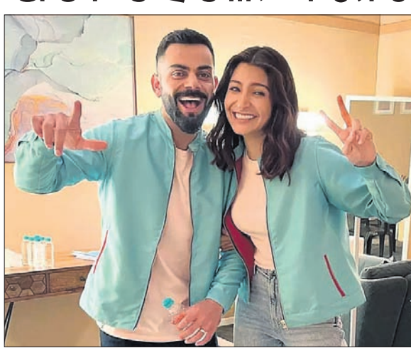
ବିରାଟ କୋହଲି ଓ ଅନୁଷ୍କା ଶର୍ମା।

ନୂଆଦିଲ୍ଲୀ, ୨୦୧୯ ଭାରତୀୟ କ୍ରୀଡ଼ାଚଳାଣୀ ବିରାଟ କୋହଲି ଦ୍ୱିତୀୟ ଥର ପାଇଁ ପିତା ହୋଇଛନ୍ତି। ମଙ୍ଗଳବାର ବୋହୂଙ୍କୁ ସ୍ତ୍ରୀ ଅନୁଷ୍କା ଶର୍ମା ଏହି ସୂଚନା ଦେଇଛନ୍ତି। ଅନୁଷ୍କା ଲନ୍ସ୍‌ସ୍‌ଗ୍ରାମରେ ଏକ ପୋଷ୍ଟ କରିଛନ୍ତି। ସମସ୍ତ ବିରାଟ କୋହଲି ମଧ୍ୟ ସମାନ ଆକାଶରୁ ନିଜ ସୋସିଆଲ ମିଡିଆ ଆକାଉଣ୍ଟରୁ ଶୋଭା ଦେଖିଥିଲେ। ପୂର୍ବରୁ ଉତ୍ତରାଖଣ୍ଡର ଆମିତା ନାମ୍ନା ଏକ ଝିଅ ରହିଛି। ଫେବୃଆରୀ ୧୫ ତାରିଖରେ ପୁଅ ଜନ୍ମ ହୋଇଥିବା ଅନୁଷ୍କା ସ୍ୱପ୍ନ କରିଛନ୍ତି। ସେ ଲେଖିଛନ୍ତି 'ଅତ୍ୟନ୍ତ ଖୁସିର ସହ ଆମେ ଜଣାଇବାକୁ ଚାହୁଁଛୁ କି ଫେବୃଆରୀ ୧୫ ତାରିଖରେ ଆମର ପୁତ୍ର ସନ୍ତାନ ଅକାଶ ଜନ୍ମ ନେଇଛି। ଏହି ଖୁସିର ମୁହୂର୍ତ୍ତରେ ଆପଣ ସମସ୍ତଙ୍କୁ ଆଶୀର୍ବାଦ କାମନା କରିବୁ। ସେହିପରି ଆମର ରୋପନାୟତାକୁ ସମ୍ମାନ ଜଣାଇଥିବା କାରଣରୁ ସମସ୍ତଙ୍କୁ ନିମ୍ନସ୍ୱାଗତ ବୋଲି ଲେଖିଛନ୍ତି ଅନୁଷ୍କା। ଉଲ୍ଲେଖଯୋଗ୍ୟ ଯେ, ବିରାଟ କୋହଲି ପାରିବାରିକ କାରଣ ଦର୍ଶାଇ ଲଙ୍କାସ୍ତ ବିପକ୍ଷ ୫ ମାସ ବିଶିଷ୍ଟ ଟେଷ୍ଟ ସିରିଜକୁ ଓହରି ଯାଇଥିଲେ।