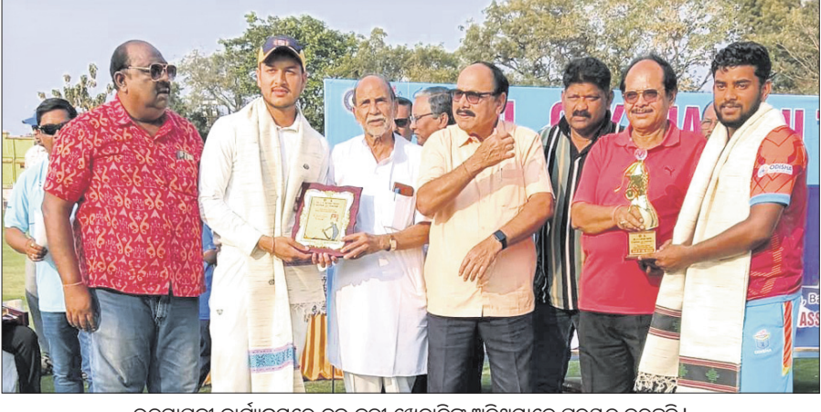
ଉଦ୍‌ଯାପନୀ କାର୍ଯ୍ୟକ୍ରମରେ ଦୁଇ କୁଟା ଖେଳାଳିଙ୍କୁ ଅତିଥିମାନେ ପୁରସ୍କୃତ କରୁଛନ୍ତି।

ବଲାଙ୍ଗୀର, ୨୦୧୯ (ବୀରେନ୍ଦ୍ର କୁମାର ଝାଙ୍କର) ଓଡ଼ିଶା କ୍ରିକେଟ ଆସୋସିଏସନ୍ ଏବଂ ବଲାଙ୍ଗୀର ଜିଲ୍ଲା ଜ୍ରାଡ଼ା ସଂସଦ ମିଳିତ ଆନୁକୁଲ୍ୟରେ ଗୁଆନା ଗାଣା ଷ୍ଟାଡ଼ିୟମରେ ଚାଳିଥିବା କନେଲ ସି. କେ. ନାଲ୍ଡୁ ଟ୍ରଫି ମଙ୍ଗଳବାର ଶେଷ ହୋଇଛି। ଓଡ଼ିଶାକୁ ଏକ ଇନିଂସ ଓ ୧୧୨ ରନ୍ରେ ହରାଇ ପଞ୍ଜାବ ଦଳ ବିଜୟୀ ହୋଇଛି।