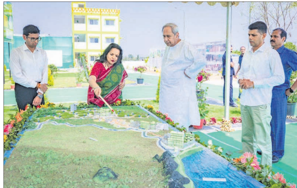
ମୁଖ୍ୟମନ୍ତ୍ରୀ ନବୀନ ପଟ୍ଟନାୟକ ଗଙ୍ଗାଧର ଉଠାକଳସେବନ ପ୍ରକଳ୍ପର ମାଧ୍ୟମ ଦେଖୁଛନ୍ତି।