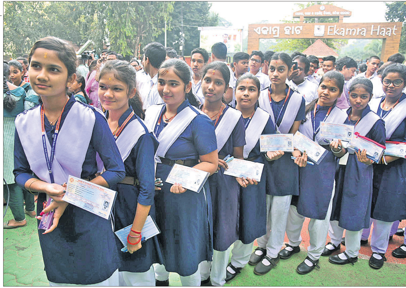
ମାଟ୍ରିକ ପରୀକ୍ଷାର ପ୍ରଥମ ଦିନ: ଭୁବନେଶ୍ୱର ଯୁକ୍ତି-ମନ୍ତ୍ରିତ କ୍ୟାମ୍ପସର ଉତ୍ତର ଚାଷୀଙ୍କୁ ମାଟ୍ରିକ ପରୀକ୍ଷା ଦେବା ପାଇଁ ମଙ୍ଗଳବାର ପରୀକ୍ଷାକ୍ଷେତ୍ରରେ ଆର୍ଥିକ କାର୍ଡ ବ୍ୟବହାର ପ୍ରଦାନ କରୁଛନ୍ତି। (ପଟ୍ଟନାୟକ-ମନୋରଞ୍ଜନ ମିଶ୍ର)

କହିଛନ୍ତି। ଜନସାଧାରଣଙ୍କ ସମସ୍ୟାର ସମାଧାନ ପ୍ରତି ଏହା ତାଙ୍କ ସରକାରଙ୍କ ପ୍ରତିବଦ୍ଧତା ଓ ନିଷ୍ଠାର ପରିଚୟ ବୋଲି ମୁଖ୍ୟମନ୍ତ୍ରୀ କହିଛନ୍ତି। ୫-ଟି ଓ ନବୀନ ଓଡ଼ିଶା ଅଧ୍ୟକ୍ଷ କେନ୍ଦ୍ରପ୍ରାଡ଼ା ଜିଲ୍ଲା ଗପ୍ତେ ଅବସରରେ ସିକିମ ଉତ୍ତରଚାଳୀ ତାଙ୍କୁ କେତେ ସେମାନଙ୍କ ଅନୁଭବ। ବିଷୟରେ ଜଣାଇଥିଲେ। ୫-ଟି ଅଧ୍ୟକ୍ଷ ଏ ବିଷୟରେ ମୁଖ୍ୟମନ୍ତ୍ରୀଙ୍କ ଦୃଷ୍ଟି ଫୁଲ୍-୧