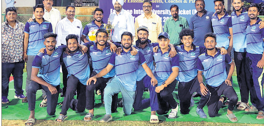
ପୂର୍ବାଞ୍ଚଳ ଆନ୍ଧ୍ର ବିଶ୍ୱବିଦ୍ୟାଳୟ କ୍ରିକେଟ ଚୁନାବଳୀରେ ଚାମ୍ପିୟନ କିଙ୍ଗ୍ ଦଳ ଅତିଥି ଓ କର୍ମକର୍ତ୍ତାଙ୍କ ସହ ଗହଣରେ।

ଭୁବନେଶ୍ୱର, ୨୧।୨ (ତପନ ସାଲ୍): କେରଳରେ ଅନୁଷ୍ଠିତ ୫୮ତମ ସୁନ୍ଦର ସ୍ୱାସ୍ଥ୍ୟ ପ୍ରତିଯୋଗିତା ମିଷ୍ଟର ଆଣ୍ଡ ମିସ୍ ଇଣ୍ଡିଆରେ ଓଡ଼ିଶାକୁ ଦୁଇଟି ପଦକ ମିଳିଛି।