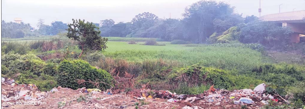
ଲଗାତୁରାରେ ପରିପୂର୍ଣ୍ଣ ଆଗୁଳ ପୋଖରୀ ।

ବ୍ରହ୍ମପୁର ସହରରେ ଥିବା ଅନେକ କଳାଶୟନ ରଖାଯାଇଥିବା ଅବାବଦୁ ପୋତି ହୋଇପଡିଛି ।