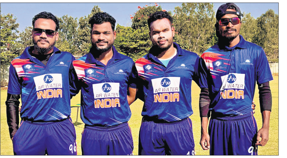
ସୁଧଲରେ ହେବାକୁଥିବା ବନ୍ଧୁପୁର୍ଣ୍ଣ ତ୍ରିରାଷ୍ଟ୍ରୀୟ ସିରିଜ ପାଇଁ ଭାରତୀୟ ଦଳରେ ଘାତ ପାଇଥିବା ଓଡ଼ିଶା ଖେଳାଳି।

ଅର୍ଦ୍ଧଶତକ ସହାୟତାରେ ୨୦ ଓଭରରେ ୩ ଉଇକେଟ ହରାଇ ୨୧୫ ରନ କରିଥିଲା। କନସ୍ୱେ ୪୬ ବଲକୁ ୬୩ (୫ ଚୌକା, ୨ ଛକା) ଓ ରବାନ୍ସ ୩୫ ବଲକୁ ୬୮ (୨ ଚୌକା, ୬ ଛକା) ରନ କରିଥିଲେ।