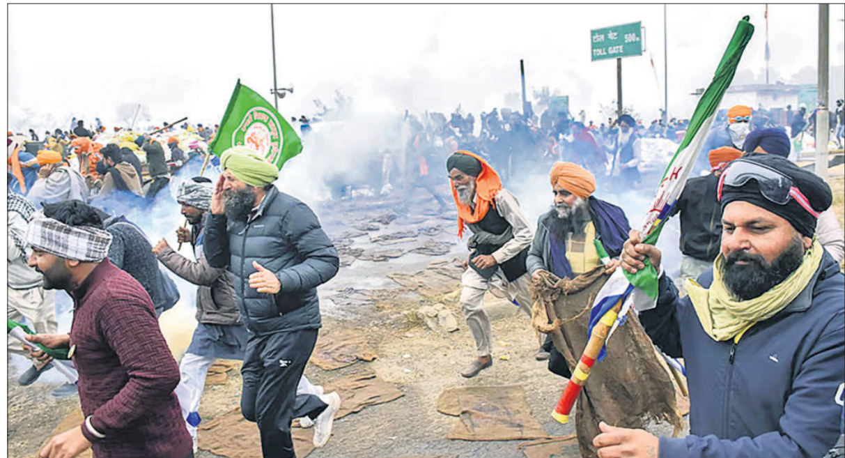
ପଞ୍ଜାବ-ହରିୟାଣାର ଶମ୍ଭୁ ସାମାଜିକ କୃଷକଙ୍କୁ ଘଉଡ଼ାଇବା ପାଇଁ ପୋଲିସ ଲୁହରୁହା ବାଷ୍ପ ପ୍ରୟୋଗ କରୁଛି ।

■ ୨ ଦିନ ପାଇଁ 'ଦିଲ୍ଲୀ ଚଳୋ' ସ୍ଥଗିତ ■ ସାମାଜିକ ସେବା କୃଷକ ■ ଆଲୋଚନା ପାଇଁ ପୁଣି ଭାଜିଲା କେନ୍ଦ୍ର