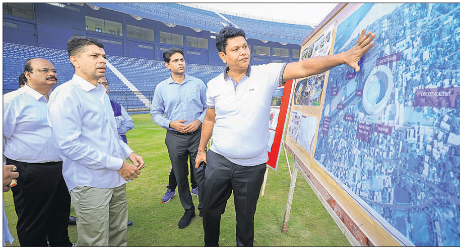
୫-ଟି ଅଧକ୍ଷ କାର୍ଯ୍ୟକ୍ରମ ପାଞ୍ଚିଆନ ରୂପରେ ବାରବାଟୀ ଷ୍ଟାଡ଼ିୟମ ଗ୍ୟାଲେରି ପାଇଁ ପ୍ରସ୍ତୁତ ରୁ ପ୍ରିକ୍ସ ଚର୍ଚ୍ଚନା କରୁଛନ୍ତି।

ବୃଦ୍ଧି କରାଯାଇ ୬୦,୦୦୦ କରାଯିବ। ଏଥିସହ ଡ୍ରେସିଂ ରୁମ୍, ଜିମ୍, ସୁଇମିଂ ପୁଲ୍, ଇନ୍ଡୋର ଗେମ୍ ପାଇଁ ବ୍ୟବସ୍ଥା କରାଯିବ। ଷ୍ଟାଡ଼ିୟମ ବାହାରର ସୌନ୍ଦର୍ଯ୍ୟକରଣ ସହ ଅନ୍ୟାନ୍ୟ କ୍ଷେତ୍ରର ଭିତ୍ତିପ୍ରସ୍ତର ବିକାଶ କରାଯିବ। ବର୍ତ୍ତମାନ ଜମି ମାଲିକାନାକୁ ନେଇ ଯେଉଁ ବିବାଦ ରହିଛି ତାହାର ସମାଧାନ ପାଇଁ ଆଗାମୀ ଦିନରେ ଉଦ୍ୟମ କରାଯିବ। ଏନେଇ ଓସିଏ ସମ୍ପାଦକ ସଞ୍ଜୟ ବେହେରା ପୂର୍ତ୍ତନା ଦେଇ କହିଛନ୍ତି, ରୂପରେ ପାଞ୍ଚିଆନ ଷ୍ଟାଡ଼ିୟମ ପରିବର୍ତ୍ତନ କରି ସମୀକ୍ଷା କରିଛନ୍ତି। ଆସନ୍ତା ୫୦ବର୍ଷକୁ ଚୁପୁଷ୍ପ-୧୧