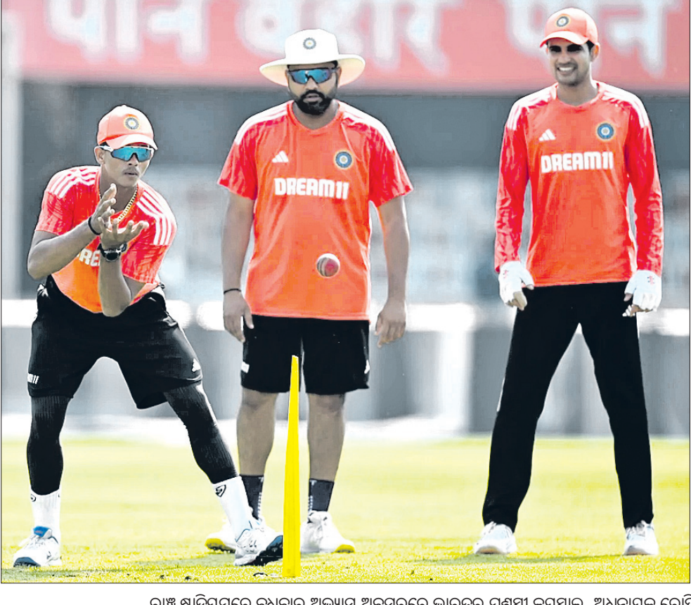
ରାଷ୍ଟ୍ର ଷ୍ଟାଡ଼ିୟମରେ ରୁଧିରା ଅଭ୍ୟାସ ଅବସରରେ ଭାରତର ଯଶସ୍ୱୀ ଜୟସ୍ୱାଲ, ଅଧିନାୟକ ରୋହିତ ଶର୍ମା ଓ ଶୁଭମନ ଗିଲ୍।

ଭୁବନେଶ୍ୱର, ୨୧।୨ (ପି.ଟି.): ଭାରତୀୟ ଓପନର ଯଶସ୍ୱୀ ଜୟସ୍ୱାଲ ଆଇସିସି ଟପ୍ ୨୦ ମଧ୍ୟରେ ପ୍ରବେଶ କରିଛନ୍ତି।