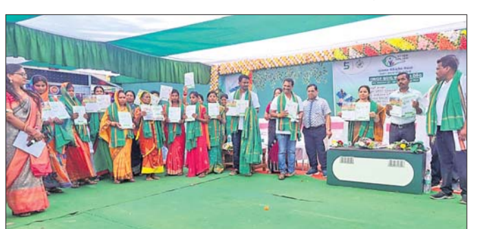
କାର୍ଯ୍ୟକ୍ରମରେ ଉପସ୍ଥିତ ଅତିଥି ଓ ଅନ୍ୟମାନେ ।

ଭଞ୍ଜନଗର, ୨୧୧୨ (ବାବୁଲୀ ପ୍ରଧାନ) - ଭଞ୍ଜନଗର ଶ୍ରୀଅରବିନ୍ଦ ଶକ୍ତିପୀଠ ପରିସରରେ ବୁଧବାର ଶ୍ରୀମାଳ ଜୟନ୍ତୀ ଉତ୍ସବ ପାଳିତ ହୋଇଯାଇଛି ।