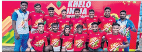
ରୌପ୍ୟ ପଦକ ବିଜୟୀ କିଙ୍ଗ୍ ରଗ୍‌ବୀ ଦଳ।

ଭୁବନେଶ୍ୱର, ୨୩।୨ (ତପନ ସାହୁ) ପଡ଼ିଆର ଲଦିରା ଗାନ୍ଧୀ ଆଥଲେଟିକ୍ସ ସ୍ପୋର୍ଟ୍ସ କମ୍ପ୍ଲେକ୍ସରେ ଅନୁଷ୍ଠିତ ଖେଳୋ ଇଣ୍ଡିଆ ବିଶ୍ୱବିଦ୍ୟାଳୟ କ୍ରୀଡ଼ାର ପୁରୁଷ ରଗ୍‌ବୀ ୭ଏସ୍ ଇଭେଣ୍ଟରେ କିଙ୍ଗ୍ ବିଶ୍ୱବିଦ୍ୟାଳୟ ଦଳ ରୌପ୍ୟ ପଦକ ହାସଲ କରିଛି। ଶୁକ୍ରବାର ଅନୁଷ୍ଠିତ ଫାଇନାଲରେ କିଙ୍ଗ୍ ବିଶ୍ୱବିଦ୍ୟାଳୟ ଚଣ୍ଡିଗଡ଼ ବିଶ୍ୱବିଦ୍ୟାଳୟଠାରୁ ୭-୧୨ରେ ହାରି ଯାଇଛି। ପୂର୍ବରୁ ଅନୁଷ୍ଠିତ ସେମିଫାଇନାଲରେ କିଙ୍ଗ୍ ଦଳ ଅନୁତସରର ଗୁରୁ ନାନକ ଦେବ ବିଶ୍ୱବିଦ୍ୟାଳୟକୁ ୩୯-୦ରେ ପରାସ୍ତ କରିଥିଲା। ଗୁରୁବାର କ୍ୱାର୍ଟର ଫାଇନାଲରେ ଏହି ଦଳ ଗାନ୍ଧୀନଗରର ରାଷ୍ଟ୍ରୀୟ ରକ୍ଷା ବିଶ୍ୱବିଦ୍ୟାଳୟକୁ ୩୧-୭ରେ ହରାଇ ଦେଇଥିଲା।