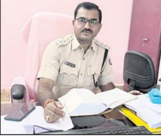
ଫିରିଙ୍ଗିଆ, ୨୩୧୨ (ବିକ୍ରମ ଦିଗାଳ):

କକ୍ଷମାଳ ଜିଲ୍ଲା ଫିରିଙ୍ଗିଆ ଥାନାରେ ଶୁକ୍ରବାର ନୂତନ ଥାନା ଅଧିକାରୀ ଭାବରେ ଗୋପାଳୀୟ ପ୍ରଧାନ ଦାୟିତ୍ୱ ଗ୍ରହଣ କରିଛନ୍ତି।