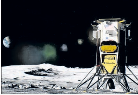
ଚନ୍ଦ୍ରପୃଷ୍ଠରେ ଅବତରଣ କରିବାରେ ଏହା ଦ୍ୱିତୀୟ ମିଶନ। ଏହା ପୂର୍ବରୁ ନାସା ମହାକାଶ ଯାନ ଚନ୍ଦ୍ରପୃଷ୍ଠରେ ଅବତରଣ କରିଥିଲା। ଆଗାମୀ କିଛି ବର୍ଷ ମଧ୍ୟରେ ଚନ୍ଦ୍ରକୁ ମାନବ ପଠାଇବା ପାଇଁ ନାସା ଲକ୍ଷ୍ୟ ରଖିଛି। ଏହା ପୂର୍ବରୁ ବିଜ୍ଞାନ ସଂସ୍ଥା (ନାସା)ର ଟେଲେସ୍କୋପ୍ ଚନ୍ଦ୍ରପୃଷ୍ଠରେ ଅବତରଣ କରିବା ପାଇଁ ନାସା ଲକ୍ଷ୍ୟ ରଖିଛି। ଏହା ପୂର୍ବରୁ ବିଜ୍ଞାନ ସଂସ୍ଥା ମୂଲ୍ୟାଙ୍କନ ଆରମ୍ଭ କରିବ। ଚଳିତ ବର୍ଷ ଅନେକ ମିଶନ ପଠାଇବାକୁ ଚାହୁଁଛି।

ଚନ୍ଦ୍ରପୃଷ୍ଠକୁ ଆମେରିକାର ମାନବ ମିଶନ ବନ୍ଦ ହେବାର ୫୦ ବର୍ଷରୁ ଉର୍ଦ୍ଧ୍ୱ ସମୟ ପରେ ଏହାର ଏକ ଘରୋଇ ମହାକାଶ ଯାନ ଗୁରୁବାର ଚନ୍ଦ୍ରପୃଷ୍ଠରେ ଅବତରଣ କରିଛି। ଇନ୍ଡ୍ରୁଇଡିଲ୍ ମେଣ୍ଡିଲ୍ ନାମକ ଘରୋଇ ସଂସ୍ଥା ଦ୍ୱାରା ବିକଶିତ ମହାକାଶ ଯାନ ଓଡିସିଅସ୍ ଚନ୍ଦ୍ରର ଦକ୍ଷିଣ ମେରୁଠାରୁ ୩୦୦ କିଲୋମିଟର ଦୂରରେ ସେଠା ଲ୍ୟାଣ୍ଡିଂ କରି ଇତିହାସ ରଚିଛି। ଇତିସୂତ୍ରରେ ଆମେରିକୀୟ ମହାକାଶ ପାଇଁ ନାସା ଲକ୍ଷ୍ୟ ରଖିଛି। ଏହା ପୂର୍ବରୁ ବିଜ୍ଞାନ ସଂସ୍ଥା (ନାସା)ର ଟେଲେସ୍କୋପ୍ ଚନ୍ଦ୍ରପୃଷ୍ଠରେ ପରିବେଶ, ଆମେରିକା ମହାକାଶ ବିଜ୍ଞାନ ସଂସ୍ଥା ମୂଲ୍ୟାଙ୍କନ ଆରମ୍ଭ କରିବ। ଚଳିତ ବର୍ଷ ଅନେକ ମିଶନ ପଠାଇବାକୁ ଚାହୁଁଛି।