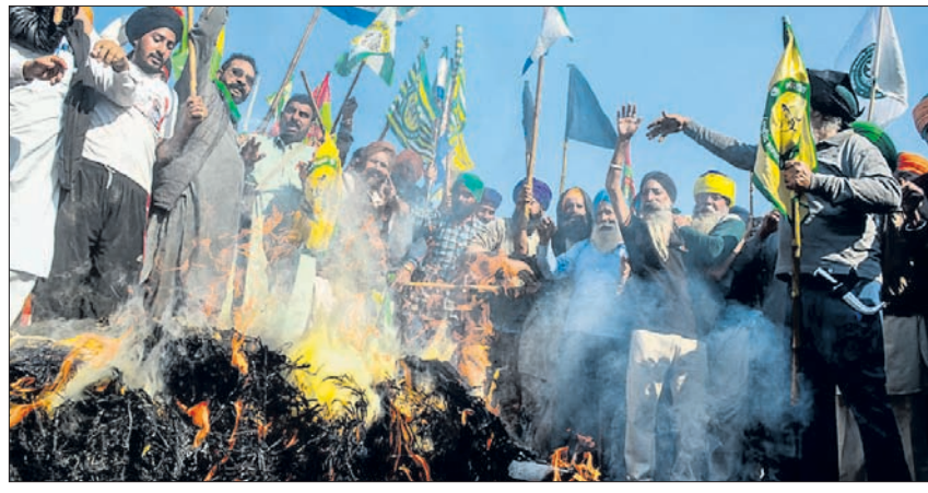
ହରିୟାଣାରେ ହିସାର ଲିଲା ଅନ୍ତର୍ଗତ ଷ୍ଟେଟ୍ ଚୋପଟାରେ ଶୁକ୍ରବାର ଆନ୍ଦୋଳନର ଚାଷୀ ଭାଜପା ନେତାମାନଙ୍କ କୁଶପୁରଲିକା ଦାହ କରୁଛନ୍ତି।

କରିଥିଲା। କୃଷକମାନେ ପଞ୍ଜାବର ଖନୌରୀ ସାମାଜିକ ଶୋଭାଯାତ୍ରାରେ ଯିବାବେଳେ ପୋଲିସ୍ ଅଟକାଇବାରୁ ଏଭଳି ଉତ୍ତେଜନାପୂର୍ଣ୍ଣ ସ୍ଥିତି ଉତ୍ପନ୍ନ ହେଲା। ଉକ୍ତ ଚାଷୀମାନେ ଖନୌରୀ ଏବଂ ଶମ୍ଭୁ ସାମାରେ ତେରା ପକାଇଥିବା ଆନ୍ଦୋଳନର ଚାଷୀଙ୍କ ସହ ସାମିଲ ହେବାକୁ ଯାଉଥିଲେ। ଶୁକ୍ରବାର ଖନୌରୀଠାରେ ଜଣେ ୬୨ ବର୍ଷୀୟ ଚାଷୀ ହୃଦ୍‌ଘାତରେ ପ୍ରାଣ ହରାଇଛନ୍ତି। ଫସଲର ସର୍ବନିମ୍ନ ସହାୟକ