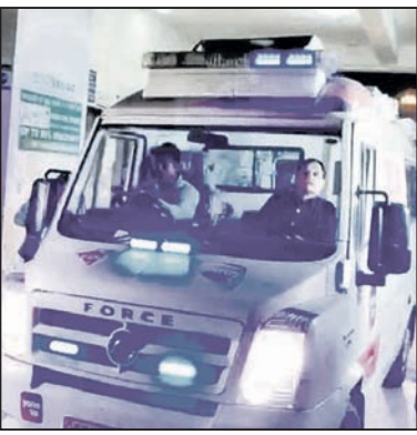
ଭୁବନେଶ୍ୱର ଏମ୍ବୁଲେନ୍ସ ନୂଆଦିଲ୍ଲୀ ଅଭିମୁଖେ ଗ୍ରାନ୍ କରିବାର ଲିଭର ନିଆଯାଉଛି।

ଭୁବନେଶ୍ୱର ଏମ୍ବୁଲେନ୍ସ ଶୁକ୍ରବାର ପ୍ରଥମ ଥର ପାଇଁ ଜଣେ ଟ୍ରେନ୍ ଡେଡ୍ (ମେଡିକାଲ ମୃତ୍ୟୁ) ଘୋଷିତ ବ୍ୟକ୍ତିଙ୍କ ଲିଭର (ଯକୃତ) ନୂଆଦିଲ୍ଲୀକୁ ବିନା ଯୋଗେ ପଠାଯାଇଛି। ଏଥିପାଇଁ ରାଜ୍ୟ ସରକାରଙ୍କ ସହାୟତାରେ କର୍ମଚାରୀମାନେ ପୋଲିସ୍ ପକ୍ଷରୁ ଗ୍ରାମିକ୍ ପୁଲ୍ ଯାତାୟତ ପାଇଁ ଭୁବନେଶ୍ୱର ଏମ୍ବୁଲେନ୍ସ ପକ୍ଷରୁ ପକ୍ଷାଘାତ ବିନା ନବନିର୍ମାଣ ଯାଏ ଗ୍ରାନ୍ କରିବାର କରାଯାଇଥିଲା। ତେବେ ଜଣେ ଓଡ଼ିଆଙ୍କ ଅଙ୍ଗପ୍ରତ୍ୟଙ୍ଗ ନୂଆଦିଲ୍ଲୀ ପଠାଯିବା ଅପେକ୍ଷା ଓଡ଼ିଶାରେ ଲିଭର ଆବଶ୍ୟକ କରୁଥିବା ବ୍ୟକ୍ତିଙ୍କଠାରେ କାର୍ଯ୍ୟକ୍ରମ ପ୍ରତିରୋଧକ କରାଯାଇନାହିଁ ବୋଲି ସାଧାରଣରେ ପ୍ରଶ୍ନ ଉଠୁଛି। ଏଭଳିସ୍ଥିତି କୁହାଯାଉଛି ଯେ, ଓଡ଼ିଶାରେ