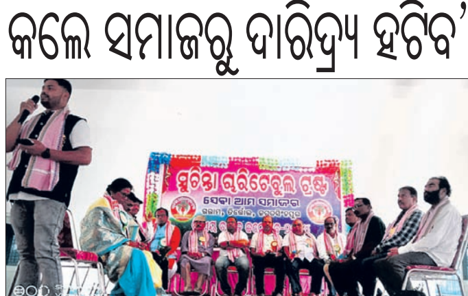
ବାର୍ଷିକ ଉତ୍ସବରେ ଯୋଗଦେଇଥିବା ଅତିଥି ଓ ଅନ୍ୟମାନେ।