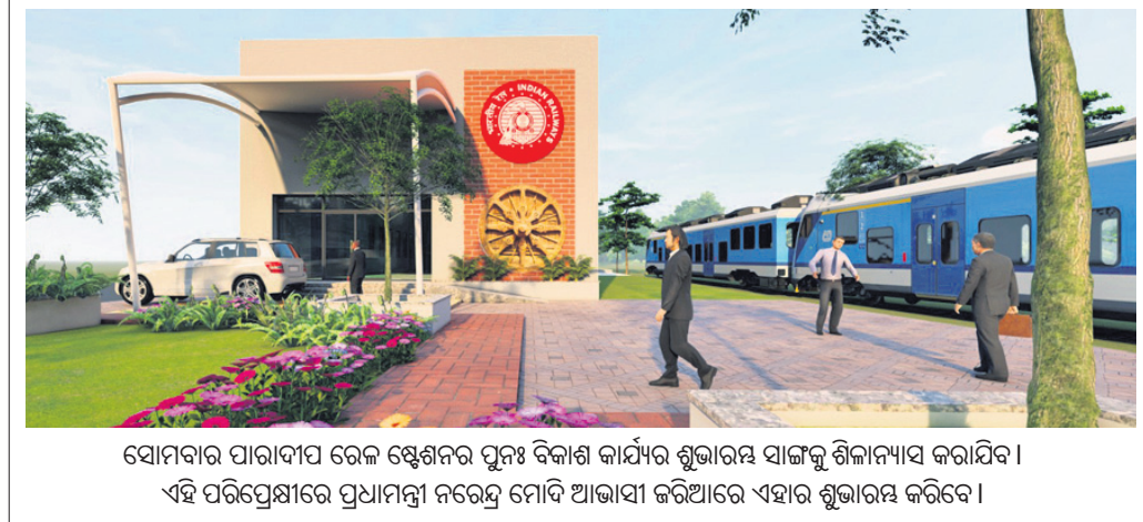
ସୋମବାର ପାରାଦୀପ ରେଳ ଷ୍ଟେସନର ପୁନଃ ବିକାଶ କାର୍ଯ୍ୟର ଶୁଭାରମ୍ଭ ସାଙ୍ଗକୁ ଶିଳାନ୍ୟାସ କରାଯିବ।