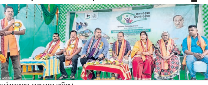
କାର୍ଯ୍ୟକ୍ରମରେ ମଞ୍ଚାସୀନ ଅତିଥି।

ହୋଇଥିବା ଅଣ୍ଡା ଉଦ୍ୟୋଗ କ୍ଷତିଗ୍ରସ୍ତ ହୋଇ ଚାଲିଛି। ଯଦି ଉଦ୍ୟୋଗ ପ୍ରତିଷ୍ଠା ପାଇଁ ଆବଶ୍ୟକ ଅର୍ଥ ବ୍ୟାଙ୍କ ପ୍ରଦାନ କରିଥାନ୍ତା, ତେବେ ଏହି ମସଲା ଉଦ୍ୟୋଗ ୫୦ ୧୦ ଜଣଙ୍କୁ ନିଯୁକ୍ତି ଦେବା ସହ ନିଜେ ଉପକୃତ ହୋଇପାରିଥାନ୍ତେ ବୋଲି ସେ କହିଛନ୍ତି।