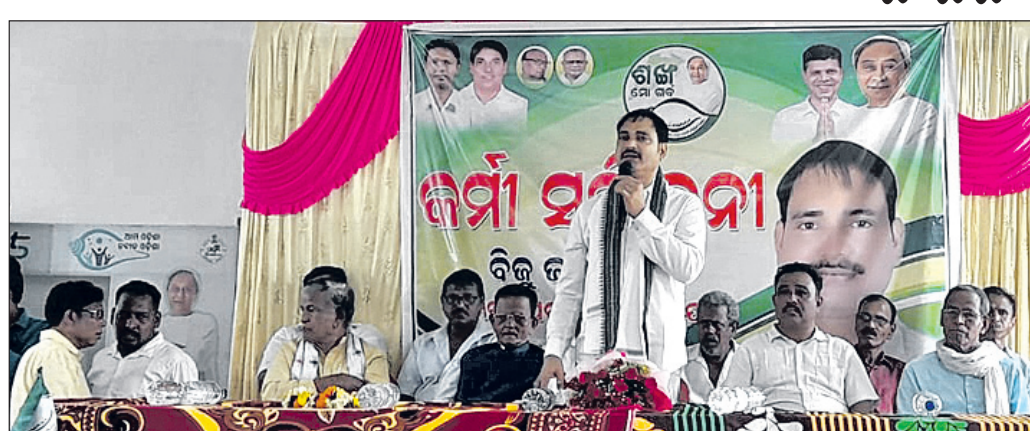
କର୍ମୀ ସମ୍ମିଳନୀରେ ମାଷାଧୀନ ନେତୃମଣ୍ଡଳୀ।