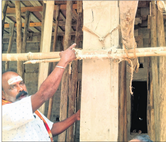
ଜଣେ ସେବାୟତ ବିମେଷ ଝଡୁଥିବା ଘ୍ନାନ ଦେଖାଉଛନ୍ତି।

ଆବଶ୍ୟକ ମୁତାବକ ପାଣି ଦିଆଯାଇ ନ ଥିବାରୁ ଏପରି ପରିସ୍ଥିତି ସୃଷ୍ଟି ହୋଇଛି।