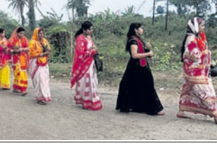
ତେରାବିଶ, ୨୫୨ (ବେବର୍ତ୍ତୀ ଅକୟ ଦାସ)