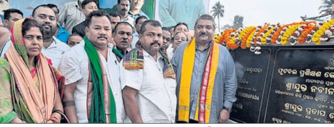
ମନ୍ତ୍ରୀ ପ୍ରତାପ କେଶରୀ ଦେବ ପ୍ରକଳ୍ପର ଉଦ୍‌ଘାଟନ କରୁଛନ୍ତି।