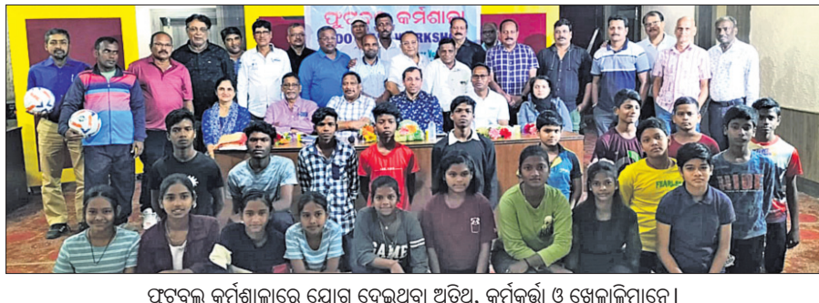
ପୁରବଳ କର୍ମଶାଳାରେ ଯୋଗ ଦେଇଥିବା ଅତିଥି, କର୍ମକର୍ତ୍ତା ଓ ଖେଳାଳିମାନେ ।

ଭୁବନେଶ୍ୱର, ୨୫/୨ (ବିଜୟ ରଣା) ପୂର୍ବ ଲାଭର୍ ଯୁଦ୍ଧ କ୍ରିକେଟ କ୍ଲବ ଆନୁକୂଲ୍ୟରେ ବିଜେବି କଲେଜ ପଡ଼ିଆରେ ଚାଳିଥିବା ୭ମ ନବ ଦାସ ଓ ୩ୟ ପ୍ରଶାନ୍ତ ମହାପାତ୍ର ମେମୋରିଆଲ ଟି୨୦ କ୍ରିକେଟ ଟୁର୍ନାମେଣ୍ଟର ଫାଇନାଲ ମ୍ୟାଚ ବାପୁଜୀ କ୍ଲବ ଓ ରାମେଶ୍ୱର ଷୋର୍ଟ ମଧ୍ୟରେ ଅନୁଷ୍ଠିତ ହୋଇଯାଇଛି । ଏଥିରେ ବାପୁଜୀ କ୍ରିକେଟ କ୍ଲବ ୮ଉଇକେଟର ବିଜୟ ଲାଭ କରି ଚାମ୍ପିୟନ ହୋଇଛି । ଉପସାଧାରଣ ଖେଳାଳିମାନେ ଏହି ମ୍ୟାଚରେ ଚମ୍ପିୟାନ ହେବା ପାଇଁ ଉତ୍ସାହୀ ଭାବେ ଯୋଗ ଦେଇଥିଲେ ।