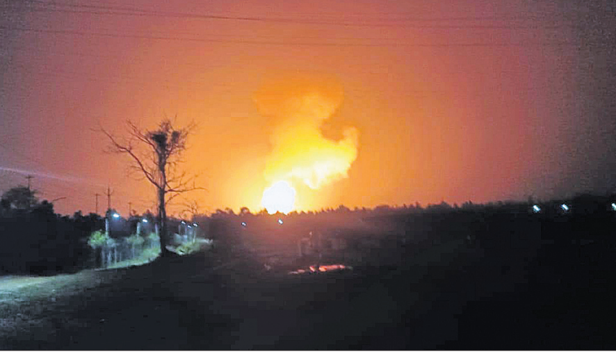
ବଡ଼ମାଲ ଗୋଳାବାରୁଦ କାରଖାନା ପରିସରରେ ରବିବାର ବିସ୍କୋରଣ ବେଳର ଦୃଶ୍ୟ।

ସଙ୍ଗତକା, ୨୫୫୨ (ରାଣାଲ ପ୍ରବାସ ଶତପଥୀ) ବଲାଙ୍ଗୀର ଜିଲ୍ଲା ସଙ୍ଗତକା ବ୍ଲକ୍ ବଡ଼ମାଲସ୍ଥିତ ଗୋଳାବାରୁଦ କାରଖାନାରେ ରବିବାର ସନ୍ଧ୍ୟା ସମୟରେ ବିସ୍କୋରଣ ଘଟିଛି।