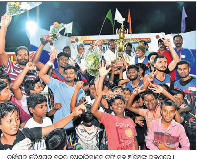
ଚାମ୍ପିୟନ ଛତିଶଗଡ଼ ଦଳର ଖେଳାଳିମାନେ ଟ୍ରଫି ସହ ଅତିଥିଙ୍କୁ ଗହଣରେ।

ଭୁବନେଶ୍ୱର, ୨୫୧୨ (ଦୀନେଶ୍ ମିଶ୍ର) ଏସିଆଇଏଚ୍ ପୁରୁଷ ହକି ପ୍ରୋ ଲିଗ୍ରେ ଆୟର୍ଲଣ୍ଡ ବିପକ୍ଷରେ ଭାରତୀୟ ଦଳ ୫-୦ ଗୋଲ୍ରେ ହରାଇଲା।