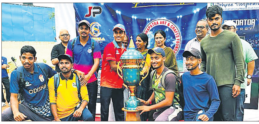
ଚାମ୍ପିୟନ ବାପୁଜୀ କ୍ରିକେଟ କ୍ଲବର ଖେଳାଳିମାନେ ଗ୍ରୁପି ସହ ଅତିଥିଙ୍କୁ ଗହଣରେ ।

ଭୁବନେଶ୍ୱର, ୨୫/୨ (ବିଜୟ ରଣା) ପୂର୍ବ ଲାଭର୍ ଯୁଦ୍ଧ କ୍ରିକେଟ କ୍ଲବ ଆନୁକୂଲ୍ୟରେ ବିଜେବି କଲେଜ ପଡ଼ିଆରେ ଚାଳିଥିବା ୭ମ ନବ ଦାସ ଓ ୩ୟ ପ୍ରଶାନ୍ତ ମହାପାତ୍ର ମେମୋରିଆଲ ଟି୨୦ କ୍ରିକେଟ ଟୁର୍ନାମେଣ୍ଟର ଫାଇନାଲ ମ୍ୟାଚ ବାପୁଜୀ କ୍ଲବ ଓ ରାମେଶ୍ୱର ଷୋର୍ଟ ମଧ୍ୟରେ ଅନୁଷ୍ଠିତ ହୋଇଯାଇଛି । ଏଥିରେ ବାପୁଜୀ କ୍ରିକେଟ କ୍ଲବ ୮ଉଇକେଟର ବିଜୟ ଲାଭ କରି ଚାମ୍ପିୟନ ହୋଇଛି । ଉପସାଧାରଣ ଖେଳାଳିମାନେ ଏହି ମ୍ୟାଚରେ ଚମ୍ପିୟାନ ହେବା ପାଇଁ ଉତ୍ସାହୀ ଭାବେ ଯୋଗ ଦେଇଥିଲେ ।