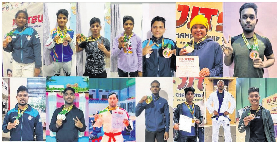
ଜାତୀୟ ଜୁ ଜିଟ୍ସୁ ପ୍ରତିଯୋଗିତା ଓଡ଼ିଆ ଖେଳାଳି

ବିଶ୍ୱକପ ଆୟୋଜନ କରିବାରେ ତାଙ୍କର ପ୍ରମୁଖ ଭୂମିକା ରହିଥିଲା। ସେହିପରି ପ୍ରାଣୀତଳ ବେସ୍ଟ ହକି ଇତିହାସ ଲିଗର ୪ଟି ସଂଖ୍ୟାଗଣା ସେ ସଫଳତାର ସହ ଆୟୋଜନ କରିଥିଲେ। ଏହା ବ୍ୟତୀତ ୨୦୧୫ ଓ ୧୭ରେ ହକି ଫୁଲ୍ ଲିଗର ଫାଇନାଲ ଆୟୋଜନ କରିବା ସହ ୨୦୧୯ ଓ ୨୪ରେ ଅଲିମ୍ପିକ୍ସ ଯୋଗ୍ୟତା ପର୍ଯ୍ୟନ୍ତ ରୂନାମେଣ୍ଟ ହକି ଇତିହାସ କରିବା ପଛରେ ନର୍ମାନ୍ଙ୍କ ବଡ଼ ଭୂମିକା ରହିଥିବା ହକି ଇତିହାସ ପୁସ୍ତକ ଏକ ବିଶ୍ୱକପ ହକି କରାଯାଇ କୁହାଯାଇଛି।