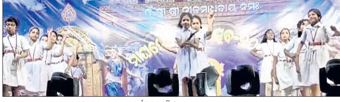
ମାଘମେଳା ମହୋତ୍ସବରେ ଛାତ୍ରୀଛାତ୍ରମାନେ ନୃତ୍ୟ ପ୍ରଦର୍ଶନ କରୁଛନ୍ତି ।

ଖଣ୍ଡପଡ଼ା, ୨୭/୧ (ଅକ୍ଷୟ କୁମାର ମହାରଣା) କଣିଲେ ଶ୍ରୀମାନମାଧବ ଜାତକ ପଦ୍ମି ମାଘମେଳା ଉପଲକ୍ଷେ ଚଳିଥିବା ମାଘମେଳା ମହୋତ୍ସବ-୨୦୨୪ର ଯୋଜନା ସମ୍ପାଦନା ପାଇଁ ମାଧବଜୀ ପରିଷଦ ଗଣା ସମ୍ପଳ୍ପଣା, ଓଡ଼ିଶା ଓ ଆଧୁନିକ ନୃତ୍ୟ ପରିବେଷଣ