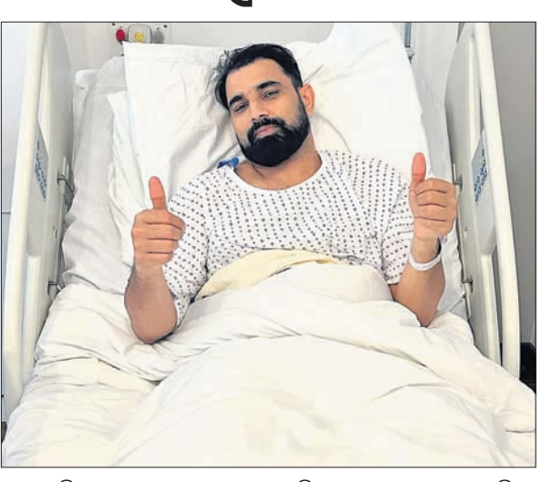
ଗୋଇଠର ସଫଳ ଅସ୍ତ୍ରୋପଚାର ପରେ ହସିତାଲ ବେଡ୍ରେ ମହମ୍ମଦ ଶାମି।

ନୂଆଦିଲ୍ଲୀ, ୨୭୨୭ (ପି.ଟି.) ଭାରତର ସିନିୟର ରେପ୍ ବୋଲର ମହମ୍ମଦ ଶାମି ଆହତ ହୋଇ ଆଇସିଏଲ୍ ୨୦୨୪ରୁ ଓହରି ଯାଇଥିବା ବେଳେ ମଙ୍ଗଳବାର ତାଙ୍କର ଅସ୍ତ୍ରୋପଚାର ହୋଇଛି। ଦିନିକିଆ ବିଶ୍ୱକପ୍ ସମୟରେ ଶାମିଙ୍କ ବାମ ଗୋଡରେ ଆଘାତ ଲାଗିଥିଲା। ଏହି ବିଶ୍ୱକପ୍ରେ ସର୍ବାଧିକ ଉଚ୍ଚକୋଟ ହାସଲକାରୀ ବୋଲର ଶାମି ଏହା ପରଠାରୁ ଭାରତ ପାଇଁ ଖେଳିନାହାନ୍ତି। ଦିନିକିଆ ବିଶ୍ୱକପ୍ରେ ସେ ଚମକ୍କାର ବୋଲିଂ କରି ୨୪ ଉଚ୍ଚକୋଟ ନେଇଥିଲେ। ଏହା ପରଠାରୁ ସେ ଆକ୍ରମଣ ସୂତରେ ରହିଛନ୍ତି। ଶାମି ଦକ୍ଷିଣ ଆଫ୍ରିକା ସିରିଜ୍ ପାଇଁ ଭାରତୀୟ ଦଳରେ ସ୍ଥାନ ପାଇ ନ ଥିବା ବେଳେ ନିକଟରେ ଭିଏଟନାମ