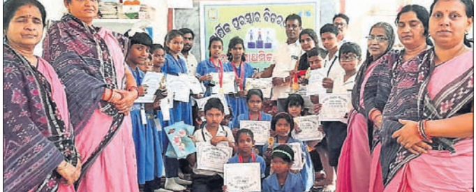
ଜାରକା ପ୍ରାଥମିକ ବିଦ୍ୟାଳୟରେ ଅତିଥିକ ଗଣଶରେ କୃତା ପ୍ରତିଯୋଗୀ।