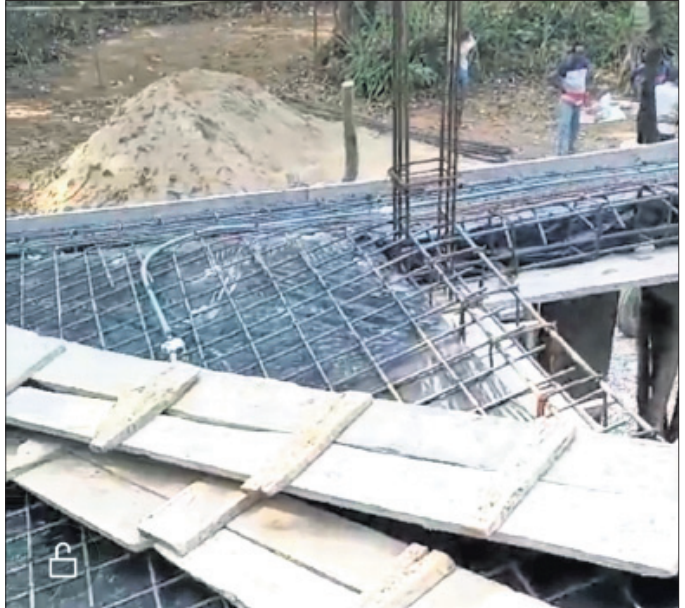
ନିମାଣାଧାର ଏକ ପ୍ରକଳ୍ପ ।

ନୟାଗଡ଼ ଜିଲ୍ଲା ନୂଆଗାଁ ବ୍ଲକ୍ ସିଦ୍ଧିତା ପଞ୍ଚାୟତ ଦାୟିତ୍ୱରେ ଥିବା ଯନ୍ତ୍ରୀଙ୍କ ଅନୁପସ୍ଥିତିରେ ନିମ୍ନମାନର କାମ ହେଉଥିବା ସୋମବାର ବିତିଓକ୍ ନିକଟରେ ଲିଖିତ ଅଭିଯୋଗ ହୋଇଛି । ବ୍ଲକ୍ , ପଞ୍ଚାୟତ ତଥା ଗାଁରେ ଉନ୍ନତ ମୂଲ୍ୟକାର୍ଯ୍ୟ କରିବା ପାଇଁ ସରକାର ଅନୁମତି ଯୋଗାଇ ଦେଉଛନ୍ତି । ସେହି କାମ ଠିକ୍ ଭାବେ କରାଯାଉଛି କି ନାହିଁ ତା'ର ତଦାରଖ କରିବା ପାଇଁ ପ୍ରତି ପଞ୍ଚାୟତରେ ଯନ୍ତ୍ରୀଙ୍କୁ ଦାୟିତ୍ୱ ପ୍ରଦାନ କରାଯାଇଛି । କିନ୍ତୁ ଅନେକ ସ୍ଥାନରେ ଯନ୍ତ୍ରୀଙ୍କ ଅନୁପସ୍ଥିତିର ଫଳସ୍ୱରୂପ ଠିକାଦାର ନିମ୍ନମାନର କାମ କରୁଥିବା ଅଭିଯୋଗ ହେଉଛି ।