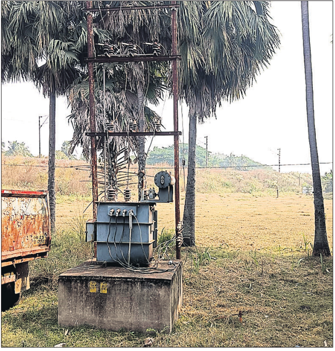
ରାସ୍ତା କଡ଼ରେ ଥିବା ବିଦ୍ୟୁତ୍ ଗ୍ରାହକମାନଙ୍କର।

ଗରବାଟିଆ ପୂର୍ଣ୍ଣ ବିଭାଗ ଭିତ୍ତିରେ ଅଧୀନ ବଡ଼ଚଣା ଉପଖଣ୍ଡରେ ରହିଛି ବରୁଆ-ବାଲିତନ୍ତୁପୁର ରାସ୍ତା। ଏହି ରାସ୍ତାର ବିଦ୍ୟୁତ୍ ନଦୀର ରକ୍ଷିତ ପାଟଠାରେ ସେତୁ ନିର୍ମାଣ ହେଉଛି। ସେତୁ ନିର୍ମାଣ ଓ ରାସ୍ତା ପ୍ରଶାସନିକ ନିମନ୍ତେ ବିଦ୍ୟୁତ୍ ଖୁଣ୍ଟ ଓ ଗ୍ରାମସଫର୍ଯ୍ୟ ହଟିବା କାର୍ଯ୍ୟ ହୋଇଛି। ବିଦ୍ୟୁତ୍ ଖୁଣ୍ଟ ପରିବର୍ତ୍ତନ ହେବାକୁ ୩ ବର୍ଷ ବିତିଯାଇଥିଲେ ମଧ୍ୟ ଅବ୍ୟାୟ ବିଦ୍ୟୁତ୍ ସଂଯୋଗ ହୋଇ ପାରୁନାହିଁ। ଯେଉଁଥି ପାଇଁ ବଡ଼ଚଣା ବ୍ଲକ୍ ଅଞ୍ଚଳରେ ରୁକ୍ଷା ପାଟ ଓ ମାଲୁକା ଗ୍ରାମବାସୀ ଅସୁବିଧାର ସମ୍ମୁଖୀନ ହେଉଛନ୍ତି। ଏନେଇ ସେମାନେ ମୁଖ୍ୟମନ୍ତ୍ରୀ ଓ ୫-ଟି ଅଧକ୍ଷକ ଲିଖିତ ଅଭିଯୋଗ କରିଥିଲେ। ଅଭିଯୋଗ ଆଧାରରେ ୨ ବିଭାଗ ପକ୍ଷରୁ ଏକ ନିତିତ ଯାଞ୍ଚ କରାଯାଇଥିଲା। ତତ୍‌ପରେ ମଧ୍ୟ ସମସ୍ୟା ସମାଧାନ ହେଉ ନ ଥିବା ଗ୍ରାମବାସୀ ଅଭିଯୋଗ କରିଛନ୍ତି।