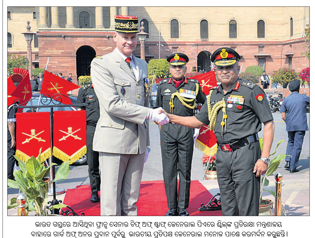
ଭାରତ ଗସ୍ତରେ ଆସିଥିବା ପ୍ରାନ୍ତ ସେନାର ଚିପ୍ ଅଫ୍ ଷ୍ଟାଫ୍ କେନେରାଲ୍ ସିଏସ୍ ଶ୍ରିକାନ୍ତ ପ୍ରତିଭା ମନ୍ତ୍ରାଳୟ ବାହାରେ ଗାର୍ଡ୍ ଅଫ୍ ଅନର୍ ପ୍ରଦାନ ପୂର୍ବରୁ ଭାରତୀୟ ପ୍ରତିପକ୍ଷ କେନେରାଲ୍ ମନୋଜ ପାଣ୍ଡେ କରମଚିନ କରୁଛନ୍ତି।