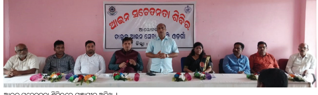
ଆଇନ ସଚେତନତା ଶିବିରରେ ମହାସଭା ଅତିଥି ।