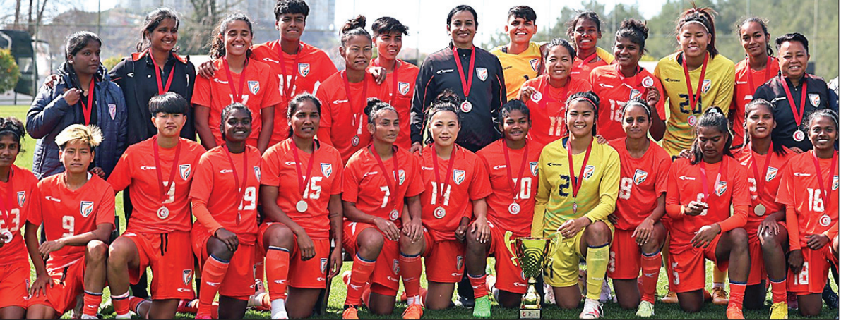
ରନର ଅପ୍ ଟ୍ରଫି ସହ ଭାରତୀୟ ମହିଳା ପୁରୁଷ ଦଳ

ଆଲମାନ୍ (ତୁର୍କୀ), ୨୭୨୭ (ପି.ଟି.) ତୁର୍କୀ ଓ ଫେରୁଜ କ୍ୱିପ୍ ଅନ୍ତର୍ଗତ ରାଜ୍ୟ ରବିନ୍ ମ୍ୟାଚ୍ରେ ଭାରତୀୟ ମହିଳା ଦଳ ସହାଠାରୁ ନିମ୍ନ ରାଜ୍ୟକ୍ରମପ୍ରାପ୍ତ କୋୟୋଭୋଠାରୁ ଏକମାତ୍ର ଗୋଲରେ ପରାସ୍ତ ହୋଇ ରନର ଅପ୍ ହୋଇଛି। ଫକରେ ଦକ୍ଷିଣ ଏସିଆ ଅଞ୍ଚଳ ବାହାରେ ସିନିୟର ସ୍ତରରେ ପ୍ରଥମ ଥର ଗୋଲକଳ ଭିତର