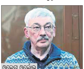
ପୁରସ୍କାର ବିଜୟୀ ମାନବାଧିକାରୀ ସଂଗଠନ ମେମୋରିଆଲ୍‌ର ସହ ଅଧକ୍ଷ। ସେ ରୁଷିଆ ସେନା ବିରୋଧରେ ଲେଖା ପ୍ରକାଶ କରିଥିଲେ। ଓଲୋକକୁ ଦଣ୍ଡିତ କରିଥିଲେ। ତାଙ୍କୁ ସିଧାସଳଖ କୋର୍ଟରୁ ଜେଲକୁ ନିଆଯାଇଛି। ପୁରୀଯୋଗ୍ୟ, ଓଲୋକ ହେଉଛନ୍ତି ନୋବେଲ୍ ଶାନ୍ତି

ଯୁକ୍ତେନ୍ଦ୍ର ବିରୋଧରେ ଯୁଦ୍ଧକୁ ସମାଲୋଚନା କରିଥିବା ଜଣେ ବର୍ଷାୟାନ ମାନବାଧିକାର ସଂଗ୍ରାମୀଙ୍କୁ ମସ୍କୋର ଏକ ଅଦାଲତ ୩୦ ମାସ ଜେଲଦଣ୍ଡରେ ଦଣ୍ଡିତ କରିଛନ୍ତି। ୧୦ ବର୍ଷାୟ ଓଲୋକ ଓଲୋକ ତାଙ୍କୁ କୋଷା ମାଧ୍ୟମରେ ରୁଷିଆ ସେନାକୁ ବାରମ୍ବାର ବଦନାମ କରିବା ଅଭିଯୋଗରେ ପ୍ରାର୍ଥୀ କରିଛନ୍ତି। ପୁରୀଯୋଗ୍ୟ, ଆଗାମୀ ଲୋକ ସଭା ନିର୍ବାଚନରେ ଲକ୍ଷ୍ମୀ ମେଘ ପକ୍ଷରୁ ଦିଲ୍ଲୀରେ ଏଏପି ୪ଟି ଓ କଂଗ୍ରେସ୍‌ରୁ ଗୋଟିଏ ସଦସ୍ୟ ଲଢ଼ିବାକୁ ନିଷ୍ପତ୍ତି ହୋଇଛି। ଏହାସହ ହରିୟାଣାରେ ଏଏପିରୁ ଗୋଟିଏ ଆସନ ଛାଡ଼ିବାକୁ କଂଗ୍ରେସ୍ ରାଜି ହୋଇଛି।