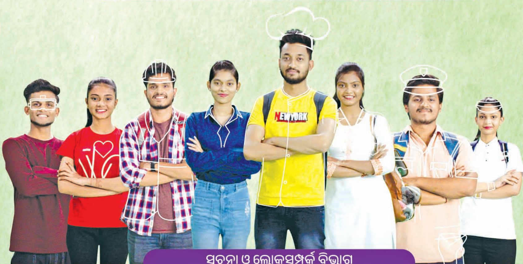
ସୂଚନା ଓ ଲୋକସମ୍ପର୍କ ବିଭାଗ