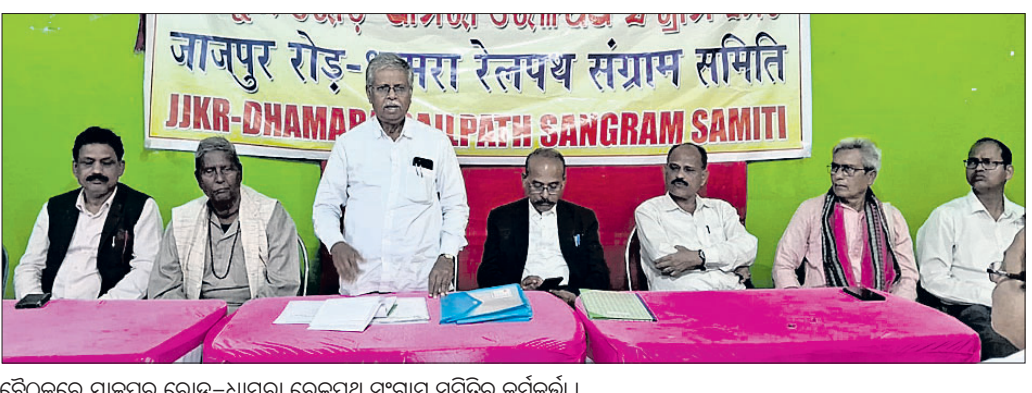
ବୈଠକରେ ଯାଜପୁର ରୋଡ-ଧାମରା ରେଳପଥ ସଂଗ୍ରାମ ସମିତିର କର୍ମକର୍ମୀ।