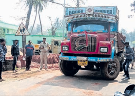
କବଚ ପଥରବୋଝେଇ ଟ୍ରକ୍।