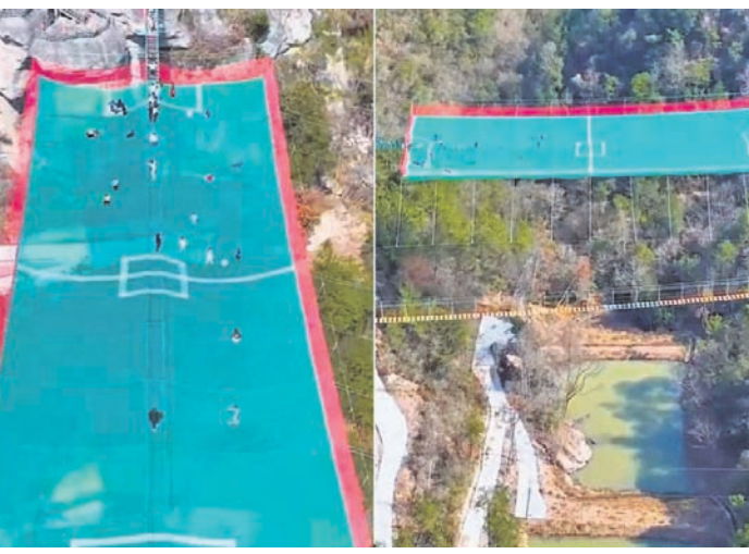
ଗ୍ରାଉଣ୍ଡ ଦେଖିବାକୁ ମିଳୁଛି, ଯାହା ଭୂମିରେ ନିର୍ମିତ ହୋଇଛି। ଭିଡିଓରୁ ଭଲ ଭାବେ ଦେଖି, ବରଂ ବହୁ ଉଚ୍ଚରେ ଆକାଶରେ

ବିଶ୍ୱରେ ଏପରି ଅନେକ ଦେଶ ରହିଛନ୍ତି, ଯେଉଁମାନେ ନିଜ ଭିତ୍ତିଭୂମିରେ ଉନ୍ନତ ଆଶିବା ପାଇଁ ସବୁବେଳେ କିଛି ନା କିଛି ନୂତନ ଏବଂ ବିଶେଷ ପ୍ରୟାସ କରିଥାନ୍ତି। ନିକଟରେ ସାମାଜିକ ଗଣମାଧ୍ୟମ ଏବଂରେ ଏପରି ଏକ ଭିଡିଓ ଭାଇରାଲ ହେବାରେ ଲାଗିଛି, ଯାହା ଦେଖି ଆଖୁକୁ ବିଶ୍ୱାସ ମଧ୍ୟ ହେଉ ନାହିଁ। ଏହି ଭିଡିଓରେ ଏକ ବିଶ୍ୱୟନକ ଫୁର୍ସ୍‌ବଲ ଗ୍ରାଉଣ୍ଡ ନିର୍ମାଣ ହୋଇଥିବା ଦେଖି ଅନେକ ଯୁବକ ଫୁର୍ସ୍‌ବଲ ଚଳିତ ହୋଇଯାଇଛନ୍ତି। ଭାଇରାଲ ହେବାରେ ଲାଗିଥିବା ଏହି ଅବିଶ୍ୱାସନୀୟ ଭିଡିଓ ତାଲନାର ଝେଟିଆଲ୍ ପ୍ରଦେଶର ଘୋଙ୍ଗାଲ୍ ସହରର ହୋଇଥିବା ପୁରୀ ମିଳିଛି। ଭିଡିଓରେ ଏକ ଫୁର୍ସ୍‌ବଲ