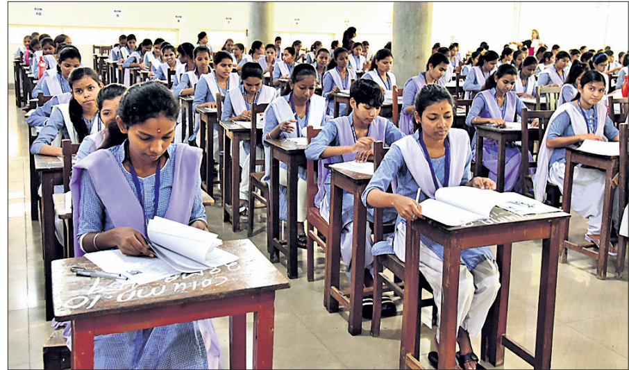
ଭୁବନେଶ୍ୱର, ୨୭/୨ (ଅସମାପିତା ସାହୁ)

ସମ୍ପ୍ରତି ଉଚ୍ଚ ମାଧ୍ୟମିକ ଶିକ୍ଷା ପରିଷଦ (ସିଏସ୍‌ସ୍‌ସି) ଦ୍ୱାରା ପରିଚାଳିତ ମୁକ୍ତ ପରୀକ୍ଷା ଚାଲିଛି । ଏଥିରେ ବିଜ୍ଞାନ ବିଭାଗର ପଢ଼କ (ପଦାର୍ଥ ବିଜ୍ଞାନ) ପରୀକ୍ଷା ପ୍ରଶ୍ନପତ୍ରରେ ତୁଟି ରହିଥିବା ଅଭିଯୋଗ ଆସିଥିଲା । ସିଲାବସ୍ ବାହାରୁ ପ୍ରଶ୍ନ ଆସିଥିବା ଛାତ୍ରଛାତ୍ରୀ ଅଭିଯୋଗ କରିଥିଲେ । କିନ୍ତୁ ସିଲାବସ୍ ବାହାରୁ ନୁହେଁ, ଚଏସ୍ ଡେପାର୍ଟମେଣ୍ଟ ଥିଲା ବୋଲି କର୍ତ୍ତୃପକ୍ଷ କହିଛନ୍ତି । ଏହି ଅଭିଯୋଗକୁ ନେଇ ପରିଷଦ ମଙ୍ଗଳବାର ସମ୍ମାନକରଣ