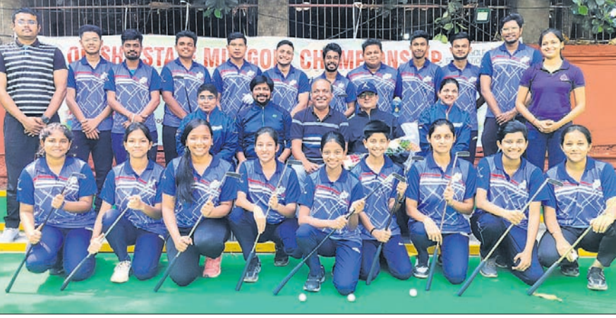
ଜାତୀୟ ମିନିଗଲ୍ ପାଇଁ ମନୋନୀତ ଓଡ଼ିଶା ମହିଳା ଓ ପୁରୁଷ ଦଳ କର୍ମକର୍ତ୍ତାଙ୍କ ସହ ଗ୍ରହଣରେ।

ଭୁବନେଶ୍ୱର, ୨୮/୨ (ତପନ ସାହୁ) ମାର୍ଚ୍ଚ ୩ରୁ ୬ ପର୍ଯ୍ୟନ୍ତ ନାଗପୁରଠାରେ ହେବାକୁ ଥିବା ୯ମ ଜାତୀୟ ମିନିଗଲ୍