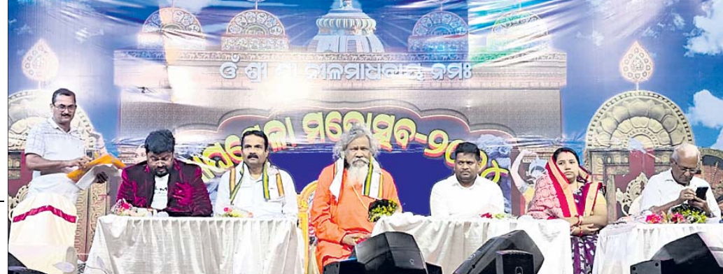
ମାଘମେଳା ଉଦ୍‌ଯାପନା ଉତ୍ସବରେ ମଞ୍ଚାଧୀନ ଅଟୁଥିଲା ।