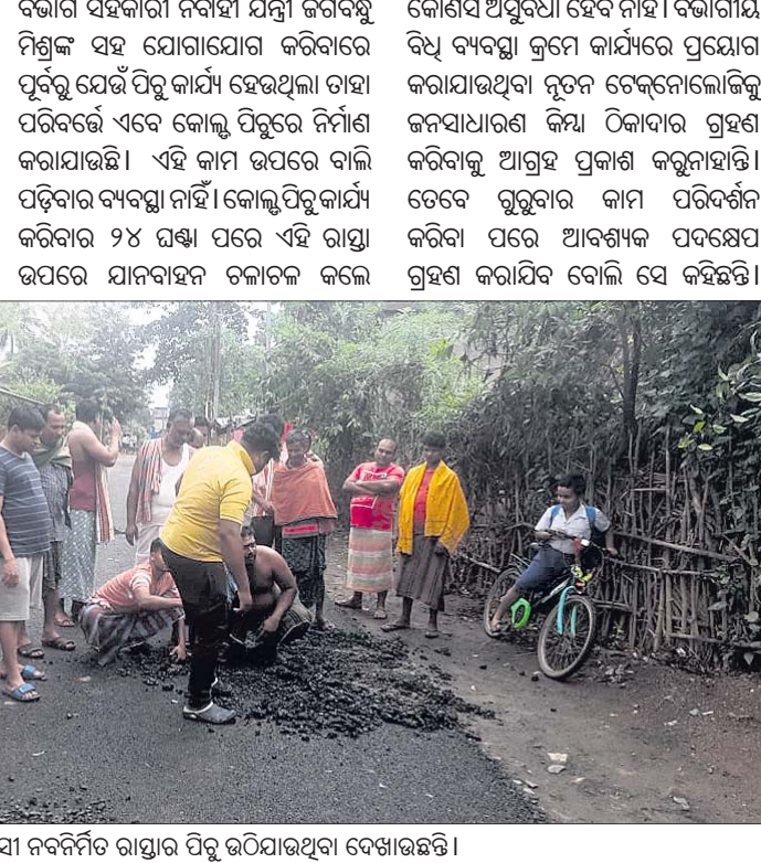
ଗ୍ରାମବାସୀ ନବନିର୍ମିତ ରାସ୍ତାର ପିଚୁ ଉଠିଯାଉଥିବା ଦେଖାଉଛନ୍ତି ।

ବିଭାଗ ସହକାରୀ ନିର୍ବାହୀ ଯତ୍ନ କରନ୍ତୁ ଲୋକଙ୍କୁ ସହାୟତା ଦେବା ପାଇଁ ।