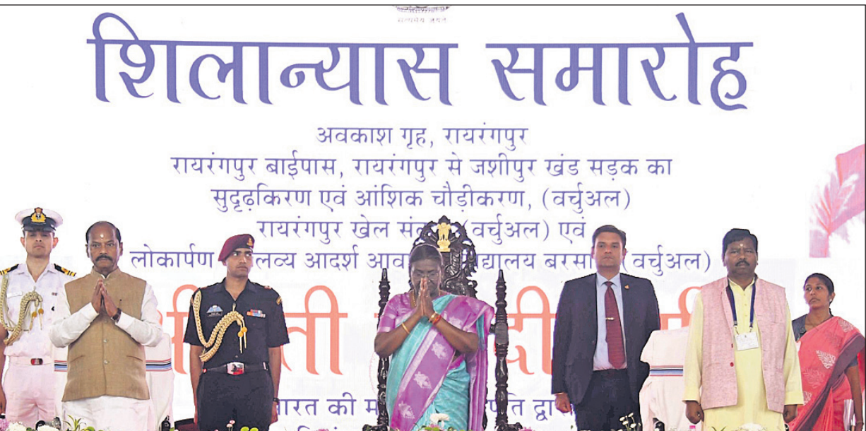
ରାଷ୍ଟ୍ରପତି ଡ୍ରୋପିଫା ମୁର୍ଦ୍ଧା କୀର୍ତ୍ତିକାବଳୀ ମନ୍ଦିରରୁ ଦର୍ଶନ କରି ଫେରିବେ।