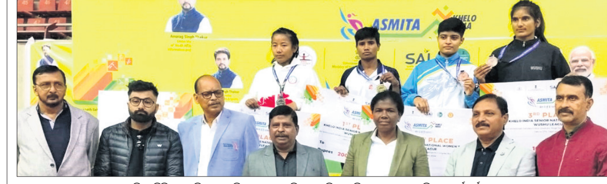
ଖେଳୋ ଇଣ୍ଡିଆ ସିନିୟର ମହିଳା ଉଷ୍ମ ଲିଗ୍ରେ ପଦକ ବିଜୟୀ ଓଡ଼ିଶା ପ୍ରତିଯୋଗୀମାନେ ଅତିଥି ଓ କର୍ମଚାରୀଙ୍କ ସହ ଗଣେ।