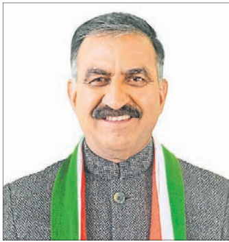
ପୁସ୍ତକ ବିଏ ପୁସ୍ତକ

■ ପୁସ୍ତକ ବିକ୍ରୟରୁ ଉତ୍ପାଦା ଦେଇ ଫେରାଇନେଇ ବିଜ୍ଞାପକ ବିଏ