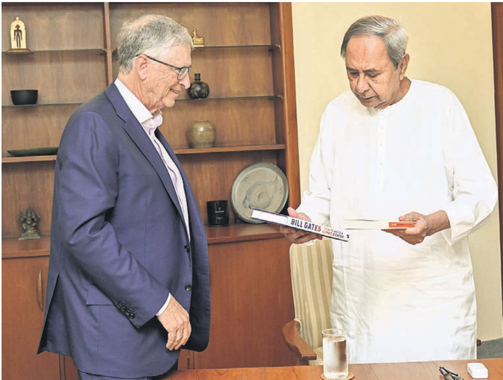
ବିଲ୍ ଓ ମେଲିଣ୍ଡା ଗେଟ୍ସ ଫାଉଣ୍ଡେଶନ୍‌ର ପ୍ରତିଷ୍ଠାତା ବିଲ୍ ଗେଟ୍ସ କୁଖବାର ମୁଖ୍ୟମନ୍ତ୍ରୀ ନବୀନ ପଟ୍ଟନାୟକଙ୍କୁ ନବୀନ ନିବାସରେ ସାକ୍ଷାତ୍ କରିବା ଅବସରରେ ତାଙ୍କ ପୁସ୍ତକ 'ହାଉ ରୁ ଆଜିଏଠିଏ ଲାଇମେଟ୍ ଡିକାସ୍‌ଟର' ପ୍ରଦାନ କରୁଛନ୍ତି ।