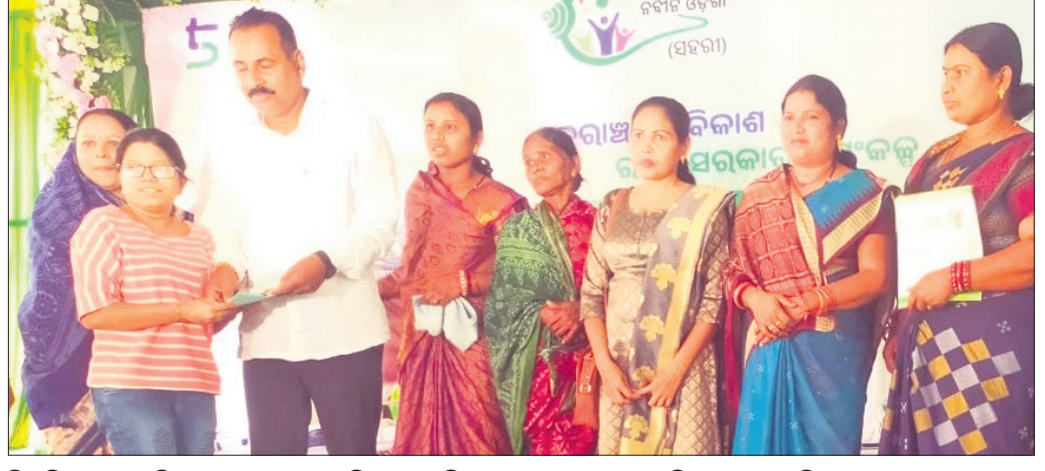
ବିଜ୍ଞାପିତ ଅଞ୍ଚଳ ପରିଷଦ ଅଧ୍ୟକ୍ଷ ମୁଖ୍ୟମନ୍ତ୍ରୀ ମିଶ୍ର ଜଣେ ହିତାଧିକାରୀଙ୍କୁ ସହାୟତା ରାଶି ପ୍ରଦାନ କରୁଛନ୍ତି।