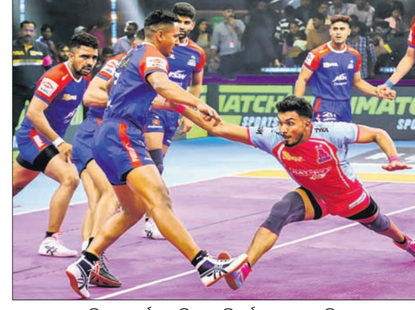
ଜୟପୁର ପିକ ପାଇର୍ସ ଓ ହରିୟାଣା ଷ୍ଟିଲର୍ସ ମଧ୍ୟରେ ଅନୁଷ୍ଠିତ ମ୍ୟାଚ୍।

ପ୍ରୋ କବାଡି ଲିଗର ୧୦ମ ସଂସ୍କରଣର ପାଇନାଲରେ ପୁନେରି ପଲଟନ ଓ ହରିୟାଣା ଷ୍ଟିଲର୍ସ ମଧ୍ୟରେ ଉତ୍ତମପରେ ଅନୁଷ୍ଠିତ ଯେଉଁ ପାଇନାଲ ମୁକାବିଲାରେ ପୁନେରି ପଲଟନ ୩୭-୨୧ରେ ପାଟନା ପାଇରେଟ୍ସକୁ ପରାସ୍ତ କରିଥିଲା।