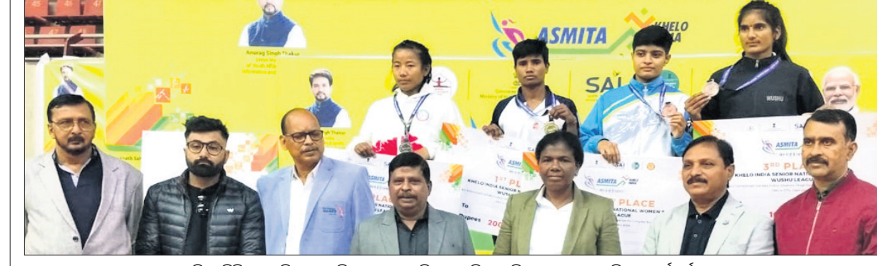
ଖେଲୋ ଇଣ୍ଡିଆ ସିନିୟର ମହିଳା ଉଷ୍ମ ଲିଗ୍ରେ ପଦକ ବିଜୟୀ ଓଡ଼ିଶା ପ୍ରତିଯୋଗୀମାନେ ଅତିଥି ଓ କର୍ମଚାରୀଙ୍କ ସହାୟତାରେ।

ସେତେବେଳେ ବିପଜନକ ସାବ୍ୟସ୍ତ ହୋଇଥାନ୍ତି। ଏଠାରେ ପ୍ରଥମ ରାଉଣ୍ଡରେ ମଧ୍ୟ ତା'ର ପୁନରାବୃତ୍ତି ଘଟିଥିଲା। ଚ୍ୟାଲେଞ୍ଜର୍ସ ସେକ୍ସନରେ ଆର. ବୈଶାଳୀ ମୁକ୍ତେନ୍ଦ୍ରର ଆଖ୍ୟାନ କୋରୋବାଭକ୍ତ ଠାରୁ ହାରିଯାଇଛନ୍ତି।