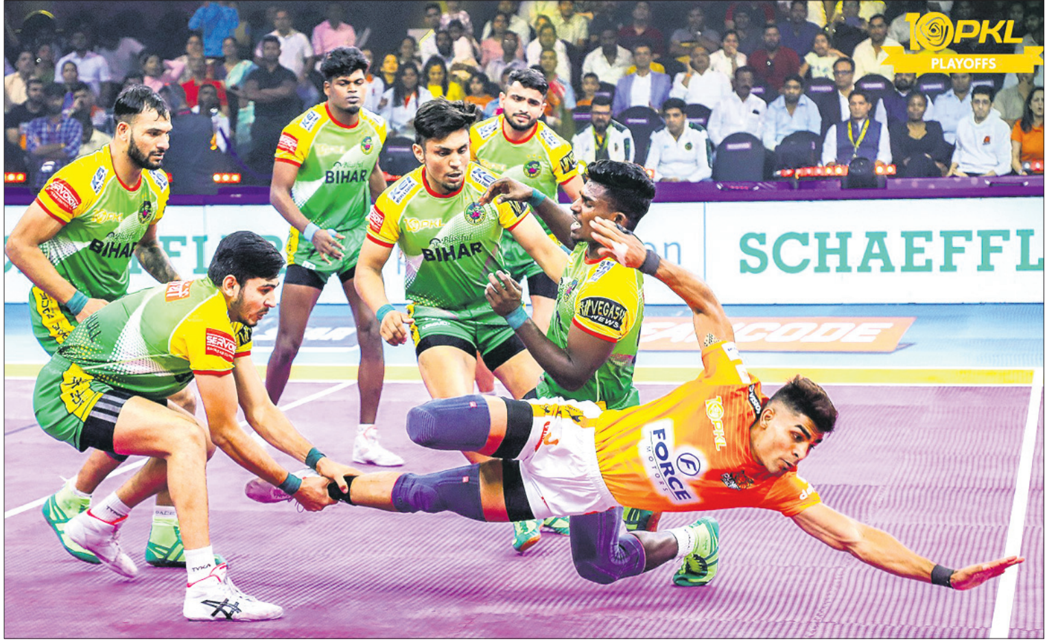
ପ୍ରୋ କବାଡି ଲିଗରେ ବୁଧବାର ପୁନେରି ପଲଟନ ଓ ପାଟନା ପାଇରେଟ୍ସ ମଧ୍ୟରେ ଅନୁଷ୍ଠିତ ମ୍ୟାଚର ଏକ ସଂଘର୍ଷପୂର୍ଣ୍ଣ ମୁହୂର୍ତ୍ତ।