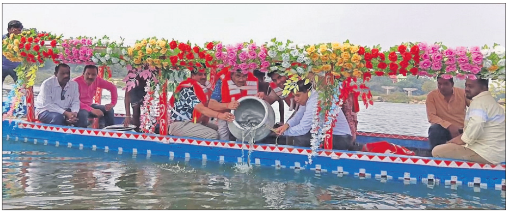
ଅତିଥି ବୃନ୍ଦ ମହାନଦୀର ଲକ୍ଷକୋଟି ଗଣରେ ମାଛ ଯାଆଁଳ ଛାଡ଼ୁଛନ୍ତି।