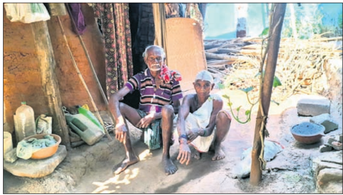
ବୃଦ୍ଧ ଦମ୍ପତି ପଦକ୍ଷେପ ଓ ମଜଦା ।

ବଞ୍ଚିଥିବା ମଧ୍ୟ ଏକ ପରିବାରର ଜଣେ ବ୍ୟକ୍ତିଙ୍କୁ ମୃତ ତାଲିକାରେ କରାଯାଇ ନାହିଁ । ଫଳରେ ସମସ୍ତ ସରକାରୀ ସୁବିଧାକୁ ସେ ବଞ୍ଚିତ ହେଉଛନ୍ତି ।