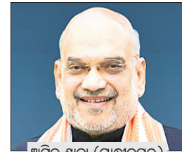
ଅମିତ ଶାହା (ଗାନ୍ଧୀନଗର)