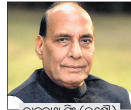
ରାଜନାଥ ସିଂ (ଲକ୍ଷ୍ନୋ)