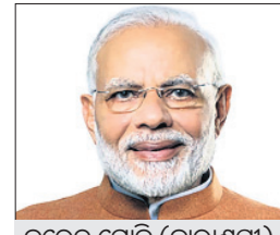
ନରେନ୍ଦ୍ର ମୋଦି (ବାରାଣସୀ)

ଦୀର୍ଘଦିନର ଦାବି ପୂରଣ ହୋଇଛି। ପ୍ରାଚୀନ କଟକ ସହରର ଅନ୍ୟତମ ଐତିହ୍ୟ ଭାବେ ପରିଗଣିତ ରୂପା ତାରକସିକୁ ଶନିବାର ଲିଓଗ୍ରାଫିକାଲ ଇଣ୍ଡିକେଶନ(ଜିଆଇ) ଫୋର୍ ମିଳିଛି। ଏହାଦ୍ୱାରା ଓଡ଼ିଶାର ଜିଆଇ ଫୋର୍ ତାଲିକାରେ ରୂପା ତାରକସି ୨୬ ନମ୍ବର ସ୍ଥାନରେ ରହିଛି। ଚେନାଇଭିଡ଼ ଲିଓଗ୍ରାଫିକାଲ ଇଣ୍ଡିକେଶନ ରେକର୍ଡ୍ସ ପସ୍ତୁରୁ ଏହି ମାନ୍ୟତା ପ୍ରଦାନ କରାଯାଇଥିବା ଜଣାପଡ଼ିଛି। କଟକର ରୂପା ତାରକସି କାରୁକାର୍ଯ୍ୟ ବିଶ୍ୱପ୍ରସିଦ୍ଧ। ହେଲେ ଏହି ଅନନ୍ୟ ଶିଳ୍ପକୁ ଜିଆଇ ଫୋର୍ ମିଳିବା ପାଇଁ ଦୀର୍ଘଦିନରୁ ଦାବି ହୋଇଆସୁଥିଲା। ଦି ଓଡ଼ିଶା ଷ୍ଟେଟ କୋଅପରେଟିଭ ହ୍ୟାଣ୍ଡିକ୍ରାଫ୍ଟ୍ କର୍ପୋରେଶନ ଲିମିଟେଡ୍ (ଉତ୍କଳିକା) ପସ୍ତୁରୁ ରୂପା ତାରକସିକୁ ଜିଆଇ ଫୋର୍ ପ୍ରଦାନ ନିମନ୍ତେ ୨୦୨୧ରେ ଆବେଦନ କରାଯାଇଥିଲା। ଆବେଦନରେ ଦର୍ଶାଯାଇଥିଲା, ରୂପାର ତାରକସି କାରୁକାର୍ଯ୍ୟ ତ୍ରୟୋଦଶ ଶତାବ୍ଦୀରୁ କଟକ ସହରରେ ଆରମ୍ଭ ହୋଇଛି। ଏହି କାରୁକାର୍ଯ୍ୟ ଜରିଆରେ ଓଡ଼ିଶା ନୃତ୍ୟଶିଳ୍ପ ପିଣ୍ଡୁଆ ଗହଣା ସମେତ ବିଭିନ୍ନ ଅଳଙ୍କାର, ସାଜସଜ୍ଜା ନିମନ୍ତେ ବ୍ୟବହାର କରାଯାଉଥିବା କାରୁକାର୍ଯ୍ୟ ସାମଗ୍ରୀ, ଜଗନ୍ନାଥ ମନ୍ଦିର, କୋଣାର୍କ ସୂର୍ଯ୍ୟମନ୍ଦିର, ପୁରୀର ମନ୍ଦିର ପ୍ରତିକୃତି, ଦୁର୍ଗାପୂଜା ସମୟରେ ଦେବାଙ୍କୁ ଲାଗି କରାଯାଉଥିବା ଚୂପୁଷ୍ପା-୭