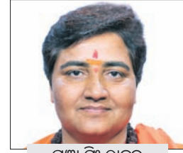
ପ୍ରଜ୍ଞା ସିଂ ଠାକୁର

ନୂଆଦିଲ୍ଲୀ, ୨୩(ପି.ଟି.) ଲୋକ ସଭା ନିର୍ବାଚନ ପାଇଁ ଭାଜପା ଶନିବାର ପ୍ରଥମ ପର୍ଯ୍ୟାୟରେ ୧୯୫ ପ୍ରାର୍ଥୀଙ୍କ ନାଁ ଘୋଷଣା କରିଛି। ଉକ୍ତ ତାଲିକାରେ ୩୪ କେନ୍ଦ୍ରମନ୍ତ୍ରୀ ରହିଛନ୍ତି। ପ୍ରଧାନମନ୍ତ୍ରୀ ନରେନ୍ଦ୍ର ମୋଦି ପୁଣିଥରେ ବାରାଣସୀ ଆସନରୁ ଲଢ଼ିବାକୁ ଥିବାବେଳେ ଅମିତ୍ ଶାହା ରୁଜରାଟର ଗାନ୍ଧୀନଗରରୁ ଏବଂ ରାଜନାଥ ସିଂ ଲକ୍ଷ୍ନୋରୁ ଲଢ଼ିବେ। ପ୍ରାର୍ଥୀ ତାଲିକାରେ ଲୋକ ସଭା ସଭା ସାତଜଣ ଓ ମ୍ ବିଜା ଏବଂ ୨ ଜଣ ପୂର୍ବତନ