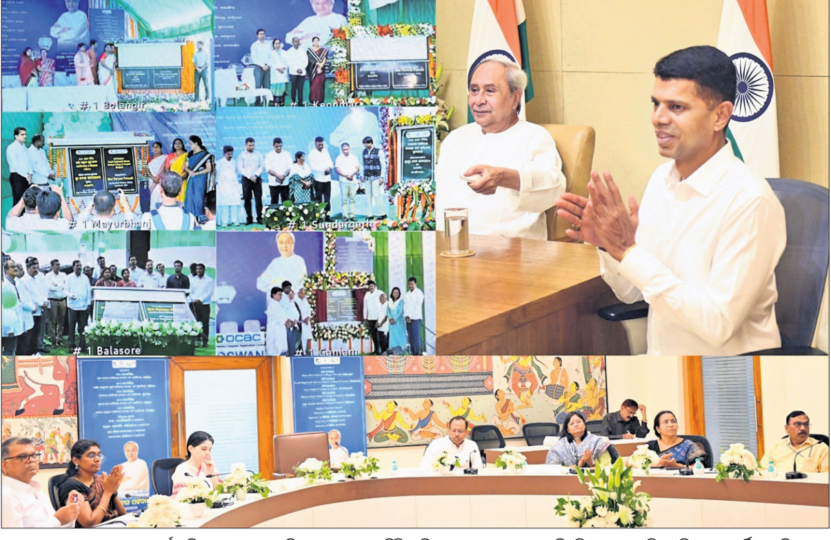
ପୁଣ୍ୟମନ୍ତ୍ରୀ ନବୀନ ପଟ୍ଟନାୟକ ଉର୍ଦ୍ଧ୍ୱାଳି ୪ ସରକାରୀ ମେଡିକାଲ କଲେଜରେ ଚିତି ହସ୍ତିଚାଳର ଉଦ୍‌ଘାଟନ କରୁଛନ୍ତି। ନିକଟରେ ଅଛନ୍ତି ୫-ଟି ଅଧିକ କାର୍ଯ୍ୟ ପାଞ୍ଜିଆନ।