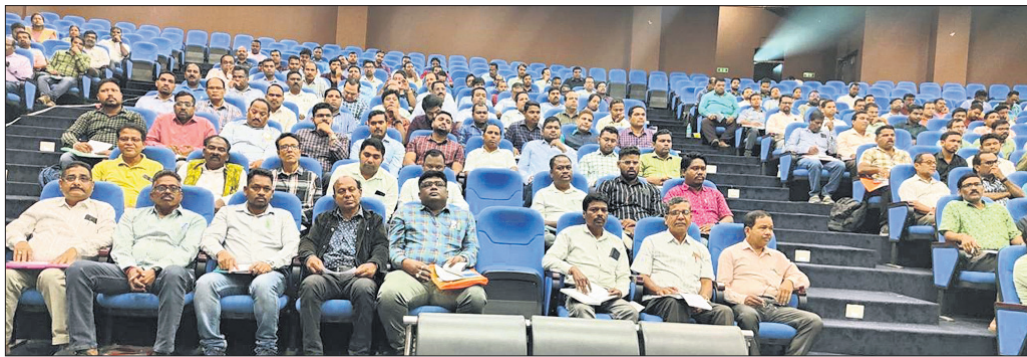
ବୈଠକରେ ଉପସ୍ଥିତ ବିଭିନ୍ନ ଅଧିକାରୀ, ବିତ୍ତ ଓ ଏବଂ ତହସିଲଦାରମାନେ ।