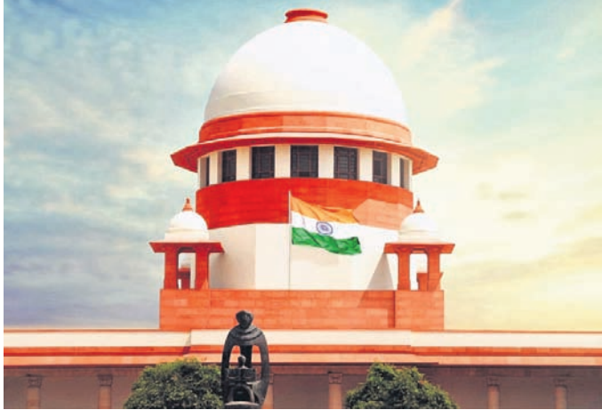
ନିର୍ଦ୍ଦେଶନାମା ପୂର୍ବରୁ ହାଇକୋର୍ଟ କାମିନ ଆବେଦନକୁ ବିଚାର କରିବା ପରିବର୍ତ୍ତେ ବିଚିତ କାରଣ ଦର୍ଶାଇ ଏହାକୁ ଗୁଞ୍ଜାଇ ରଖିଥିଲେ। ନାଗରିକଙ୍କ ସ୍ୱାଧୀନତା ସହ

କଠିତ ମାମଲାକୁ ରୁକ୍ଷ ବିଚାର ନ କରି ଗଢ଼ାଇ ତାଲିକା ଦ୍ୱାରା ସମ୍ପୂର୍ଣ୍ଣ ପକ୍ଷକୁ ତାଙ୍କ ମୂଲ୍ୟବାନ ଅଧିକାରକୁ ବଞ୍ଚିତ କରୁଛି। ସମ୍ବିଧାନ ଅନୁଚ୍ଛେଦ ୨୧ ନାଗରିକମାନଙ୍କ ଏହି ଅଧିକାରକୁ ସୁରକ୍ଷିତ କରୁଥିବା ଖଣ୍ଡପାଠ କହିଛନ୍ତି। ବନ୍ଦେ ହାଇକୋର୍ଟରେ ବିଚିତ ମାମଲାରେ କାମିନ ଏବଂ ଅନ୍ତରାଣ କାମିନ ଆବେଦନର ଦ୍ୱିତୀୟ ନିଷ୍ପତ୍ତି ଆତ୍ମା ପାଇଥିଲେ। ଏଭଳି ଏକ ମାମଲାରେ ଅନ୍ତରାଣ କାମିନ ଆବେଦନକୁ ୪ ବର୍ଷରୁ ଉର୍ଦ୍ଧ୍ୱ ସମୟ ଗୁଜାଇ ରଖାଯାଇଥିଲା ବୋଲି ଖଣ୍ଡପାଠ କହିଛନ୍ତି। ବିଚାରପତିମାନେ ମାମଲାକୁ ରୁକ୍ଷ ବିଚାର ନ ନେଇ ବିଚିତ ବାହାନା କରି ସମୟ ଗଢ଼ାଇ ଗଢ଼ାଇଛନ୍ତି। ତେଣୁ ଆପରାଧିକ ମାମଲା ବିଚାର କରୁଥିବା ସମସ୍ତ ବିଚାରପତିଙ୍କୁ କାମିନ କିମ୍ପା ଅନ୍ତରାଣ କାମିନ ସମ୍ପର୍କ