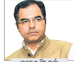
ପ୍ରଦେଶ ସିଂ ବର୍ମା