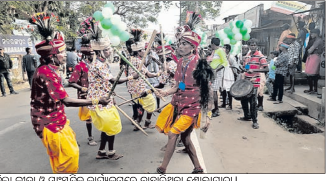
ଜିଲା କ୍ରୀଡ଼ା ଓ ସଂସ୍କୃତିକ କାର୍ଯ୍ୟକ୍ରମରେ ବାହାରିଥିବା ଶୋଭାଯାତ୍ରା ।