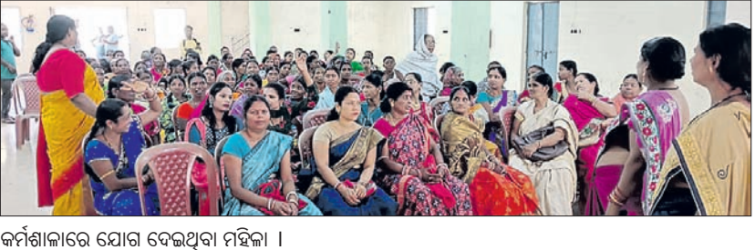
କର୍ମଶାଳାରେ ଯୋଗ ଦେଇଥିବା ମହିଳା ।

କୋରାପୁଟ, ୬୩ (ଅମିତାଳ ବେହେରା) ଭାରତୀୟ ଜନତା ପାର୍ଟି କୋରାପୁଟ ନିର୍ବାଚନମଣ୍ଡଳୀ ପକ୍ଷରୁ ରୂପବାର ନାରୀ ଶକ୍ତି ବନ୍ଦନ କାର୍ଯ୍ୟକ୍ରମ ଅନୁଷ୍ଠିତ ହୋଇଯାଇଛି।