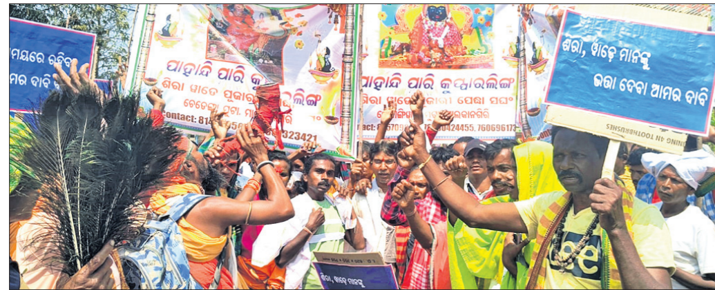
ଜିଲ୍ଲାପାଳଙ୍କ କାର୍ଯ୍ୟାଳୟକୁ ଯାତ୍ରାରେ ଖାତେ, ସିରା, ପୁରୀର ଏବଂ ବିଶାଳୀଗାମେ ।

ମାଲକାନଗିରି, ୬୩(ହୃଦୟଧନ ପାଠ) ମାଲକାନଗିରି ଜିଲା ଅଧିକାରୀଙ୍କୁ ଦ୍ୱାରସ୍ଥ ହୋଇ ଖାତେ ସିରା ବିଶାଳୀ ସଂଘର ସଭାପତି ଉପସ୍ଥିତ ରହି ଉପକାରୀଙ୍କୁ ଗଢ଼ାଇ ଦିଆଯାଇଛି।