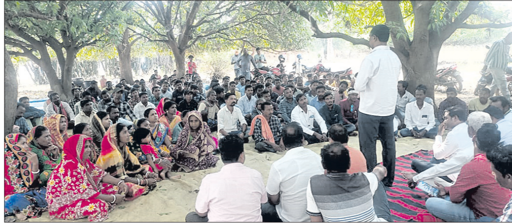
କାର୍ଯ୍ୟକ୍ରମରେ ବିକେଟି କର୍ମଚାରୀ ଓ ଗ୍ରାମବାସୀ ।

ମାଲକାନଗିରି ଜିଲା ବିକେଟି ତରପଟୁ ଘରେ ଘରେ ଶଙ୍ଖ କାର୍ଯ୍ୟକ୍ରମ ଅନୁଷ୍ଠିତ ହୋଇଯାଇଛି। ମାଲକାନଗିରି ସ୍ତର ଉପରେ ଉପସ୍ଥିତ ରହି ଉପକାରୀଙ୍କୁ ଗଢ଼ାଇ ଦିଆଯାଇଛି।