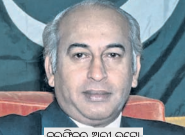
କୁଳଫିକର ଅଲୀ କୁଟୁବୁ

ପିପୁଲ୍ ପାର୍ଟି (ପିପି) ପ୍ରତିଷ୍ଠାତା ତଥା ତାଙ୍କ ଶ୍ୱଶୁର କୁଟୁବୁଲ୍ ପାଶୀଖୁଷ୍ରେ ଝୁଲାଇବା ଅନୁଚିତ ଥିଲା