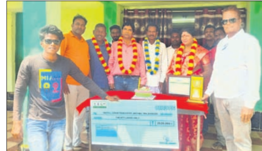
ଅଭିଯାନ ମାଘୁଲି ପଞ୍ଚାୟତରାଜ ପ୍ରକଳ୍ପର ଉଦ୍ଘାଟନ ।