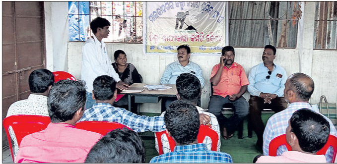
ବିକେଟି ନିଆଯାଇଥିଲା । ଶ୍ରମିକ ସଂଘର ସଭାପତିଙ୍କୁ ହସ୍ତାନ୍ତର କରାଯାଇଛି ।

ମାଲକାନଗିରି ଜିଲା ନିର୍ମାଣ ଶ୍ରମିକ ସଂଘ କାର୍ଯ୍ୟକାରୀ କମିଟି ଚିତ୍ତେଇ ଦ୍ୱାରା ନିର୍ମାଣ ଶ୍ରମିକ ସଂଘର ସଭାପତିଙ୍କୁ ହସ୍ତାନ୍ତର କରାଯାଇଛି। ଏହି କାର୍ଯ୍ୟକ୍ରମରେ ମାଲକାନଗିରି ସ୍ତର ଉପରେ ଉପସ୍ଥିତ ରହି ଉପକାରୀଙ୍କୁ ଗଢ଼ାଇ ଦିଆଯାଇଛି।