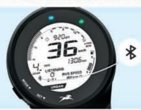
BLUETOOTH CONNECTIVITY WITH VOICE ASSIST**