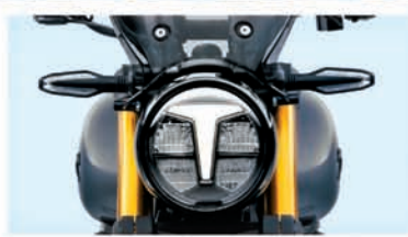
ALL LED LAMPS