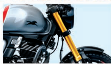
UPSIDE DOWN FRONT FORKS