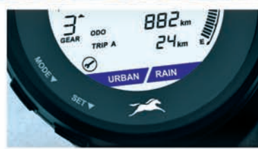
RAIN & URBAN ABS MODES