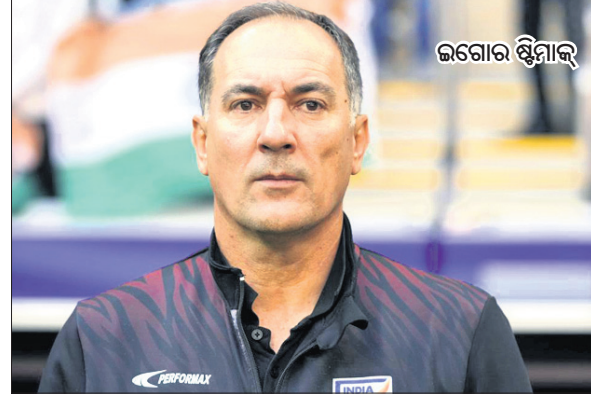
ଦୁଆବିକା, ୭୩ (ପି.ଟି.)

ଭାରତ ଓ ଇଂଲଣ୍ଡ ମଧ୍ୟରେ ଖେଳାଯାଉଥିବା ଅନ୍ତିମ ଟେଷ୍ଟରେ ବିରାଟ କୋହଲିଙ୍କ ରେକର୍ଡ ଭାଙ୍ଗିଛନ୍ତି ଯଶସ୍କା ଜୟଶାଲ। ଇଂଲଣ୍ଡ ବିପକ୍ଷ ୫ ମ୍ୟାଚ୍ ବିଶିଷ୍ଟ ଟେଷ୍ଟ ସିରିଜରେ ସର୍ବାଧିକ ରନ କରିବାରେ ସେ କୋହଲିଙ୍କୁ ପଛରେ ଛାଡିଛନ୍ତି। ୨୦୧୬ରେ କୋହଲି ଇଂଲଣ୍ଡ ବିପକ୍ଷରେ ୬୫୭ ରନ୍ ସ୍କୋର କରିଥିଲେ। ଅନ୍ତିମ ଟେଷ୍ଟର ପ୍ରଥମ ଇନିଂସରେ ଜୟଶାଲ ୫୭ ରନ୍ର ଇନିଂସ ଖେଳିବା ସହ ୭୦୦ ରନ୍ ମାର୍କ ଅତିକ୍ରମ କରିଛନ୍ତି। ୨୦୦୨ରେ ବର୍ତ୍ତମାନ ଭାରତୀୟ ଦଳର ମୁଖ୍ୟ କୋର୍