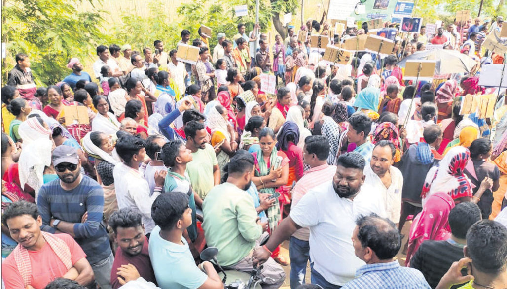
ରୁକ୍ମିଣୀଙ୍କୁ ନେଇ ଚାଷୀମାନେ କଟକ ଯାତ୍ରା ଆରମ୍ଭ କରିଛନ୍ତି।

ନୂଆଗାଁ ମୁଖ୍ୟ ରାସ୍ତାକୁ ଜବରଦସ୍ତୀ ଭିକାରୀଙ୍କୁ ନେଇ ଚାଷୀ ଆନ୍ଦୋଳନ ଆରମ୍ଭ ହୋଇଛି। ଚାଷୀମାନେ ଚାଷୀ ଆନ୍ଦୋଳନ ଆରମ୍ଭ କରିଛନ୍ତି। ଚାଷୀମାନେ ଚାଷୀ ଆନ୍ଦୋଳନ ଆରମ୍ଭ କରିଛନ୍ତି। ଚାଷୀମାନେ ଚାଷୀ ଆନ୍ଦୋଳନ ଆରମ୍ଭ କରିଛନ୍ତି।