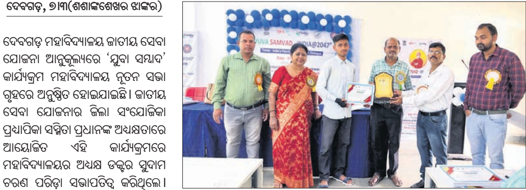
ଦେବଗଡ଼, ୨୩(ଶଶୀକାନ୍ତ ଖେଳ): ଦେବଗଡ଼ ମହାବିଦ୍ୟାଳୟରେ 'ୟୁବା ସମାଦ' କାର୍ଯ୍ୟକ୍ରମ ଅନୁଷ୍ଠିତ ହୋଇଯାଇଛି।

ଦେବଗଡ଼ ମହାବିଦ୍ୟାଳୟରେ 'ୟୁବା ସମାଦ' କାର୍ଯ୍ୟକ୍ରମ ଅନୁଷ୍ଠିତ ହୋଇଯାଇଛି। ଦେବଗଡ଼ ମହାବିଦ୍ୟାଳୟରେ 'ୟୁବା ସମାଦ' କାର୍ଯ୍ୟକ୍ରମ ଅନୁଷ୍ଠିତ ହୋଇଯାଇଛି।