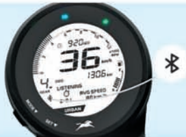
BLUETOOTH CONNECTIVITY WITH VOICE ASSIST**