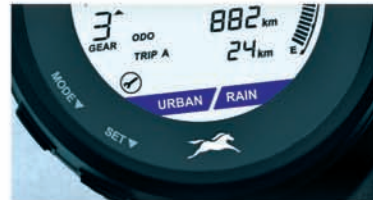
RAIN & URBAN ABS MODES