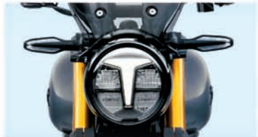
ALL LED LAMPS