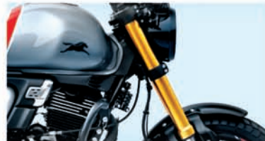
UPSIDE DOWN FRONT FORKS