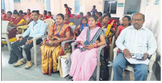
ତାଲିମ କର୍ମଶାଳାରେ ଉପସ୍ଥିତ ଅଧିକାରୀ।

ସୁନ୍ଦରଗଡ଼ ଜିଲ୍ଲା ସର୍ବୋତ୍ତମ କୁଳର ସମସ୍ତ ସ୍ତ୍ରୀମାନଙ୍କୁ ଅଧିକାରୀଙ୍କୁ ନେଇ ଏକ ତାଲିମ କର୍ମଶାଳା ସ୍ଥାନୀୟ ରାଜ୍ୟ ଗାନ୍ଧୀ ସେବା କେନ୍ଦ୍ରରେ କୁଳ ପ୍ରଶାସନ ତରଫରୁ ବିଭିନ୍ନ ସାମାଜିକ ଓ ଉପଯୋଗୀ କର୍ମଶାଳାରେ କୁଳର ସମସ୍ତ ୨୫ ଜଣ ସ୍ତ୍ରୀମାନଙ୍କୁ ଅଧିକାରୀଙ୍କୁ ନେଇ ଏକ ତାଲିମ କର୍ମଶାଳା ଅନୁଷ୍ଠିତ ହୋଇଯାଇଛି।