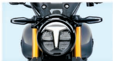
ALL LED LAMPS