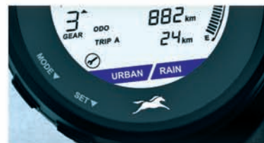
RAIN & URBAN ABS MODES