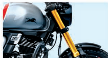
UPSIDE DOWN FRONT FORKS