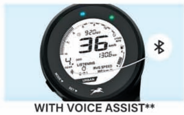
WITH VOICE ASSIST**