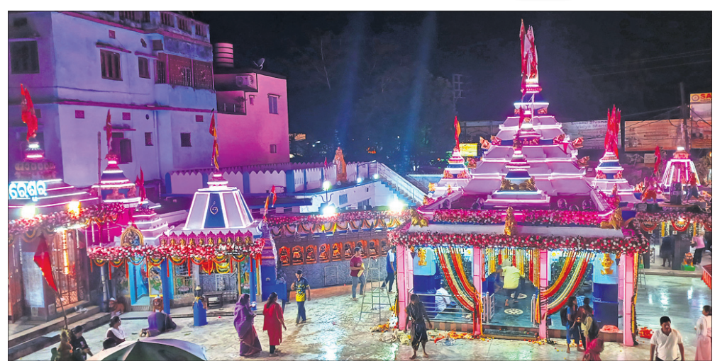
ମହାଶିବରାତ୍ରି ପାଇଁ କଟକ ବନ୍ଧୁବଳାରମ୍ଭିତ ଅମରେଶ୍ୱର ମନ୍ଦିରକୁ ଆଲୋକମାଳାରେ ସଜ୍ଜିତ କରାଯାଇଛି।

କଟକ, ୨୩ (ଶିଳ୍ପୀ ପ୍ରିୟଦର୍ଶିନୀ) ଶୁକ୍ରବାର ମହାଶିବରାତ୍ରି ବିଭିନ୍ନ ଶୈବପୀଠରେ ଭକ୍ତମାନେ ଠାକୁରଙ୍କୁ ଦର୍ଶନ କରିବା ସହ ପୂଜାର୍ଚ୍ଚନା କରିବେ। ଏଥିପାଇଁ ବିଭିନ୍ନ ଶୈବପୀଠ ଚଳଚଞ୍ଚଳ ହୋଇପଡିଥିବାବେଳେ ଗୁରୁବାର ସୁଦ୍ଧା ପ୍ରସ୍ତୁତି ଶେଷ ହୋଇଛି। ମନ୍ଦିରଗୁଡ଼ିକ ଉଜ୍ଜ୍ୱଳରେ ଆଲୋକମାଳାରେ ଝଲସୁ ରୁଛି। ବିଶେଷକରି କଟକ ଜିଲାର ଶୈବପୀଠଗୁଡ଼ିକରେ ଭକ୍ତଙ୍କ ଶୁଖିଳିତ ଦର୍ଶନ ପାଇଁ ବ୍ୟବସ୍ଥା କରାଯାଇଛି। କେତେକ ମନ୍ଦିରରେ ସାଂସ୍କୃତିକ କାର୍ଯ୍ୟକ୍ରମ ପାଇଁ ବ୍ୟବସ୍ଥା କରାଯାଇଛି। କଟକ ଯୋଡ଼ାଠାରେ ଥିବା ପାରେଶ୍ୱର ମହାଦେବ ମନ୍ଦିରରେ ରାତି ୨ଟାରେ ମହାଦୀପ ଉଠିବ ବୋଲି ମନ୍ଦିର ପରିଚାଳନା କମିଟି ପକ୍ଷରୁ ଜଣାପଡିଛି। କଟକ ସହରର