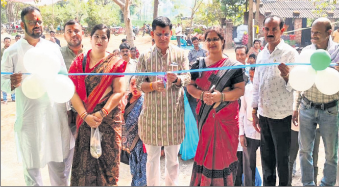
ବରଗଡ଼ ବିଧାୟକ ମୁଖ୍ୟମନ୍ତ୍ରୀ ସଭାଗୃହର ଲୋକାର୍ପଣ କରୁଛନ୍ତି ।