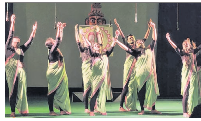
ମହୋତ୍ସବରେ ମାନ୍ୟତା ନାଟକର ଏକ ଦୃଶ୍ୟ।

ସମ୍ବଲପୁର, ୯ମାର୍ଚ୍ଚ (ବି.ଶଙ୍କର) ଏହି ନାଟ୍ୟକୁ ମୁଖ୍ୟ ଅତିଥି ଭାବେ ଯୋଗଦେଇଥିଲେ। ଉତ୍ସବ ଆୟୋଜକ ପକ୍ଷରୁ ପ୍ରୋତ୍ସାହନରେ ତତ୍ତ୍ୱାବଳିତ ହୀରାଘଣ୍ଟ ନାଟ୍ୟ ମହୋତ୍ସବର ଦ୍ୱିତୀୟ ରଙ୍ଗରେ ବଙ୍ଗଳା ଭାଷାରେ ନାଟକ ଉତ୍ସବ ସମୟ ମାନ୍ୟତା ଦେବାକୁ ପରିଚାଳନା କରାଯାଇଛି।