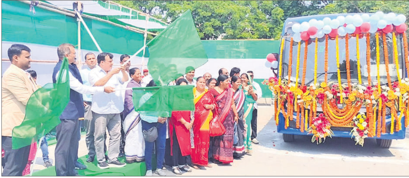
ସବୁଜ ପତାକା ଦେଖାଇ 'ମୋ ବସ୍' ସେବାର ଶୁଭାରମ୍ଭ କରାଯାଇଛି।

ସମ୍ବଲପୁର, ୯ମାର୍ଚ୍ଚ (ଭବନୀ ଶଙ୍କର ଭୋଇ): ଓଡ଼ିଶା ସାଂସ୍କୃତିକ ସମାଜ ଭବନଠାରେ ପଶ୍ଚିମ ଓଡ଼ିଶା ଦଲିତ ସୁରକ୍ଷା ପରିଷଦ ପକ୍ଷରୁ ଶନିବାର ବିଶିଷ୍ଟ ବ୍ୟକ୍ତିଗଣଙ୍କୁ ସମ୍ବର୍ଦ୍ଧନା କରାଯାଇଛି।