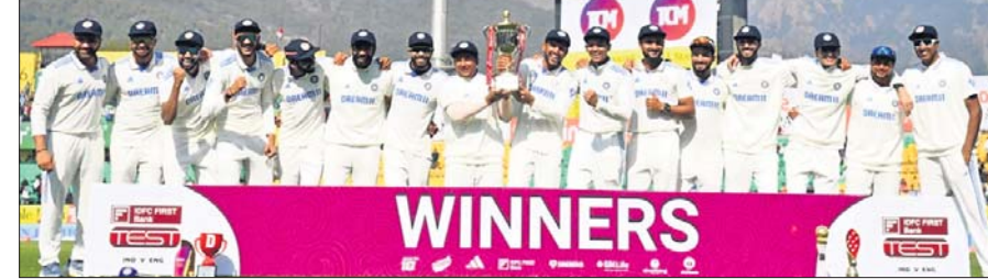
ଇଂଲଣ୍ଡ ବିପକ୍ଷରେ ଟେଷ୍ଟ ସିରିଜ ବିଜୟୀ ଭାରତୀୟ ଦଳ।

୩ ଦିନରେ ଶେଷ ହେଲା ୫ମ ଟେଷ୍ଟ। ଇଂଲଣ୍ଡ ଏକ ଇନ୍‌ସିଂସ ୬୪ ରନରେ ପରାସ୍ତ। କୁଲଦୀପ ଯାଦବ ପୂର୍ଣ୍ଣ ଓ ୨୫ ମିଟର ଇନ୍‌ସିଂସରେ ୫ ଉଇକେଟ୍ ପାଇଥିଲେ। କେନ୍ଦୁ ଆଶ୍ୱରାୟ ୨ ଉଇକେଟ୍ ନେବାସହ ଟେଷ୍ଟରେ ୭୦୦ ଉଇକେଟ୍ ପୁରଣ କରିଥିଲେ। ଦ୍ୱିତୀୟ ଇନ୍‌ସିଂସ ଆରମ୍ଭ ହୋଇଥିଲା। ମାତ୍ର ୩୭ ରନରେ ୩ ଉଇକେଟ୍ ହରାଇ ଭ୍ରମଣକାରୀ ଦଳ ବ୍ୟାକ୍‌ସ୍ପୋର୍ଟକୁ ଚାଲିଯାଇଥିଲା। ମିଡିଲ ଅର୍ଡରରେ ଜୋ ରୁଟ୍ ୮୪ ଓ ଜି ବେୟାରଣ୍ଡେ ୩୯ ରନ କରି ଯଦିଓ ଭାରତୀୟ ବୋଲରଙ୍କ କିଛି ସମୟ ପୂଜାବିଳା କରିବା ସମ୍ଭବ ହୋଇଥିଲେ, ତେବେ ଚାନ୍ଦ ଇଂଲଣ୍ଡକୁ ଇନ୍‌ସିଂସ ପରାଜୟରୁ ରକ୍ଷା କରିପାରି ନ ଥିଲା। ଭାରତ ପକ୍ଷରୁ ରବିଚନ୍ଦ୍ର ଅଶ୍ୱିନ ୫ଟି, ଯଶପ୍ରାଦ୍ କୁମ୍ଭାରା ଓ କୁଲଦୀପ ଯାଦବ ୨ଟି ଲେଖାଏ ଉଇକେଟ୍ ନେଇଥିଲେ। ସଂକ୍ଷିପ୍ତ ସ୍ୱାର ଭଂକ୍ଷିତ ପ୍ରଥମ ଇନ୍‌ସିଂସ: ୨୧୮। ଭାରତ ପ୍ରଥମ ଇନ୍‌ସିଂସ: ୪୭୭। ଇଂଲଣ୍ଡ ଦ୍ୱିତୀୟ ଇନ୍‌ସିଂସ: ୧୯୫/ଅଲଆଉଟ୍ (ଜୋ ରୁଟ୍-୮୪, ଜି ବେୟାରଣ୍ଡେ-୩୯, ରବିଚନ୍ଦ୍ର ଅଶ୍ୱିନ-୫/୭୭, ଯଶପ୍ରାଦ୍ କୁମ୍ଭାରା-୨/୩୮, କୁଲଦୀପ ଯାଦବ-୨/୪୦, ରବୀନ୍ଦ୍ର ଜାଡେଜା-୧/୨୫)।