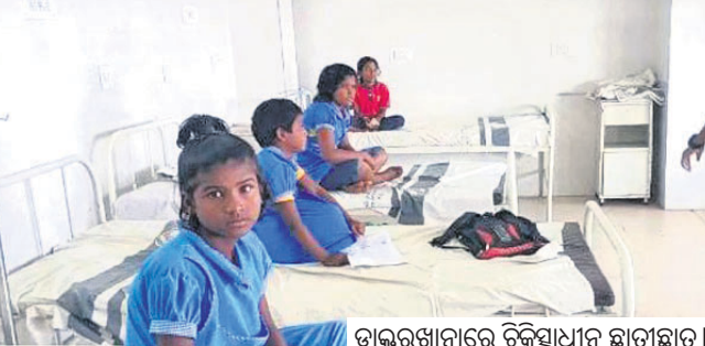
ଡାକ୍ତରଖାନାରେ ଚିକିତ୍ସାଧୀନ ଛାତ୍ରାଛାତ୍ରୀ ।