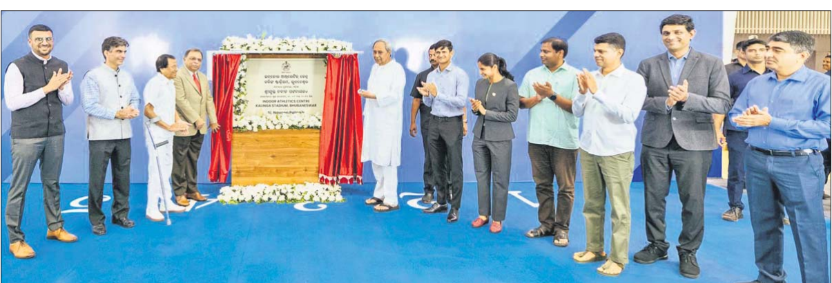
କଳିଙ୍ଗ ଷ୍ଟାଡ଼ିୟମରେ ଶନିବାର ଇନ୍ଡୋର ଆଧୁନିକ ସେଣ୍ଟର ଉଦ୍ଘାଟନ ଅବସରରେ ମୁଖ୍ୟମନ୍ତ୍ରୀ ନବୀନ ପଟ୍ଟନାୟକ ଓ ଅନ୍ୟ ଅତିଥିବୃନ୍ଦ।