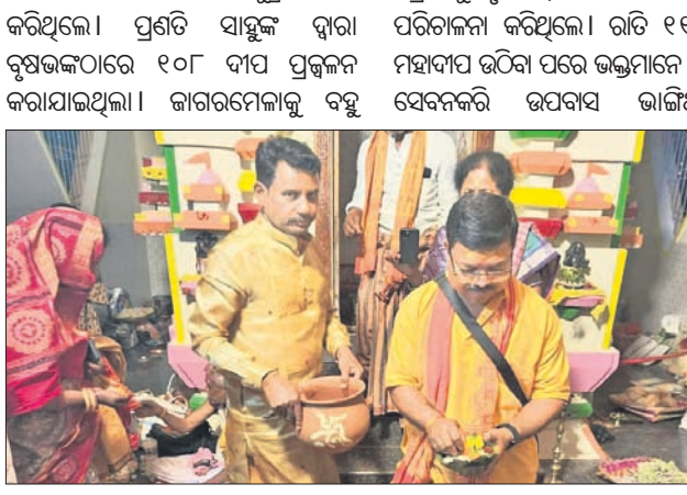
ବାବାଙ୍କୁ ଜଳଧାନ କରୁଥିବା ବିଧାନିକା।