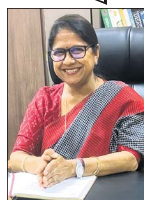
ଶିଳ୍ପୀ ସାହୁ ହେଉଛି ଏହି ଚାମ୍ପିୟନ୍ସ ଟ୍ରଫି ଅଳ୍ପ ପ୍ରକ୍ରିୟା ମାଧ୍ୟମରେ ପ୍ରତି ଦଳରେ ୧୮ ଜଣ ଖେଳାଳି

ଭୁବନେଶ୍ୱର, ୯ମ (ତପନ ସାହୁ) ସାଇ ଇଣ୍ଟରନାଶନାଲ ରେସିଡେନ୍ସିଆଲ ସ୍କୁଲ (ଏସ୍‌ଆଇଆର୍‌ଏସ୍) ଚାମ୍ପିୟନ୍ସ ଟ୍ରଫି କ୍ରିକେଟ୍ ଟୁର୍ନାମେଣ୍ଟ ଚଳିତ ମାସ ୧୨ ତାରିଖରୁ ଆରମ୍ଭ ହେବାକୁ ଯାଉଛି। ଏହା ହେବ ପ୍ରତିଯୋଗିତାତୃତୀୟ ଏଂକ୍ସରଣ। ରୋମାଞ୍ଚଭରା ଏହି କ୍ରିକେଟ୍ ପ୍ରତିଯୋଗିତାରେ ଏଥର ମୋଟ ୬ଟି ଦଳ ଅଂଶଗ୍ରହଣ କରୁଛନ୍ତି। ଦଳଗୁଡ଼ିକର ନାମ ହେଲା କୋହଲି ଓରିୟଣ୍ଟ, ଗାଙ୍ଗୁଲି ଗ୍ୟାଙ୍ଗ୍, ସଚିନ ସ୍ନାକର୍ସ, ଯୋନୀ ଡେଭିଲ୍, ସେହ୍ନା ସ୍ନାକର୍ସ ଓ ଭ୍ରାଜିତ ଡେଭିଲ୍। ୨୨ ତାରିଖ ପର୍ଯ୍ୟନ୍ତ ହେବାକୁ ଥିବା