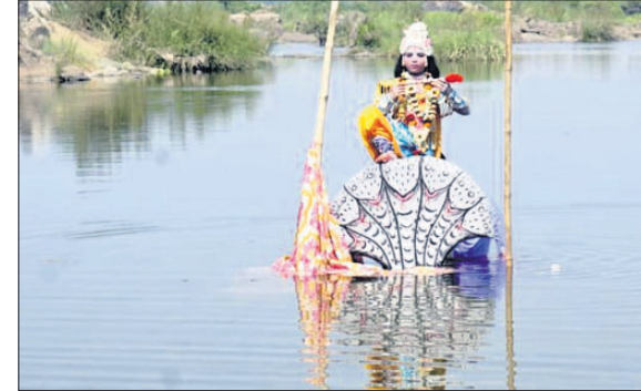
ଶ୍ରୀକୃଷ୍ଣଙ୍କ କାଳୀୟ ଦଳନର ଦୃଶ୍ୟ।

ସମ୍ବଲପୁରୀ ଧନୁସ୍ତାତ୍ରୀ ଶନିବାର ଚତୁର୍ଥ ଦିବସରେ ଗୋପପୁର (ଗାଉଁରପୁର)ରେ ଶ୍ରୀକୃଷ୍ଣଙ୍କ ବାଲ୍ୟଲୀଳା ପ୍ରଦର୍ଶିତ ହୋଇଥିଲା। ଶ୍ରୀକୃଷ୍ଣ ଦହି ହାଣ୍ଡି ଭାଙ୍ଗିବା ନେଇ ଗୋପପୁରବାସୀ ଯଶୋଦାଙ୍କୁ ଅଭିଯୋଗ କରିଥିଲେ। ଏହାପରେ ମହାନଦୀ ବାଞ୍ଚେଇପୁର ଘାଟରେ କାଳୀୟ ଦଳନ ନାଟ୍ୟ ରୂପାନ୍ତର ଦର୍ଶକଙ୍କୁ ଆକୃଷ୍ଟ କରିଥିଲା।