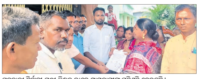
ସହକାରୀ ନିର୍ବାହୀ ଯନ୍ତ୍ରୀ ଲିଖିତ ଭାବେ ଗ୍ରାମବାସୀଙ୍କୁ ପ୍ରତିଶ୍ରୁତି ଦେଇଛନ୍ତି।

ଧର୍ମଗଡ଼, ୯୩(ହିମାଂଶୁ ଶେଖର ପଣ୍ଡା) ଯନ୍ତ୍ରୀ ମଧ୍ୟାହ୍ନଭୋଜନ ଯୋଗାଇ ଆସୁଛି। ଏପରି ଘଟଣା ବାରମ୍ବାର ଘଟୁଥିଲେ ମଧ୍ୟ ଜିଲ୍ଲା ପ୍ରଶାସନ କାର୍ଯ୍ୟାଳୟରୁ ଗ୍ରହଣ କରୁ ନ ଥିବା ଅଭିଯୋଗ ଆଣି ଅସନ୍ତୋଷ ବୃଦ୍ଧି ପାଇଛି। ସେମାନଙ୍କ ଖାମଖାଆଳି କାର୍ଯ୍ୟ ଯୋଗୁ ଏଭଳି ଘଟଣା ଘଟୁଥିବା ଚଳି ହେଉଛି। ଏନେଇ ବ୍ଲକ୍ ଶିକ୍ଷାଧିକାରୀ ମିଳିକ କହିଛନ୍ତି, ଭଉଣି ଘଟଣାରେ ୨ ଷ୍ଟୁଲର ପ୍ରଧାନଶିକ୍ଷକଙ୍କୁ ଚିପୋର୍ ମନାଯାଇଛି। ଚିପୋର୍ ମିଳିବା ପରେ ସାହା ପଦକ୍ଷେପ ନିଆଯିବ।