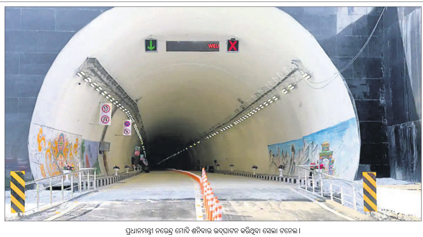
ପ୍ରଧାନମନ୍ତ୍ରୀ ନରେନ୍ଦ୍ର ମୋଦି ଶନିବାର ଉଦ୍ଘାଟନ କରିଥିବା ସେଲ ଚଳେଇ।

ନୂଆଦିଲ୍ଲୀ, ୯ମାର୍ଚ୍ଚ: ଇଲେକ୍ଟୋରାଲ ବଣ୍ଟ ସମ୍ପର୍କିତ ତଥ୍ୟ ଦାଖଲ ସମାପ୍ତ ହେବାକୁ ମଧ୍ୟ ୩୦ ପର୍ଯ୍ୟନ୍ତ ବଢ଼ାଇବା ନିମନ୍ତେ କ୍ଷେତ୍ର ବ୍ୟାପୀ ଅଧିକାରୀ (ଏସ୍‌ବିଆଇ) କରିଥିବା ଆବେଦନର ଶୁଣାଣି ଆସନ୍ତା ୧୧ ତାରିଖରେ ସୁପ୍ରିମକୋର୍ଟରେ ହେବ। ସାମ୍ବନ୍ଧିକ ପାଠରେ ହେବ। ପ୍ରଧାନ ବିଚାରପତି ଡି.ଓ.ଲୀ. ରତ୍ନକୃଷ୍ଣଙ୍କ ଅଧ୍ୟକ୍ଷତାରେ ଗଠିତ ସାମ୍ବନ୍ଧିକ ପାଠ ଗତ ମାସ ୧୫ ତାରିଖରେ ଇଲେକ୍ଟୋରାଲ ବଣ୍ଟକୁ ଅସାମ୍ବନ୍ଧିକ ଏବଂ ତଥ୍ୟ ଶାନ୍ତିବା ଅଧିକାରର ଉଲ୍ଲଙ୍ଘନ ଦର୍ଶାଇ ଏହାକୁ ରଦ୍ଦ କରିଦେଇଥିଲେ। ଏଥିପ୍ରତି ବଣ୍ଟ ସମ୍ପର୍କିତ ସର୍ବୋଚ୍ଚ ତଥ୍ୟ ମାତ୍ର ୬ ପୃଷ୍ଠା ନିର୍ବାଚନ କମିଶନଙ୍କ ନିକଟରେ ଦାଖଲ କରିବା ନିମନ୍ତେ ସର୍ବୋଚ୍ଚ ଅଧିକାରୀ ଏସ୍‌ବିଆଇକୁ ନିର୍ଦ୍ଦେଶ ଦେଇଥିଲେ। ତେବେ ଏତେ କମ୍ ସମୟ ମଧ୍ୟରେ ଇଲେକ୍ଟୋରାଲ ବଣ୍ଟ ସମ୍ପର୍କିତ ସମସ୍ତ ତଥ୍ୟ ଏକାଠି କରିବା ସହଜ ନୁହେଁ ବୋଲି ଦର୍ଶାଇ ଏସ୍‌ବିଆଇ ସମୟ ବଢ଼ାଇବା ପାଇଁ ଗତ ୪ ତାରିଖରେ ଆବେଦନ କରିଥିଲା।