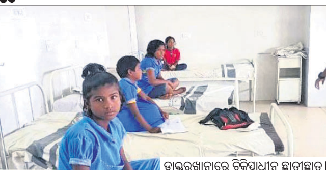
ଡାକ୍ତରଖାନାରେ ଚିକିତ୍ସାଧୀନ ଛାତ୍ରାଛାତ୍ରୀ।