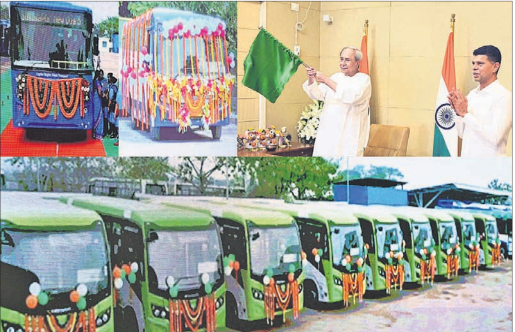
୧୯ ମେଟ୍ରୋ ରେଳ ଯୋଜନା ମୁଖ୍ୟ ଓଡ଼ିଶା ବିଭାଗରେ ଆମର ଉଦ୍ୟମକୁ ଶକ୍ତିଶାଳୀ କରୁଛି। ସମ୍ବଲପୁର ଓ ବ୍ରହ୍ମପୁର ସହରରେ ମୋ ବସ୍ ସେବା ଆରମ୍ଭ ହେଲା। ଏହାଦ୍ୱାରା ଲୋକମାନେ ସହର ଭିତରେ ସରା ରାଜ୍ୟରେ ଗାଁକୁ ସହର ସହୁଡ଼ାପେ ପରିବହନ ବ୍ୟବସ୍ଥାରେ ରୂପାନ୍ତର ଆସିଛି। ମୋ ବସ୍‌ରୁ ଆରମ୍ଭ କରି ଲକ୍ଷ୍ମୀ ଯୋଜନା

ଭଉଣି ଯୋଗାଯୋଗ ସମ୍ବଳ ଭବିଷ୍ୟତର ଆଧାର: ପୁଣ୍ୟମନ୍ତ୍ରୀ ରାଜ୍ୟର ସବୁ ସହରରେ ମୋ ବସ୍ ସେବା ପ୍ରସିଦ୍ଧା ମିଳିବ