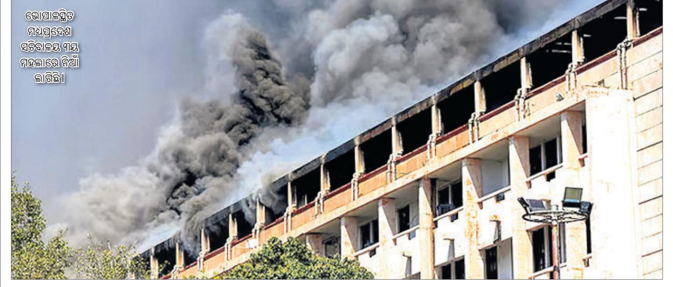
ଭୋପାଳସ୍ଥିତ ମଧ୍ୟପ୍ରଦେଶ ସଚିବାଳୟ, ମାୟା ମହଲାରେ ନିଆଁ ଲାଗିଛି।