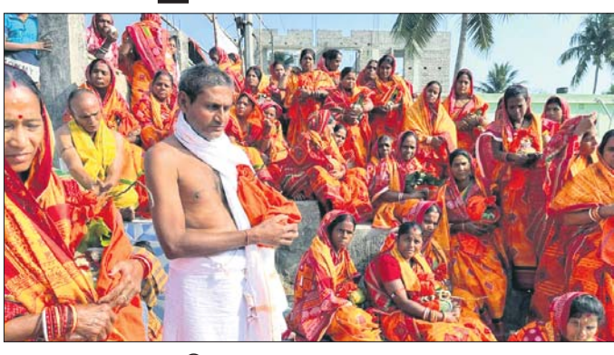
କଳସ ଶୋଭାଯାତ୍ରାରେ ସାମିଲ ଶ୍ରଦ୍ଧାଳୁ।