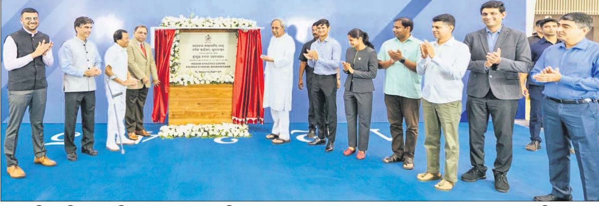
କଳିଙ୍ଗ ଷ୍ଟାଡ଼ିୟମରେ ଶନିବାର ଇନ୍ଡୋର ଆଧୁନିକ ସେଣ୍ଟର ଉଦ୍ଘାଟନ ଅବସରରେ ପୁଣ୍ୟମନ୍ତ୍ରୀ ନବୀନ ପଟ୍ଟନାୟକ ଓ ଅନ୍ୟ ଅତିଥିମାନେ।