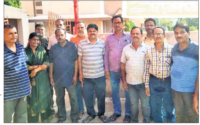
ଭଜନ ସନ୍ଧ୍ୟା ଅବସରରେ କମିଟି କର୍ମକର୍ମୀ।

ଭଦ୍ରକ, ୯/୩ (ସନାତନ ରାଉତ) ଘାଣ୍ଟିମାର୍ଚ୍ଚ ନିର୍ବାଚନ ପ୍ରସ୍ତୁତି ପୂର୍ବରୁ ଭଦ୍ରକ ପୋଲିସ ପକ୍ଷରୁ ଶନିବାର ସନ୍ଧ୍ୟାରେ ଘାଣ୍ଟିମାର୍ଚ୍ଚ କରାଯାଇଛି। ଭଦ୍ରକ ସହରର ବଡ଼ଛକଠାରୁ ପୁରୁଣାବଜାର ପର୍ଯ୍ୟନ୍ତ ଅନୁଷ୍ଠାନ ଦ୍ୱିବେଦୀ, ଆସିଷ୍ଟାନ୍ଟ କମିଶ୍ନର ସହାୟ କୁମାରଙ୍କ ନେତୃତ୍ୱରେ ଭଦ୍ରକ ପୋଲିସ ଓ ବିଏସ୍‌ଏଫ୍ ଯୁବାନ ଘାଣ୍ଟିମାର୍ଚ୍ଚ ପ୍ରଦର୍ଶନ କରିଥିଲେ। ଆସନ୍ତା ନିର୍ବାଚନରେ ଶାନ୍ତିଶୃଙ୍ଖଳା ରକ୍ଷା କରାଯିବ ଓ ଶାନ୍ତିପୂର୍ଣ୍ଣ ଅନୁଷ୍ଠାନ ଦ୍ୱିବେଦୀ, ଆସିଷ୍ଟାନ୍ଟ କମିଶ୍ନର ସହାୟ କୁମାରଙ୍କ ନେତୃତ୍ୱରେ ଭଦ୍ରକ ପୋଲିସ ଓ ବିଏସ୍‌ଏଫ୍ ଯୁବାନ ଘାଣ୍ଟିମାର୍ଚ୍ଚ ପ୍ରଦର୍ଶନ କରିଥିଲେ। ଆସନ୍ତା ନିର୍ବାଚନରେ ଶାନ୍ତିଶୃଙ୍ଖଳା ରକ୍ଷା କରାଯିବ ଓ ଶାନ୍ତିପୂର୍ଣ୍ଣ ଅନୁଷ୍ଠାନ ଦ୍ୱିବେଦୀ, ଆସିଷ୍ଟାନ୍ଟ କମିଶ୍ନର ସହାୟ କୁମାରଙ୍କ ନେତୃତ୍ୱରେ ଭଦ୍ରକ ପୋଲିସ ଓ ବିଏସ୍‌ଏଫ୍ ଯୁବାନ ଘାଣ୍ଟିମାର୍ଚ୍ଚ ପ୍ରଦର୍ଶନ କରିଥିଲେ।