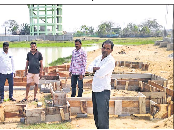
ନିର୍ମାଣ ସ୍ଥଳରେ ଲୋକେ।