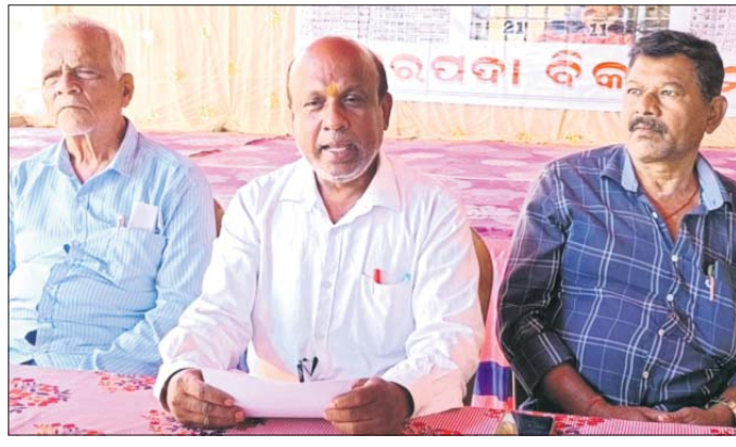
ଖବରଦାତା ସମ୍ମିଳନୀରେ ବରପଦା ବିକାଶ ମନ୍ତ୍ରୀ କର୍ମକର୍ମୀ।