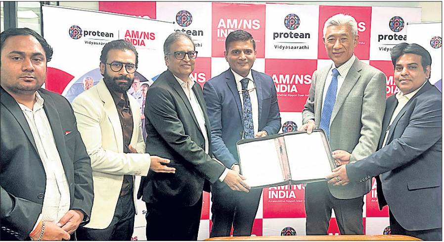
ଆର୍ଦ୍ଧଲେନ ମିଲ ଲିଗ୍ ନିର୍ମାଣ (ଏସଏମଏସଏ) ଲିଗ୍ ଆରମ୍ଭ ହୋଇଛି। ଏହା ପ୍ରତିନିଧିତ୍ୱ କରିବା ପାଇଁ ଏକ ଶୁଭାଚରଣ କାର୍ଯ୍ୟକ୍ରମ ଅନୁଷ୍ଠିତ ହୋଇଛି।