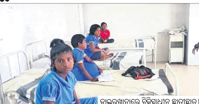
ଡାକ୍ତରଖାନାରେ ଚିକିତ୍ସାଧୀନ ଛାତ୍ରାଛାତ୍ରୀ ।