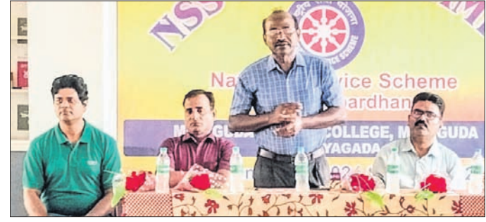
ସେବା ଶିବିର ଉଦଘାଟନା କାର୍ଯ୍ୟକ୍ରମରେ ମହାସାଥୀ ଅତିଥି ।