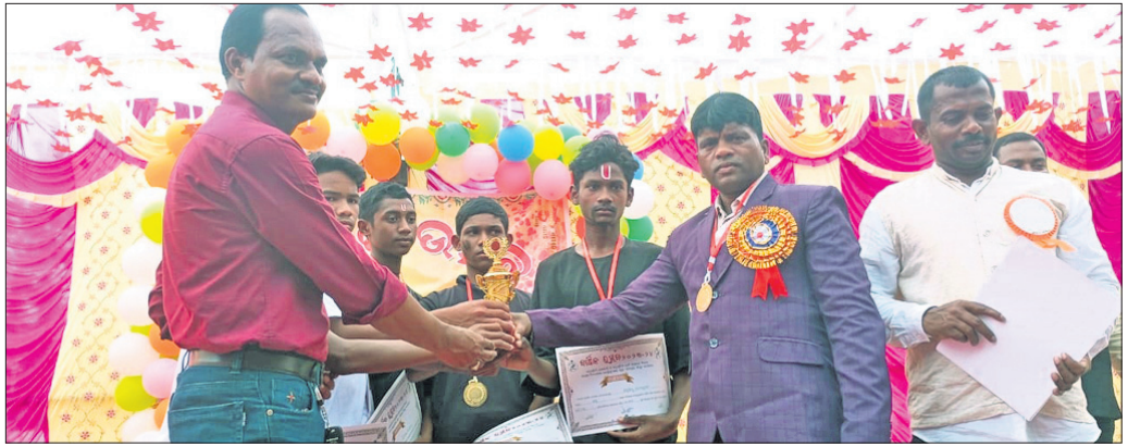
ଅତିଥିମାନେ କୃତା ପ୍ରତିଯୋଗୀଙ୍କୁ ପୁରସ୍କୃତ କରୁଛନ୍ତି ।