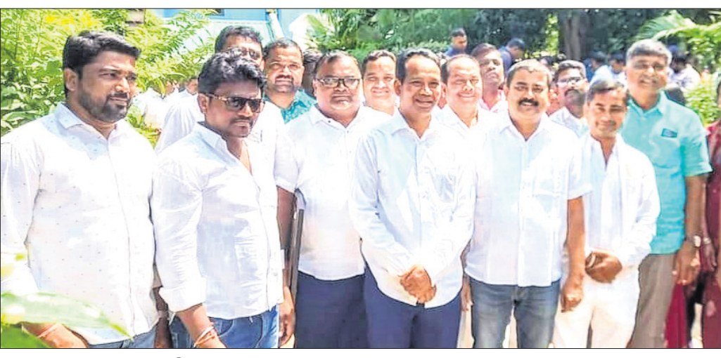
ମନ୍ତ୍ରୀ ଜଗନ୍ନାଥ ସାହୁଙ୍କ ସହ ପୁନିଗୁଡ଼ା ଅଞ୍ଚଳବାସୀ ।