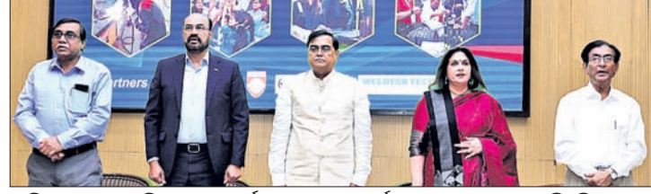
ଆର୍ଦ୍ଧଲେନ ମିଲ ଲିଗ୍ ନିର୍ମାଣ (ଏସଏମଏସଏ) ଲିଗ୍ ଆରମ୍ଭ ହୋଇଛି। ଏହା ପ୍ରତିନିଧିତ୍ୱ କରିବା ପାଇଁ ଏକ ଶୁଭାଚରଣ କାର୍ଯ୍ୟକ୍ରମ ଅନୁଷ୍ଠିତ ହୋଇଛି।