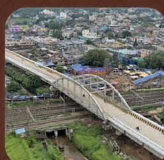
କୁଦିଆରୀ ରେଳ ଓଭର-ବ୍ରିଜ