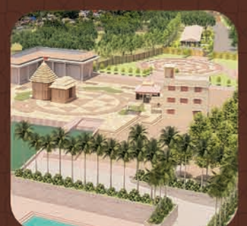
ମା ଉଗ୍ରତାରା ଶକ୍ତିପୀଠ