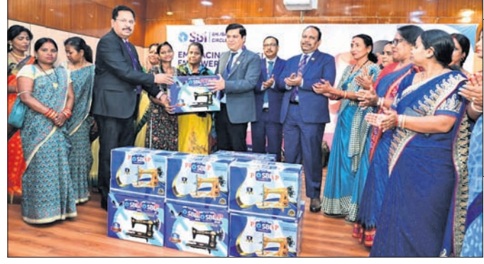
ଭୁବନେଶ୍ୱର, ୧୦।୩। (ଅନୁରାଧା ମହାରଣା)

ଭାରତୀୟ ଷ୍ଟେଟ୍ ବ୍ୟାଙ୍କ (ଏସ୍‌ବିଆଇ) ଭୁବନେଶ୍ୱର ମଣ୍ଡଳର ଘ୍ନାନାୟ ମୁଖ୍ୟ କାର୍ଯ୍ୟାଳୟ ଓ ସମଗ୍ର କ୍ଷେତ୍ରୀୟ ବ୍ୟବସାୟିକ କାର୍ଯ୍ୟାଳୟରେ ଆନ୍ତର୍ଜାତୀୟ ମହିଳା ଦିବସ ପାଳିତ ହୋଇଯାଇଛି। ଚଳିତ ବର୍ଷ ମିଳିତ ଇତିହାସ ଆନ୍ତର୍ଜାତୀୟ ମହିଳା ଦିବସ ୨୦୨୪ ପାଇଁ 'ମହିଳାମାନଙ୍କ ପାଇଁ ବିନିଯୋଗ: ପ୍ରଗତି ଦୂରାଦୃଷ୍ଟି' ଶୀର୍ଷକ ଘୋଷଣା କରିଛି। ଏହି ପରିପ୍ରେକ୍ଷାରେ, ମୁଖ୍ୟ ମହାପ୍ରବନ୍ଧକ ଦାନେଶ ପରୁଥିଙ୍କ ନେତୃତ୍ୱରେ ଭୁବନେଶ୍ୱର ମଣ୍ଡଳ ତାହାର