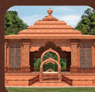
ମହାପୁରୁଷ ଶ୍ରୀ ଶ୍ରୀ ଅତ୍ୟୁତାନନ୍ଦ ଦାସଙ୍କ ଗାଦୀ ଓ ପୀଠ