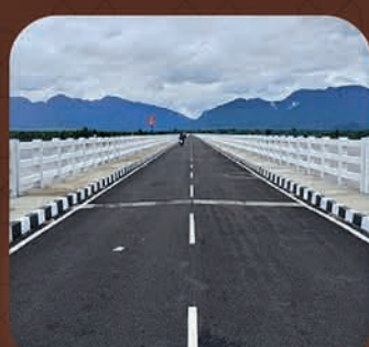
ଆଠମଲ୍ଲିକ-ଧଳପୁର ଦୀର୍ଘତମ ସେତୁ