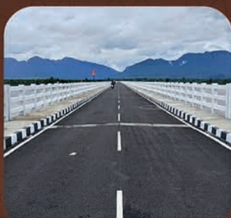
ଆଠମଲ୍ଲିକ-ଧଳପୁର ଦୀର୍ଘତମ ସେତୁ