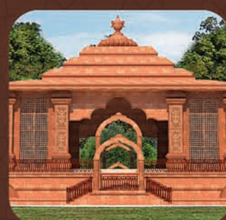
ମହାପୁରୁଷ ଶ୍ରୀ ଶ୍ରୀ ଅଚ୍ୟୁତାନନ୍ଦ ଦାସଙ୍କ ଗାଦୀ ଓ ପୀଠ