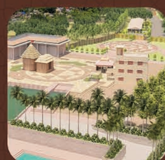
ମା ଉଗ୍ରତାରା ଶକ୍ତିପୀଠ