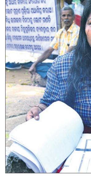
ଧାରଣାରେ ଅର୍ଜନା କାରୁଣ୍ୟା

ଭୁବନେଶ୍ୱର, ୧୦ମାର୍ଚ୍ଚ (ସରୋଜ କୁମାର ଜେନା): ଭୁବନେଶ୍ୱରର ଉତ୍ତମ କ୍ରୀଡ଼ାକାରୀ ମଧ୍ୟରୁ ଶାର୍ଦୂଳ ମୃତ୍ୟୁଞ୍ଜୟଙ୍କ ଶତକ ଆଶ୍ଚର୍ଯ୍ୟ ସୃଷ୍ଟି କରିଥିଲା।