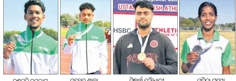
କିଟ୍ଟର ୪ ଆଥଲେଟିକ୍ସ ୫ ପଦକ