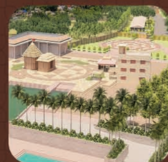
ମା ଉଗ୍ରତାରା ଶକ୍ତିପୀଠ