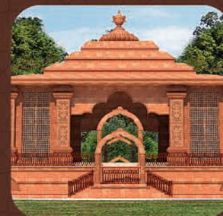
ମହାପୁରୁଷ ଶ୍ରୀ ଶ୍ରୀ ଅଚ୍ୟୁତାନନ୍ଦ ଦାସଙ୍କ ଗାଦୀ ଓ ପୀଠ