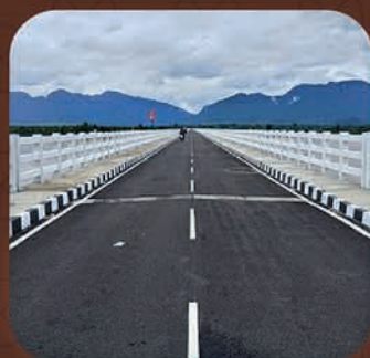
ଆଠମଲ୍ଲିକ-ଧଳପୁର ଦୀର୍ଘତମ ସେତୁ