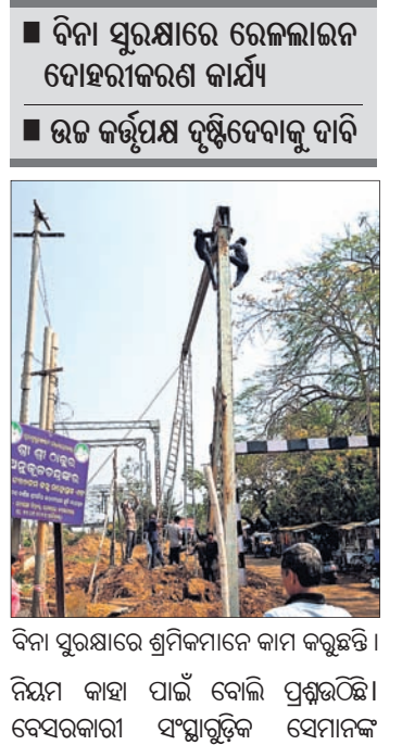
ବିନା ସୁରକ୍ଷାରେ ଶ୍ରମିକମାନେ କାମ କରୁଛନ୍ତି।

ଯାଜପୁର, ୧୦/୩ (ପବିତ୍ର ରଞ୍ଜନ ମହାନ୍ତି): ପୂର୍ବତନ ରେଳପଥ ଆଧାର ଯାଜପୁର-କେନ୍ଦୁଝର ରୋଡ଼ ରେଳଲାଇନର ସମ୍ପ୍ରସାରଣ କାର୍ଯ୍ୟ ଚାଲୁଅଛି।