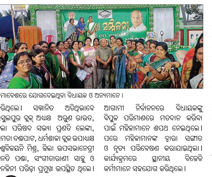
ସମାବେଶରେ ଯୋଗଦେଇଥିବା ବିଧାୟକ ଓ ଅନ୍ୟମାନେ ।

ଯାଜପୁର ଜିଲ୍ଲା ଧର୍ମଶାଳା ନିର୍ବାଚନପନ୍ଥକାର ମହିଳାମାନଙ୍କର ମହିଳାମାନଙ୍କ ପ୍ରତି ଆଶେ ଧର୍ମଶାଳା ବିଜୁ ମହିଳା ଜନତା ଦଳ ପକ୍ଷରୁ ରବିବାର ଏକ ସମ୍ମିଳନୀ ଅନୁଷ୍ଠିତ ହୋଇଯାଇଛି।