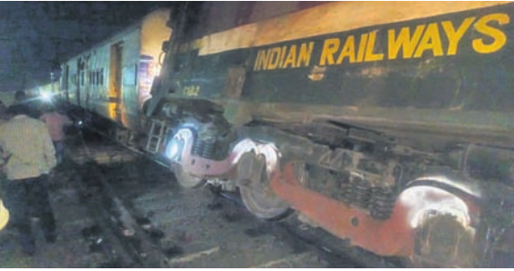
ରାୟଗଡ଼ା, ୧୦/୩ (ଆଶିଷ ରଞ୍ଜନ ପଣ୍ଡା)

ଆନ୍ଧ୍ରପ୍ରଦେଶ କୋଟାବାଲ୍ୟା ରେଳ ଷ୍ଟେଶନ ନିକଟରେ ରବିବାର ସନ୍ଧ୍ୟା ପ୍ରାୟ ୬ଟାରେ ଏକ ପାସେଞ୍ଜର ଟ୍ରେନ୍ ଦୁର୍ଘଟଣାଗ୍ରସ୍ତ ହୋଇଛି। ବିଶାଖାପାଟଣା-ଭବାନୀପାଟଣା ପାସେଞ୍ଜର ଟ୍ରେନ୍ ଲାଇନରୁ ୨ଟି ବଗି ଲାଇନରୁପତ ହୋଇଛି। ଦୁର୍ଘଟଣାରେ ଜଣେ ଲୋକେ ପାଇଲଟ ଆହତ ହୋଇଛନ୍ତି। ଅନ୍ୟ କୋଣସି ଯାତ୍ରୀ ମୃତ୍ୟୁ ହେଉଛି ନ ଥିବା ସୂଚନା ମିଳିଛି। ବିଶାଖାପାଟଣା-ଭବାନୀପାଟଣା ପାସେଞ୍ଜର ଟ୍ରେନ୍ ରବିବାର ସନ୍ଧ୍ୟା ୬ଟାରେ ବିଶାଖାପାଟଣା ଛାଡ଼ିଥିଲା। କୋଟାବାଲ୍ୟା ଷ୍ଟେଶନରେ ୬ଟା ୪୮ ମିନିଟ୍ରେ ପହଞ୍ଚି ଷ୍ଟେଶନ ଛାଡ଼ିଥିଲା। ତେବେ ପ୍ଲଟଫର୍ମରୁ ଦୁଇ ନମ୍ବର ଚୁକ୍ତର ଯିବା ବେଳେ ହଠାତ୍ ଟ୍ରେନ୍ ଲାଇନରୁପତ ହୋଇଥିଲା।