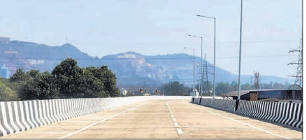
ଯୋଡ଼ାରେ ନିର୍ମିତ ନୂତନ ପ୍ଲାଏ ଓଭର।