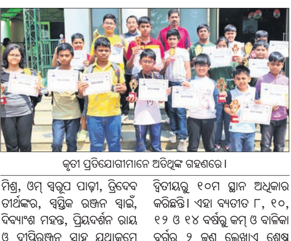
କୃତୀ ପ୍ରତିଯୋଗୀମାନେ ଅତିଥିକ ଗହଣରେ।

ଭୁବନେଶ୍ୱର, ୧୦ମାର୍ଚ୍ଚ (ତପନ ସାହୁ): ଓଡ଼ିଶା ରାଜ୍ୟ ଚେଷ୍ଟ ଆସୋସିଏଶନ ଆନୁଷ୍ଠାନିକ ଭାବରେ ଆୟୋଜିତ ହୋଇଥିବା ଓପନ ଚେଷ୍ଟ ଟୁର୍ଣ୍ଣାମେଣ୍ଟର ବିବରଣୀ ଯାଜପୁର ଜିଲ୍ଲା ବିଜ୍ଞାନପୁରସ୍ଥିତ ବିପିପିଠାରେ ଆରମ୍ଭ ହୋଇଛି।