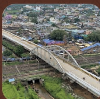
କୁଦିଆରୀ ରେଳ ଓଭର-ବ୍ରିଜ