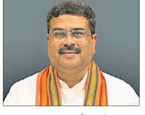
ସୂଚକ କରିବା ପାଇଁ ଅର୍ଥ ମଞ୍ଜୁର କରାଯାଇଛି।

ଅଇଁଠାପାଲିରେ ଫ୍ଲାଏଓଭର, ଏନ୍-ଏଚ୍-୫୩ରେ ୨ କୋଟି ବିଶିଷ୍ଟ ରୋଡ୍ ଓଭର ଟ୍ରିଲ୍