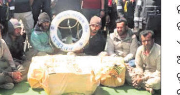
ଗୁଜରାଟ ଏଟିଏସ୍ ଗିରଫ ହୋଇଥିବା ୬ ଜଣ ପାକିସ୍ତାନୀ ନାଗରିକ ଏକ ଭାରତୀୟ ଡଙ୍ଗାକୁ

ବ୍ୟବହାର କରି ଦିଲ୍ଲୀ ଓ ପଞ୍ଜାବରେ ଡ୍ରଗ୍ସ ଚୋରାଚାଲାଣ କରିବା ଉଦ୍ଦେଶ୍ୟରେ ଆରବ ସାଗରରେ ଯାତ୍ରା କରୁଥିଲେ। ସୋମବାର ମଧ୍ୟାହ୍ନରେ ଏନଇ କୌଣସି ସୂଚନା ସୂଚନା ପାଇଁ ଗୁଜରାଟ ଏଟିଏସ୍, ଆଇସିଏ ଏବଂ ଏନ୍‌ସିଏ ପକ୍ଷରୁ ମିଳିତ ଭାବେ ସର୍ଚ୍ଚ ଅପରେଶନ୍ ଆରମ୍ଭ ହୋଇଥିଲା। ଗତ ୩୦ ଦିନ ମଧ୍ୟରେ ଗୁଜରାଟ ଉପକୂଳରେ ଏହା ହେଉଛି ଦ୍ୱିତୀୟ ବୃହତ୍ ଡ୍ରଗ୍ସ ଜବତ। ପେଟ୍‌ସୁଆରୀ ୨୮ରେ ପୋରବନ୍ଦର ଉପକୂଳରୁ ୨ ହଜାର କୋଟି ମୂଲ୍ୟର ୩୩୦୦ କେଜି ଡ୍ରଗ୍ସ ଜବତ ହୋଇଥିଲା।