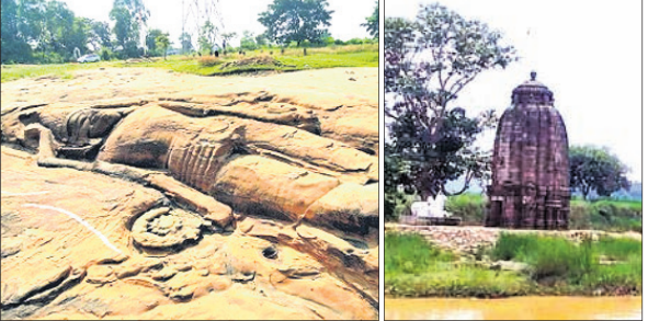
ସରକାରଙ୍କୁ ଅନନ୍ତ ଶୟନ।