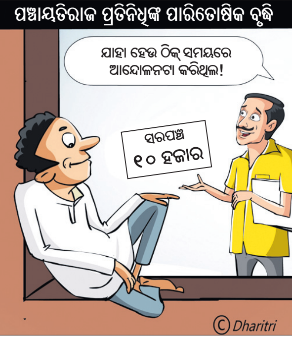
ଯାହା ହେଉ ଠିକ୍ ସମୟରେ ଆୟୋଜନଟା କରିଥିଲୁ!