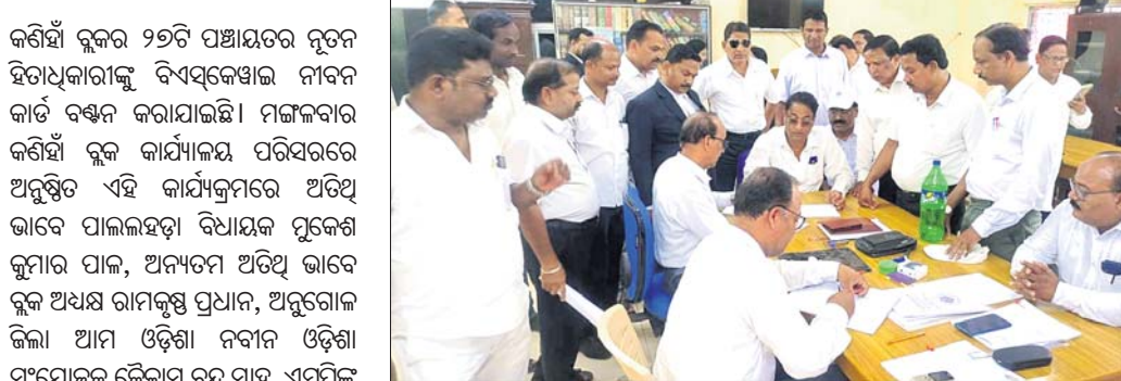
ଡେକୋରାଲ ଓକିଲ ସଂଘ ନିର୍ବାଚନ ପାଇଁ ନାମାଙ୍କନ ପତ୍ର ଦାଖଲ କରାଯାଇଛି।

ଡେକୋରାଲ ଓକିଲ ସଂଘ ନିର୍ବାଚନ ପାଇଁ ନାମାଙ୍କନ ପତ୍ର ଦାଖଲ କରାଯାଇଛି। ଡେକୋରାଲ ଜିଲା ଓକିଲ ସଂଘର ନିର୍ବାଚନ ଆସନ ୩୦ ତାରିଖରେ ଅନୁଷ୍ଠିତ ହେବ। ଏହି ନିର୍ବାଚନ ପାଇଁ ମଙ୍ଗଳବାର ପ୍ରାର୍ଥପତ୍ର ଦାଖଲ କରିଥିବା ବେଳେ କାର୍ଯ୍ୟକାରୀତା ସାଧନ ପାଇଁ ୪୯ଟି ପ୍ରାର୍ଥପତ୍ର ଦାଖଲ କରିଛନ୍ତି। ପ୍ରଥମ ପର୍ଯ୍ୟାୟରେ ୨୬ ପଞ୍ଚାୟତର ୧୩୨ ଜଣଙ୍କୁ ନବୀନ ବିଏସ୍‌କେଫ୍ରାଇ କାର୍ଡ ପ୍ରଦାନ କରାଯାଇଥିଲା। ବିଭିନ୍ନ ପଞ୍ଚାୟତର ସରପଞ୍ଚ, ସମିତିସଭା ସଭ୍ୟ କାର୍ଯ୍ୟନିର୍ବାହୀ ଅଧିକାରୀ ବୁକ୍ସର ସମସ୍ତ କର୍ମଚାରୀ ସହଯୋଗ କରିଥିଲେ।