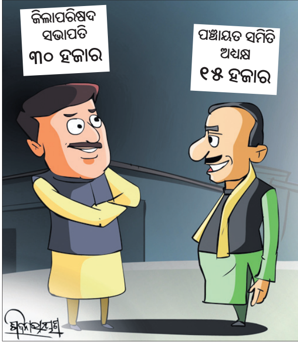
ଜିଲ୍ଲାପରିଷଦ ସଭାପତି ୩୦ ହଜାର

ପ୍ର-ଗ୍ରାମାଞ୍ଚଳରେ ବିକ୍ରି ବୃଦ୍ଧି ହେଉ ଭାରତରେ ବୁଲୁଛନ୍ତିଆ। ଯାନର ବଜାର ବୁଜିଗଲିବେ ବଢ଼ିବାରେ ଲାଗିଛି। ଆପଣ ଓଡ଼ିଶା ବଜାରରେ ମଧ୍ୟ ବିକ୍ରି ବୃଦ୍ଧି ଦେଖୁଛନ୍ତି କି? ଉ-ନିଶ୍ଚିତ ଭାବେ ଗ୍ରାମାଞ୍ଚଳରେ ବୁଲୁଛନ୍ତିଆ ଯାନ ବିକ୍ରି ସଂଖ୍ୟା ବଢ଼ୁଛି। ଏକ ଗ୍ରାମାଞ୍ଚଳ ଜିଲ୍ଲା ହୋଇଥିଲେ ମଧ୍ୟ ମୟୂରଭଞ୍ଜରେ ବୁଲୁଛନ୍ତିଆ ଯାନ ବିକ୍ରି ବହୁଥିବାରୁ ଏହା ଅର୍ଥନୀତିର ଅଭିବୃଦ୍ଧି ଏବଂ ବଜାରରେ ସହାୟକ ହେବ। ହଁ, ଓଡ଼ିଶା ବଜାରରେ ବିକ୍ରିରେ ବୃଦ୍ଧି ଘଟିଛି। ମାତ୍ର କୃଷି କ୍ଷେତ୍ର ପ୍ରଭାବିତ ହେବା, ପାଣିପାଗର ପରିବର୍ତ୍ତନ ଗ୍ରାମାଞ୍ଚଳ ବଜାର ଉପରେ ଅଧିକ ପ୍ରଭାବ ପକାଇଥାଏ। ତେଣୁ ଆମେ କେବଳ ଗ୍ରାମାଞ୍ଚଳ ପୁସ୍ତକ୍ତୁଳି ଉପରେ ନିର୍ଭର ନ କରି ଅନ୍ୟ ଉପାୟ ଖୋଜିବାକୁ ପଡ଼ିଥାଏ। ପ୍ର-ମୟୂରଭଞ୍ଜ ଜିଲ୍ଲାରେ ଏକ ଅଗ୍ରଣୀ ଡିଲର ହୋଇଥିବାବେଳେ କେଉଁ ସବୁ ସମସ୍ୟା ବା ଆହ୍ୱାନର ସାମ୍ନା କରିବାକୁ ପଡ଼ିଥାଏ? ଉ-ଗତ ୨ ବର୍ଷ ମଧ୍ୟରେ ହୋଷ୍ଟା ପରିବାର ଯୋଗାଣ କ୍ଷେତ୍ରରେ ଏକ ବଡ଼ ସଙ୍କଟର ସାମ୍ନା କରିଛି। ଯେଉଁ କାରଣରୁ ଚାହିଦା ଓ ଯୋଗାଣ ମଧ୍ୟରେ ସମନ୍ୱୟ ରକ୍ଷା ପୂର୍ବକ ବଜାରରେ