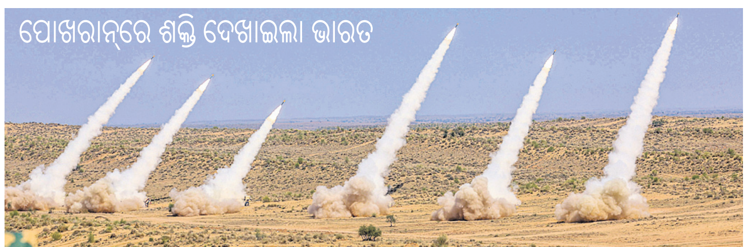
ଘୋଷରାନରେ ଶକ୍ତି ଦେଖାଇଲା ଭାରତ

ହେବ। ରାଜ୍ୟ ସରକାର ଏଥିପାଇଁ ୧୬୨.୬୮ କୋଟି ଟଙ୍କା ଅତିରିକ୍ତ ଖର୍ଚ୍ଚ ବହନ କରିବେ। ଏହାବ୍ୟତୀତ ପଞ୍ଚାୟତରାଜ ପ୍ରତିନିଧିମାନଙ୍କର ପଦବୀରେ ଥିବା ସମୟରେ ମୁକ୍ତା ଘଟିଲେ ଅନୁକମ୍ପାମୂଳକ ସହାୟତା ରାଶି ବାବଦରେ ୨ ଲକ୍ଷ ଟଙ୍କା ମିଳିବ। ଏହା ସହିତ ଚୁଙ୍ଗିଚାଳନା ପୂର୍ଣ୍ଣ ଅକ୍ଷମତା କ୍ଷେତ୍ରରେ (ବୁଲ୍ ଆଣ୍ଡ୍ ହାତ କ୍ରିୟ ପାଦ ହୋଇଲେ) ୨ ଲକ୍ଷ ଟଙ୍କା ସହାୟତା ଦିଆଯିବ। ସେହିପରି ଆଂଶିକ ଅକ୍ଷମତା କ୍ଷେତ୍ରରେ ୧ ଲକ୍ଷ ଟଙ୍କା ସହାୟତା ଦିଆଯିବ।