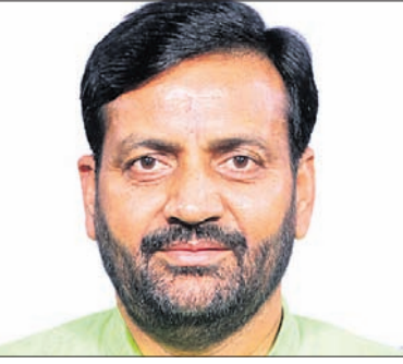
ଚନ୍ଦ୍ରଶେଖର, ୧୨ମାର୍ଚ୍ଚ (ପି.ଟି.)

ଆଜପା-ଜେଜେପି ମେଣ୍ଟ ଭାଙ୍ଗିଲା ଇସ୍ତଫା ଦେଲେ ଖଜାଉ